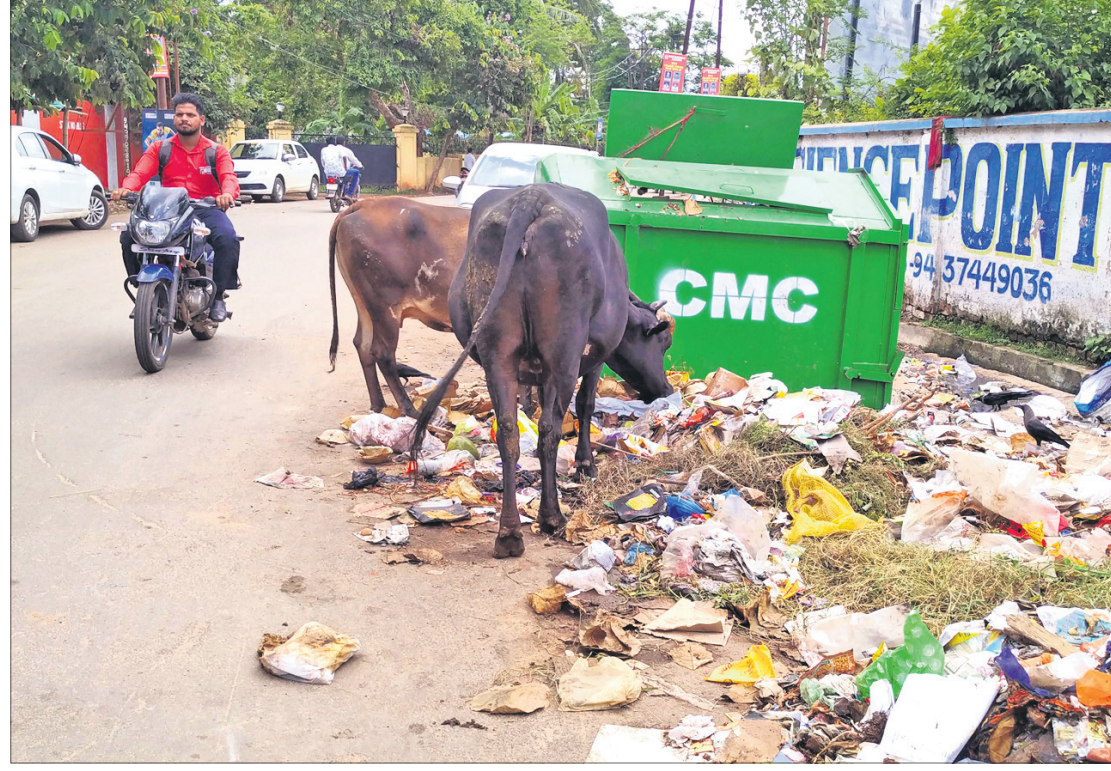
କ୍ୟାଣ୍ଟନମେଣ୍ଟ ରୋଡ଼ରୁ ରାଜନୀତୋକ ଯିବା ରାସ୍ତା ଉପରେ କଟକ ମହାନଗର ନିଗମ(ସିଏମ୍‌ସି) ଡଷ୍ଟବିନ୍ ଓ ଖେଳାଇହୋଇ ପଡ଼ିରହିଥିବା ଆବର୍ଜନା