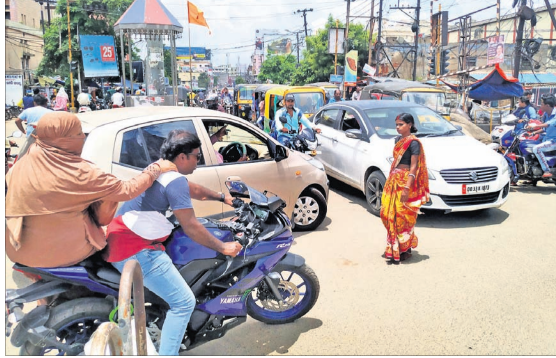
ଗ୍ରାମିକ୍ ନିୟମ କଟିବାକୁ କେହି ନାହିଁ: ବକ୍ରକବାଟି କେନାଲ ରୋଡ଼ ଛକରେ ଯିଏ ଯୁଆଡ଼େ ପାରିଲା ଗଲା।