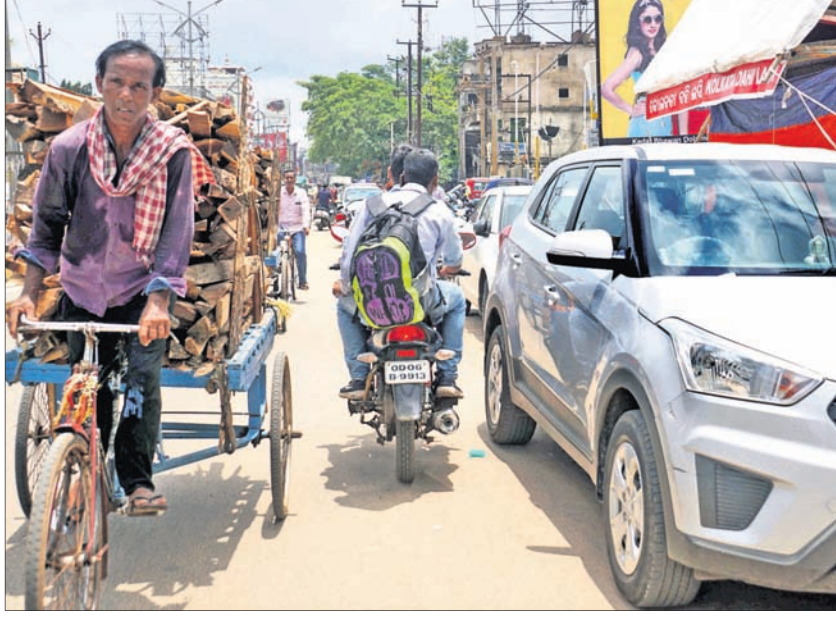
ବକ୍ରକବାଟି ମୁଖ୍ୟ ଏକତରଫା ରାସ୍ତାରେ ଗ୍ରାମିକ୍ ନିୟମ ଉଲ୍ଲଙ୍ଘନ କରି ଯାଉଥିବା ବାଇକ୍ ଚାଳକ