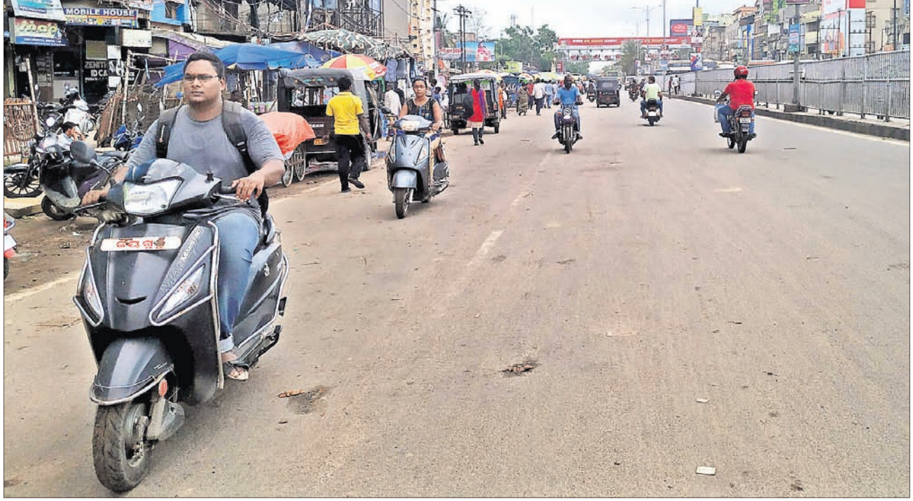
ରାସ୍ତାର ମନକଳ୍ପା ବ୍ୟବହାର: ବାବାମବାଡ଼ିର ଏକତରଫା ରାସ୍ତାରେ ଗ୍ରାମିକ୍ ଉଲ୍ଲଙ୍ଘନ କରି ଆସୁଥିବା ବାଇକ୍ ଚାଳକ।