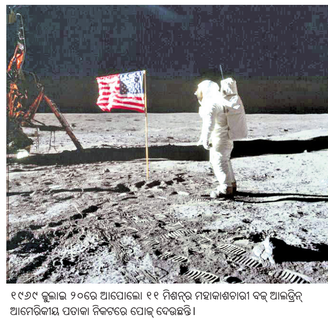
୧୯୬୯ ଜୁଲାଇ ୨୦ରେ ଆପୋଲୋ ୧୧ ମିଶନ୍‌ର ମହାକାଶଚାରୀ ବକ୍ ଆଲଡ୍ରିନ୍ ଆନେରିକାୟ ପତାକା ନିକଟରେ ପୋର୍ ବେଉଛନ୍ତି ।

ଭୁବନେଶ୍ୱର, ୨୦୧୭ (ବୁଧବେଳା) ଆଶ୍ର ପ୍ରଦେଶ ରାଜ୍ୟପାଳ ଭାବେ ନିଯୁକ୍ତ ହୋଇଥିବା ବିଶ୍ୱଭୂଷଣ ହରିଚନ୍ଦନ ଶନିବାର କେନ୍ଦ୍ରମନ୍ତ୍ରୀ ଧର୍ମେନ୍ଦ୍ର ପ୍ରଧାନ ଡାକ ବାସଭବନରେ ଭେଟି ଅଭିନନ୍ଦନ ଜଣାଇଲେ ।