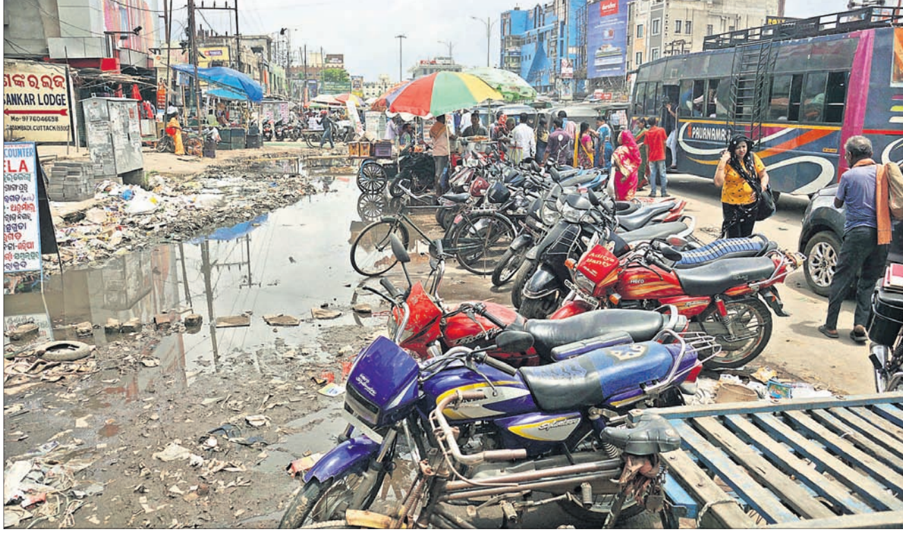
ବାବାମବାଡ଼ି ବସ୍ଷାଣ୍ଡ ସମ୍ମୁଖ ରାସ୍ତାରେ ପାଣି ଓ ଅଳିଆ ଆବର୍ଜନା ଜମି ରହିବା ସହ ବେଆଇନ ପାର୍କିଂ ଯୋଗୁ ଗ୍ରାମିକ୍ କାମ ପରିସ୍ଥିତି ସୃଷ୍ଟି ହୋଇଛି