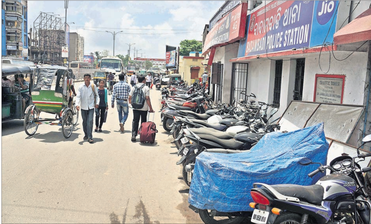
ବାବାମବାଡ଼ି ଥାନା ଆଗ ରାସ୍ତା ଉପରେ ରଖାଯାଇଥିବା ଜବତ ବାଇକ୍।