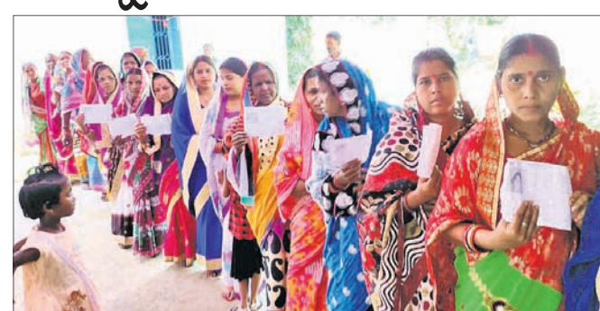
ପାଟକୁରାସ୍ଥିତ ଏକ ମତଦାନ କେନ୍ଦ୍ରରେ ମହିଳାମାନେ ଭୋଟଦେବା ପାଇଁ ଠିଆ ହୋଇଛନ୍ତି।

ଭୁବନେଶ୍ୱର/କେନ୍ଦ୍ରାପଡ଼ା ଅଫିସ୍, ୨୦୭(ବୁଧବେ)