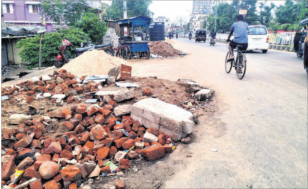
ଖାନନଗର ଗ୍ରାମିକ୍ ଛକରୁ ବାବାମବାଡ଼ି ଯିବା ରାସ୍ତା ଉପରେ ଗଦା ହୋଇ ରହିଥିବା ଇଟା, ବାଲି।