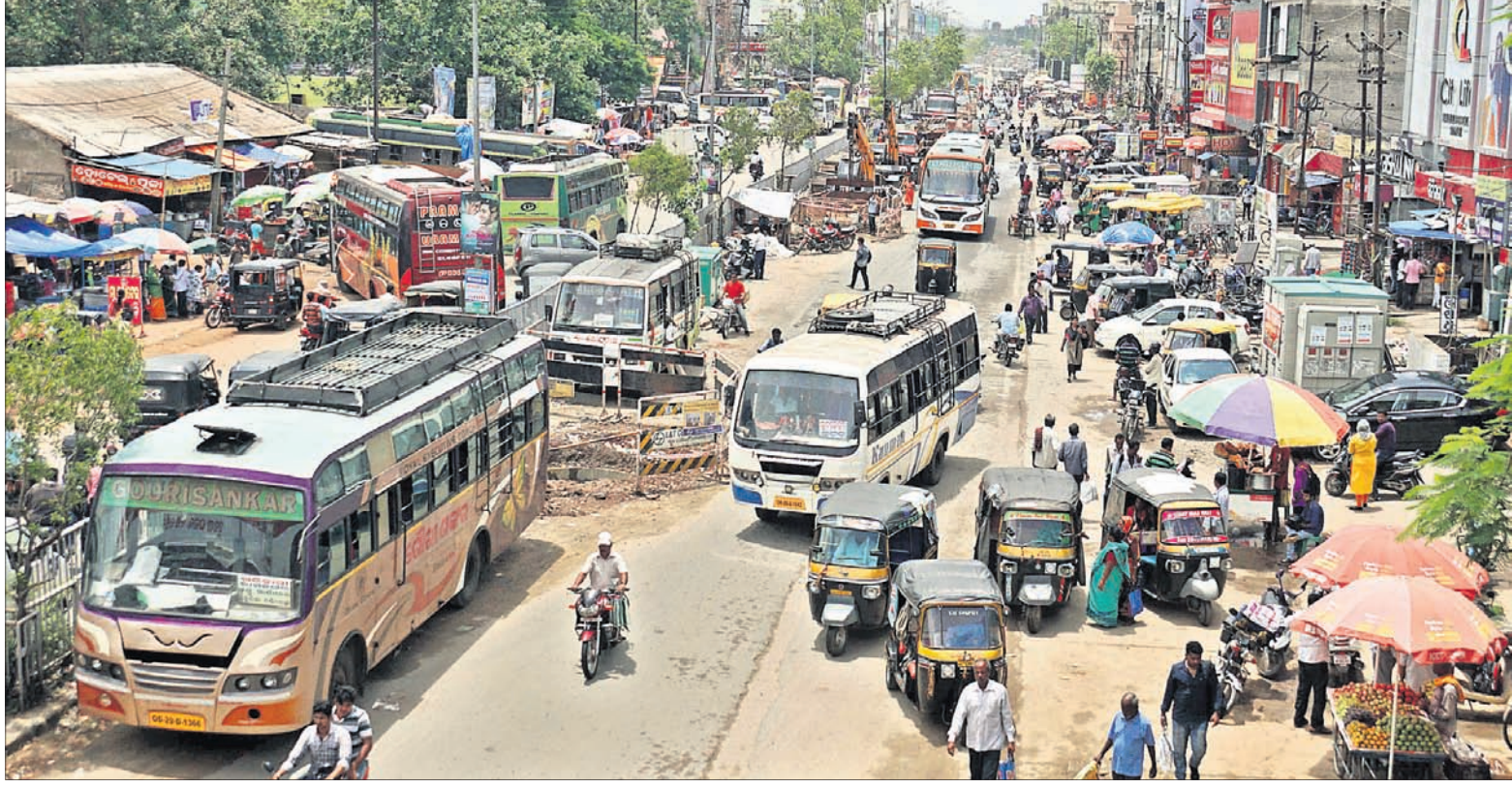
ବସ୍, ଅଟୋ ଅଟକି ରହିବା ଓ ଉଠାବୋକାନ ଯୋଗୁ ଲିଙ୍କରୋଡ଼ରୁ ବାବାମବାଡ଼ି ବସ୍ଷାଣ୍ଡ ଯିବା ରାସ୍ତା ସଂକୀର୍ଣ୍ଣ ହୋଇପଡ଼ିଛି

କଟକ ସହର ବାରବାଟୀ ଷ୍ଟାଡ଼ିୟମ ଓ ତାରକସି କାରୁକାର୍ଯ୍ୟ ପାଇଁ ସାରା ବିଶ୍ୱରେ ପରିଚିତ। ହାଇକୋର୍ଟ, ବଡ଼ ଡାକ୍ତରଖାନା, ଶିଶୁଭବନ, କର୍କଟ କେନ୍ଦ୍ର ନିମନ୍ତେ ସାରା ଓଡ଼ିଶାରୁ ବହୁସଂଖ୍ୟକ ଲୋକ ପ୍ରତ୍ୟହ ଏଠାକୁ ଆସନ୍ତି। ହେଲେ ଅପରିଷ୍କାର ଓ ଲୋକଙ୍କ ମନକଳ୍ପା ରାସ୍ତା ବ୍ୟବହାର ଯୋଗୁ ଏହି ଐତିହ୍ୟ ସହର ପ୍ରତି ଖରାପ ଛବି ସୃଷ୍ଟି ହେଉଛି। ଏଥିପ୍ରତି କଟକ ମହାନଗର ନିଗମ, କଟକ ଉନ୍ନୟନ କର୍ତ୍ତୃପକ୍ଷ, ପୂର୍ଣ୍ଣ ବିଭାଗ, ସ୍ଥାନୀୟ ବାସିନ୍ଦା, ନେତା ଓ ବିଶେଷ କରି କମିଶନରେଟ୍ ପୋଲିସର କୌଣସି କର୍ତ୍ତବ୍ୟ ଥିବା ଭଳି ମନେ ହେଉନାହିଁ। ଏହି ସହରରୁ ପୋଲିସ ମହାନିର୍ଦ୍ଦେଶକ ରାଜ୍ୟର ଆଇନଶୃଙ୍ଖଳା ନିୟନ୍ତ୍ରଣ କରନ୍ତି। ଏଠାରୁ ହାଇକୋର୍ଟ ମାଧ୍ୟମରେ ରାଜ୍ୟବାସୀ ନ୍ୟାୟ ପାଉଛନ୍ତି। କିନ୍ତୁ ବାପତଳ ଅନ୍ଧାର ଭଳି କଟକ ସହର ମୁଣ୍ଡାଇଛି ମନୁଷ୍ୟକୃତ କଦାକାର ରୂପ।