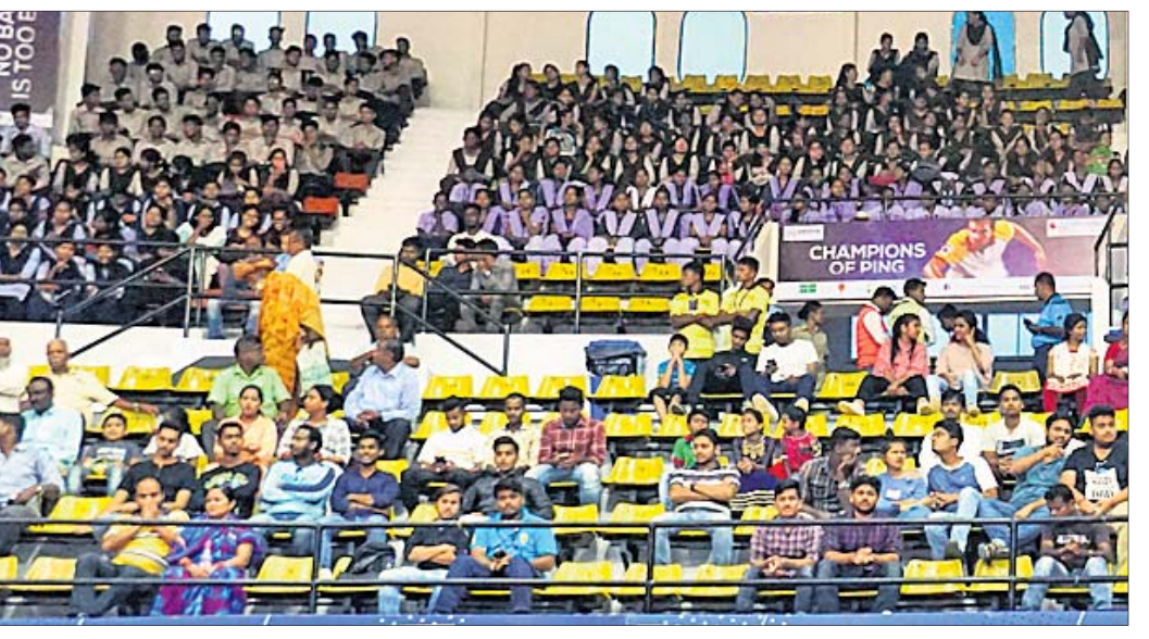
ଦର୍ଶକଭରା ଗ୍ୟାଲେରି।

୫ଜଣ ହେଲେ ବ୍ରାଣ୍ଡ ଆୟାସାତର ରାଜ୍ୟଗୋଷ୍ଠୀ ଚିତ୍ତ ଫେଡେରେଶନ ଏମାନେ ହେଲେ ଶରଥ କମଲ ଓ ପକ୍ଷରୁ ଚୁନାବେଳେ ୫ଜଣ ଖେଳାଳିଙ୍କୁ ମନିକା ବାପୁ। ଇଂଲଣ୍ଡ, ଅଷ୍ଟ୍ରେଲିଆ ଓ ବଙ୍ଗାଧାର ବ୍ରାଣ୍ଡ ଆୟାସାତର ଭାବେ ନାଲଜେରିଆର ଜଣେ ଜଣେ ଖେଳାଳି ଘୋଷଣା କରାଯାଇଛି। ୫ଜଣଙ୍କ ରହିଛନ୍ତି। ଅନ୍ୟପକ୍ଷରେ ଶ୍ରୀକା ଆକ୍ଷୟାଙ୍କୁ ମଧ୍ୟରେ ୨ଜଣ ଭାରତୀୟ ରହିଛନ୍ତି। ଫେୟାର ପୁ ଆସାତ୍ ବିଆଯାଇଥିଲା।