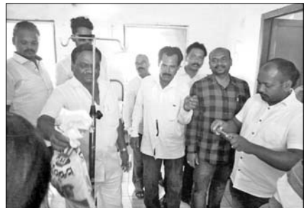
ବିଧାୟକ ଡାକ୍ତରଖାନାରେ ଗୋଷ୍ଠୀକୁ ଭେଟୁଛନ୍ତି।