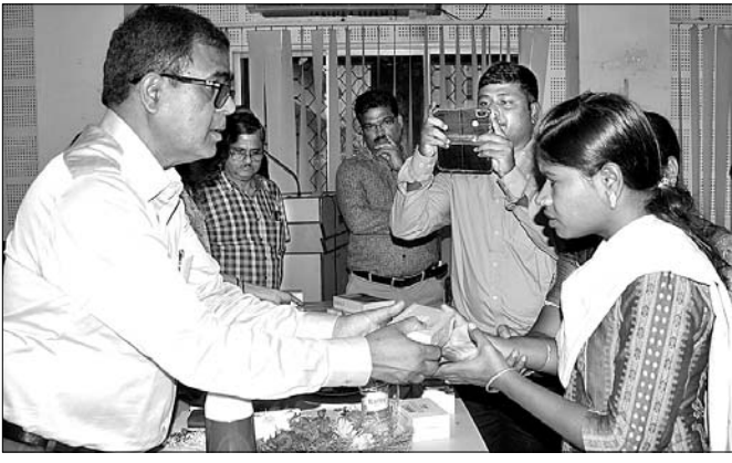
ଜିଲାପାଳ ଜଣେ ଛାତ୍ରୀଙ୍କୁ ଉପକରଣ ପ୍ରଦାନ କରୁଛନ୍ତି ।