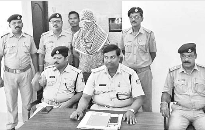
ପୋଲିସର ଖବରଦାତା ସମ୍ମିଳନୀ।