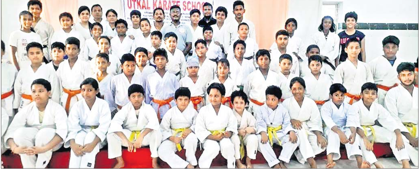
କଟକର ଉତ୍କଳ ସ୍ପୋର୍ଟସ୍ ଉଲ୍ଲସ କରାଣୀ କୋଚ୍ ତରଫରୁ ପ୍ରତିଷ୍ଠିତ ଉତ୍କଳ କରାଣୀ କ୍ରୀଡା କ୍ଲବ୍ ପାଇଁ ଉଦ୍ଦୀପନ କରାଯାଇଛି।