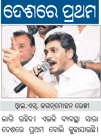
ଓ.ଏ.ଏ. କରନ୍ତମୋହନ ରେଡ୍ଡୀ

ଅନାମକ, ୧୩୭(ପି.ଟି.): ଅନାମକ ଆନ୍ଧ୍ରପ୍ରଦେଶରେ ଥିବା ବିଭିନ୍ନ ଘରୋଇ ଉତ୍ପାଦନ ସ୍ଥାନରେ ଥିବା ମୁଦ୍ରକଙ୍କୁ ୧୫% ସ୍ଥାନୀୟ ମୁଦ୍ରକଙ୍କୁ ଉପଯୋଗୀ କରିବା ପାଇଁ ନିର୍ଦ୍ଦେଶ ଦେଇଛନ୍ତି।