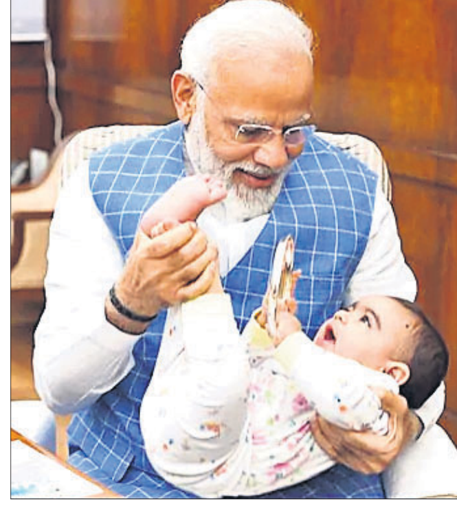
ନୂଆଦିଲ୍ଲୀ, ୧୩୭ (ଆଇଏଏନଏସ୍)

ନୂଆଦିଲ୍ଲୀ, ୧୩୭(ପି.ଟି.): ଆସାମରେ ଜାତୀୟ ନାଗରିକ ପଞ୍ଜିକା(ଏନ୍ଆର୍ସି)ର ବୃତ୍ତାନ୍ତ ସମୟ ସୀମା ସୁପ୍ରିମକୋର୍ଟ ମଙ୍ଗଳବାର ଜୁଲାଇ ୩୧ତା ଅଗଷ୍ଟ ୩୧ ପର୍ଯ୍ୟନ୍ତ ବୃଦ୍ଧିକରିଛନ୍ତି।