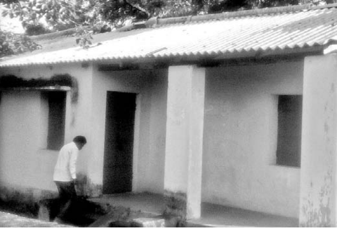
ରାଜ୍ୟ ନିରାକାର କାର୍ଯ୍ୟାଳୟ ।

ଫନୀ ବାଟ୍ୟା ନିରାକାରପୁର ଅଞ୍ଚଳର ବହୁ କ୍ଷୟକ୍ଷତି କରିଥିଲା। ଇତିମଧ୍ୟରେ ୨ ମାସ ବିତିଯାଇଥିଲେ ମଧ୍ୟ ସ୍ଥାନୀୟ ଅଞ୍ଚଳର ଅନେକ କ୍ଷୟକ୍ଷତି ଭରଣା ହୋଇପାରି ନ ଥିବା ଜଣାପଡ଼ିଛି।