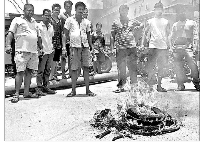
ଉତ୍ତମ ଲୋକେ ଚାନ୍ଦାର କାଳି ରାସ୍ତାରେକୋ କରିଛନ୍ତି ।

କଟକ ଅଫିସ, ୨୩।୭ ସ୍ଥାନୀୟ ୨୭ ନଂ ଖାର୍ଡ ନିମସ୍ତା ଅଞ୍ଚଳରେ ଅନେକ ଦିନ ଧରି ରାସ୍ତା ଖୋଳାହୋଇ ପଡ଼ି ରହିଥିବା ଯୋଗୁ ପ୍ରତିଦିନ ଛୋଟବଡ଼ ଦୁର୍ଘଟଣା ଘଟୁଛି । ସ୍କୁଲ ପିଲାଙ୍କଠାରୁ ଆରମ୍ଭ କରି ବୟସ୍କ ବ୍ୟକ୍ତି ରାସ୍ତାରେ ପଡ଼ି ଦୁର୍ଘଟଣାର ଶିକାର ହୋଇଛନ୍ତି । ଏ ନେଇ ମଙ୍ଗଳବାର ଅଞ୍ଚଳବାସୀଙ୍କ ପକ୍ଷରୁ ରାସ୍ତାରେକୋ ବିଭାଗୀୟ ଅଧିକାରୀମାନେ ପହଞ୍ଚି ଦୁରନ୍ତ ସମାଧାନର ପ୍ରତିଶ୍ରୁତି ଦେବା ପରେ ରାସ୍ତାରେକୋ ହଟିଥିଲା । ସେହି ଅଞ୍ଚଳରେ ପାନୀୟକଳ ଏକ ମୁଖ୍ୟ ସମସ୍ୟା । ଅଞ୍ଚଳବାସୀ ବାରମ୍ବାର ଜନସାଧାରଣ ବିଭାଗ ନିକଟରେ ଦାବି କରିବା ପରେ ବିଭାଗ ପକ୍ଷରୁ ପାଇପ