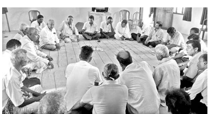
ମହାସଂଘରେ ଯୋଗ ଦେଇଥିବା ସଭାପତି, ସମ୍ପାଦକ ଓ ସଦସ୍ୟମାନେ ।

ପୁରୀ ଜିଲାର କୃଷ୍ଣପ୍ରସାଦ ବ୍ଲକ୍ କୁ ୩ ପାର୍ଶ୍ୱରୁ ଚିଲିକା ଏବଂ ଗୋଟିଏ ପାର୍ଶ୍ୱରୁ ବଙ୍ଗୋପସାଗର ଘେରି ରହିଛି। ତେଣୁ ଚିଲିକାକୁ କୃଷ୍ଣପ୍ରସାଦର ଭାତହାଣ୍ଡି ବୋଲି କୁହାଯାଇଥାଏ।