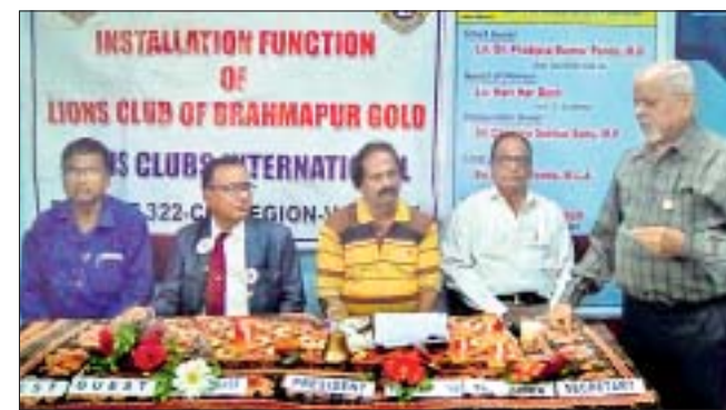
ଅଧିଷ୍ଠାନ ଉତ୍ସବରେ ମହାସ୍ଥାନ ଅତିଥିମାନେ