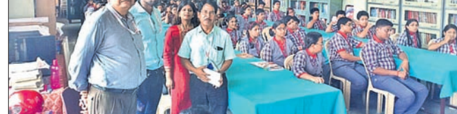
ଭୁବନେଶ୍ୱର, ୨୩-୭ (ବ୍ୟୁରୋ)