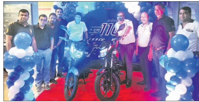
ଭୁବନେଶ୍ୱର, ୨୩-୭ (ବ୍ୟୁରୋ)