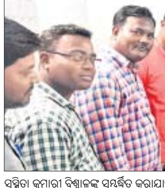
ସମ୍ବରଦ୍ଧି କୁମାରୀ ବିଶ୍ୱାଳକ୍ଷ୍ମ ସମର୍ପଣ କରାଯାଇଛି।