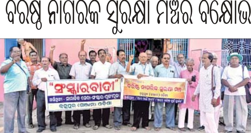
ସଂଗଠନ କର୍ମକର୍ତ୍ତାମାନେ ବିକ୍ଷୋଭ ପ୍ରଦାନ କରିଛନ୍ତି।