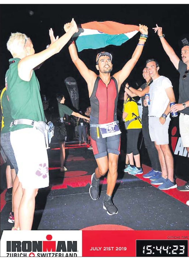
ଆଇରନ୍ ମ୍ୟାନ ଟାଇଟଲ ଜିତିବା ପରେ ଖୁସି ମନାଉଛନ୍ତି ଅଭିଯୋଗୀ ପଦକାୟକ ।

ଦତ୍ତୁଙ୍କୁ କୋର୍ଟରେ ଡାକି ନିର୍ଦ୍ଦୋଷୀ ମାମଲା ରଦ୍ଦ କରିଛନ୍ତି। ଏହି ଅଭିଯୋଗକୁ ମୁମ୍ବାଇର ବିଚାର ଚାଲିଥିବାବେଳେ ଆସକ୍ତ ମାସରେ ଅସ୍ଥିଆରେ ହେବାକୁ