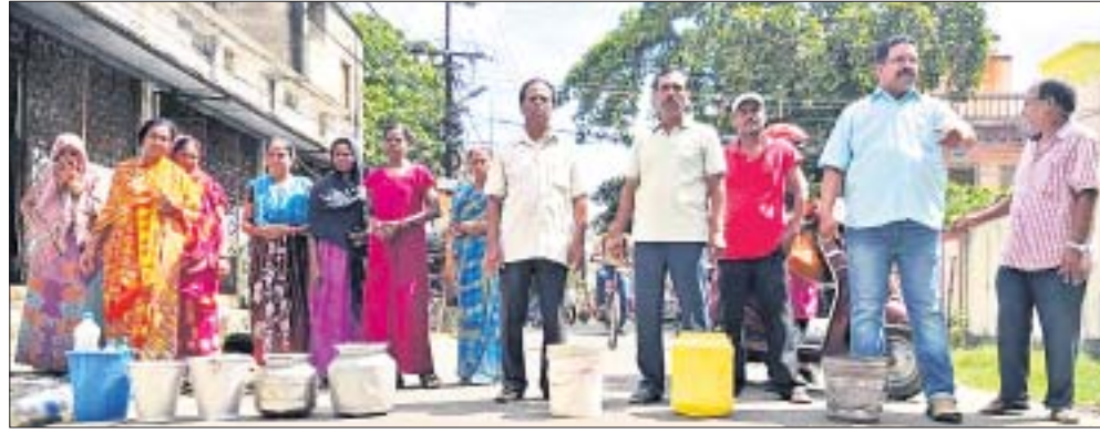
ଗଜପତି ନଗରରେ ବିକ୍ଷୋଭ ସୂଚୀ ଯାଚାଯାଉଛି