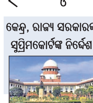
ଖଣ୍ଡପାଠ ଉଚ୍ଚ ନିର୍ଦ୍ଦେଶ ଦେଇଛନ୍ତି