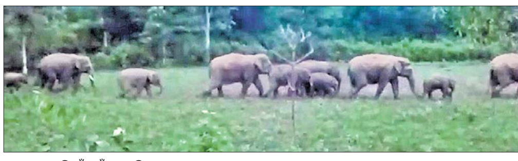
ଜଙ୍ଗଲକୁ ବାହାରି ଗାଁ ପୁହାଁ ହେଉଛନ୍ତି ହାତୀ।

ଚମ୍ପୁଆ ରେଞ୍ଜରେ ହାତୀ ଉପଦ୍ରବ ଦିନକୁ ଦିନ ବଢ଼ି ଚାଲିଥିବା ବେଳେ ବନ ବିଭାଗର ନାଚର ପଣିଆ ଗ୍ରାମବାସୀଙ୍କୁ ରାତ୍ରୀ ଅନିଦ୍ରା ହେବାକୁ ବାଧ୍ୟ କରୁଛି। ବର୍ଷା ଅଭାବରୁ ଚମ୍ପୁଆ ବ୍ଲକ୍ରେ ମରୁତ ଆଖିକା ଦେଖା ଦେଇଥିବା ବେଳେ ଚାଷୀ ଆତଙ୍କିତ ଅବସ୍ଥାରେ ରହିଛନ୍ତି। ଯାହା ଦି ଖରାଡ଼ିଆ ଚାଷ କରିଥିଲେ ତାହାକୁ ହାତୀ ଦାଉରୁ ରକ୍ଷା କରିବା ତିକ୍ତ ଏବେ ଚାଷୀଙ୍କୁ ଘାରିଛି। ସାମିତ କେତେକ ସ୍ୱାର୍ଥ ଦ୍ୱାରା ହାତୀ ଘଉଡ଼ାଇବା କାର୍ଯ୍ୟ କରାଯାଇଛି। ହେଲେ ଗାର୍ଡ ଅନୁପାତରେ ହାତୀ ମାନଙ୍କ ସଂଖ୍ୟା ଅଧିକ ଥିବାରୁ ହାତୀ ଘଉଡ଼ାଇବା ଯୋଜନା ବିଫଳ ହୋଇଥିବା ଦେଖିବାକୁ ମିଳିଛି। ଏହାକୁ ନେଇ ଗ୍ରାମବାସୀଙ୍କ ମଧ୍ୟରେ ବହୁଥିବା ଅସନ୍ତୋଷ ଏବେ ଆନ୍ଦୋଳନର ଦାନା ବାନ୍ଧିବା ଆରମ୍ଭ କଲାଣି। ବନ ବିଭାଗ