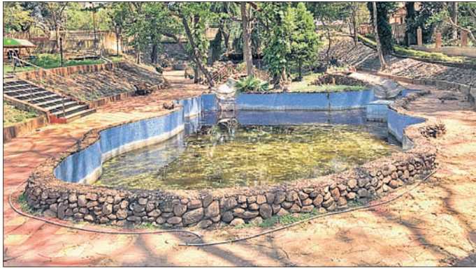
ତଜା ପଡ଼ି ରହିଥିବା ବେଳେ ଜଳାଶୟ ଅପରିଷ୍କାର ହୋଇଛି ।