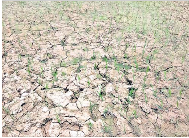
ବର୍ଷା ଅଭାବରୁ ଚାଷ ଜମି ଫାଟି ଥାଏ। ଜଳ ସେଚନ ପ୍ରକଳ୍ପ ରହିଛି। ଏଥିରେ ଯୋଜନା ରହିଥିଲେ ହେଁ କୌଣସି ୬ହଜାର ହେକ୍ଟର ଜମିରେ ଜଳସେଚନର ପ୍ରକଳ୍ପରେ ପାଣି ନାହିଁ। ଏଥି ଯୋଗୁଁ

ସମ୍ପୂର୍ଣ୍ଣ ପାଟ ଯୋଗୁଁ ଚେଲକୋଇ ବ୍ଲକରେ ଚାଷଜମି ଫାଟି ଥାଏ। ଧାନ ଚାଷ, ବିହୁଆ ଓ ପ ହୋଇଥିବା ବେଳେ ଧାନ ଚଳି ହଳଦିଆ ହୋଇ ପଡ଼ିଛି। ଶ୍ରାବଣ ମାସ ଆରମ୍ଭ ହୋଇଥିବା ବେଳେ ବର୍ଷା ର ଦେଖା ନାହିଁ। ଅଧ୍ୟାପକଙ୍କ ଦର୍ଶନ ଅଭାବ ଯୋଗୁଁ ନଦୀ ନାଳର ଜଳ ଉପ ଗୁଡ଼ିକରେ ପାଣି ନାହିଁ। କୁଳ ଅଧୀନରେ ୧୨ ହଜାର ହେକ୍ଟରରୁ ଉର୍ଦ୍ଧ୍ୱ ଧାନକ୍ଷେତ ମାତ୍ର ୫ ପ୍ରତିଶତ କାର୍ଯ୍ୟ ହୋଇଯାଇଛି। ଏହି ୫ ପ୍ରତିଶତ ଚାଷ ଜମିରେ ଚାଷ ବଞ୍ଚାଇବା ପାଇଁ ଚାଷୀ ମାନେ ମୋଟର ସାହାଯ୍ୟରେ ପାଣି ମତାଇବା ପାଇଁ ଉଦ୍ୟମ ଜାରି ରଖିଛନ୍ତି। ତେବେ ଏହି ବ୍ଲକ ଅଧୀନରେ ୧୨ଟି କ୍ଷୁଦ୍ର