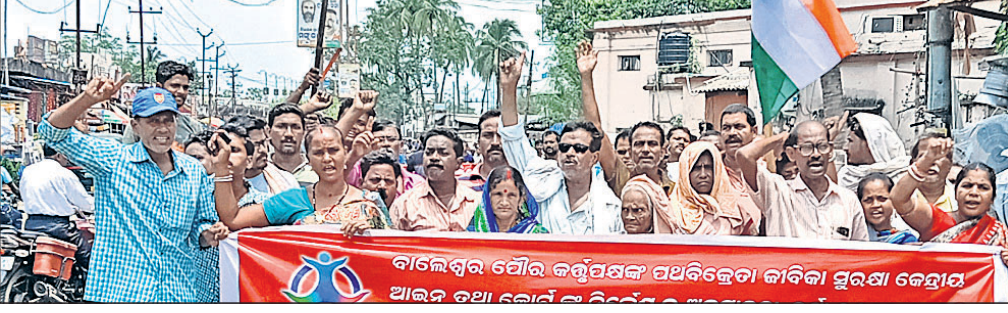
ଓଡ଼ିଶା ପଥବିକେତ୍ରା ସଂଘ ପକ୍ଷରୁ ବିରୋଧ ଓ ବିକ୍ଷୋଭ ପ୍ରଦର୍ଶନ କରାଯାଇଛି।