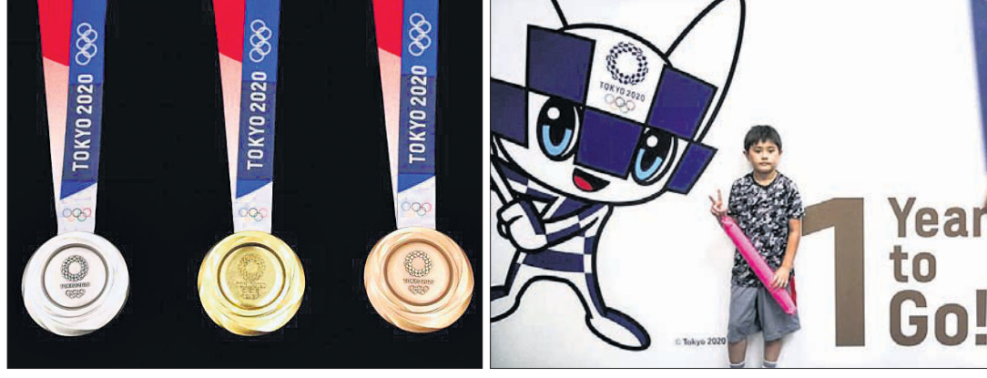
ଅଲିମ୍ପିକ୍ ପାଇଁ ଉନ୍ମୋଚିତ ପଦକ ରୌପ୍ୟ, ସ୍ୱର୍ଣ୍ଣ ଓ ବ୍ରୋଞ୍ଜ । ୨୦୨୦ ଅଲିମ୍ପିକ୍ ଅବଗଣନା

୨୦୨୦ ଟୋକିଓ ଅଲିମ୍ପିକ୍ସ ଆରମ୍ଭ ହେବାକୁ ଆଉ ଟୋକିଓ ବର୍ଷ ବାକି ରହିଛି । ଏହି ଅବଗଣନା ଆରମ୍ଭ କରିବା ଅବସରରେ ଅଲିମ୍ପିକ୍ସର ସ୍ୱର୍ଣ୍ଣ, ରୌପ୍ୟ ଓ ବ୍ରୋଞ୍ଜ ପଦକ ଉନ୍ମୋଚନ କରାଯାଇଛି । ଜାପାନର ପ୍ରଶଂସକ, ପ୍ରାୟୋଜକ ଓ ରାଜଧାନୀ ଟୋକିଓରେ ଏହି ଦିନକୁ ଅବଗଣନା ଉତ୍ସବ ହିସାବରେ ବ୍ୟାପକଭାବେ ପାଳନ କରିଛନ୍ତି । ଏହି କ୍ରୀଡ଼ା ମହାକୁସ୍ତ ୨୦୨୦ ଜୁଲାଇ ୨୫ ତାରିଖରେ ଆରମ୍ଭ ହେବ । ଅଲିମ୍ପିକ୍ସ ଆରମ୍ଭ ହେବାକୁ ୩୬୫ ଦିନ ବାକିଥିବାକୁ ସୂଚାଉଥିବା ଘଣ୍ଟାକୁ ପ୍ରକାଶ କରିବାକୁ ପାଳନ କରାଯାଇଛି ।