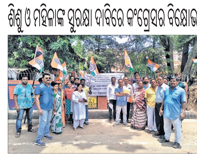
କଂଗ୍ରେସ ଦେବତୃତ୍ଵ ବିକ୍ଷୋଭ ପ୍ରଦର୍ଶନ କରୁଛନ୍ତି ।

କଂଗ୍ରେସ ଦେବତୃତ୍ଵ ବିକ୍ଷୋଭ ପ୍ରଦର୍ଶନ କରୁଛନ୍ତି । ବାରିପଦା ଅଫିସ, ୨୫୭ (ଡି.ଏନ୍.ଏ.) ରାଜ୍ୟରେ କ୍ରମାଗତ ଭାବେ ଶିଶୁ ନାବାଳିକା ଓ ନାରୀ ନିର୍ଯାତନା, ବଳାହାର, ଅପହରଣ ଓ ନିଷେଧ ଘଟଣା ବଢ଼ି ଚାଲିଛି । ଏହାର ପ୍ରତିବାଦରେ ତଥା ଶିଶୁ ଓ ମହିଳାଙ୍କ ସୁରକ୍ଷା ଦାବିରେ ରାଜ୍ୟ କଂଗ୍ରେସ ନିର୍ଦ୍ଦେଶ କ୍ରମେ ମୟୂରଭଞ୍ଜ ଜିଲା କଂଗ୍ରେସ ପକ୍ଷରୁ ରୁଧିର ଭଙ୍ଗାପାଳକ କାର୍ଯ୍ୟାଳୟ ସମ୍ମୁଖରେ ବିକ୍ଷୋଭ ପ୍ରଦର୍ଶନ ପାଠାଯାଇଥିଲା ।