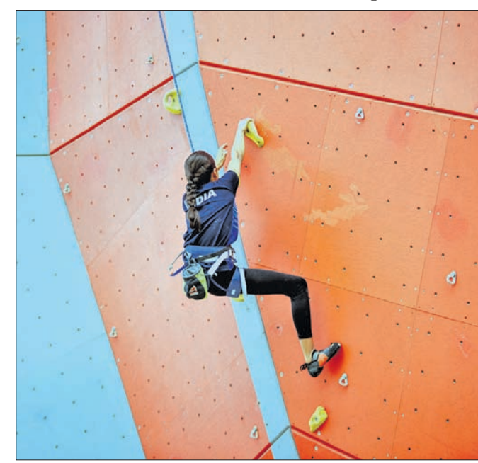
ଓଲି ଡ଼ିଏରେ ନିମନ୍ତ୍ରଣ କଲେ ପ୍ରତିଯୋଗୀ ।

ଭାରତୀୟ ମାଉଣ୍ଟେନିଂ ଫେଡେରେଶନ (ଆଇଏମ୍‌ଏଫ୍) ଏବଂ ରାଜ୍ୟ ସରକାରଙ୍କ କ୍ରୀଡ଼ା ଓ ଯୁବସେବା ବିଭାଗ ମିଳିତ ଆନୁକୁଲ୍ୟରେ କଳିଙ୍ଗ ଷ୍ଟାଡିୟମରେ ସ୍ପୋର୍ଟ୍ସ୍ କ୍ଲବ୍‌ସିଂର ଏକ ହାଇପରଫରମାଟ୍ ସେଣ୍ଟର ନିର୍ମାଣ କରାଯାଇଛି । ଭାରତୀୟ ସ୍ପୋର୍ଟ୍ସ୍ କ୍ଲବ୍‌ସିଂକୁ ଅନ୍ତର୍ଜାତୀୟ ମାନର କରିବା ଏହାର ଲକ୍ଷ୍ୟ । ଏହାକୁ ଦୃଷ୍ଟିରେ ରଖି ଆଇଏମ୍‌ଏଫ୍ ପକ୍ଷରୁ ଚଳିତମାସ ୧୬ ତାରିଖରୁ ୧୦ରୁ ୧୬ ବର୍ଷ ବୟସବର୍ଗର ବାଳିକା ବାଳକଙ୍କୁ ନେଇ ଟ୍ରେନିଂ ଆରମ୍ଭ କରାଯିବାକୁ ଯୋଜନା ହୋଇଛି । କ୍ରୀଡ଼ା ଓ ଅନ୍ତର୍ଜାତୀୟ ସ୍ତରର ପେସାଦାର ଟ୍ରେନରଙ୍କୁ ଅଣାଯାଇ ଏଠାରେ ଟ୍ରେନିଂ ଦିଆଯିବ । ସ୍ପୋର୍ଟ୍ସ୍ କ୍ଲବ୍‌ସିଂ ଏବେ ଏକ ଅଲିମ୍ପିକ୍ କ୍ରୀଡ଼ା । ଏହା ୨୦୨୦ ଟୋକିଓ ଅଲିମ୍ପିକ୍ସରେ