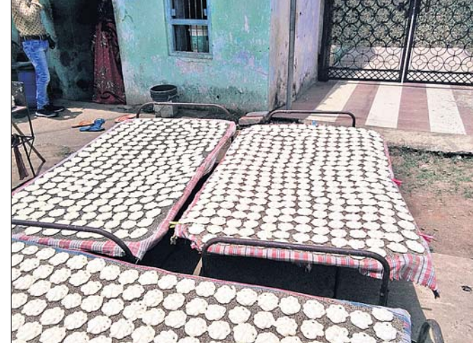
ଖରାରେ ବଡ଼ ବୁଡ଼ିବୁ ଶୁଖାଯାଇଛି।

କେନ୍ଦୁଝରର ଓଡ଼ିଶା ପ୍ରସିଦ୍ଧ ବଡ଼ କଥା କିଏ ନ ଜାଣେ। ଏହି ବଡ଼କୁ ନେଇ ଆଦର ବହୁଥିଲେ ମଧ୍ୟ ସେପରି ଭାବେ ସରକାରୀ ଭାବେ ପ୍ରୋତ୍ସାହନ ମିଳୁନାହିଁ। କେନ୍ଦୁଝରରେ ଏହା ପାଇଁ ଏକ ସ୍ୱତନ୍ତ୍ର ବଜାର ଟିଏ କରାଗଲେ ବହୁ ଲୋକ ଶାନ୍ତିପାଠରେ। କେନ୍ଦୁଝରରେ ପ୍ରସ୍ତୁତ ହେଉଥିବା ବଡ଼ ସାଧାରଣତଃ ବେଶ୍ୱ ସାବିତ୍ରୀ ବୋଲି ଏଥିପାଇଁ ସମସ୍ତଙ୍କ ରୁଚି ରହିଥିବାବେଳେ ଏହାର ମୁଖ୍ୟ କାରଣ ହେଉଛି କେନ୍ଦୁଝରର ଜଳବାୟୁ। ଶୀତ ଦିନରେ ଏହି ବଡ଼କୁ ଅଧିକ ସାବିତ୍ରୀ ଓ ଖାଇବା ଉପଯୋଗୀ ହୋଇଥାଏ। କେବଳ ଓଡ଼ିଶା କାର୍ଯ୍ୟକ୍ରମ ଅନୁସାରେ ମଧ୍ୟ କେନ୍ଦୁଝରର ବଡ଼ ବେଶ୍ୱ ରାଜ୍ୟରେ ମଧ୍ୟ କେନ୍ଦୁଝରର ବଡ଼ ବେଶ୍ୱ ପ୍ରସିଦ୍ଧିଲାଭ କରିଛି। ତେବେ ବିଭିନ୍ନ କିସମର ବଡ଼ ରହିଛି। ଫୁଲବଡ଼ି, କଖାରୁ ବଡ଼, ମଞ୍ଜି ବଡ଼, ବାଦାମ ବଡ଼ ପ୍ରଭୃତି। ତେବେ ଅନେକ କିସମର ବଡ଼ ଥିଲେ ମଧ୍ୟ ଫୁଲବଡ଼ିର ସ୍ୱତନ୍ତ୍ର ଆଦର ରହିଛି। ଫୁଲବଡ଼ି ପାଇଁ କେନ୍ଦୁଝରର ପାହାଡ଼ିଆ ଅଞ୍ଚଳରେ ପ୍ରସ୍ତୁତ ପେଟୁଆ ବିରି ଓ ଖଦା ପ୍ରସ୍ତୁତ ହୋଇଥାଏ। ପୂର୍ବଦିନ