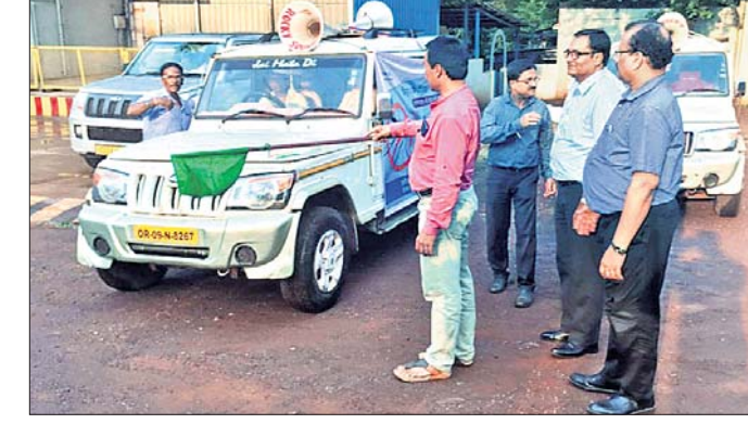
ତେଜୁ ସଚେତନତା କାର୍ଯ୍ୟକ୍ରମ ଶୁଭାରମ୍ଭ।