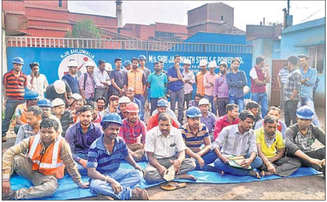
କେଜେଏସ ପିଲେଟ ପ୍ଲାଷ୍ଟ ମୁଖ୍ୟ ଫାଟକ ସମ୍ମୁଖରେ ଆନ୍ଦୋଳନରତ ଶ୍ରମିକ।

କେଜେଏସ ପିଲେଟ ପ୍ଲାଷ୍ଟ ମୁଖ୍ୟ ଫାଟକ ସମ୍ମୁଖରେ ଆନ୍ଦୋଳନ ଆରମ୍ଭ କରିଛନ୍ତି। ସୂଚନା ଅନୁଯାୟୀ, କେଜେଏସ ପିଲେଟ ପ୍ଲାଷ୍ଟରେ ୩ଶହରୁ ଊର୍ଦ୍ଧ୍ୱ ଶ୍ରମିକ ନିଯୋଜିତ ରହିଛନ୍ତି। ଦୀର୍ଘ ଦେଢ଼ ବର୍ଷ କାର୍ଯ୍ୟରତ ଥିବା ଶ୍ରମିକମାନଙ୍କୁ କମ୍ପାନୀ ପକ୍ଷରୁ ବିଭିନ୍ନ ସୁବିଧା ମିଳୁ ନ ଯୋଗୁଁ ଶ୍ରମିକମାନେ ଆନ୍ଦୋଳନ ଆରମ୍ଭ କରିଛନ୍ତି। ଶ୍ରମିକମାନେ କେଜେଏସ ପିଲେଟ ପ୍ଲାଷ୍ଟ ମୁଖ୍ୟ ଫାଟକ ସମ୍ମୁଖରେ ଆନ୍ଦୋଳନ ଆରମ୍ଭ କରିଛନ୍ତି। ସୂଚନା ଅନୁଯାୟୀ, କେଜେଏସ ପିଲେଟ ପ୍ଲାଷ୍ଟରେ ୩ଶହରୁ ଊର୍ଦ୍ଧ୍ୱ ଶ୍ରମିକ ନିଯୋଜିତ ରହିଛନ୍ତି। ଦୀର୍ଘ ଦେଢ଼ ବର୍ଷ କାର୍ଯ୍ୟରତ ଥିବା ଶ୍ରମିକମାନଙ୍କୁ କମ୍ପାନୀ ପକ୍ଷରୁ ବିଭିନ୍ନ ସୁବିଧା ମିଳୁ ନ ଯୋଗୁଁ ଶ୍ରମିକମାନେ ଆନ୍ଦୋଳନ ଆରମ୍ଭ କରିଛନ୍ତି। ଶ୍ରମିକମାନେ କେଜେଏସ ପିଲେଟ ପ୍ଲାଷ୍ଟ ମୁଖ୍ୟ ଫାଟକ ସମ୍ମୁଖରେ ଆନ୍ଦୋଳନ ଆରମ୍ଭ କରିଛନ୍ତି।