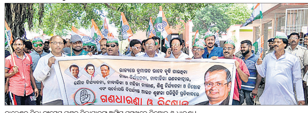
ବାଲେଶ୍ୱର ଜିଲା କଂଗ୍ରେସ ପକ୍ଷରୁ ଜିଲାପାଳଙ୍କ ଅଫିସ୍ ସମ୍ମୁଖରେ ବିକ୍ଷୋଭ ଓ ଧାରଣା।