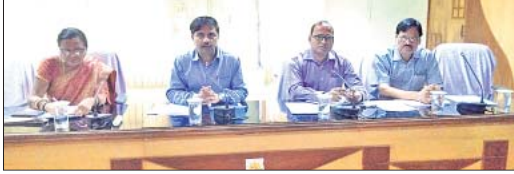
ବୈଠକରେ ଉପସ୍ଥିତ ଜିଲାପାଳ ଏବଂ ଅନ୍ୟମାନେ ।