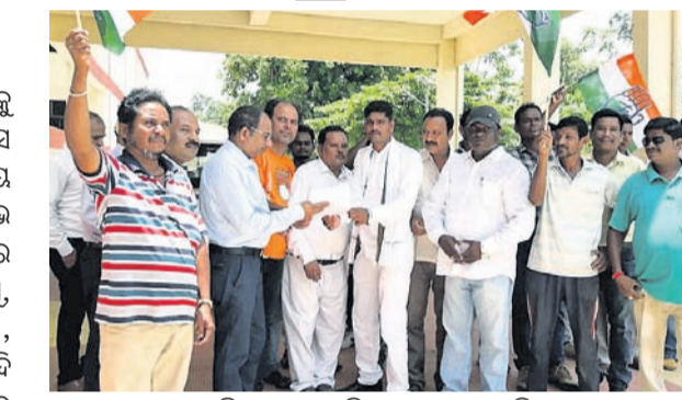
କଂଗ୍ରେସ ନେତା ଉପକ୍ରମାପାଳଙ୍କୁ ଦାବିପତ୍ର ପ୍ରଦାନ କରୁଛନ୍ତି ।