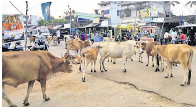
ରାସ୍ତାରେ ବୁଲୁଥିବା ଗୋରୁଗାଈ।

ମାଲକାନଗିରି ଜିଲା ପଡିଆ ବ୍ଲକ ଅନ୍ତର୍ଗତ ଏମିତି-୭୯ ମୁଖ୍ୟ ରାସ୍ତାରେ ଗୋରୁଙ୍କ ବାରଣଭଙ୍ଗି ପାଇଛି।