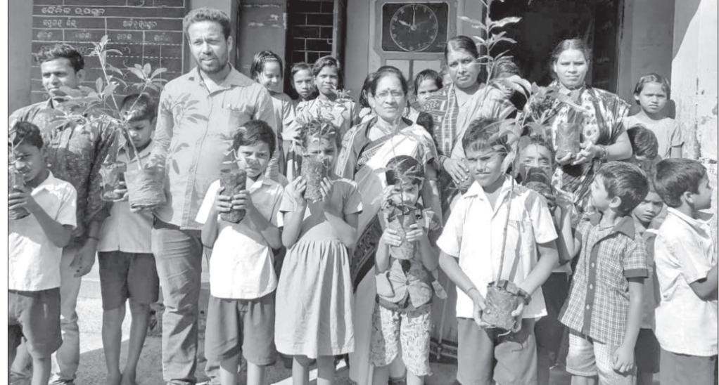
କାର୍ଯ୍ୟକ୍ରମରେ ଶିକ୍ଷୟିତ୍ରୀଶିକ୍ଷକ ଏବଂ ଛାତ୍ରଛାତ୍ରୀ।

ଡେକାନାଲ ଅଫିସ, ୨୪୧୭ ପରିବେଶ ପୁରୁଣା ଏବଂ ଜଳବାୟୁ ସଂରକ୍ଷଣ ପାଇଁ ଗଛର ଆବଶ୍ୟକତା ଅନେକ। ଏପରି ମହତ୍ତ୍ୱ ବାଣୀ ନେଇ ଡେକାନାଲସ୍ଥିତ ମହିଷାପାତ ସରକାରୀ