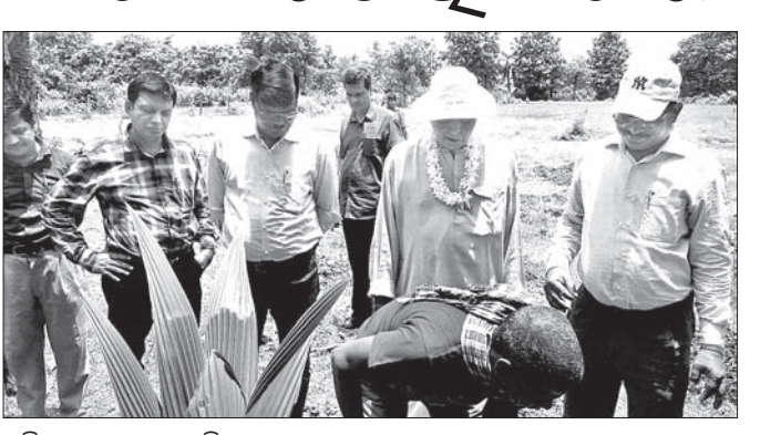
କପିଳାସ ତପୋବନ ମହିମା ପୀଠରେ ବନ ମହୋତ୍ସବ।