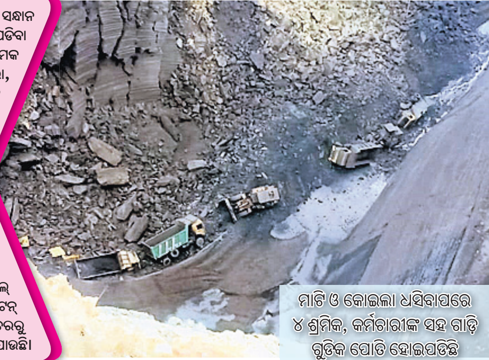
ମାଟି ଓ କୋଇଲା ଧସିବାପରେ ୪ ଶ୍ରମିକ, କର୍ମଚାରୀଙ୍କ ସହ ଗାଡ଼ି ଗୁଡ଼ିକ ପୋଡ଼ି ହୋଇପଡ଼ିଛି

୧୯୨୨ରେ ଇଷ୍ଟଇଣ୍ଡିଆ କମ୍ପାନୀ ତାଳଚେରଠାରେ କୋଇଲା ସମ୍ପାଦନା ପାଇଁ ସର୍ଭେ କରିଥିଲା। ସେହିବର୍ଷ ଏଠାରେ କୋଇଲା ଥିବା ଜଣାପଡ଼ିବ। ପରେ ତତକାଳୀନ ରାଜ୍ୟ ଅନୁମତି ନେଇ ୧୯୧୬ରେ ଭିଲିୟର୍ସ ନାମକ କମ୍ପାନୀ ହାଣ୍ଡିଆଁଠାରେ କୋଇଲା ଖଣି ଆରମ୍ଭ କଲା। ପରେ ଡେରା, ବଳଶ୍ୟା ଆଦି ଅଞ୍ଚଳରେ ଖଣି ଖୋଳା ଯାଇଥିଲା। ତେବେ ୧୯୯୨ ଏପ୍ରିଲ ମାସେ ଓଡ଼ିଶାର କୋଇଲା ଖଣିଗୁଡ଼ିକୁ ନେଇ ମହାନଦୀ କୋଲ୍ ଫିଲଡସ୍ (ଏମ୍ପ୍ଲଏୟାର୍) ଜନ୍ମ ନେଇଥିଲା। ଇନ୍ ଭ୍ୟାଲି ସହ ଏବେ ତାଳଚେରର ହିଲୁଳା, ବଳରାମ, ଭରତପୁର, ନନ୍ଦିରା, ଜଗନ୍ନାଥ, ଅନନ୍ତ, ଲିଙ୍ଗରାଜ, ଭୁବନେଶ୍ୱରୀ, କଣିହାଁ ଓପନକାଷ୍ଟ, ନନ୍ଦିରା ଓ ଡେରା ଅଣ୍ଡର ମାଲିନି ଖଣିରୁ ଏମ୍ପ୍ଲଏୟାର୍ କୋଇଲା ଉତ୍ତୋଳନ କରୁଛି। ଖଣି ଆରମ୍ଭ ବେଳେ ଏମ୍ପ୍ଲଏୟାର୍ ଉତ୍ପାଦନ କ୍ଷମତା ଥିଲା ବାର୍ଷିକ ୨୨ ମିଲିୟନ ଟନ୍। ସେଥିରୁ ତାଳଚେରରୁ ୧୬ ଓ ଇନ୍ ଭ୍ୟାଲିରୁ ୬ ମିଲିୟନ ଟନ୍ ଉତ୍ତୋଳନ ହେଉଥିଲା। ଏବେ କେବଳ ତାଳଚେର କୋଲ୍ ଫିଲଡସ୍‌ରୁ ଗତବର୍ଷ ୮୦ ମିଲିୟନ ଟନ୍ କୋଇଲା ଉତ୍ତୋଳନ ହୋଇଛି। ଆଗାମୀ ୫ ବର୍ଷରେ ଏମ୍ପ୍ଲଏୟାର୍ ତାଳଚେର କୋଲ୍ ଫିଲଡସ୍‌ରୁ ୨୫୫ ମିଲିୟନ ଟନ୍‌କୁ ମିଶାଇ ମୋଟ ୩୫୫ ମିଲିୟନ ଟନ୍ ଉତ୍ପାଦନ କରିବ ବୋଲି ଲକ୍ଷ୍ୟଧାରୀ କରାଯାଇଛି। ପ୍ରତିଦିନ ତାଳଚେରରୁ ୨.୫ ଲକ୍ଷ ଟନ୍ କୋଇଲା ଉତ୍ତୋଳନ ସହ ପରିବହନ କରାଯାଉଛି।