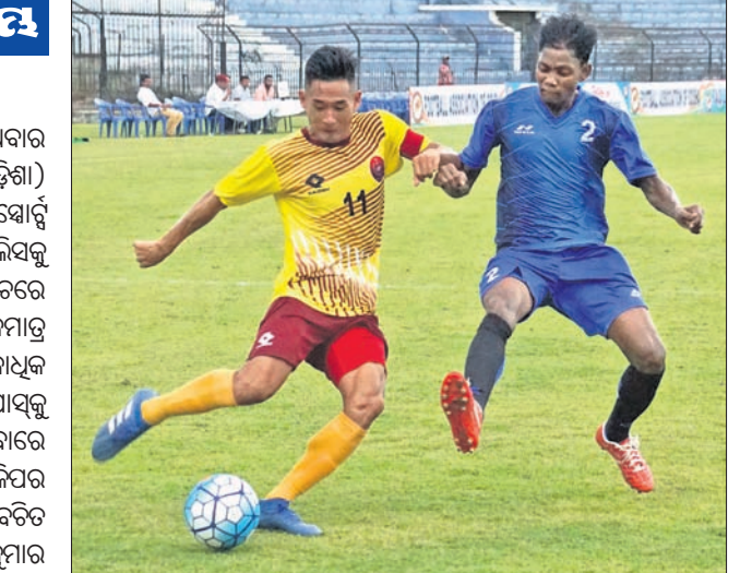
ସ୍ପୋର୍ଟ୍ସ ହଷ୍ଟେଲ ଓ ଓଡ଼ିଶା ପୋଲିସ ମଧ୍ୟରେ ଅନୁଷ୍ଠିତ ମ୍ୟାଚ୍ ।

କଟକର ବାରବାଟୀ ସ୍ଵାତିୟମରେ ରୁପ୍ତାବାର ଫାଓ (ଫୁଟବଲ ଆସୋସିଏସନ ଅଫ୍ ଓଡ଼ିଶା) ଲିଗ୍ ଉଦ୍ଘାଟିତ ହୋଇଛି ।