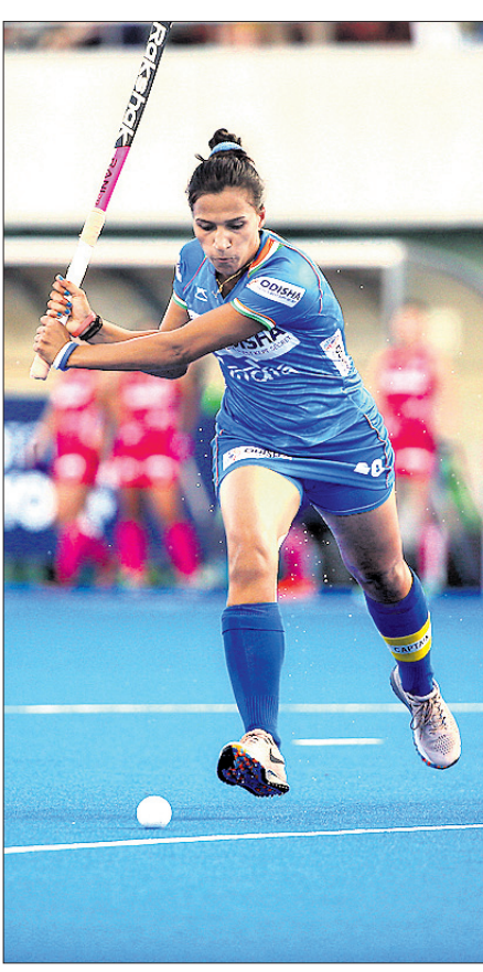
ମନପ୍ରୀତ ସିଂ ଓ ରାଣୀ ରାମପାଲ

ଆଗକୁ ବହୁଛି ବୋଲି ସିଂ ଓ ଦୁତୀ ପ୍ରମାଣିତ କରିଛନ୍ତି। ସେମାନଙ୍କ ପ୍ରଦର୍ଶନ