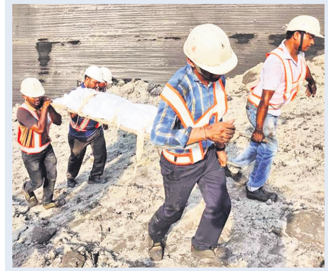
ମୃତଦେହକୁ ଉଦ୍ଧାର କରି ନିଆଯାଉଛି । ■ ଜଣେ ଶ୍ରମିକଙ୍କ ମୃତଦେହ ଉଦ୍ଧାର ■ ଅନ୍ୟ ୩ ଜଣଙ୍କୁ ଚାଲିଛି ଖୋଜା ■ ୯ ଗୁରୁତର ସେଣ୍ଟାଲ ହସ୍ପିଟାଲରେ ଭର୍ତ୍ତି ■ ବିଜୟରେ ଉଦ୍ଧାର କାର୍ଯ୍ୟକୁ ନେଇ ଉତ୍ତେଜନା ■ ଦୃଢ଼ କାର୍ଯ୍ୟାନୁଷ୍ଠାନ ଦାବି କଲେ ବିଧାୟକ