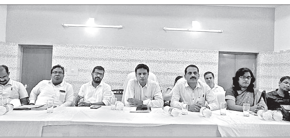
କର୍ମଶାଳାରେ ପ୍ରଶାସନିକ ଅଧିକାରୀମାନେ।

ଦେଶାନ୍ତର ଜିଲ୍ଲାର ୯୮ ପଡ଼ାଗ୍ରାମକୁ ମିଳିବ ରାଜସ୍ୱ ଗ୍ରାମ୍ୟ ମାନ୍ୟତା। ଏଥିପାଇଁ ବିଧିବଦ୍ଧ ଭାବେ ଆରମ୍ଭ ହୋଇଛି ପ୍ରକ୍ରିୟା। ଭିକିଟୁମ୍ ସମାକ୍ଷା, ଗ୍ରାମବାସୀଙ୍କ ସହ ଆଲୋଚନା ଏବଂ ଆବଶ୍ୟକ ସରକାରୀ ଦୁଇଟି ସୁଯୋଗ ବ୍ୟବସ୍ଥା କରାଯିବା ପରେ ଏ ସଂକ୍ରାନ୍ତିରେ ପରବର୍ତ୍ତୀ କାର୍ଯ୍ୟପଦ୍ଧତୀ ଗ୍ରହଣ କରାଯିବ।