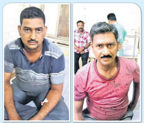
ସେଣ୍ଟ୍ରାଲ ହସ୍ପିଟାଲରେ ଚିକିତ୍ସିତ ଗୁରୁତର ମାନେ