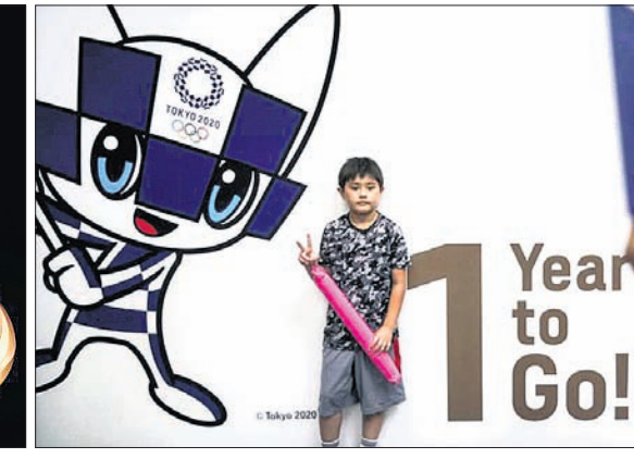
ଅଲିମ୍ପିକ୍ ପାଇଁ ଉନ୍ମୋଚିତ ପଦକ ରୌପ୍ୟ, ସ୍ୱର୍ଣ୍ଣ ଓ ବ୍ରୋଞ୍ଜ । ୨୦୨୦ ଅଲିମ୍ପିକ୍ସ ଅବଗଣନା

ଅଲିମ୍ପିକ୍ସ ଆୟୋଜନ ଓ ସହାୟ ପ୍ରସ୍ତୁତି ପାଇଁ ଟୋକିଓ ୨୦ ବିଲିୟନ ଆମେରିକୀୟ ଡଲାର ବ୍ୟୟ କରୁଛି । ଆୟୋଜକ ସହର ହିସାବରେ ଟୋକିଓର ପ୍ରସ୍ତୁତି ପାଇଁ ଏହି ପରିମାଣ ଅର୍ଥ ଖର୍ଚ୍ଚ ହେବା ଚାଲୁ ରହିଛି ।