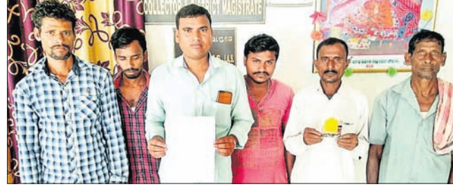
ଜିଲ୍ଲାପାଳଙ୍କ କାର୍ଯ୍ୟାଳୟକୁ ଅଭିଯୋଗ କରିବାକୁ ଆସିଥିବା ଜମିଦାରୀଗଣ।