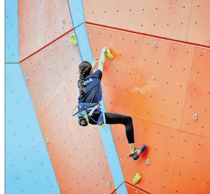
ଓଲି କ୍ରିକେଟ୍‌ରେ ନିମନ୍ତ ଲଗେ ପ୍ରତିଯୋଗୀ ।

ଭାରତୀୟ ଦଳରେ ଅଭିଆତ କରିଥିବା ଚିନ୍ ପୂର୍ଣ୍ଣାଦ ଦର୍ଶକଙ୍କଠାରୁ ଅଭିବାଦନ ଗ୍ରହଣ କରୁଛନ୍ତି ।