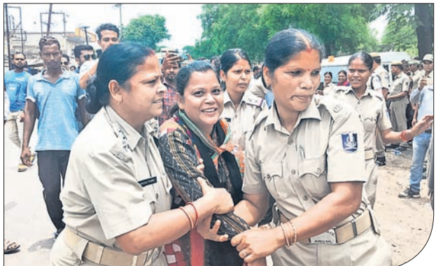
ଜଣେ ମହିଳା କର୍ମୀଙ୍କୁ ଯୋଗ୍ୟ ରାସ୍ତାରୁ ହଟାଇଛି ।