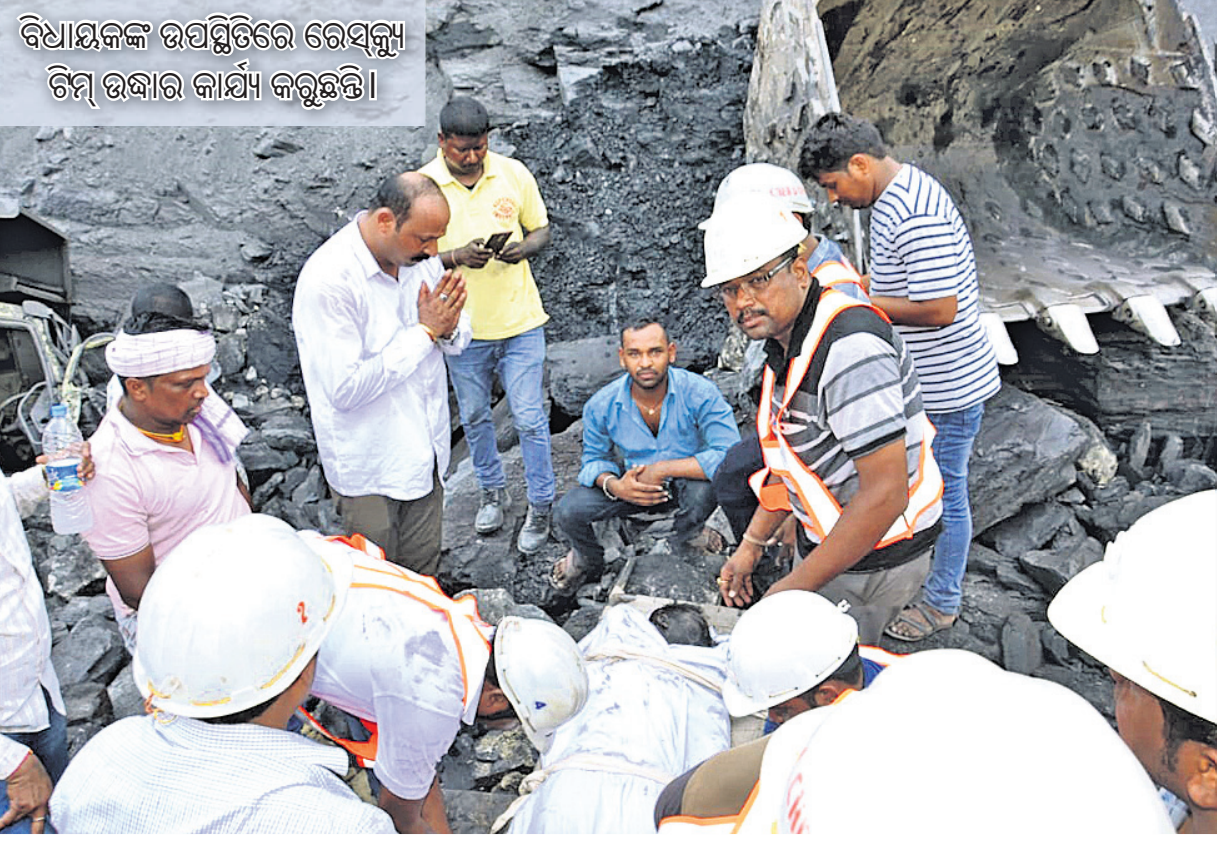
ବିଧାୟକଙ୍କ ଉପସ୍ଥିତିରେ ରେଭିନ୍ୟୁ ଟିମ୍ ଉଦ୍ଧାର କାର୍ଯ୍ୟ କରୁଛନ୍ତି।