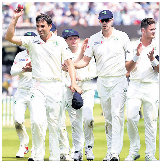
୫ ଉଇକେଟ ଅଧିଆର କରିଥିବା ଚିନ୍ ପୂର୍ଣ୍ଣାଦ ଦର୍ଶକଙ୍କଠାରୁ ଅଭିବାଦନ ଗ୍ରହଣ କରୁଛନ୍ତି ।

ଐତିହାସିକ ଲଣ୍ଡନ ଗ୍ରୀଡ଼଼ଖରେ ଯୁଧ୍ୱାବାରଠାକୁ ଆରମ୍ଭ ହୋଇଥିବା ଆୟଲିଂସ୍ ବିପକ୍ଷ ଏକମାତ୍ର ଟେଷ୍ଟ ମ୍ୟାଚ୍‌ରେ ଯିବାର ଲକ୍ଷ୍ୟ ଦିପ୍ତୀୟନରେ ସମ୍ପୂର୍ଣ୍ଣ ହୋଇଛି ।