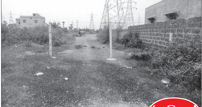
ତାରବାଡ଼କୁ ହଟାଇ ରାସ୍ତା ଖୋଲାଯାଇଛି।

ଦେଶାନ୍ତର ଜିଲ୍ଲା ଓଡ଼ିଆପଡ଼ା ବ୍ଲକ୍ କଣ୍ଟାବଣିଆ ଥାନା ନିକଟରେ ରହୁଥିବା ଶହୀଦ ପରିବାର ଘରକୁ ବାଟ ଫିଟିଲା। 'ଧରତୀ'ରେ ଖବର ପ୍ରକାଶ ପାଇବା ପରେ ପୋଲିସ୍ ରାସ୍ତାରେ ପକାଇଥିବା ତାରବାଡ଼ ଉଠାଇଦେଇଛି। ଫଳରେ ସମ୍ପୂର୍ଣ୍ଣ ପରିବାର ସଦସ୍ୟ ସ୍ୱାଭାବିକ ଭାବେ ଏବେ ରାସ୍ତାରେ କରିପାରିବେ ବୋଲି ସାଧାରଣରେ ମତପ୍ରକାଶ ପାଲିଛି। ସୂଚନାଯୋଗ୍ୟ, ହିରୋଇ ବ୍ଲକ୍ ରାସୋଲ ଥାନା ବେଡ଼ାପଡ଼ା ଗ୍ରାମର ବୃତନାୟକଙ୍କ ଏକମାତ୍ର ପୁଅ ହେଉଛନ୍ତି ସ୍ୱତନ୍ତ୍ର ସାମଲ। ଦିୱାଦାରୀଗୁଡ଼ା ଏଠିରେ ବେଲଛନ୍ତି। ଏଣିକି ଶହୀଦ ଥିବାବେଳେ ୨୦୧୦ରେ ସେ ମାଓବାଦୀ ଆକ୍ରମଣରେ ଶହୀଦ ହୋଇଥିଲେ।