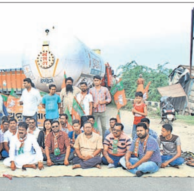
ହୁକୁରିସିଂହାଠାରେ ଭାଙ୍ଗିବା ନେତା, କର୍ମୀ ରାସ୍ତାରେ ବସି ବିକ୍ଷୋଭ ପ୍ରଦର୍ଶନ କରୁଛନ୍ତି ।