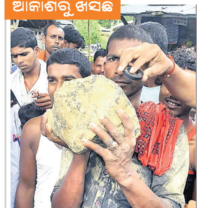
ଆକାଶରୁ ଏକ ୧୦ କେ.ଜି.ରୁ ଊର୍ଦ୍ଧ୍ୱ ଓଜନର ରୂପକାୟ ଧାରୁ ଖସି ବିହାରର ମଧୁବନ ଜିଲ୍ଲା ମହାଦେବ ଗ୍ରାମରେ ପଡ଼ିଛି। ଏହାକୁ ଜଣେ ଗ୍ରାମବାସୀ ଧରିଛନ୍ତି।