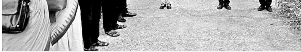
ଆଠଗଡ଼ ବ୍ଲକ ଯୋଗସାହିତ ମାଧ୍ୟମ ସାମାଜିକସ୍ୱାସ୍ଥ୍ୟ ବିଦ୍ୟାଳୟରେ ଫାଇଲେରିଆ ସଚେତନତା ନେଇ ଶପଥପାଠ କରାଯାଇଛି।

ସମ୍ପୂର୍ଣ୍ଣ ଆବର୍ତ୍ତନା ସ୍କୁଲ ହତାକୁ ପ୍ରବେଶ କରୁଛି। ସେହିପରି ଶିକ୍ଷାଧୀକ ଯାଇକେଲ ଷ୍ଟାଣ୍ଡ ମଧ୍ୟ ଆବର୍ତ୍ତନା ଜଳରେ ଭରି ହୋଇ ରହିଛି। ଏନେଇ ବିଦ୍ୟାଳୟ ପ୍ରଧାନଶିକ୍ଷକ ବାଉଁଶର ଠିକା ସମ୍ପ୍ରା ଅଧିକାରୀଙ୍କଠାରୁ ଆରମ୍ଭ କରି ବିଭାଗୀୟ ଅଧିକାରୀଙ୍କୁ ଅବଗତ କରାଯାଇଥିଲେ ମଧ୍ୟ ଅବ୍ୟବସ୍ଥା କୌଣସି ସୁଫଳ ମିଳିପାରି ନ ଥିବା ଅଭିଯୋଗ କରିଛନ୍ତି। ଉକ୍ତ ବିଦ୍ୟାଳୟରେ ଚଳିତ ଶିକ୍ଷା ବର୍ଷରେ ନବମ ଓ ଦଶମ ଶ୍ରେଣୀରେ ମୋଟ ୧୯୬ ଶିକ୍ଷାର୍ଥୀ ଅଧ୍ୟୟନରେ ଅଛନ୍ତି। ତେଣୁ ସେମାନଙ୍କୁ ବିପଦ ପୂର୍ଣ୍ଣ ମୁହୂର୍ତ୍ତରେ ଡ୍ରେନ୍ରୁ ସୁରକ୍ଷା ଦେବା ପାଇଁ ଶିକ୍ଷକମାନେ ଫାଟକଠାରେ ଶିକ୍ଷାଧୀକ ଯାଚାଯାତ ସମୟରେ ଜରି ରଖିଛନ୍ତି। ଏହାର ସମାଧାନ ଦିଗରେ ସ୍ଥାନୀୟ ଓ ଜିଲ୍ଲା ପ୍ରଶାସନ ଦୃଷ୍ଟିଦେବାକୁ ଶିକ୍ଷକ ଅଭିଭାବକ ଓ ଛାତ୍ରାଛାତ୍ରୀ ଦାବି କରିଛନ୍ତି।