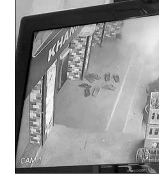
ସିସିଟିଭି ଫୁଟେଜରେ କ-ଏବ ହୋଇଥିବା ବୋମାମାଡ଼ ସମୟର ଦୃଶ୍ୟ। ବୋମାମାଡ଼ରେ କ୍ଷତିଗ୍ରସ୍ତ କାଢ଼।