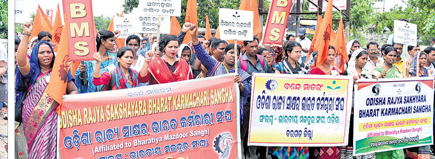
ଶିକ୍ଷା ପ୍ରତି ଅବହେଳା ପ୍ରତିବାଦ ସହ ବିଭିନ୍ନ ଦାବି ନେଇ ଓଡ଼ିଶା ରାଜ୍ୟ ସାକ୍ଷର ଭାରତ କର୍ମଚାରୀ ସଂଘର ଜିଲ୍ଲା କମିଟିଗୁଡ଼ିକ ପକ୍ଷରୁ ବୁଧବାର ଭୁବନେଶ୍ୱର ଲୋଘର ପିଏମ୍‌ଜିଠାରେ ବାହାରିଥିବା ବିକ୍ଷୋଭ ଶୋଭାଯାତ୍ରା।