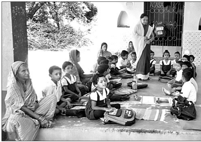
ମନ୍ଦିର ପିଣ୍ଡାରେ ଛାତ୍ରାଛାତ୍ରୀ ପାଠ ପଢ଼ୁଛନ୍ତି।