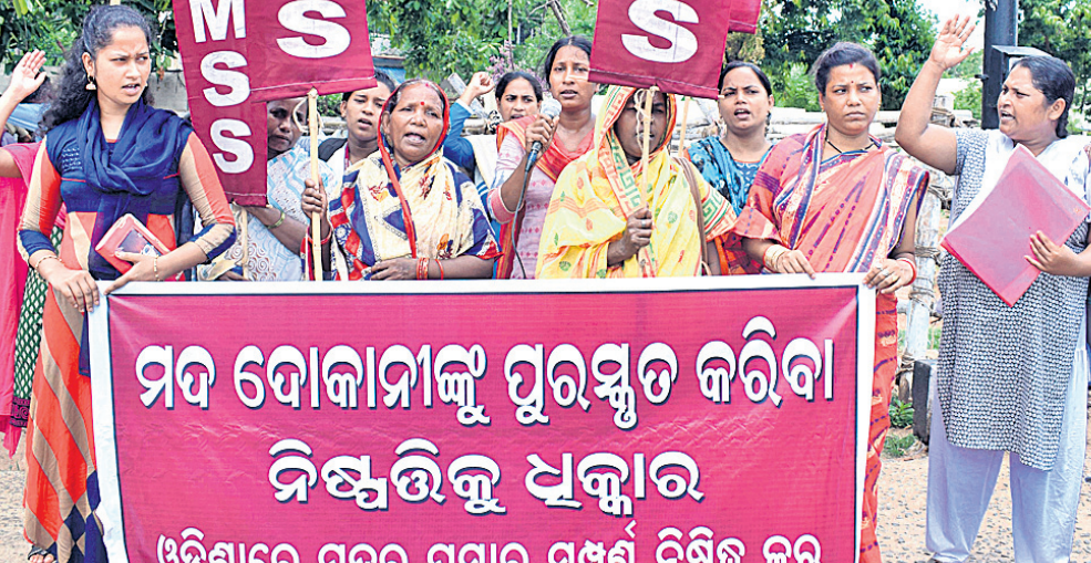
ମତ ଦୋଳାନାକୁ ପୁରସ୍କୃତ କରିବା ନିଷ୍ପତ୍ତିକୁ ବିରୋଧ କରି ବୁଧବାର ଭୁବନେଶ୍ୱର ଲୋଘର ପିଏମ୍‌ଜିଠାରେ ଅଲ୍ ଇଣ୍ଡିଆ ମହିଳା ସାଂସ୍କୃତିକ ସଂଗଠନର କର୍ମକର୍ତ୍ତାମାନେ ବିକ୍ଷୋଭ ପ୍ରଦର୍ଶନ କରୁଛନ୍ତି।