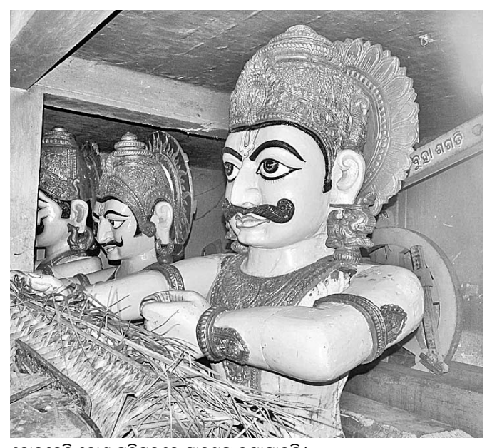
ଦୋଳବେଦି କୋଣ ପରିସରରେ ସାରଥୀଙ୍କୁ ରଖାଯାଇଛି।

ନବଦିନାମ୍ବକ ଘୋଷଯାତ୍ରା ପରେ ଚତୁର୍ଦ୍ଧାଦିଗ୍ରହ ଏବେ ରତ୍ନସିଂହାସନରେ। ଏଥିସହିତ ତିନିରଥରୁ ଓହ୍ଲାଇଛନ୍ତି ସାରଥୀ, ଅଶ୍ୱ ଓ ପାର୍ଶ୍ୱ ଦେବଦେବୀ।