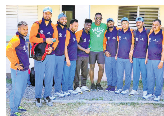
ଭାରତୀୟ ଦୃଷ୍ଟିହୀନ କ୍ରିକେଟରଙ୍କ ଗହଣରେ ଶେଲଡନ କଟ୍ରେଲି (ମଝି)।

କାମାଜକା, ୨୪୧୭(ପି.ଟି.): ପହଞ୍ଚିବା ପରେ କଟ୍ରେଲି ବିଶ୍ୱବିଜୟୀ ଭାରତୀୟ ଦୃଷ୍ଟିହୀନ କ୍ରିକେଟ୍ ଦଳକୁ ସ୍ୱାଗତ କରିଥିଲେ। ଏହି ପରିପ୍ରେକ୍ଷାରେ କାମାଜକା ଗସ୍ତରେ ରହିଛି। ଏଠାରେ କଟ୍ରେଲି ନିଜ ରୁଚ୍ଛରେ ପେକ୍ରେ ଭାରତୀୟ ଦଳ କାମାଜକା ସହ ଖାଟି ପହଞ୍ଚିବା ପରେ କଟ୍ରେଲି ବିଶ୍ୱବିଜୟୀ ଭାରତୀୟ ଦୃଷ୍ଟିହୀନ କ୍ରିକେଟ୍ ଦଳକୁ ସ୍ୱାଗତ କରିଥିଲେ। ଏହି ପରିପ୍ରେକ୍ଷାରେ କାମାଜକା ଗସ୍ତରେ ରହିଛି। ଏଠାରେ କଟ୍ରେଲି ନିଜ ରୁଚ୍ଛରେ ପେକ୍ରେ ଭାରତୀୟ ଦଳ କାମାଜକା ସହ ଖାଟି