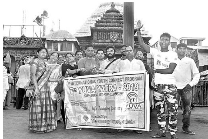
ସିଂହଦ୍ୱାର ସମ୍ବନ୍ଧୀୟ ଅନ୍ତରାଷ୍ଟ୍ରୀୟ ଯୁବଯାତ୍ରାର ଶୁଭାରମ୍ଭ କରାଯାଇଛି।

ଆୟିଲି ଗ୍ରାମର ଏକ ପୋଖରୀରୁ ମାଛ ଚୋରି ଅଭିଯୋଗରେ କୋଣାର୍କ ଥାନା ପୋଲିସ ବୁଧବାର ୨ ଜଣ ଅଭିଯୁକ୍ତଙ୍କୁ ଗିରଫ କରି କୋର୍ଟ ଚାଲାଣ କରିଥିଲା।