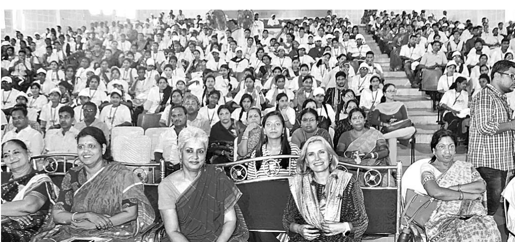
ପୁରୀ ଗାଜନହଲ ପରିସରରେ କୁଧିବାର ଆୟୋଜିତ କାର୍ଯ୍ୟକ୍ରମରେ ଅତିଥି, ଆୟୋଜକ ସଙ୍ଗରେ କର୍ମକର୍ତ୍ତା ଏବଂ ପିଲାମାନେ।

ବାତ୍ୟାରେ ପୁରୀ ଜିଲାରେ ୨,୭୮,୭୬୨ଟି ବାସଗୃହ ଭାଙ୍ଗିଥିଲା। ତନ୍ମଧ୍ୟରୁ ୬୪୪ଟି ପକାଇ, ୮,୯୮୫ଟି କକାଘର ସମ୍ପୂର୍ଣ୍ଣ ଭାଙ୍ଗିଥିବାବେଳେ ୬,୯୨୨ଟି ପକାଇ ଓ ୯୮,୫୮୮ କକାଘର ଅତ୍ୟଧିକ କ୍ଷତିଗ୍ରସ୍ତ ହୋଇଥିଲା।