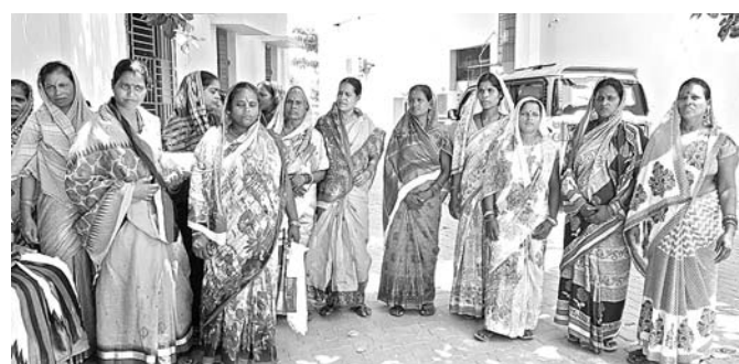
ଜିଲାପାଳଙ୍କୁ ଅଭିଯୋଗ ଜଣାଇବାକୁ ଆସିଥିବା ମହିଳାମାନେ।

ଉଲ୍ଲେଖ ହୋଇଛି ଯେ, ବାତ୍ୟା ପରଠାରୁ ସିପକୂବା ବନମାଳାପୁର ପାଟଣା ଗାଁକୁ ବିଦ୍ୟୁତ୍ ସଂଯୋଗ ହୋଇପାରିନାହିଁ।