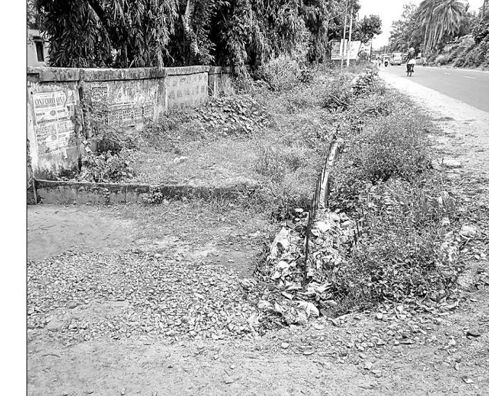
ହାଇସ୍କୁଲ ମୁଖ୍ୟ ଫାଟକ ସମ୍ମୁଖରେ ଥିବା ଅର୍ଦ୍ଧନିର୍ମିତ ଡ୍ରେନ୍।