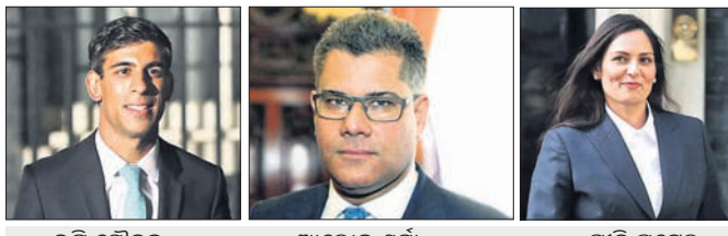
ରଷି ସୌନକ, ଆଲୋକ ଶର୍ମା, ପ୍ରୀତି ପଟେଲ

୧୦ ତାରିଖ ଷ୍ଟ୍ରିଟ୍‌ରେ କ୍ୟାବିନେଟ୍ ବୈଠକରେ ଯୋଗ ଦେଇଥିଲେ। ବୋରିସ୍ ବୁଧବାର ତାଙ୍କର ପ୍ରଥମ ବହୁତାରେ କହିଥିଲେ, 'ଆମେ ଆମ ବଂଶୋଦ୍ଭବଙ୍କୁ ନିଜ ମନ୍ତ୍ରିମଣ୍ଡଳରେ ସାମିଲ କରିଛୁ। ରାଶା ଏଲିଜାବେଥ୍ ଦ୍ୱିତୀୟଙ୍କ ଦ୍ୱାରା ବୋରିସ୍ ଟ୍ରିଟ୍‌ସେନ୍ ନୂଆ ପ୍ରଧାନମନ୍ତ୍ରୀ ଭାବେ ନିଯୁକ୍ତି ପାଇବାର କିଛି ଘଣ୍ଟା ପରେ ସେ ପ୍ରୀତି ପଟେଲଙ୍କୁ ସ୍ୱରାଷ୍ଟ୍ର ସଚିବ, ଆଲୋକ ଶର୍ମାଙ୍କୁ ଅନ୍ତର୍ଜାତୀୟ ଉନ୍ନୟନ ସଚିବ ଏବଂ ରଷି ସୌନକଙ୍କୁ ଟ୍ରେଡିଙ୍ଗ୍ ମୁଖ୍ୟ ସଚିବ ଭାବେ ନିଯୁକ୍ତି ଦେଇଛନ୍ତି। ସେମାନେ ଗୁରୁବାର ପୂର୍ବାହ୍ନରେ