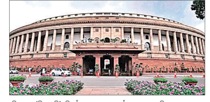
କମିଶନର (ସିଆଇସି) ନିର୍ଦ୍ଦେଶ ଦେବା ପରେ ସରକାର ପ୍ରତିଶୋଧପରାୟଣ ହୋଇପଡ଼ିଛନ୍ତି। ସିଆଇସିକୁ କ୍ଷମତାହୀନ କରିଦେବା ବିଲ୍‌ର ପ୍ରକୃତ ଉଦ୍ଦେଶ୍ୟ ବୋଲି