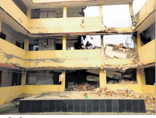
ଭୁଣ୍ଡୁଡି ପଡିଥିବା କୋଠା।

ବ୍ରହ୍ମପୁର ବିଶ୍ୱବିଦ୍ୟାଳୟରେ ଗୁରୁବାର ଅପରାହ୍ଣରେ ଘଟିଛି ଏକ ବଡ଼ ଦୁର୍ଘଟଣା। ବିଶ୍ୱବିଦ୍ୟାଳୟ କ୍ୟାମ୍ପସ୍ ପରିସରସ୍ଥ ସାବେରୀ ଛାତ୍ରାନ୍ତରାସର ୩ ମହଲା ବିଶିଷ୍ଟ କୋଠାର ଏକ ଅଂଶ ଭୁଣ୍ଡୁଡି ପଡିଛି। ଯେଉଁଠି ଶୈତାଳୟ ଥିଲା। ମଧ୍ୟାହ୍ନରେ ଛାତ୍ରାନ୍ତରାସର ସମସ୍ତ ଛାତ୍ରା କ୍ଲବ କରିବା ପାଇଁ ଚାଲି ଯାଇଥିବା ବେଳେ ଏଭଳି ଘଟଣା ଘଟିଥିବା ଜଣାପଡିଛି। ଫଳରେ ଏକ ବଡ଼ ଦୁର୍ଘଟଣାରୁ ଛାତ୍ରାନ୍ତରାସର ସମସ୍ତ ଅନ୍ତରାସୀ ବର୍ତ୍ତିଯାଇଛନ୍ତି। ଜଣେ ପ୍ରତ୍ୟକ୍ଷଦର୍ଶୀ ଛାତ୍ରା ନାମ ଗୋପନ ରଖିବା ସର୍ତ୍ତରେ କହିଛନ୍ତି, ମଧ୍ୟାହ୍ନରେ ଛାତ୍ରାନ୍ତରାସର ସମସ୍ତ ଛାତ୍ରା କ୍ଲବ କରିବାକୁ ଯାଇଥିଲେ। କିନ୍ତୁ କେତେକ ଛାତ୍ରା ହଷ୍ଟେଲରେ ଥିଲେ। ଅପରାହ୍ଣ ପ୍ରାୟ ୧ ଟା ବେଳେ ରସାୟନ ବିଜ୍ଞାନ ବିଭାଗର ଜଣେ ଛାତ୍ରା ଶୈତାଳୟକୁ ଯାଇଥିବା ବେଳେ ଏକ ଉଚ୍ଚ ଶବ୍ଦ ଶୁଣି ବାହାରକୁ ଚାଲି ଆସିଥିଲେ।