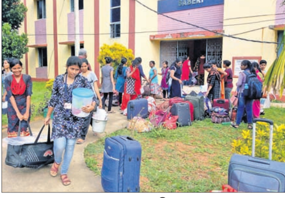
ଛାତ୍ରାମାନଙ୍କୁ ଅନ୍ୟତ୍ର ସ୍ଥାନାନ୍ତର କରାଯାଇଛି।

ଏହାର କିଛିକ୍ଷଣ ମଧ୍ୟରେ ୩ ମହଲା ବିଶିଷ୍ଟ ଶୈତାଳୟ କୋଠାଟି ଭୁଣ୍ଡୁଡି ପଡିଥିବା ଦେଖିଥିଲେ। ତେବେ ଏହାପୂର୍ବରୁ ଅନେକ ସମୟରେ ଶୈତାଳୟ ଛାତ୍ରୁ ପାଣି ଗଲିବା ସହ ପଲସ୍ତରା ଖସୁଥିବା ନେଇ ସେମାନେ କର୍ତ୍ତୃପକ୍ଷଙ୍କ ନିକଟରେ ଅଭିଯୋଗ କରିଥିଲେ। ଖରାକୁଟିରେ ଛାତ୍ରାନ୍ତରାସ ମରାମତି କାର୍ଯ୍ୟ କରିବାକୁ କର୍ତ୍ତୃପକ୍ଷ ପ୍ରତିଶ୍ରୁତି ଦେଇଥିଲେ। କିନ୍ତୁ ଖରାକୁଟିରେ ଅନ୍ୟ କେତେକ କୋଠାଗୁଡ଼ିକର ମରାମତି କରାଯାଇଥିବା ବେଳେ ଶୈତାଳୟ କୋଠା କାମ ହୋଇ ନ ଥିବା ଛାତ୍ରାମାନେ କହିଛନ୍ତି। ଗୁରୁବାର ସକାଳେ ମଧ୍ୟ ଶୈତାଳୟ ଛାତ୍ରୁ ପଲସ୍ତରା ଖସୁଥିବା ନେଇ କର୍ତ୍ତୃପକ୍ଷଙ୍କୁ ଅବଗତ କରାଯାଇଥିବା କେତେକଟି