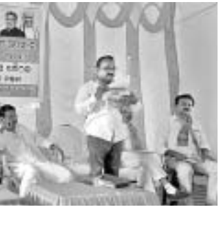
ମହାସାଧନ ନେତାମାନେ ।

ସଦସ୍ୟତା ଅଭିଯାନ ବୈଠକ ପରିଚାଳନା କରିଥିଲେ । ବାଲିଗୁଡ଼ା ନଗର, ବରଖାମା, ପ୍ରଭାତୀ, ସହ ପ୍ରଭାତୀଙ୍କ ସମେତ କର୍ମୀମାନେ ଏଥିରେ ଯୋଗ ଦେଇଥିଲେ ।