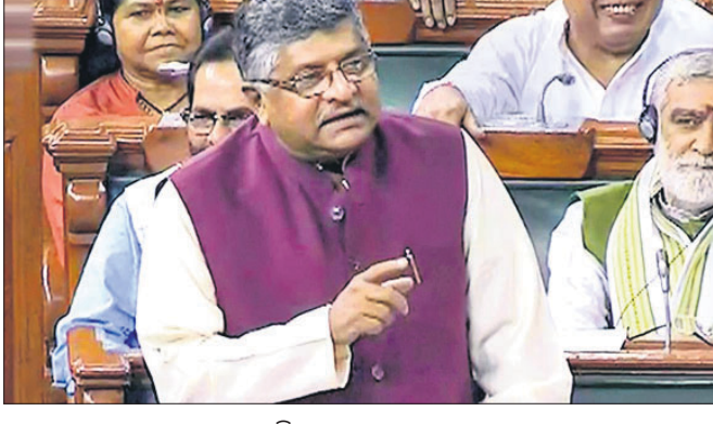
ଲୋକ ସଭାରେ ଆଇନମନ୍ତ୍ରୀ ରବିଶଙ୍କର ପ୍ରସାଦ