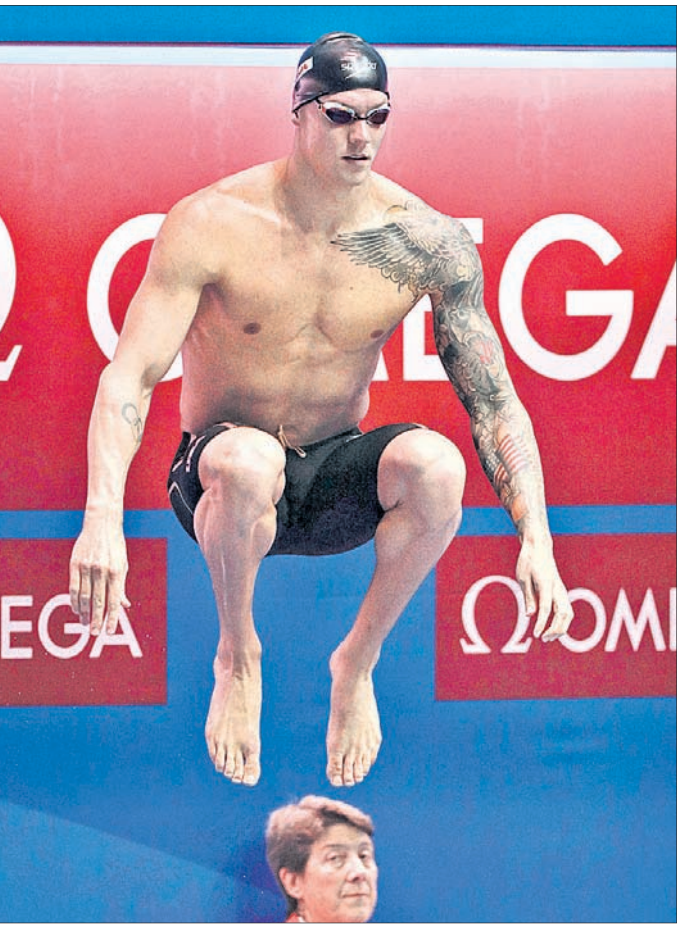
ପୁରୁଷ ୧୦୦ ମିଟର ବଟରଫ୍ଲାଇଂ ସ୍ପିନ୍ନିଂ ଅବସରରେ କାଲେବ ଡ୍ରେସେଲ ।

ଘାଜକ୍ସ (ଦକ୍ଷିଣ କୋରିଆ), ୨୬/୭ (ଏସପି) କାଲେବ ଡ୍ରେସେଲ ପୁରୁଷ ୧୦୦ ମିଟର ବଟରଫ୍ଲାଏ ସ୍ପିନ୍ନିଂରେ ନୂଆ ବିଶ୍ୱ ରେକର୍ଡ୍ କରିଛନ୍ତି। ଏଠାରେ ତାଲିକା ଦିଶୁଛି ଚମ୍ପିୟନ ଡ୍ରେସେଲ ୪୯.୫୦ ସେକେଣ୍ଡ ଗାଜକ୍ସରେ ରେସ୍ ଶେଷ କରିଥିଲେ। ରୋମ୍‌ଠାରେ ଅନୁଷ୍ଠିତ ୨୦୧୯ ବିଶ୍ୱ ଚମ୍ପିୟନଶିପ୍ରେ ଆମେରିକୀୟ କିମ୍ବଦନ୍ତୀ ଫୋଲ୍ଡିଙ୍ଗ୍ ଯେଉଁ ଗାଜକ୍ସରେ ବିଶ୍ୱରେକର୍ଡ୍ ଅଧିକାରୀ ହୋଇଥିଲେ, ତାଙ୍କଠାରୁ ୦.୩୨ ଗାଜକ୍ସ କମ୍ ସମୟରେ ସେ ରେସ୍ ଶେଷ କରିଥିଲେ। ୨୦୧୭ ବିଶ୍ୱ ଚମ୍ପିୟନଶିପ୍ରେ ୭ ସର୍ବ ପଦକ ଜିତିଥିବା ଡ୍ରେସେଲ ଚଳିତ ସପ୍ତାହରେ ଦକ୍ଷିଣ କୋରିଆରେ ଏହାଠାରୁ ଅଧିକ ସର୍ବ ପଦକ ଜିତିବା ଲକ୍ଷ୍ୟରେ ରହିଛନ୍ତି। ସୁନାମୋଗ୍ୟ, ଏହି ସପ୍ତାହରେ ବଟର ଫ୍ଲାଇଂରେ ଫୋଲ୍ଡିଙ୍ଗ୍ ନାମରେ ଥିବା ଦୁଇଟି ରେକର୍ଡ୍ ଭଙ୍ଗ ହୋଇଛି। ପୂର୍ବରୁ ୨୦୦୯ରେ ହଙ୍ଗେରୀର ଡ୍ରେସେଲ ଫୋଲ୍ଡିଙ୍ଗ୍ ଦ୍ୱାରା ୨୦୦୯ରେ ୨୦୦ମିଟର ବଟର ଫ୍ଲାଇଂରେ ପ୍ରତିଷ୍ଠିତ ବିଶ୍ୱ ରେକର୍ଡ୍ ଭଙ୍ଗ କରିସାରିଥିଲେ।