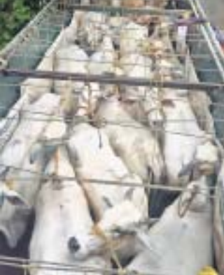
ଜବତ ଗୋରୁ ବୋହେଇ ଟ୍ରକ ।