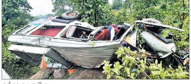
ଦୁର୍ଘଟଣାଗ୍ରସ୍ତ ଗାଡ଼ି ।

ବାଲିଗିପୋଷି, ୨୭।୭।(ବି.ଏନ୍.ଏ.) ମୟୂରଭଞ୍ଜ ଜିଲ୍ଲା ଦେଇ ଯାଇଥିବା ୪୯ ନମ୍ବର ଜାତୀୟ ରାଜପଥର ବାଲିଗିପୋଷି ନିକଟ ଦ୍ୱାରଶୁଣୀ ଘାଟିରେ ଶୁକ୍ରବାର ଦିନେ ଚଳିଥିବା ଏକ ମର୍ତ୍ତ୍ୟୁ ସହକାରୀ ଦୁର୍ଘଟଣା ଘଟିଛି। ୧୦ ଜଣ ବୋଲେରୋ ଭିତରେ ଯାଉଥିବା ଏକ ବୋଲେରୋ ସହ ଅପରପାଖକୁ ଆସୁଥିବା ଟ୍ରକ୍ ଦୁର୍ଘଟଣାରେ ଜନସମ୍ପର୍କ ଅଧିକାରୀ ସୂଚନା ଦେଇଛନ୍ତି। ସେହିପରି ୫ ଦିନ ଚାପି ନେଇ ଭାଙ୍ଗି ପକ୍ଷରୁ ଖଣିର ଅଭାବନା ଜାରି ରହିଥିବାରୁ ତାଳଚେର କୋଲ ଫିଲଡ୍‌ସରେ ଥିବା ସମସ୍ତ ଖଣିରୁ କୋଇଲା ଉତ୍ତୋଳନ, ପରିବହନ ବନ୍ଦ ରହିଛି।