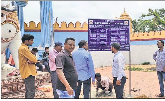
ବାରିମୂଳ ଆଶ୍ରମର ମୁଖ୍ୟ ଗେଟ ନିକଟରେ ନୋଟିସ ବୋର୍ଡ ଲଗାଯାଇଛି।