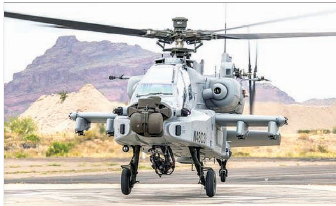
ନୂଆଦିଲ୍ଲୀ, ୨୭/୭/୧୯ (ପି.ଟି.)

ଭାଙ୍ଗିବା ନେତୃତ୍ୱାଧୀନ ଏକତ୍ର ସରକାର କଶ୍ମୀରକୁ ଧାରା ୩୭୦ ଏବଂ ୩୫୩ ଉଚ୍ଛେଦ କରିପାରେ ବୋଲି ଆଶଙ୍କା ପ୍ରକାଶ ପାଇଛି। ସମ୍ପାଦନ ଧାରା ୩୭୦ କଶ୍ମୀରକୁ ସ୍ୱୟଂଶାସନ ମାନ୍ୟତା ପ୍ରଦାନ କରିଥିବାବେଳେ ଧାରା ୩୫୩ ସେଠାକାର ସ୍ଥାୟୀ ବାସିନ୍ଦାଙ୍କୁ ସ୍ୱତନ୍ତ୍ର ସୁବିଧା ସୁଯୋଗ ଯୋଗାଇଦେଇଛି। ରାଜ୍ୟରେ ବର୍ତ୍ତମାନ ଅତ୍ୟଧିକ ସୁରକ୍ଷା ବଳ ନିୟୋଜିତ ଥିବାବେଳେ ଏହାକୁ ପ୍ରତ୍ୟାହାର ନ କରି ପୁଣି ୧୦ ହଜାର ଯବାନଙ୍କୁ ପଠାଇବା ପଛରେ କେନ୍ଦ୍ରର ଉଦ୍ଦେଶ୍ୟ କୁଖ୍ୟାପନା ହେବ ବୋଲି ସୁନିୟମ କର୍ମଚାରୀଙ୍କୁ ଅଧିକ ନିରୁତ୍ସାହିତା ଉପାର ପାଠକୁ କହିଛନ୍ତି।