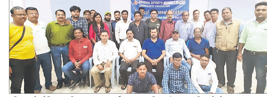
ଓଡ଼ିଶା ସ୍କୋର୍ସ୍ ଜର୍ନାଲିଷ୍ଟ ଆସୋସିଏଶନ (ଓସଜା)ର ବାର୍ଷିକ ସାଧାରଣ ପରିଷଦ ବୈଠକରେ ଉପସ୍ଥିତ କର୍ମକର୍ତ୍ତା।

ଏଠାରେ ଚାଲିଥିବା ୧୯ ବର୍ଷରୁ କମ୍ ଡ୍ରି-ରାଷ୍ଟ୍ରୀୟ କ୍ରିକେଟ୍ ଚୁର୍ଣ୍ଣମେଷ୍ଟରେ ଶନିବାର ଭାରତ ଓ ବାଂଲାଦେଶ ଯୁଥ୍ ଦଳ ମଧ୍ୟରେ ଅନୁଷ୍ଠିତ ମ୍ୟାଚ୍ ବର୍ଷା ଯୋଗୁ ବାତିଲ ହୋଇଯାଇଛି। ପ୍ରବଳ ବର୍ଷା କାରଣରୁ ମ୍ୟାଚ୍ରେ ଚନ୍ଦ୍ର ପଡ଼ିବା ସମ୍ଭବପରି ହୋଇ ନ ଥିଲା। ଫଳରେ ଉଭୟ ଦଳ ଏକ ପଦକ୍ ଲେଖାଏ ପାଇଥିଲେ। ଫଳରେ ଭାରତୀୟ ଯୁବ ଦଳ ୪ ମ୍ୟାଚ୍ରେ ୨ ବିଜୟ, ଗୋଟିଏ ପରାଜୟ ଓ ଗୋଟିଏ ବିନା ଫଳାଫଳ ସହ ୫ ପଦକ୍ ପାଇ ଚେଷ୍ଟା ଶୀର୍ଷରେ ରହିଛି। ବାଂଲାଦେଶ (୩) ଓ ଆୟୋଜକ ଲଂଲଣ୍ଡ (୨) ଯଥାକ୍ରମେ ୨ୟ ଓ ୩ୟ ସ୍ଥାନରେ ରହିଛନ୍ତି।