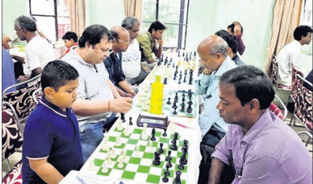
ଉମେଶ ମେମୋରିଆଲ୍ ଚେସ୍ ଦ୍ଵିତୀୟ ଦିନ ଖେଳ ଅବସରରେ ପ୍ରତିଯୋଗୀମାନେ।

କରାଚୀ, ୨୮/୭: ନିକଟରେ ଚେଷ୍ଟା କ୍ରିକେଟରୁ ଅବସର ନେଇଥିବା ବାମହାତୀ ଯେତେବେଳେ ଅମିର ଏବେ ଦ୍ଵିତୀୟ ସ୍ତରୀୟ ବାସିନ୍ଦା ହେବା ପାଇଁ ଉଦ୍ୟମ କରୁଛନ୍ତି। ସୁଦୂର ଜଣାପଡ଼ିଛି। ଅମିର ୨୦୧୬ ସେପ୍ଟେମ୍ବରରେ ଜଣେ ଦ୍ଵିତୀୟ ମହିଳାଙ୍କୁ ବିବାହ କରିଥିଲେ। ଫଳରେ ସେ ପତିଙ୍କ ଭିତା ଲାଗି ଯୋଗ୍ୟ ହୋଇଛନ୍ତି। ଏହି ଭିତା ତାଙ୍କୁ ଲଂଲଣ୍ଡରେ ୩୦ ମାସ ରହିବାକୁ ଅନୁମତି ଦେଇଛି। ଏହି ସମୟରେ ସେ ଲଂଲଣ୍ଡର ନାଗରିକତା ଭଳି ସମସ୍ତ ଅଧିକାର ଫାଳିବା ଉପାଦାନ ପାରିବେ। ତେବେ ସେ ଲଂଲଣ୍ଡରେ ଏକ ଘର କିଣିବାକୁ ଚାହୁଁଛନ୍ତି। ୨୭ ବର୍ଷୀୟ ବୋଲରଙ୍କ ନିକଟରେ ବହୁତ କ୍ରିକେଟ ବାଜି ଅଛି। ଏବେଠାରୁ ଲଂଲଣ୍ଡରେ ସ୍ଥାୟିତ୍ଵ ପାଇଁ ଉଦ୍ୟମ କରିବା ପ୍ରଶଂସକଙ୍କୁ ଚକିତ କରି ଦେଇଛି। ସେ ନିୟମିତ ବ୍ୟବସାୟରେ ଲଂଲଣ୍ଡ ଯାଆନ୍ତି। ଗତବର୍ଷଠାରୁ ସେଠାରେ କାଉଣ୍ଟି କ୍ରିକେଟ ମଧ୍ୟ ଖେଳୁଛନ୍ତି। ଅମିର ଚାହାନ୍ତି କ୍ରିକେଟର ଲକ୍ଷ୍ୟ ଫର୍ମାଟରୁ ସମସ୍ୟା ସୂଚାଏ। ଏହାପରେ ଶୋଏବ ଅଖତର, ଖୁସିମ ଆକ୍ରମ, ଖୁସିମ ସୁନିସ, ରମିଜ ରାଜକ ଭଳି ବହୁ ପୂର୍ବତନ କ୍ରିକେଟର ତାଙ୍କୁ ସମାଲୋଚନା କରିଥିଲେ।