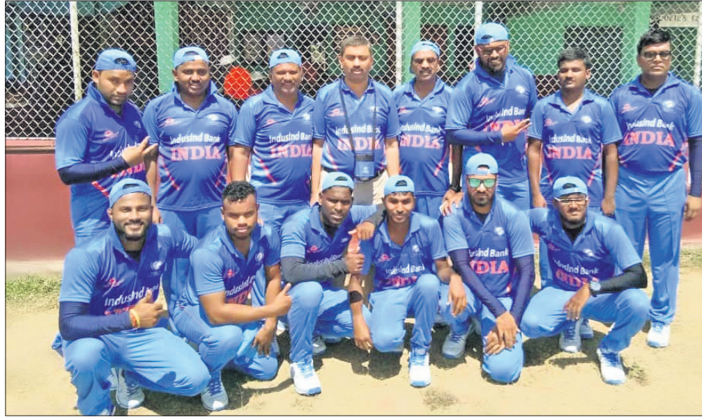
ବିଜୟ ହାସଲ ପରେ ଖୁସି ମନାଉଛନ୍ତି ଭାରତୀୟ ଦୃଷ୍ଟିହୀନ କ୍ରିକେଟ ଦଳର ଖେଳାଳିମାନେ।