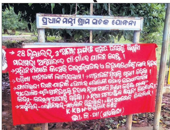
ଫିରିଙ୍ଗିଆ ବୁକ୍ ଅଞ୍ଚଳରେ ମାଓବାଦୀଙ୍କ ପକ୍ଷରୁ ଲଗାଯାଇଥିବା ପୋଷ୍ଟର।

ମାଓବାଦୀଙ୍କ ଶହୀଦ ସପ୍ତାହ ରବିବାରଠାରୁ ଆରମ୍ଭ ହୋଇଛି। ଏଥିପାଇଁ କକ୍ଷମାଳ ଜିଲ୍ଲାରେ ଭୟର ବାତାବରଣ ସୃଷ୍ଟି ହୋଇଛି। ମାଓବାଦୀଙ୍କ ଶହୀଦ ସପ୍ତାହ ପାଳନକୁ ନେଇ ସୁରକ୍ଷା ଦୃଷ୍ଟିରୁ ଓଏସଆରଟିଭି(ଓଡିଶା ସଡ଼କ ପରିବହନ ନିଗମ) ପକ୍ଷରୁ କକ୍ଷମାଳରେ ଯାତାୟତ କରୁଥିବା ବସ୍ ବୁଡ଼ିକୁ ଅଟକାଇ ଗାଡ଼ି ଯାତାୟତ ବନ୍ଦ କରି ଦିଆଯାଇଛି। ପୋଲିସ ପ୍ରଶାସନ ପକ୍ଷରୁ ବ୍ୟାପକ ସୁରକ୍ଷା ବ୍ୟବସ୍ଥା ଗ୍ରହଣ କରାଯାଇଛି। ଦାରିଜବାଡ଼ିଠାରୁ ଉତ୍ତରାଞ୍ଚଳ, ବ୍ରାହ୍ମଗାଁ, କାଟିଙ୍ଗିଆ, ହାଡ଼ିମୁଣ୍ଡାଠାରୁ ଫୁଲବାଣୀକୁ ବସ ଚଳାଚଳ ବନ୍ଦ ରହିଛି। ସେହିପରି ବାଲିଗୁଡ଼ା ଦେଇ ଯାଉଥିବା ସମସ୍ତ ସରକାରୀ ବସ ଚଳାଚଳ ବନ୍ଦ ରହିଛି। ବାଲିଗୁଡ଼ା ଦେଇ ଯାଉଥିବା ଫୁଲବାଣୀକୁ ବେଲପୁର, ଲକ୍ଷ୍ମୀଗାଁ, ଲକ୍ଷ୍ମୀଗଡ଼, ଜୟପୁର ଓ ଭୁବନେଶ୍ୱରଠାରୁ ଭବାନୀ ପାଟଣା, କୋରାପୁଟ ସୁନାବେତା ଯାଉଥିବା ମାଓବାଦୀମାନେ ମାଓବାଦୀମାନେ