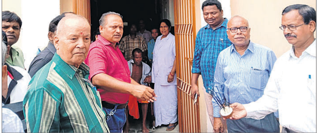
ବାର୍ଦ୍ଧକ୍ୟ ଅନ୍ତଃବିଭାଗ ସମ୍ମୁଖରେ ମେଡିକାଲ କର୍ତ୍ତୃପକ୍ଷ।