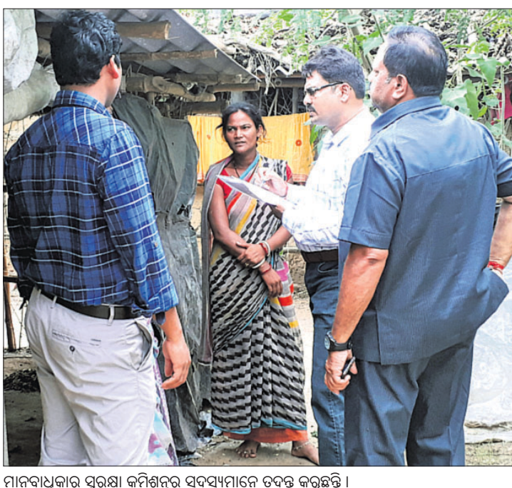
ମାନବାଧିକାର ସୁରକ୍ଷା କମିଶନ୍‌ର ସଦସ୍ୟମାନେ ତଦନ୍ତ କରୁଛନ୍ତି।