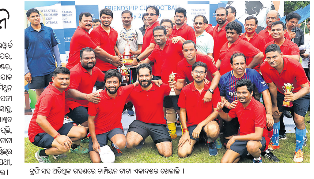
ଚୁପ୍ଟି ସହ ଅତିଥିକ୍ ଗହଣରେ ଚାମ୍ପିୟନ ଚାଟା ଏକାଦଶର ଖେଳାଳି।