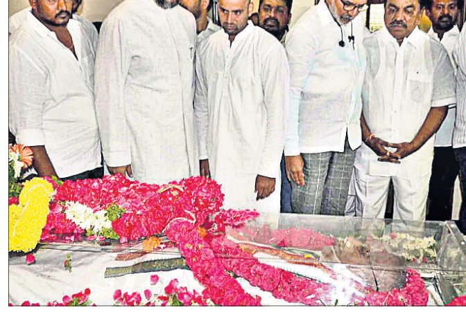
ହାଇଦ୍ରାବାଦରେ ଏସ୍. ଜୟପାଲ ରେଣ୍ଡାଙ୍କ ଶେଷଦର୍ଶନ କରୁଛନ୍ତି ଏଆଇଏମ୍ଏମ୍ ମୁଖ୍ୟ ଅସାଦୁଦ୍ଦିନ୍ ଓଡ଼ିଆଲି ଏବଂ ଅନ୍ୟମାନେ।

ବରିଷ୍ଠ କଂଗ୍ରେସ ନେତା ତଥା ପୂର୍ବତନ କେନ୍ଦ୍ରମନ୍ତ୍ରୀ ଏସ୍. ଜୟପାଲ ରେଣ୍ଡାଙ୍କ ପରଲୋକରେ ଦେଶର ରାଜନୀତିରେ ଏକ ଶୂନ୍ୟସ୍ଥାନ ସୃଷ୍ଟି ହୋଇଛି। ଜୟପାଲ ପୋଲିଓ ରୋଗରେ ଆକ୍ରାନ୍ତ ଥିଲେ ବି ରାଜନୈତିକ ଉଜ୍ଜ୍ୱଳତାରେ ଏହା ତାଙ୍କ ପାଇଁ ବାଧ୍ୟତା ହୋଇ ନ ଥିଲା। ବର୍ଷ ତାଙ୍କର ବାକି ପାଇଁ ମେଢ଼ିଆ ଶୂନ୍ୟସ୍ଥାନ ସୃଷ୍ଟି କରିଥିଲା। ସେ ୫ ଥର ଲୋକ ସଭା ଏବଂ ୨ ଥର ରାଜ୍ୟ ସଭାକୁ ନିର୍ବାଚିତ ହୋଇଥିଲେ। ସେ ମଧ୍ୟ ୪ ଥର ଜଗନ୍ନାଥରେ ରେଣ୍ଡା ପ୍ରମୁଖ ଶୋକବ୍ୟକ୍ତ କରିଛନ୍ତି। ଜୟପାଲ ଜଣେ ଖ୍ୟାତନାମା ରାଜନେତା ଓ ଶ୍ରେଷ୍ଠ ପାର୍ଲିମେଣ୍ଟରୀୟ ଥିଲେ ବୋଲି ରାଷ୍ଟ୍ରପତି ତାଙ୍କ ବାଣୀରେ କହିଛନ୍ତି। ସେ ଜଣେ ବିଚକ୍ଷଣ ବାଗ୍ମୀ ଓ ବିଜ୍ଞ ରାଜନେତା ଥିଲେ ବୋଲି ଉପରାଷ୍ଟ୍ରପତି ପାଟ୍ଟି ଶୋକବାଣୀରେ ଉଲ୍ଲେଖ କରିଛନ୍ତି। ପୂର୍ବତନ କେନ୍ଦ୍ରମନ୍ତ୍ରୀଙ୍କ ପରଲୋକରେ ପ୍ରଧାନମନ୍ତ୍ରୀ ଶୋକବ୍ୟକ୍ତ କରିବା ସହ ତାଙ୍କ ଶୋକସତ୍ରପ୍ତ ରାଜ୍ୟ ଗଠନରେ ତାଙ୍କର ପ୍ରମୁଖ