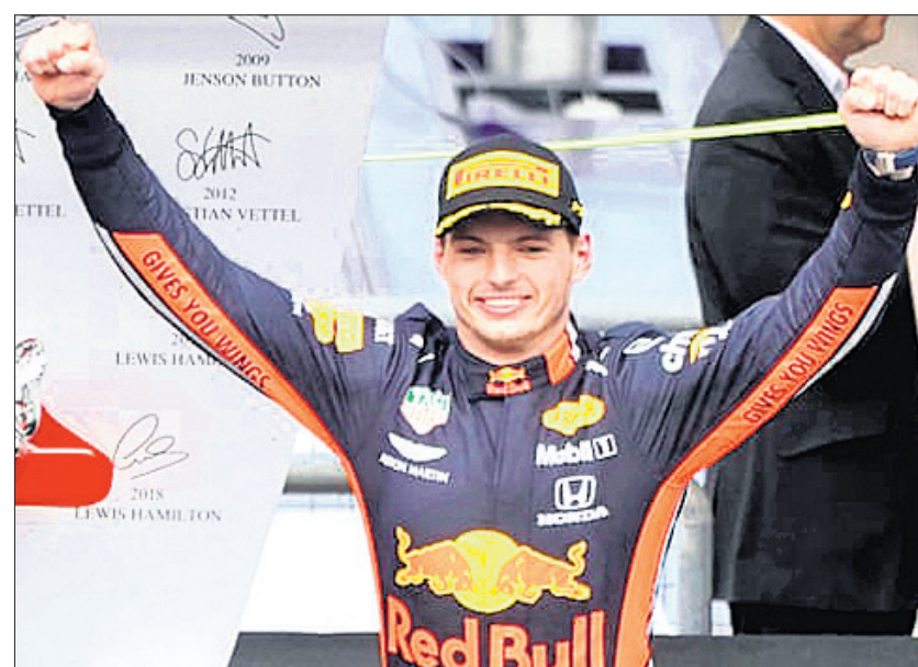
ଚାମ୍ପିୟନ ମାକ୍ ଭର୍ଷ୍ଟାପେନ ।

ହକେନହର୍ମ୍ (ଜର୍ମାନୀ), ୨୮୭ ରେଡ୍‌ବୁଲ୍ ମାକ୍ ଭର୍ଷ୍ଟାପେନ ଜର୍ମାନୀ ଫର୍ମୁଲାଓନ ମୋଟର ରେସ୍ ଗ୍ରାଣ୍ଡ୍ ଜିତିଛନ୍ତି। ଚଳିତ ସିଜନରେ ଏହା ହେଉଛି ତାଙ୍କର ଦ୍ୱିତୀୟ ଏବଂ କ୍ୟାରିୟରର ୭ମ ଚାଲଟଲ। ଏହି ୨୧ ବର୍ଷୀୟ ଡ୍ର ଡ୍ରାଇଭର ୪୫ର ବିଶ୍ୱ ଚାମ୍ପିୟନ ଫୋରାରିର ସେବାଷ୍ଟିଆନ ଭେଟେଲଙ୍କ ଆଗରେ ତାଙ୍କ ରେସ୍ ଶେଷ କରିଥିଲେ। ଭେଟେଲ ୨୦ତମ ତଥା ଅଧିକ ଗ୍ରାଣ୍ଡ୍ ରେସ୍ ଆରମ୍ଭ କରିଥିଲେ। ତାଙ୍କ କ୍ୟାଡ୍ ଟୁଟାୟ ହୋଇଥିଲେ। ଏହାଛଡା ତାଙ୍କ କ୍ୟାରିୟରର ଟୁଟାୟ ପୋଡିୟମ ଫିନିଶ। ମଝିରେ ମଝିରେ ବର୍ଷା ଯୋଗୁ ରେସ୍‌ଟି ଘଟଣାବହୁଳ ଥିଲା। ମସିହା ପାଲି ରବିବାର ଏକ ଖରାପ ଦିନ ଥିଲା। ଟିମ୍ ମୋଟର ସୋର୍ସ୍‌ରେ ଏହାର ୧୨୫ ବର୍ଷ ପୂର୍ଣ୍ଣ ସହ ଆଧୁନୀକ ଯୁଗରେ ୨୦୦ତମ ଫର୍ମୁଲା ଓନ ଉତ୍ସବ ପାଳନ କରୁଥିବାବେଳେ ଏଠାରେ ପ୍ରଦର୍ଶନ ନିରୋଖ୍ୟଜନକ ଥିଲା। ୫୫ର ଡିଫେଣ୍ଡିଂ ଚାମ୍ପିୟନ ଲୁଇସ୍ ହାମିଲଟନ ଏବଂ ତାଙ୍କ ଟିମ୍‌ମେଟ୍ ଭାଲ୍‌ରେରି ବୋକାସ୍ କୌଣସି ସ୍ପୋର କରିବାରେ ବିଫଳ ହୋଇଥିଲେ। ୬ ପିଲ୍‌ସ୍ ପରେ ହାମିଲଟନ ୧୧ତମ ସ୍ଥାନ ଅଧିକାର କରିଥିଲା। ଗତ ୨୩ଟି ରେସ୍ ମଧ୍ୟରେ ସେ ପ୍ରଥମ ଥର ପର୍ଯ୍ୟନ୍ତ ସ୍କୋର କରିବାରେ ବିଫଳ ହୋଇଛନ୍ତି। ରେସ୍ ପର୍ଯ୍ୟନ୍ତ ଲାମ୍ବୁ ଷ୍ଟୋଲ ଚତୁର୍ଥ ସ୍ଥାନ ଅଧିକାର କରିଥିଲେ। ତାଙ୍କ ଟିମ୍‌ର ଏହାହେଉଛି ଶ୍ରେଷ୍ଠ ପ୍ରଦର୍ଶନ। ଷ୍ଟୋଲ୍ ମ୍ୟାକଲରେନର କାର୍ଲୋସ ସେଜା, ଟୋରୋ ଟୋସୋର ଆଲେକ୍ସ ଆଲବେନ ଏବଂ ଆଲ୍‌ଫା ରୋମିଓର କିରି ରାଇକୋନେନଙ୍କଠାରୁ ଆଗରେ ରହିଥିଲେ। ସେହିପରି ଯଥାକ୍ରମେ ଆଲ୍‌ଫା ରୋମିଓର ଆଣ୍ଡୋନିଓ ଜିଓଜିନାଜି ଓ ଟିମ୍‌ମେଟ୍ କେଭିନ୍ ମାଗନସେନଙ୍କଠାରୁ ଆଗରେ ହାସ୍ତ ରୋମେନ୍ ଗ୍ରୋସ୍‌ଭେଁ ୮ମ ସ୍ଥାନ ଅଧିକାର କରିଥିଲେ।