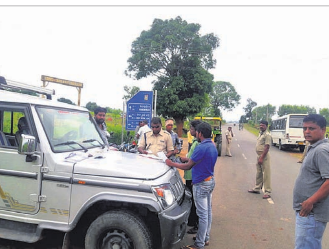
ଦାରିଜବାଡ଼ି ବୁକ୍ ଅଞ୍ଚଳରେ ଗାଡ଼ି ଯାତ୍ରା କରାଯାଉଛି।

ଉଭୟ ପଟର ବସ ଯାତାୟତକୁ ଓଏସଆରଟିଭି ପକ୍ଷରୁ ସପ୍ତାହ ପର୍ଯ୍ୟନ୍ତ ବନ୍ଦ କରି ଦିଆଯାଇଥିବା ସ୍ଥାନୀୟ ଶାଖା କାର୍ଯ୍ୟାଳୟ ପକ୍ଷରୁ କୁହାଯାଇଛି। ତେବେ ଘରୋଇ ବସଗୁଡ଼ିକ ଯାତାୟତ କରୁଛି। ଦାରିଜବାଡ଼ି ଅଞ୍ଚଳରେ କୌଣସି ସ୍ଥାନରେ ମାଓବାଦୀଙ୍କ ପକ୍ଷରୁ ପୋଷ୍ଟର ଲାଗି ନ ଥିବା ବେଳେ ଫିରିଙ୍ଗିଆ ବୁକ୍ ଅଞ୍ଚଳରେ ପୋଷ୍ଟର ଲାଗି ମାଓବାଦୀମାନେ ସେମାନଙ୍କ ଉପସ୍ଥିତି ଜାହିର କରିଛନ୍ତି। ସେପଟେ ପୋଲିସ ପକ୍ଷରୁ ଦିନଗାଡି ପାଟ୍ରୋଲିଂ କୁ କଟାକଟି କରାଯିବା ସହ ବିଭିନ୍ନ ସ୍ଥାନରେ ବୁକିଂ କରି ଯାନବାହନ ଯାତ୍ରା ପ୍ରତିଷ୍ଠା କାରି ରହିଛି। ଗତବର୍ଷ ମାଓବାଦୀଙ୍କ ଶହୀଦ ସପ୍ତାହ ପାଳନ ବେଳେ ପୋଲିସ ପକ୍ଷରୁ ଜନସଚେତନତା ପାଇଁ ମାଓବାଦୀଙ୍କ କାର୍ଯ୍ୟକଳାପ ବେଆଇନ ଭାବେ ବର୍ଣ୍ଣାଯାଇ ପୋଷ୍ଟର ଛପାଯାଇଥିବା