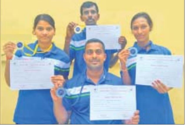
ଜାତୀୟ ହୁଲଲଚେୟାର ଫେଡ଼ିଂ: ପଦକ ଓ ମାନପତ୍ର ସହ ପ୍ରତିଯୋଗୀମାନେ ।

ପଣକୀ, ୨୮୮: ୧୯ ବର୍ଷରୁ କମ୍ ଭାରତୀୟ ଦଳର ଦୁଇ ସଦସ୍ୟ ଗୁରୁତର ଆହତ ହେବାରୁ ବର୍ତ୍ତମାନ ଚଳିଥିବା ଚୁର୍ଣ୍ଣ ଗସ୍ତରେ ଥିବା ଭାରତୀୟ ଦଳ ଶନିବାର ସ୍ଥାନୀୟ କ୍ଲବ୍ ସହ ଏକ ମ୍ୟାଚ୍ ଖେଳିବା ପରେ କୋର୍ଟ୍ ଫୁଟ୍‌ବଲ ପିସ୍ତା ଖେଳାଳିଙ୍କୁ ଗୋଟିଏ ଦିନ ପାଇଁ ବିଶ୍ରାମ ଦେଇଥିଲେ। ସ୍ୱର ଖେଳାଳିମାନେ ହୋଟେଲ ନିକଟରେ ଥିବା ପାଇଁ ସମୟ ବିତାଇବାକୁ ନିଷ୍ପତ୍ତି ନେଇଥିଲେ। ଦଳୀୟ ସ୍ୱପ୍ନକୁ ଜଣାପଡ଼ିଛି, ଦୁଇ ଖେଳାଳିଙ୍କୁ ନେଇ ଯାଉଥିବା କେବୁଲ୍ କାର୍ ମଝିରେ ଅଟକି ଯାଇଥିଲା। ଏଥିଯୋଗୁଁ ସେମାନେ ଭୟଭୀତ ହୋଇ ଡେଇଁଥିଲେ। ଏ ନେଇ ଦଳର ଫିରିଂଗ୍‌ପିସ୍ଟ ଏଥାଇଟିଏଫ୍‌ସ୍ ନିକଟରେ ରିପୋର୍ଟ ଦାଖଲ କରିଛନ୍ତି। ଏଥିରେ ଖେଳାଳି ଆହତ ହୋଇଛନ୍ତି, ହେଲେ କୌଣସି ବିଶାଳନକ ବିଷୟ ନୁହେଁ। ସ୍ୱର ଭାରତୀୟ ଦଳ ଏବେ ୧୯ ବର୍ଷରୁ କମ୍ ଏଏଫ୍‌ସି ଚାମ୍ପିୟନଶିପ ପାଇଁ ଚୁର୍ଣ୍ଣରେ ପ୍ରସ୍ତୁତ ହୋଇଛି। ଭାରତ ଏ ପର୍ଯ୍ୟନ୍ତ ଚୁର୍ଣ୍ଣରେ ଦୁଇଟି ମ୍ୟାଚ୍ ଖେଳିଛି। ପ୍ରଥମ ମ୍ୟାଚ୍‌ରେ ଓମାନଠାରୁ ୨-୧ର ପରାଜୟ ବରଣ କରିଛି। ପରବର୍ତ୍ତୀ ମ୍ୟାଚ୍‌ରେ ଶ୍ରୀଲଙ୍କା ନାଗାଟାକୁ ଭେଟିବାର ଅଛି। ହେଲେ ପ୍ରକଳ ବର୍ଷା ଯୋଗୁଁ ଅଭାବ ହୋଇ ପାରୁନାହିଁ।