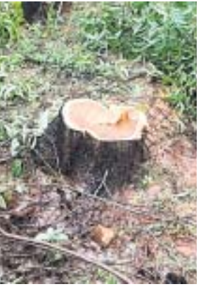
ଗ୍ରାମବାସୀଙ୍କ ଅଭିଯୋଗ ଯେ, ଯେଉଁଦିନ ବନ ବିଭାଗ ତରଫରୁ ଦିନରେ ମଣିଗାଠା ପାର୍ଶ୍ଵରେ ଲାଗିଥିବା ବହୁ ପୁରୁଣା ଗଛଗୁଡ଼ିକୁ ପ୍ରାୟ ୪ଥର ଏମିତି ରାତି ଅଧରେ ଚୋରମାନେ ମେଶିନ ସାହାଯ୍ୟରେ କାଟି ନେଇଯାଇଛନ୍ତି। ବାରମ୍ବାର ଦେପାରଗୁଡ଼ା ବନ ଅଧିକାରୀଙ୍କୁ ଜଣାଇବା ସତ୍ତ୍ୱେ କୌଣସି ଦୃଷ୍ଟାନ୍ତମୂଳକ ବାରିଆଗୁଡ଼ା ନିଆଯାଇ ନାହିଁ।

ବନ ବିଭାଗ ପାଟ୍ଟୋଲିଂ ବେଳେ ଦେଖାଇଲେ କାମ ହେଉଥିବା ଅଭିଯୋଗ କଲେ ଗ୍ରାମବାସୀ