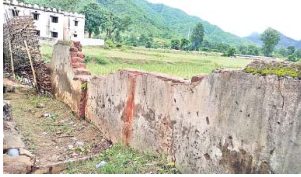
ଦଣ୍ଡାବାଡ଼ି ଉନ୍ନତ ଆଶ୍ରମ ବିନ୍ୟାୟର ପାଟେରି ଭାଙ୍ଗିଯାଇଛି।

ଉପାନ୍ତ ଅଞ୍ଚଳର ଆଶ୍ରମ ବିନ୍ୟାୟକୁ ବିରୁଦ୍ଧରେ ଅଭାବ ଭିତରେ ରହୁଛି। ବହୁସଂଖ୍ୟାରେ ଛାତ୍ରଛାତ୍ରୀ ଥାଇ ଆବଶ୍ୟକ ଶିକ୍ଷକ ନାହାନ୍ତି। ପୁଣି ପାନୀୟ ଜଳ ଓ ପାଟେରି ଅଭାବ ରହିଛି। ଶିକ୍ଷକ ଭିତ୍ତିମୂଳକ ଏଭଳି ଅଭାବ ଭିତରେ ଫେଲ୍ ମାରୁଛି ଗୁଣାତ୍ମକ ଶିକ୍ଷା। କୋଟପାଡ଼ ଜିଲ୍ଲା ନାରାୟଣପାଟଣା ବ୍ଲକ୍ରେ ଦଣ୍ଡାବାଡ଼ି ଉନ୍ନତ ଆଶ୍ରମ ବିନ୍ୟାୟ ହେଉଛି ଏହାର ଏକ ନମୁନା।