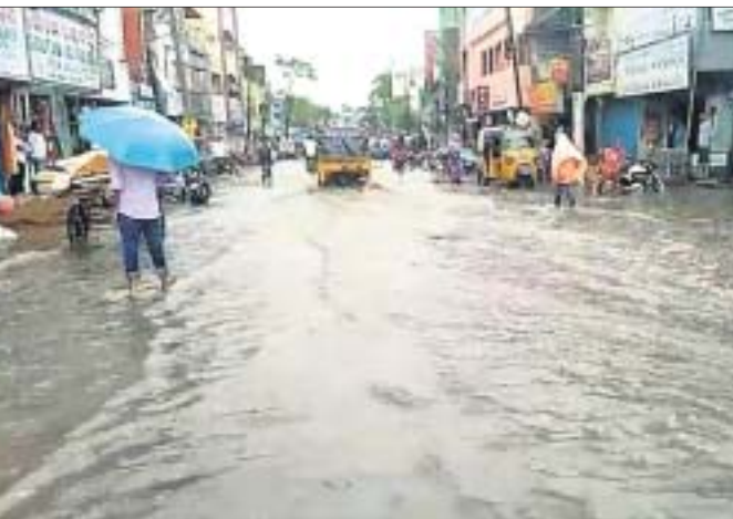
ଲଗାଶ ବର୍ଷା ଯୋଗୁ ରବିବାର ଜୟପୁର ସହରରେ ବକାର ମୁଖ୍ୟରାସ୍ତାରେ ଆଖୁଏ ପାଣି ଜମିବା ସହ କୃତ୍ରିମ ବନ୍ୟା ଭଳି ଦୃଶ୍ୟ ଦେଖିବାକୁ ମିଳିଛି।