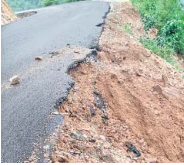
ଘାଟିରାସ୍ତାର ଗୋଟିଏ ପାର୍ଶ୍ୱକୁ ମାଟି ଧରିଯାଇଛି।

ହେବ, ତାହା କହିହେବ ନାହିଁ। ସେହିପରି ଲକ୍ଷ୍ମୀପୁରଠାରୁ ନାରାୟଣପାଟଣା ଯିବାକୁ ଥିବା ଏହି ରାସ୍ତାର ନାଳକୁଆ ନିକଟସ୍ଥ ରାସ୍ତାପାର୍ଶ୍ୱରେ ନାଳ କରାଯାଇ ନଥିବାରୁ ରାସ୍ତା ପାର୍ଶ୍ୱ ପ୍ରାୟ ୧ ମିଟର ମାଟି ଖାଇଯାଇ ବିପଦସଙ୍କୁଳ କରିଛି। ରାସ୍ତା ଉପରୁ ପିଚୁ କୋଟ କରାଯାଇଥିବାବେଳେ ତାହାର ତଳେ ପ୍ରାୟ ୧ ମିଟର ଯାଏ ମାଟି ଖୋଳାଯାଇଛି। ବିଭାଗୀୟ କର୍ତ୍ତୃପକ୍ଷ ତୁରନ୍ତ ଦୃଷ୍ଟି ଦେବାକୁ ସାଧାରଣରେ ଦାବି ହୋଇଛି।