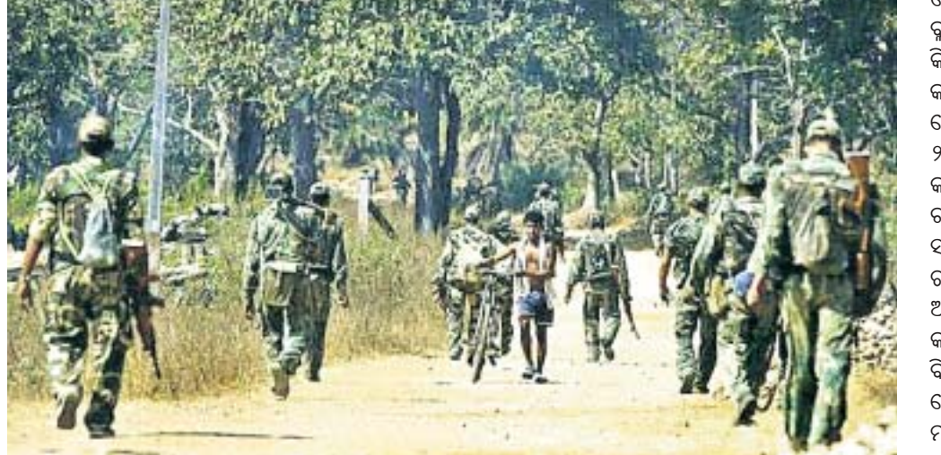
ଲମତାପୁର ଅଞ୍ଚଳରେ ରବିବାର ବିଏସ୍‌ଏସ୍ ଯବାନମାନେ କୋସିଂ ଅପରେଶନ କରାଇଛନ୍ତି।

କୋରାପୁଟ, ୨୮ (ସ.ପ୍ର.) ଅବିଭକ୍ତ କୋରାପୁଟ ଜିଲ୍ଲାରେ ରବିବାରଠାରୁ ମାଓବାଦୀଙ୍କ ଶହାଦ ସପ୍ତାହ ଆରମ୍ଭ ହୋଇଥିବାବେଳେ କୋରାପୁଟ ଜିଲ୍ଲାରେ ଏହାର ଆଂଶିକ ପ୍ରତ୍ୟାବ ପଡ଼ିଛି। ଜିଲ୍ଲାର ପଟାଳି ବ୍ଲକ ଆବାଲି, ଏ. ଗୋଲୁର, ତଳଗୋଲୁର, ନନ୍ଦପୁର ବ୍ଲକର ପାଠୁଆ, ଅତଞ୍ଜା ଅଞ୍ଚଳ, ଲମତାପୁଟ