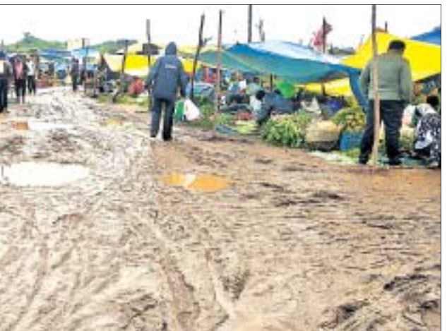
ସେମିଲିଗୁଡ଼ା ରବିବାର ସାପ୍ତାହିକ ହାଟର ଅବସ୍ଥା ବର୍ଷା ପରେ ବିପର୍ଯ୍ୟୟ ହୋଇଛି। ସୁନାବେଡ଼ା ମୁ୍ୟନିସପାଲିଟି ମାହାସୁଲ ନେଇଥିବା ବେଳେ ବକ୍ଷଣାବେକ୍ଷଣ କରୁ ନଥିବା ବୁଧାରା, କାଣ୍ଡି, ସୁବାଳ, ବୁଧାପୁଟ ଅଞ୍ଚଳର ମାଲୀ ସମୂହଙ୍କ ଦେପାରୀ ଅଭିଯୋଗ କରିଛନ୍ତି।