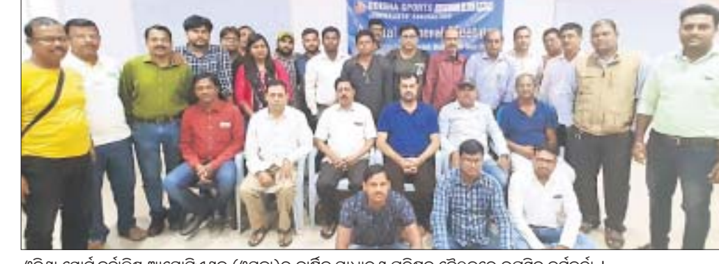
ଓଡ଼ିଶା ସ୍କୋର୍ସ୍ ଜର୍ନାଲିଷ୍ଟ ଆସୋସିଏସନ୍ (ଓସକା)ର ବାର୍ଷିକ ସାଧାରଣ ପରିଷଦ ବୈଠକରେ ଉପସ୍ଥିତ କର୍ମଚାରୀ ।