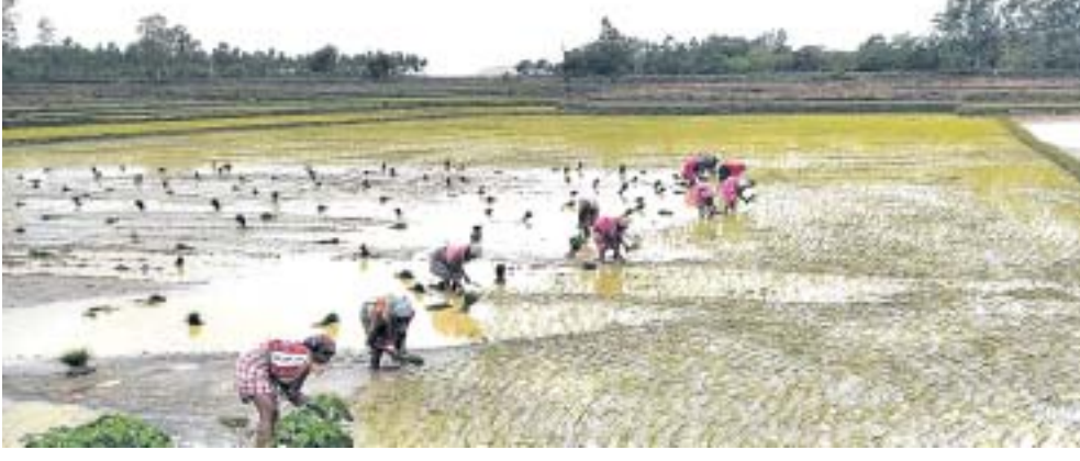
କନ୍ଧପୁର ଅଞ୍ଚଳର ଚାଷକାରୀରେ ଭୂଆଁକାମ ଚାଲିଛି।

କୋଟପାଡ଼ ଜିଲ୍ଲାରେ ଗତ ଦିନରେ ପ୍ରବଳବର୍ଷା ଯୋଗୁ ଚାଷକାରୀଙ୍କ ଜୋର ଧରିଲା। ଚାଷମାନେ ନିଜ ଜମିରେ ଖରିଫ ଧାନ ପାଇଁ ଭୂଆଁ କାର୍ଯ୍ୟ ଆରମ୍ଭ କରିଦେଇଛନ୍ତି। ଜୁଲାଇ ପ୍ରାରମ୍ଭରୁ ସାମାନ୍ୟ ବର୍ଷା ହୋଇଥିଲେ ମଧ୍ୟ ବୃତ୍ତାନ୍ତ ସମୁଦାୟ ପ୍ରାୟ ୧୦ ଦିନ ଯାଏ ବର୍ଷାର ପରିମାଣ କମିଯାଇଥିଲା। ଜୁଲାଇ ପ୍ରଥମ ସପ୍ତାହରେ ସାମାନ୍ୟ ବର୍ଷା ପରେ ଧାନ ଚଳି ପକାଯାଇଥିଲେ ମଧ୍ୟ ଧାନରେ ଚାନ୍ଦା ହେବା ସହ ତାହା ପ୍ରାୟ ୧୦ ଲକ୍ଷରୁ ଏକ କୁଟ ଯାଏ ବଢ଼ିଥିଲା। କିନ୍ତୁ ଅଧିକାଂଶ ଜମିରେ ଆବଶ୍ୟକ ପାଣି ନଥିବାରୁ ଯୋଗୁ ଭୂଆଁକାମ ହୋଇପାରି ନଥିଲା। କିନ୍ତୁ ଗତ ୨୬ ତାରିଖରେ ଜିଲ୍ଲାରେ ୬୪.୬ ମିମି, ୨୭ ତାରିଖ ୩୦.୪.୯ ମିମି ବର୍ଷା ହୋଇଥିବା ବେଳେ ୨୮ ତାରିଖ ମଧ୍ୟ ବର୍ଷା ଲାଗି ରହିଛି। କୋଟପାଡ଼ ଜିଲ୍ଲାରେ ଜୁଲାଇରେ ସାଧାରଣତଃ ୩୭୫.୬ ମିମି ବର୍ଷା ହୋଇଥାଏ।