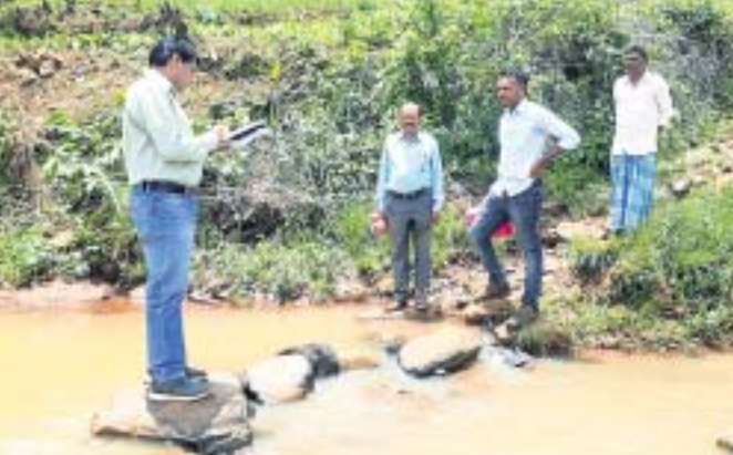
ନଦୀସ୍ଥଳ ଅନୁଧ୍ୟାନ କରୁଛନ୍ତି ବିତିଓ ଏବଂ ଯନ୍ତ୍ରୀ।

ନଦୀରେ ପୋଲ ପାଇଁ ସ୍ଥିତି ଅନୁଧ୍ୟାନ କଲେ ବିତିଓ, ଯନ୍ତ୍ରୀ