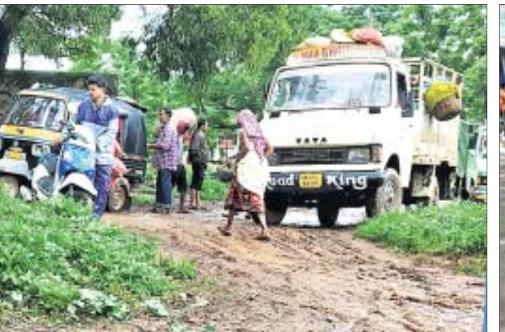
ସୁନାବେଡ଼ା ସ୍ଥିତ ଜଗନ୍ନାଥ ମାକେଟ୍ ବର୍ଷା ଯୋଗୁ କାହୁଣ୍ଡା ଭର୍ତ୍ତି ହୋଇଛି। ପୌରପରିଷଦ ଟିକସ ନେଉଥିଲେ ମଧ୍ୟ ଏହାର ଯତ୍ନ ନେଉନଥିବା ସ୍ଥାନୀୟ ଦେପାରୀ ଓ ଗ୍ରାହକ କହିଛନ୍ତି।