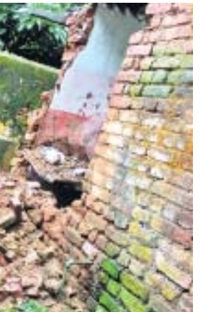
ଯବାନ ରହୁଥିବା ଗୃହ ଧସିଯାଇଛି।

କୋରାପୁଟ ସଦର ଅନ୍ତର୍ଗତ କୋଲାବନଗର ଛିତ ସମୂହ ଆଇଆରବି ବାଟାଲିୟନର ଯବାନମାନେ ରହୁଥିବା ଏକ ପରିତ୍ୟକ୍ତ କ୍ୱାର୍ଟର ରବିବାର ଲଗାଶ ବର୍ଷାରେ ଭାଙ୍ଗିଯାଇଛି। ଫଳରେ ଘରପଛ ପଟେ ଥିବା ଡ୍ରେନ୍‌ଟି ଏଥିରେ ସମ୍ପୂର୍ଣ୍ଣ ପୋଡି ହୋଇଯାଇଛି। ବର୍ଷାପାଣି ନିଷ୍କାସନ ହୋଇ ନପାରି ପଡ଼ୋଶୀଙ୍କ ଘରେ ପଶିଛି। ଉଲ୍ଲେଖଯୋଗ୍ୟ ଯେ, ବିପଦସଙ୍କୁଳ ଥିବା କ୍ୱାର୍ଟରରେ ସୁରକ୍ଷାକର୍ମୀମାନେ ମେସ୍