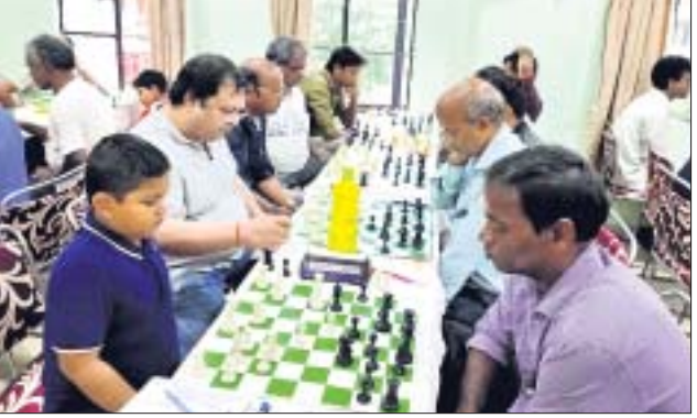
ଉମେଶ ମେମୋରିଆଲ୍ ଟେସ୍ଟ ଦ୍ୱିତୀୟ ଦିନ ଖେଳ ଅବସରରେ ପ୍ରତିଯୋଗୀମାନେ ।

କରାଚୀ, ୨୮୮: ନିକଟରେ ଟେଷ୍ଟ କ୍ରିକେଟ୍‌ରୁ ଅବସର ନେଇଥିବା ବାମହାତୀ ଯେସର ମହମ୍ମଦ ଅମିର ଏବେ ଦ୍ୱିତୀୟ ସ୍ତରୀୟ ବାସିନା ହେବା ପାଇଁ ଉଦ୍ୟମ କରୁଛନ୍ତି। ସେ ପ୍ରସ୍ତୁତ ଜଣାପଡ଼ିଛନ୍ତି। ଅମିର ୨୦୧୬ ସେପ୍ଟେମ୍ବରରେ ଜଣେ ଦ୍ୱିତୀୟ ମହିଳାଙ୍କୁ ବିବାହ କରିଥିଲେ। ଫଳରେ ସେ ପତିଙ୍କ ଭିତ୍ତି ଲାଗି ଯୋଗ୍ୟ ହୋଇଛନ୍ତି। ଏହି ଭିତ୍ତି ତାଙ୍କୁ ଇଂଲଣ୍ଡରେ ୩୦ ମାସ ରହିବାକୁ ଅନୁମତି ଦେଇଛି। ଏହି ସମୟରେ ସେ ଇଂଲଣ୍ଡର ନାଗରିକତା ଭଳି ସମସ୍ତ ଅଧିକାର ଫାଳିବା ଉପରେ ପ୍ରସ୍ତୁତ। ତେବେ ସେ ଇଂଲଣ୍ଡରେ ଏକ ଘର କିଣିବାକୁ ଚାହୁଁଛନ୍ତି। ୨୭ ବର୍ଷୀୟ ବୋଲରଙ୍କ ନିକଟରେ ବହୁତ କ୍ରିକେଟ୍ ବାକି ଅଛି। ଏବେଠାରୁ ଇଂଲଣ୍ଡରେ ସ୍ଥାୟିତ୍ୱ ପାଇଁ ଉଦ୍ୟମ କରିବା ପ୍ରଶଂସକଙ୍କୁ ଚକିତ କରି ଦେଇଛି। ସେ ନିୟମିତ ବ୍ୟବସାୟରେ ଇଂଲଣ୍ଡ ଯାଆନ୍ତି। ଗତବର୍ଷଠାରୁ ସେଠାରେ କାର୍‌ବ୍ କ୍ରିକେଟ୍ ମଧ୍ୟ ଖେଳୁଛନ୍ତି। ଅମିର ଚୁପ୍‌ଚାପ କ୍ରିକେଟ୍‌ର ଲୟା ଫର୍ମାଟକୁ ସମ୍ୟକ ଯୋଗ୍ୟ କରିଥିଲେ। ଏହାପରେ ଶୋଏବ ଅଖତର, ଖୁସିମ ଆକ୍ରମ, ଖୁସିମ ସୁନିସ, ରମିଜ ରାଜକ ଭଳି ବହୁ ପୂର୍ବତନ କ୍ରିକେଟ୍‌ର ଚାଳୁ ସମାଲୋଚନା କରିଥିଲେ।