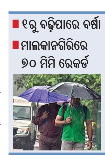
ପାରାଦୀପ, ବାଲେଶ୍ୱର, ଚାନ୍ଦବାଲିରେ ମଧ୍ୟ ସ୍କୁଲ ପରିମାଣର ବର୍ଷା ହୋଇଥିବା ଭୁବନେଶ୍ୱର ଆଞ୍ଚଳିକ ପାଣିପାଗ କେନ୍ଦ୍ର ପକ୍ଷରୁ ସୂଚନା ଦିଆଯାଇଛି।

ଭୁବନେଶ୍ୱର, ୨୮୭(ବ୍ୟୁରୋ) ମନ୍ଦିର ଗ୍ରାମ ଲାଲପୁର ପ୍ରଭାବରେ ସାରା ରାଜ୍ୟରେ ବର୍ଷା ଲାଗି ରହିଛି।