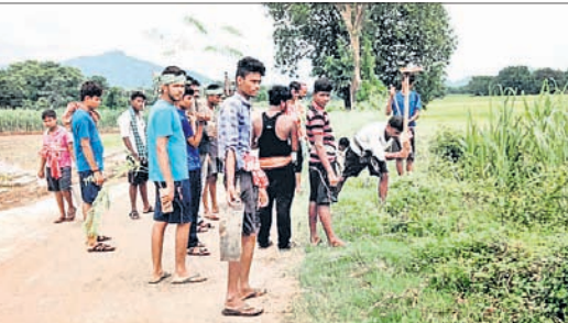
ଓଡ଼ିଶାରେ ଛାତ୍ରାଛାତ୍ରୀ, ଶିକ୍ଷକମାନେ ଚାରା ରୋପଣ କରୁଛନ୍ତି।