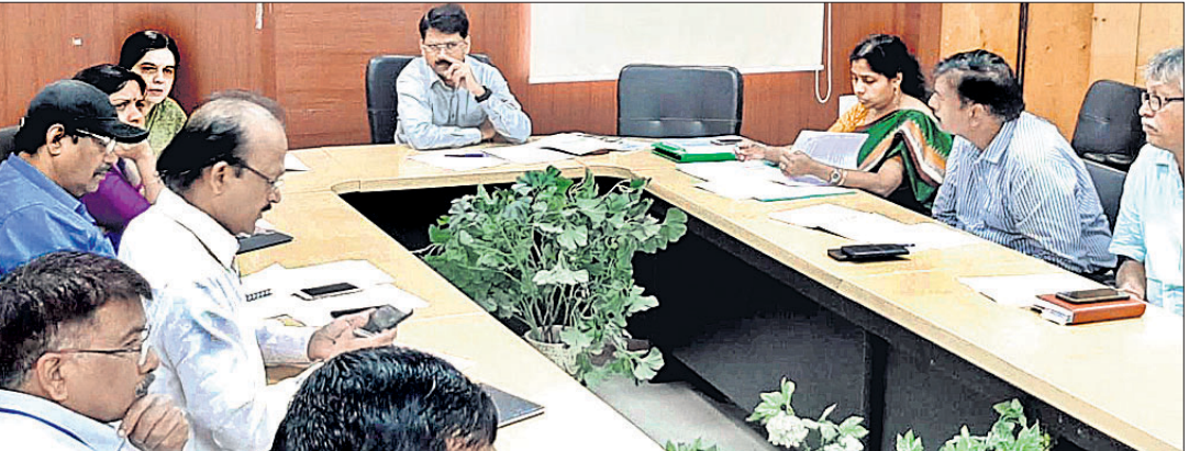
ଟାସ୍କଫୋର୍ସ ବୈଠକରେ ଯୋଗଦେଇଥିବା ବିଭାଗୀୟ ଅଧିକାରୀମାନେ।

ଭୁବନେଶ୍ୱର, ୩୦।୭।(ବୁଧବୋ) କର୍କଟ, ମଧୁମେହ, କାର୍ଡିଓ ଭାସ୍କୁଲାର ଏବଂ ହୃଦ୍‌ଘାତ ନିରାକରଣ ଓ ନିୟନ୍ତ୍ରଣ ପାଇଁ କାର୍ଯ୍ୟକାରୀ ହେଉଥିବା ଜାତୀୟ ଯୋଜନା (ଏନ୍‌ପିସିଡିସିଏସ୍‌) ଟାସ୍କଫୋର୍ସ ପ୍ରଥମ ରାଜ୍ୟସ୍ତରୀୟ ବୈଠକ ମଙ୍ଗଳବାର ଅନୁଷ୍ଠିତ ହୋଇଯାଇଛି।