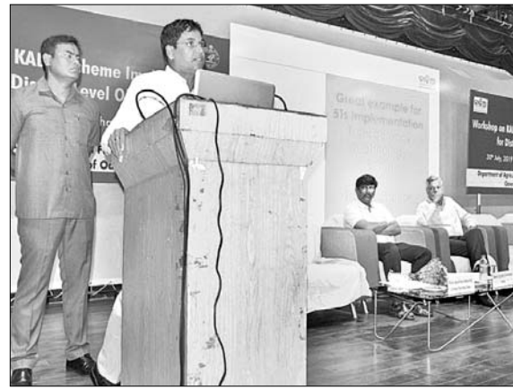
ଜିଲ୍ଲାପ୍ରାୟତ ସମ୍ମିଳନୀରେ କୃଷିମନ୍ତ୍ରୀ ଅରୁଣ ସାହୁ ଉଦ୍‌ଘୋଷଣା କରୁଛନ୍ତି ।