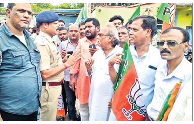
ଭାଙ୍ଗପା ନେତୃତ୍ୱରେ ପୋଲିସ୍ ସହିତ ଆଲୋଚନା କରୁଛନ୍ତି।

ବ୍ୟାସନଗର ପୌର ପରିଷଦର ରାସ୍ତାଯାତ୍ର ବିପର୍ଯ୍ୟୟ ହୋଇପଡ଼ିଛି। ସହରବାସୀ ଯାତାୟାତ କରିବାରେ ଅସୁବିଧା ସମ୍ଭୁତ ହେଉଛି।