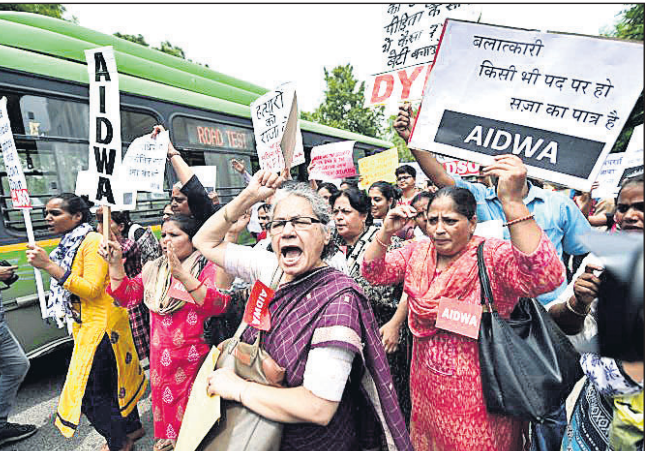
ଭନାଓ ମାମଲାରୁ ନେଇ ନୂଆଦିଲ୍ଲୀସ୍ଥିତ ଯୁପି ଭବନ ବାହାରେ ମହିଳା କର୍ମୀଙ୍କ ବିରୋଧ।

ସେନ୍ଦ୍ରାରଙ୍କ ବିରୋଧରେ ବଳାହାର ମାମଲା ରୁଜୁ ହେବା ପରେ ଗତବର୍ଷ ଏପ୍ରିଲରେ ତାଙ୍କୁ ଗିରଫ କରାଯାଇଥିଲା। ଏବେ ଏହି ଘଟଣାରୁ ନେଇ ରାଜନୀତି ଜୋର୍ ଧରିବାରେ ଲାଗିଛି। ମଙ୍ଗଳବାର