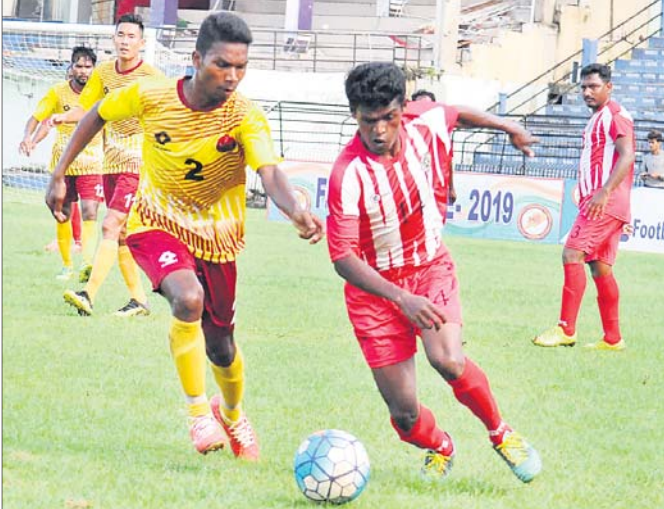
ଓଡ଼ିଶା ପୋଲିସ ଓ ପୂର୍ବତ ଚେଲଝେକୁ ମଧ୍ୟରେ ଅନୁଷ୍ଠିତ ମ୍ୟାଚ୍।

କଟକ ଅଫିସ, ୩୦।୭: କଟକରେ ଚାଲିଥିବା ପ୍ରଥମ ଡିଭିଜନ ଫୁଟବଲ ଲିଗର ମଙ୍ଗଳବାର ଅନୁଷ୍ଠିତ ମ୍ୟାଚ୍ରେ ଓଡ଼ିଶା ପୋଲିସ ୨-୧ ଗୋଲରେ ପୂର୍ବତ ଚେଲଝେକୁ ପରାସ୍ତ କରିଛି।