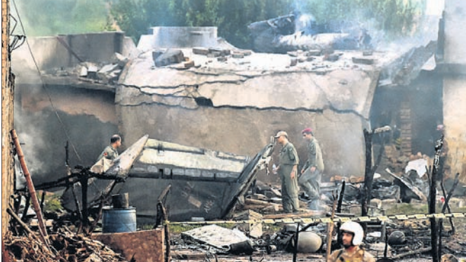
ଦୁର୍ଘଟଣା ପରେ ବିମାନର ଭଗ୍ନାବଶେଷ।

ସମ୍ପର୍କମାନଙ୍କୁ ପୋଲିସ ଗିରଫ କରିଥିଲା। ଭନାଓ ପାଢ଼ିତାଙ୍କ ପରିବାର ପକ୍ଷରୁ ହସ୍ତିଗୋଲ ସମ୍ମୁଖରେ ବିରୋଧ କରାଯାଇଥିବାବେଳେ ପାଢ଼ିତାଙ୍କ ଦାବାକୁ ପାରୋଲ ମିଳିବା ପରେ ପରିସ୍ଥିତି ଶାନ୍ତ ପଡ଼ିଛି। ଆଲୋଚନା ସହାକାରୀ ପାଢ଼ିତାଙ୍କ ଦାବାକୁ ନିଜ ସ୍ୱାକ୍ ଶେଷକୁତ୍ୟ ଲାଗି ଗୋଟିଏ ଦିନ ପାରୋଲ୍ ପ୍ରଦାନ କରିଛନ୍ତି। ସେପରେ ତିନିଦିନ ହେଉଥିବା ପାଢ଼ିତା ଓ ଡାକ ଓକିଲଙ୍କ ଅବସ୍ଥା ସଙ୍କଟାପଜ ଥିବା ମେଡିକାଲର ମୁଖପାତ୍ର ସମାପ୍ତ ତିପ୍ପଣୀ ପ୍ରକାଶ କରିଛନ୍ତି। ସେମାନଙ୍କୁ ଆଇସିୟୁରେ ଭେଟିଲେଗର ସହ ରଖାଯାଇଥିବା ସେ କହିଛନ୍ତି। ଅନ୍ୟପକ୍ଷରେ ଜାତୀୟ ମହିଳା କମିଶନର ଏକ ଟିମ୍ ଭନାଓ ପାଢ଼ିତାଙ୍କ ମା'କୁ ଲକ୍ନୋରେ ଭେଟିଛନ୍ତି। ଗତ ସୋମବାର ଟିମ୍ ଡିପିଓ ଓ.ପି. ସିଙ୍କୁ ଭେଟି ଉପସ୍ଥିତ ତଦନ୍ତ ଲାଗି ଦାବି କରିଥିଲେ।