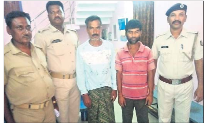
ଯାକପୁର ଗଞ୍ଜେଇ, ୩୦୭ (ଡିଏନଏ)