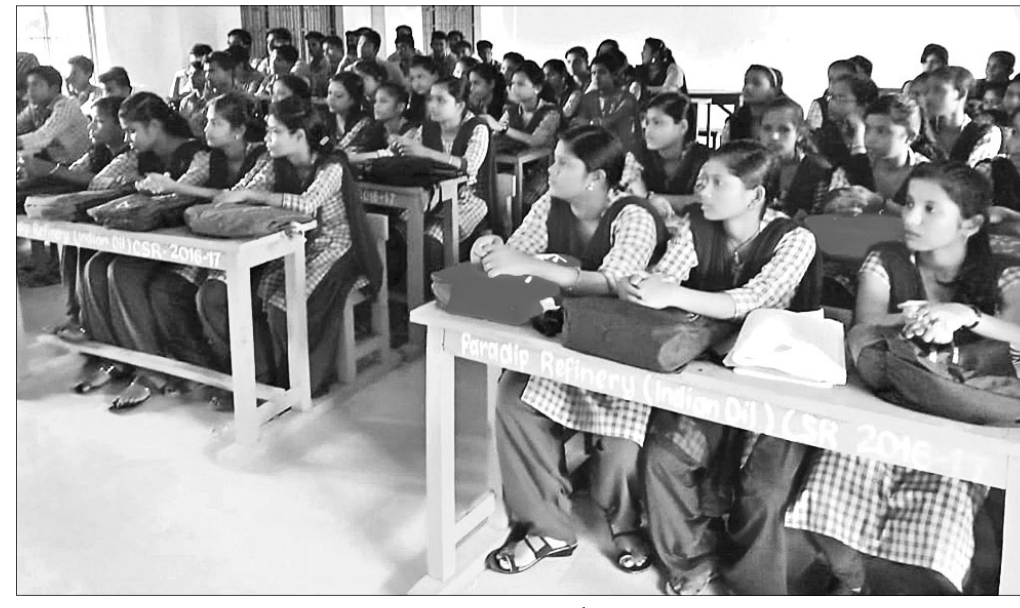
କୂଳଙ୍ଗ କଲେଜରେ ଅନୁଷ୍ଠିତ ପ୍ରବେଶ ଉତ୍ସବରେ ଉପସ୍ଥିତ ଯୁକ୍ତ ୨ ପ୍ରଥମ ବର୍ଷ ଛାତ୍ରାଛାତ୍ରୀ।

ପତି ରହୁଛି। ସେଥିରେ ପାଣି ଜମିବା ଦ୍ୱାରା ମଶା ମାଛି ବଂଶ ବିସ୍ତାର ହେବାରେ ଲାଗିଛି। ଏଥି ସହିତ ଲୋକେ ସେଥିରେ ଆବର୍ଜନା ପକାଇ ଦେବା ଦ୍ୱାରା ପତି ବୃଦ୍ଧି ହେଲାଣି।