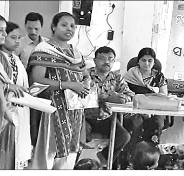
ସମୀକ୍ଷା ବୈଠକରେ ଉପସ୍ଥିତ ଅତିଥିଙ୍କ ସହ ଅନ୍ୟମାନେ।