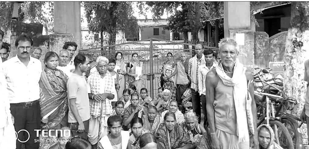
ଜଟେସିଂହା ପଞ୍ଚାୟତ ସମ୍ମୁଖରେ ଜନସାଧାରଣ ବିକ୍ଷୋଭ ପ୍ରଦର୍ଶନ କରୁଛନ୍

ଜଟେସିଂହା ପଞ୍ଚାୟତରେ ହେବାକୁ ଥିବା ସାମାଜିକ ସମାକ୍ଷା ବୈଠକ ରୁଧିରୀ ବନ୍ଦ ହୋଇଯାଇଛି। ଏହାର ପ୍ରତିବାଦରେ ଜନସାଧାରଣ ପଞ୍ଚାୟତ କାର୍ଯ୍ୟାଳୟ ସମ୍ମୁଖରେ ବିକ୍ଷୋଭ ପ୍ରଦର୍ଶନ କରିଥିଲେ। ସୁତରାଂସା, ଗତ ୧୫ରୁ ୩୧ ତାରିଖ ପର୍ଯ୍ୟନ୍ତ ବିଭିନ୍ନ ଦିବସରେ ରୁକର ବିଭିନ୍ନ ପଞ୍ଚାୟତରେ ସାମାଜିକ ସମାକ୍ଷା ବୈଠକ ହେବା ନେଇ ଦିନ ଧାର୍ଯ୍ୟ ହୋଇଥିଲା। ଏହି କ୍ରମରେ ରୁଧିରୀ ଉପୁଲ, ଜଟେସିଂହା, ସୁବଳୟା, ପିତାମହୁଳ ଓ କମିଳା ପଞ୍ଚାୟତରେ ସାମାଜିକ ସମାକ୍ଷା ବୈଠକ ହେବାକୁ ନାହିଁ। ଏଥିରେ ପଞ୍ଚାୟତ ଦାୟିତ୍ୱରେ ଥିବା କନିଷ୍ଠ ଯନ୍ତ୍ରୀ, ନିର୍ବାହୀ ଅଧିକାରୀ, ଗ୍ରାମ ରୋଜଗାର ସେବକ ଯୋଗ ଦେବାର ଥିଲା। ବୈଠକରେ ୨୦୧୮-୧୯ ଆର୍ଥିକ ବର୍ଷର ମହାମାଗାଣୀ ଜାତୀୟ ଗ୍ରାମୀଣ ନିହିତ କର୍ମନିୟୁତି ଯୋଜନା ଓ ଜାତୀୟ ସାମାଜିକ ସହାୟତା କାର୍ଯ୍ୟକ୍ରମର ସମୀକ୍ଷା ହେବାର ଥିଲା। ବିଡ଼ିଓଙ୍କ ଆଦେଶପ୍ରତ୍ନ ସଂଖ୍ୟା ୧୦୪୨ ଅନୁଯାୟୀ ବୈଠକରେ