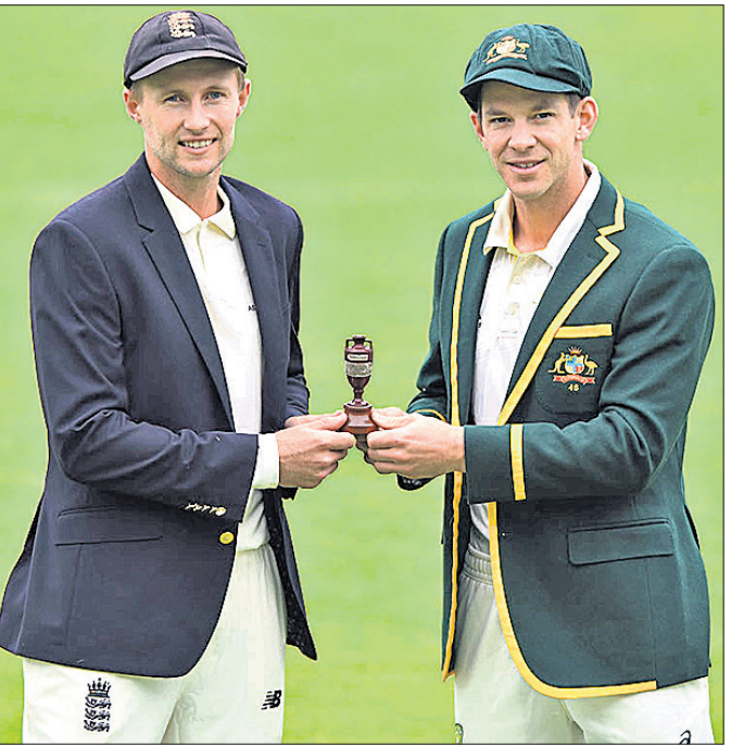
ଆଶେସ୍ ଲମ୍ପ ସହ କୋ ରୁଟ୍ ଓ ଚିମ୍ପ ପେନ୍

ଗୁରୁବାରଠାରୁ ଆରମ୍ଭ ହେବାକୁ ଯାଉଛି ହାଇପ୍ରୋଫାଇଲ ଆଶେସ୍। ଗ୍ଲାନାୟ ଏକଦାସ୍ତ୍ର ଗ୍ରାଉଣ୍ଡରେ ଗୁରୁବାରଠାରୁ ଆରମ୍ଭ ହେବାକୁ ଥିବା ପ୍ରଥମ ଚେଷ୍ଟ ମ୍ୟାଚରେ ଦୁଇ ପାରମ୍ପରିକ ପ୍ରତିଦ୍ୱନ୍ଦ୍ୱୀ ଇଂଲଣ୍ଡ ଓ ଅଷ୍ଟ୍ରେଲିଆ ପୁଣିପୁଣି ହେବେ। କିଛିଦିନ ତଳେ ବିଶ୍ୱକପ୍ ଜିତି ଘରୋଇ ତଥା କ୍ରିକେଟର ଜନକ ଇଂଲଣ୍ଡ ପ୍ରଥମଥର ପାଇଁ ଚାଲଚଳ ହାସଲ କରିଥିଲା। ଏଥର ଅସେସ୍ ଜିତି ଇଂଲଣ୍ଡ ଏହି ସଫଳତାକୁ ବିରୁଦ୍ଧ କରିବାକୁ ଚାହୁଁଛି। ଅନ୍ୟପଟେ ଆସେସର ଗତ ସଂସ୍କରଣରେ ୪-୦ରେ ବିଜୟ ହୋଇଥିବା ଅଷ୍ଟ୍ରେଲିଆ ଏଥର ବାଜିମାରିବା ଲକ୍ଷ୍ୟରେ ରହିଛି। ୧୯ ବର୍ଷପରେ ଅଷ୍ଟ୍ରେଲିଆ ଇଂଲଣ୍ଡ ମାଟିରେ ଆଶେସ୍ ଜିତି ଅଷ୍ଟ୍ରେଲିଆ ଇତିହାସ ସୃଷ୍ଟି କରିବା ଲକ୍ଷ୍ୟରେ ରହିଛି। କ୍ରିକେଟର ଦୁଇ ପୁରୁଣା ପ୍ରତିଦ୍ୱନ୍ଦ୍ୱୀଙ୍କ ମଧ୍ୟ ଏଥର ମୁକାବିଲା ସଂଘର୍ଷପୂର୍ଣ୍ଣ ହେବ ବୋଲି ଆଶା କରାଯାଉଛି। ବିଶ୍ୱକପ୍ ଜିତିଥିବାରୁ ଇଂଲଣ୍ଡର ଆତ୍ମବିଶ୍ୱାସ ବେଶ୍ ଦୃଢ଼ ରହିଛି। ଘରୋଇ ପରିବେଶରେ ବେଶ୍ ସକ୍ରିୟ ମନେ ହେଉଥିବା ଇଂଲଣ୍ଡ ଏଥର ସୁଯୋଗ ହାତଛତା କରିବାକୁ ଚାହୁଁବ ନାହିଁ ଓ ଗତ ଆସେସ୍ ପରାଜୟର ପ୍ରତିଶୋଧ ନେବାକୁ ପ୍ରୟାସ କରିବ।