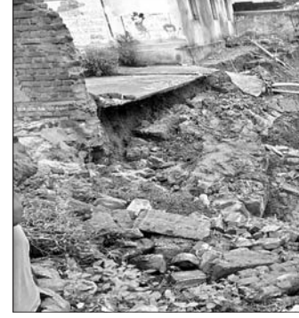
ଭୁଜୁରି ପଡିଥିବା ଭୁଜୁରିପାଲି ଗ୍ରାମର ଅଙ୍ଗନୱାଡି(ଖ) କେନ୍ଦ୍ର ପାଟେରି।

ହୋଇଥିବାରୁ ଲୋକେ ଘଟଣାରୁ ବର୍ତ୍ତମାନ ଅଭିଯୋଗ, ପୂରାବକ, ପାଟେରି ନିର୍ମାଣ ବେଳେ ନିର୍ମାଣର କାମ ହେଉଥିବା ନେଇ ଗ୍ରାମବାସୀ ପ୍ରତ୍ୟେକ କରି ବିଭାଗୀୟ ଯନ୍ତ୍ରୀଙ୍କ ଦୃଷ୍ଟି ଆକର୍ଷଣ କରିଥିଲେ। ହେଲେ ପ୍ରଶାସନ ପକ୍ଷରୁ ଗ୍ରାମବାସୀଙ୍କ କଥାକୁ ଗୁରୁତ୍ୱ ଦିଆଯାଇ ନ ଥିଲା। ସାହାକି ଗତ ଉପସର ଗତ ବର୍ଷରେ ପାଟେରି ଭୁଜୁରି ପଡିଥିବା ଗ୍ରାମବାସୀ ଅଭିଯୋଗ କରିଛନ୍ତି। ଜିଲ୍ଲା ପ୍ରଶାସନ ଘଟଣାର ତଦନ୍ତ କରି ଆବଶ୍ୟକ ପଦକ୍ଷେପ ନେବାକୁ ଗ୍ରାମବାସୀ ଦାବି କରିଛନ୍ତି।