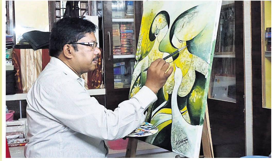
ବାନବନ୍ଧୁ ସାହୁଙ୍କ ଦ୍ଵାରା ଆଙ୍କାଯାଇଥିବା ଏକ ଚିତ୍ର ।

ଆପଣଙ୍କ ସକାଳ କେମିତି ଆରମ୍ଭ ହୁଏ ? ❖ ସକାଳ ପ୍ରାୟ ୬ଟା ପୂର୍ବରୁ ଶଯ୍ୟାତ୍ୟାଗ କରେ । ନିତ୍ୟକର୍ମ ସରିବା କରେ କିଛି ସମୟ ପ୍ରାର୍ଥନା ଭ୍ରମଣ ଏବଂ ଶାରୀରିକ ବ୍ୟାୟାମ କରେ । ସକାଳ ୮ଟାକୁ ବୃତ୍ତିଗତ ଜୀବନ ଆରମ୍ଭ ହୋଇଯାଏ । କେଉଁଭଳି ଖାଦ୍ୟରେ ରୁଚି ରଖନ୍ତି ? ❖ ଆଳୁ, ବାଜରା, ଚମାଟୋ ପୋଡ଼ା, ବଡ଼ିଚୁରା ସହିତ ଦହି ପଖାଳ ମୋର ଅତି ପ୍ରିୟ । ପ୍ରଥମ ଦରମା କ'ଣ କରିଥିଲେ ? ❖ ନବରଙ୍ଗପୁର ଜିଲ୍ଲା ଝରିଗାଁ ଗୋଷ୍ଠୀ ସ୍ଵାସ୍ଥ୍ୟକେନ୍ଦ୍ରରୁ ମୋର ତାଲୁକା ଚାକିରି ଆରମ୍ଭ ହୋଇଥିଲା । ପ୍ରଥମ ଦରମା ୪୦୪୨ ଟଙ୍କା ପାଇଥିଲି । ପିଲାଦିନରୁ ବେହେଲା ବାଦନ ପ୍ରତି ମୋର ରୁଚିକତା ଥିଲା । ପୁଁ ରାୟପୁରରୁ ସେହି ଟଙ୍କାରେ ବେହେଲା କିଣିଥିଲି । ଯାହା ଆଜି ଯାଏଁ ମୋର ସୁଖଦୁଃଖର ସାଥୀ ହୋଇ ରହିଛି । ସିନେମା ଦେଖିବ କି ?