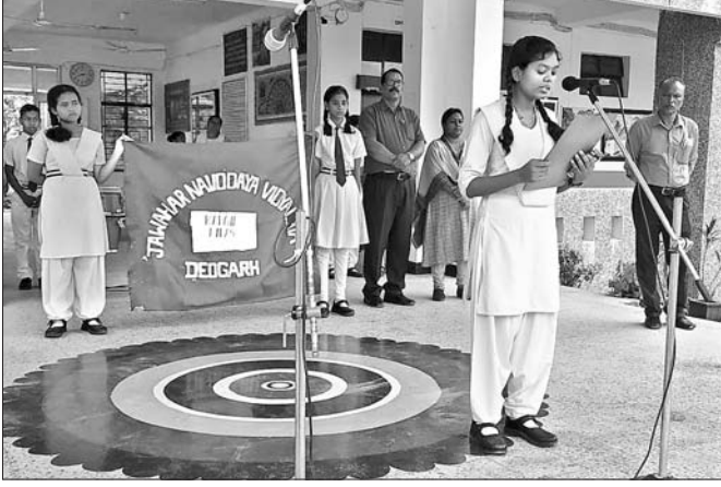
କାର୍ତ୍ତିକ ବିଜୟ ସପ୍ତାହ ଦିବସ ବିଦ୍ୟାଳୟର ଛାତ୍ରଛାତ୍ରୀ