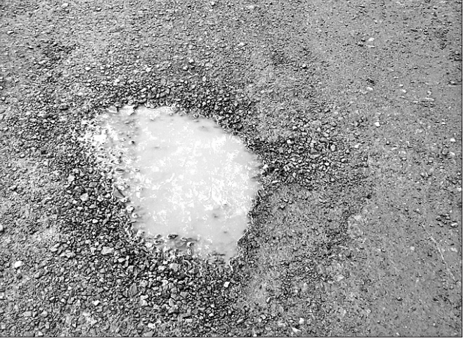
ଭୁବନିପାଲି ବସ୍ତାଖଣ୍ଡ ପାସେ ଜାତୀୟ ରାଜପଥ ଅବସ୍ତା। କରୁରପକ୍ଷକର୍ତ୍ତୃତ୍ୱରେ ନାଲି ପଡ଼ବାରଟା ଦିନାପୁରୀକୁ ବଲାଙ୍ଗୀର ଏନ୍.ଏ.ଏ. ନିହାତି ବୁଖର କଥା। ଇ ଜାତୀୟ ରାଜପଥ ଡିଜିଟାଲ ଅଧୀନରେ ରହିଛେ। ହେଲେ

ସୁବର୍ଣ୍ଣପୁର ଜିଲ୍ଲା ଭୁବନିପାଲି ରୁକ ସଦର ଦେଇ ଯାଇଛେ ବରଗଡ଼ ବୋରିଗୁମା ୨୨ ନମ୍ବର ଜାତୀୟ ରାଜପଥ। ରାସ୍ତାଟା ସବୁବେଳେ ଭିଡ଼ଭାଡ଼ ରହୁଥିଲାବେଳେ ପିପିନ ଶହ ଶହ ଉଜ୍ଜୈନୀ ଗାଡ଼ି ମଟର ଯାଆବା କରୁଛେ। ହେଲେ ମରାମତି ଅଭାବୁ ଏହେବେ ଭୁବନିପାଲି ବସ୍ତାଖଣ୍ଡରୁ ବଲାଙ୍ଗୀର ରାସ୍ତାରେ ଅନେକ ଜାଗରେ ବଡ଼ ବଡ଼ ଖାଲ ହେଇଛେ। ଯେତୁଥିଲେ ପିପିନ ଛୁଟିଆପୁଟିଆ ଭୁରଘଟନା ସବୁହେ। ସେନ୍ଦ୍ର ଭୁବନିପାଲି ଥାନା ଆସେ ଜାତୀୟ ରାଜପଥରେ ଗୁଡ଼ ବଡ଼େ ଖାଲ ହେଇଛେ। ପିପିନ ଅନେକ ଲୋକ୍ ଇ ଖାଲେ ପଡ଼ି ଖିଆଡ଼ିଆ ହେଉଛନ୍ତି। ଅନେକ ଦିନ ହେଲେ ଖାଲଟା ରାସ୍ତା ଉପରେ ରହିଥିଲେ ବି ବିଭାଗୀୟ