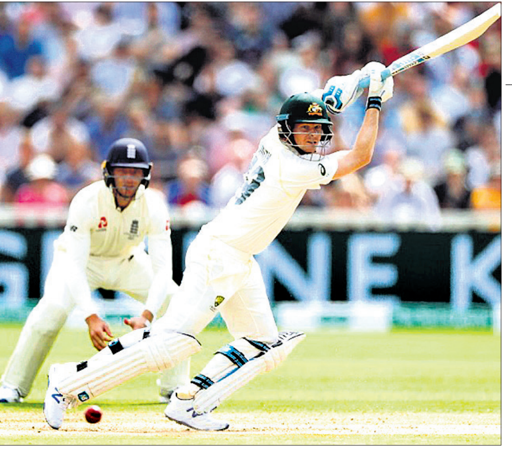
ଏକଦିନୀୟ ଟ୍ରାଉଥରେ ଲୁଡୁଆ ଶତକ ହାସଲ କରିଥିବା ଅଷ୍ଟ୍ରେଲିଆର ସ୍କଟ ଷ୍ଟିଭିନ୍ସ।