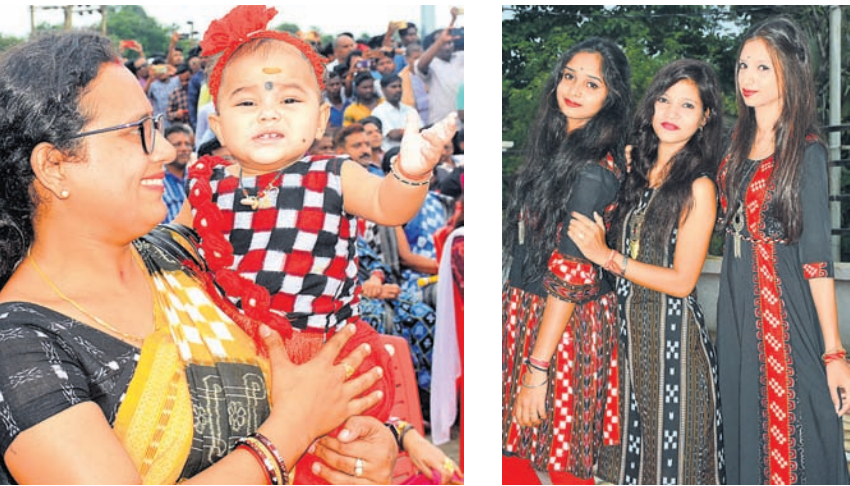
ସମ୍ବଲପୁରରେ ଆୟୋଜିତ ଉତ୍ସବରେ ସମ୍ବଲପୁରୀ ପୋଷାକରେ ଜଣେ ଶିଶୁ ଓ ଯୁବତୀମାନେ ।