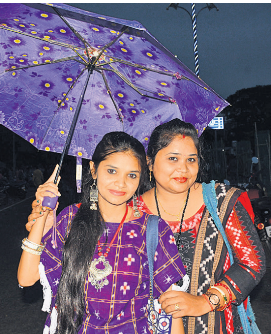
ସମ୍ବଲପୁରୀ ବିନ୍ଦୁ ଉତ୍ସବରେ ସାମାନ୍ୟ ବର୍ଷା ହେବାରୁ ଜଣେ ନେଇ ଉତ୍ସବ ସ୍ଥଳକୁ ଆସିଥିବା ଦୁଇ ଯୁବତୀ ।