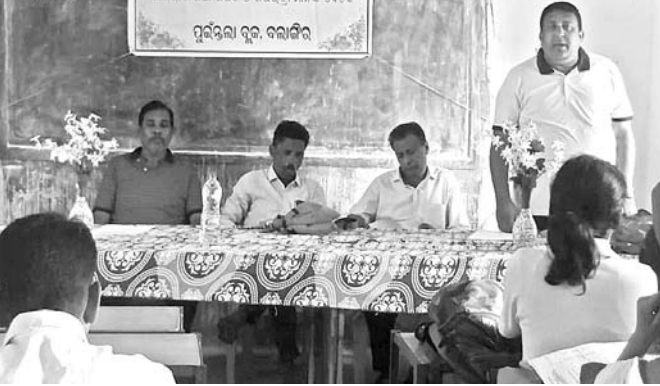
ବୃକ୍ଷପ୍ରସାୟ ଶାରୀରିକ ଶିକ୍ଷା ଶିକ୍ଷକ ସମିଳନୀରେ ମହାସାଧନ ଅତିଥି।