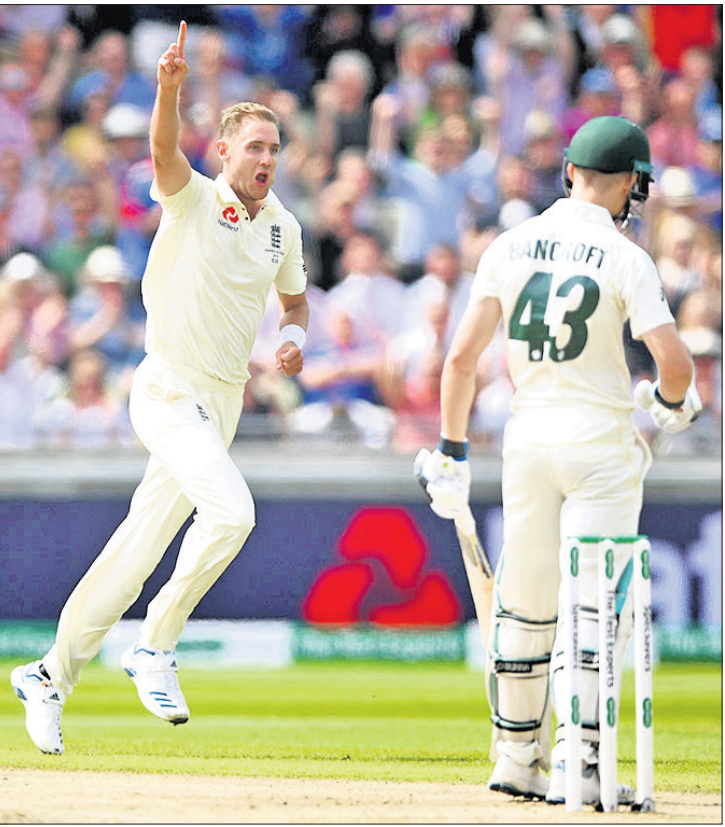
ଉଇକେଟ ହାସଲ ପରେ କ୍ରିସ୍ ବ୍ରଡ୍ ଓ ସୁଆର୍ଥ ବ୍ରଡ୍‌ଙ୍କ ପ୍ରତିକ୍ରିୟା।