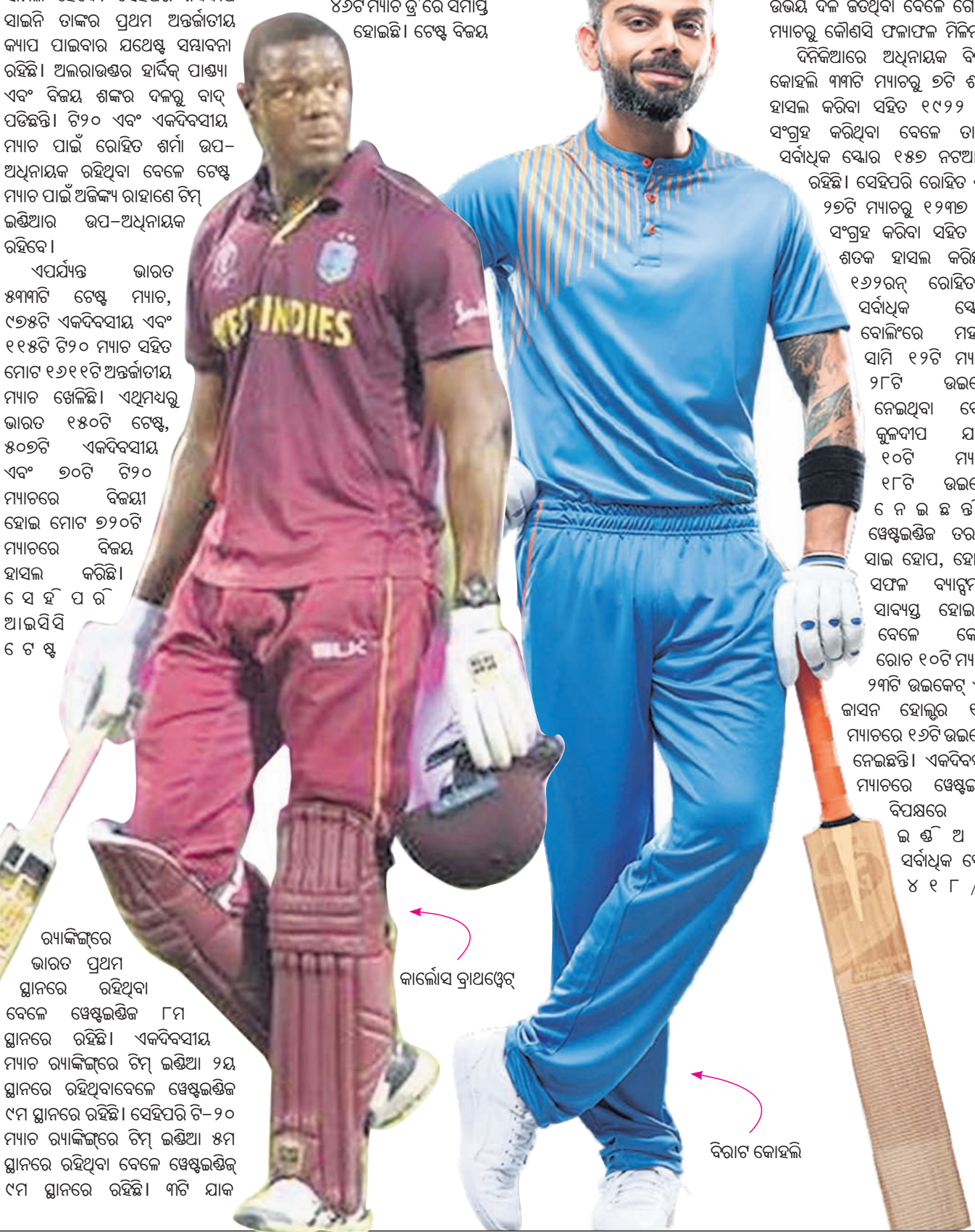
ରାଧିକାଙ୍କରେ ଭାରତ ପ୍ରଥମ ସ୍ଥାନରେ ରହିଥିବା ବେଳେ ଷ୍ଟେସ୍‌କ୍ରୀଡ଼ିଙ୍ଗ ୮ମ ସ୍ଥାନରେ ରହିଛି। ଏକଦିବସୀୟ ମ୍ୟାଚ ରାଧିକାଙ୍କରେ ଟିମ୍ ଇଣ୍ଡିଆ ୨ୟ ସ୍ଥାନରେ ରହିଥିବାବେଳେ ଷ୍ଟେସ୍‌କ୍ରୀଡ଼ିଙ୍ଗ ୯ମ ସ୍ଥାନରେ ରହିଛି। ସେହିପରି ଟି-୨୦ ମ୍ୟାଚ ରାଧିକାଙ୍କରେ ଟିମ୍ ଇଣ୍ଡିଆ ୫ମ ସ୍ଥାନରେ ରହିଥିବା ବେଳେ ଷ୍ଟେସ୍‌କ୍ରୀଡ଼ିଙ୍ଗ ୯ମ ସ୍ଥାନରେ ରହିଛି। ୩ଟି ଯାକ

ରହିଛି। ଟେଷ୍ଟ ମ୍ୟାଚ ଆରମ୍ଭ ପୂର୍ବରୁ ଏକ ୩ ଦିନିଆ (୧୭ ରୁ ୧୯) ଅଭ୍ୟାସ ମ୍ୟାଚ ଭାରତ ଆଷ୍ଟ୍ରେଲିଆରେ ଖେଳିବ। ଏଥିପାଇଁ ବିସିଆଇ ବିରାଟ କୋହଲିଙ୍କ ନେତୃତ୍ୱରେ ୩ଟି ଫର୍ମାଟ ପାଇଁ ଖେଳାଳି ତାଲିକା ପ୍ରକାଶିତ କରିଛି। ଏଥିରେ ଅଭିଜ୍ଞ ଖେଳାଳିମାନଙ୍କ ସହିତ ଆଇପିଏଲ୍ ଏବଂ ଘରୋଇ ସିଜନରେ ଭଲ ପ୍ରଦର୍ଶନ କରିଥିବା ଅନେକ ଯୁବ ଖେଳାଳିଙ୍କୁ ସୁଯୋଗ ପ୍ରଦାନ କରାଯାଇଛି। ସେମାନଙ୍କ ମଧ୍ୟରେ ଅଛନ୍ତି ଶ୍ରେୟାଣ୍ତ ଆୟର, ନବଦୀପ ସାଲ୍‌ଜି, ଖଲିଲ ଅହମ୍ମଦ, ଖାଶିଫ୍‌ଉଦ୍‌ଦିନ ସୁଦର, ରାହୁଲ କାରନସିଲ (ଆଇସିସି) ଦ୍ୱାରା ବାସ୍ତବ ହେବା ଫଳରେ ଏହି ଗସ୍ତ ବା ସିରିଜର