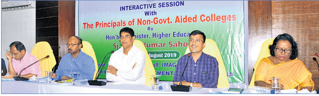
ବେସରକାରୀ ଅନୁଦାନପ୍ରାପ୍ତ ମହାବିଦ୍ୟାଳୟର ଅଧ୍ୟକ୍ଷମାନଙ୍କୁ ନେଇ ଅନୁଷ୍ଠିତ ରାଜ୍ୟସ୍ତରୀୟ ସମ୍ମିଳନୀରେ ଉପସ୍ଥିତ ଅତିଥି।