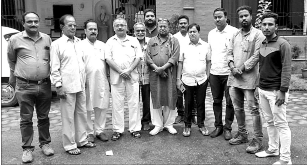
କଂଗ୍ରେସ ପ୍ରତିନିଧି ମଣ୍ଡଳ କଳାପାଳଙ୍କୁ ସାକ୍ଷାତ କରିବାକୁ ଯାଉଛନ୍ତି।