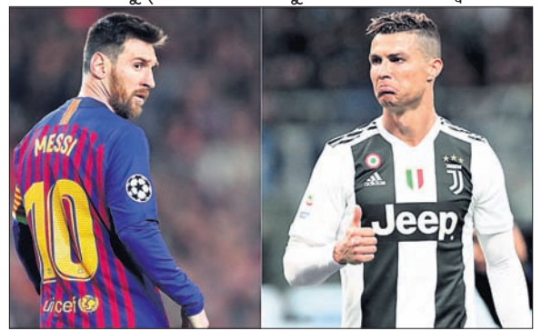
ଲିଭିଙ୍ଗ୍ ମେସି ଓ କ୍ରିଷ୍ଟିଆନୋ ରୋନାଲ୍ଡୋ