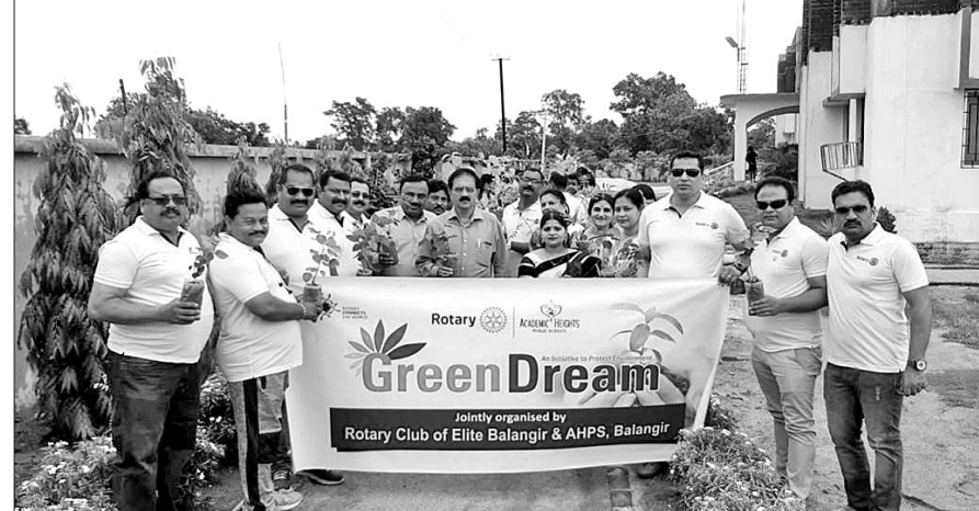
ବଲାଙ୍ଗୀର ଡିଆଇଇଡି ସ୍କୁଲ ସମ୍ମୁଖ ସ୍ତ୍ରୋତ ଲାଗିଯାଇଥିବାବେଳେ ଡ୍ରୋବର ଆବର୍ତନ ଓ ପାଣି ରାସ୍ତା ଉପରକୁ ଆସିଯାଇଛି। କାମରାଜ ରାଜପୁତ କର୍ତ୍ତୃପକ୍ଷଙ୍କ ଦୃଷ୍ଟିପୂର୍ଣ୍ଣତା (ବାମ)। ବଲାଙ୍ଗୀର ସୁଦପଠାରେ ଶାନ୍ତକଣ୍ଠୀ ମଞ୍ଚପ ନିର୍ମାଣ ପାଇଁ ଜୟ ମାଁ ଏସ୍.ବି.ସି. ମହିଳା ସଦସ୍ୟମାନେ କମିଟି ସଦସ୍ୟଙ୍କୁ ୧୫୫୫ଟା ଟଙ୍କା ସହାୟତା ପ୍ରଦାନ କରୁଛନ୍ତି (ମଝି)। ବଲାଙ୍ଗୀର ଏକାଡେମିକୁ ସ୍ୱାଇଚ୍ ସ୍କୁଲରେ ରୋଗୀର ଏଲିଏ କର୍ତ୍ତୃପକ୍ଷଙ୍କୁ ବୃକ୍ଷରୋପଣ କାର୍ଯ୍ୟକ୍ରମ।