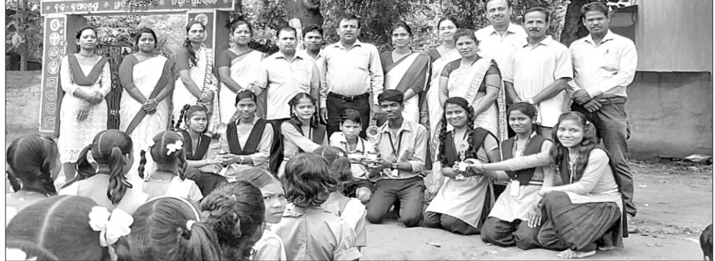
ବିଜ୍ଞାନ ନାଟକ ପ୍ରତିଯୋଗିତାରେ ପ୍ରଥମ ହୋଇଥିବା ଛାତ୍ରଛାତ୍ରୀଙ୍କୁ ସ୍କୁଲ ପକ୍ଷରୁ ପୁରସ୍କାର ପ୍ରଦାନ କରାଯାଇଛି।