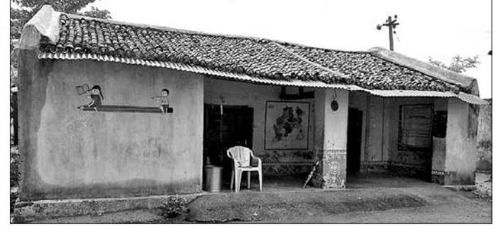
ଖମନପତା ସରକାରୀ ପ୍ରାଥମିକ ବିଦ୍ୟାଳୟ ।

ଶିକ୍ଷା ବ୍ୟବସ୍ଥାକୁ ଅଧିକ ଗୁରୁତ୍ୱ ଦେଇ ସରକାର ଅନେକଗୁଡ଼ିଏ ଯୋଜନା ପ୍ରଣୟନ କରିଛନ୍ତି । ଏ ପରିକ୍ଷାପ୍ରତି ଆଗ୍ରହ ପାଇଁ ସର୍ବଶିକ୍ଷା ଅଭିଯାନ, ମାଧ୍ୟମିକଭାଜନ, ମାରଣା ପୁସ୍ତକ, ଖାଦ୍ୟ, ପୋଷାକ, ବୁଦ୍ଧି, ସାଇକେଲ ଆଦି ଛାତ୍ରାଛାତ୍ରୀମାନଙ୍କୁ ଦେଇ ବହୁ ଅର୍ଥ ଖର୍ଚ୍ଚ କରୁଛନ୍ତି । କିନ୍ତୁ ପରିଚାଳନା ଦାୟିତ୍ୱରେ ଥିବା ବିଭାଗୀୟ ଅଧିକାରୀମାନଙ୍କ ଅବହେଳା ଯୋଗୁଁ ଏସବୁ ଯୋଜନା ଠିକ୍ ଭାବେ କାର୍ଯ୍ୟକାରୀ ହେଉ ନ ଥିବା ବେଳେ ବିଭିନ୍ନ ଶ୍ରେଣୀ ଗୃହ ବିପଦସଙ୍କୁଳ ଅବସ୍ଥାରେ ରହିଛି । କଳାହାଣ୍ଡି ଜିଲ୍ଲା କଲମପୁର ବ୍ଲକ୍ ମିନଗୁର ପଞ୍ଚାୟତ ଖମନପତା ସରକାରୀ ପ୍ରାଥମିକ ବିଦ୍ୟାଳୟ ଏବେ ବିପଦ ସଙ୍କୁଳ ଅବସ୍ଥାରେ ଥିବା ଦେଖିବାକୁ ମିଳିଛି । ୧୯୬୬ରେ ଗ୍ରାମିତ ଏହି ବିଦ୍ୟାଳୟରେ ପ୍ରଥମରୁ ପଞ୍ଚମ ଶ୍ରେଣୀ