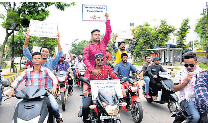
ପଶ୍ଚିମଓଡ଼ିଶା ଯୁବମାର୍ଚ୍ଚ ପସରୁ ଭୁବନେଶ୍ୱରରେ ଆୟୋଜିତ ବାଇକ୍ ଶୋଭାଯାତ୍ରା ।