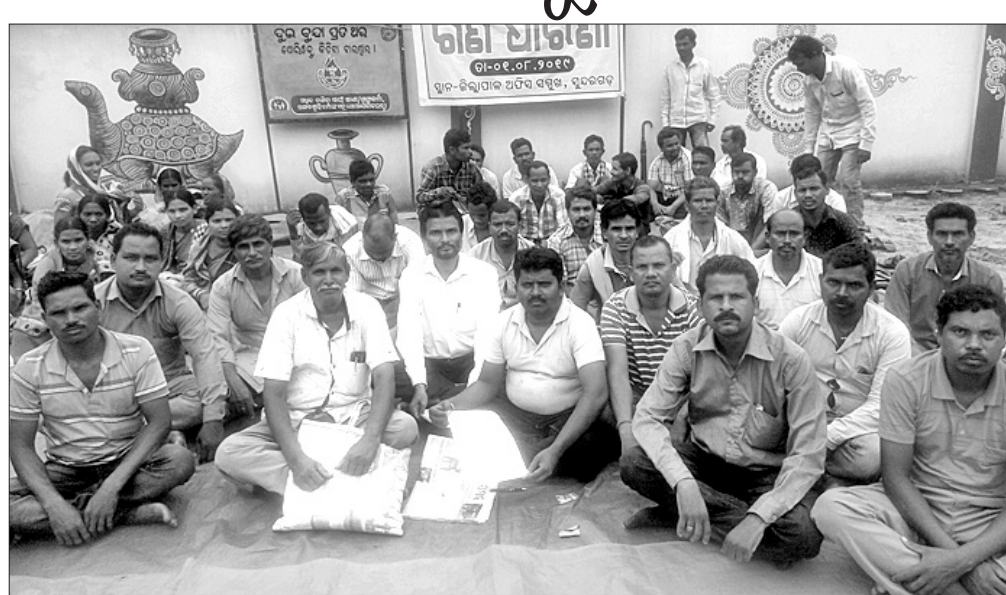
ଜିଲ୍ଲାପାଳଙ୍କ କାର୍ଯ୍ୟାଳୟ ସମ୍ମୁଖରେ ଛାତ୍ରାଛାତ୍ରୀଙ୍କ ମାତାପିତା, ଅଭିଭାବକ ଧାରଣା ଦେଇଛନ୍ତି।