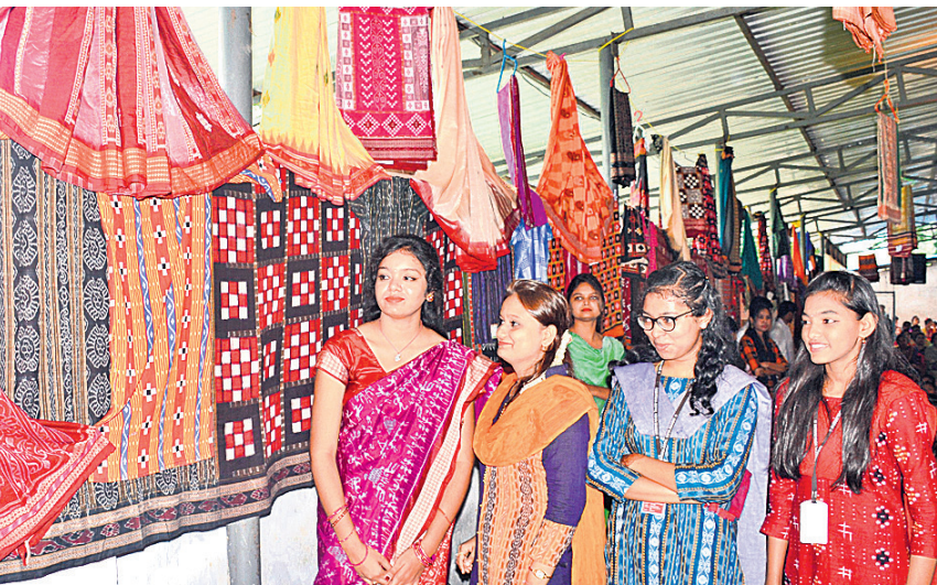
ସମ୍ବଲପୁରୀ ବିନ୍ଦୁ ଉପଲକ୍ଷେ ଶାଢ଼ି ଓ ପୋଷାକ ପ୍ରଦର୍ଶନୀ ।