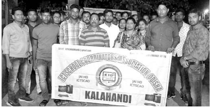
ଆଇସିଟି ସ୍କୁଲ କୋଅଡିନେଟର ଆୟୋଜିତ ସମ୍ମାନ ଓ ଉଷ୍ମ କର୍ମକର୍ମା ।

କଳାହାଣ୍ଡି ଜିଲ୍ଲା ସମେତ ଓଡ଼ିଶାର ବିଭିନ୍ନ ସରକାରୀ ଓ ସରକାରୀ ସ୍ୱିକ୍ତିପ୍ରାପ୍ତ ଉଚ୍ଚ ବିଦ୍ୟାଳୟରେ ରାଜ୍ୟ ସରକାରଙ୍କ ଦ୍ୱାରା ୨୦୧୪ଠାରୁ କମ୍ପ୍ୟୁଟର ଶିକ୍ଷା ପ୍ରଚଳନ ହୋଇଛି । ଇ-ବିଦ୍ୟାଳୟ ନାମକ ଏହି ପ୍ରୋଜେକ୍ଟର ନିୟୋଜନ, ପରିଚାଳନା ଓ ମାନବସମ୍ପଦ ନିୟୁକ୍ତି ପାଇଁ ଏକ ବେସରକାରୀ ସଂଗଠନ ଦିଆଯାଇଥିଲା ଏହି ଯୋଜନା ଦ୍ୱାରା ରାଜ୍ୟର ୪ ହଜାର ଉଚ୍ଚ ବିଦ୍ୟାଳୟରେ ଲକ୍ଷଲକ୍ଷ ଛାତ୍ରାଛାତ୍ରୀ ମାରଣାରେ କମ୍ପ୍ୟୁଟର ଶିକ୍ଷା ପାଇ ପାରୁଥିଲେ । ଏଥିସହିତ ୪ ହଜାରରୁ ଊର୍ଦ୍ଧ୍ୱ ଯୁବକଯୁବତୀ ମଧ୍ୟ ସ୍କୁଲ ଅଡ଼ିନେଟର ଭାବେ ନିଯୁକ୍ତି ପାଇଥିଲେ । ବେସରକାରୀ ସଂଗଠନ ରୁକ୍ମି ୨୦୧୯ରେ ଶେଷ ହେବା ପରେ ଆଇସିଟି ପ୍ରୋଜେକ୍ଟ ବନ୍ଦ ହେବାକୁ ଯାଇଛି । ଫଳରେ ଶିକ୍ଷା ବ୍ୟବସ୍ଥାରେ ବୟନର ପରିସ୍ଥିତି ସୃଷ୍ଟି ହୋଇଛି । ରାଜ୍ୟର ଲକ୍ଷଲକ୍ଷ ହାଇସ୍କୁଲ ଛାତ୍ରାଛାତ୍ରୀ