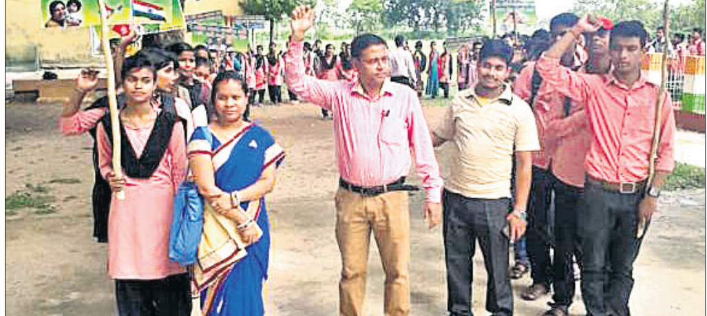
ଛାତ୍ରୀଛାତ୍ରଙ୍କ ପକ୍ଷରୁ ବାହାରିଥିବା ସଚେତନତା ଶୋଭାଯାତ୍ରା।

ଅନୁଭବ ହେଉଥିବା ସେ କହିଛନ୍ତି। ଉଲ୍ଲେଖଯୋଗ୍ୟ ଯେ, ଭଦ୍ରକ ହେଡ୍ ପୋଷ୍ଟଅଫିସ୍ ଅଧୀନରେ ୧୯୪୪ (ପୋଷ୍ଟମାଷ୍ଟରଙ୍କ ଆଇଡି) ନ ଥିବାରୁ ସେ ଉପଡାକଘର ପ୍ରତିଷ୍ଠା ହୋଇଛି। ଏହା ଅଧୀନରେ ସିମୁଲିଆ ବ୍ଲକର ବିଭିନ୍ନ ଗ୍ରାମାଞ୍ଚଳ ବରିହା, ଆନନ୍ଦପୁର, ବରି, ବାଟି, ଗୋବିନ୍ଦପୁର, କାମୁଡ଼ି, ମହମ୍ମଦପୁର, ଗାଁ ମାର୍କେଟିଂ, ତୁରୁଣ୍ଡା ଓ ସହିରାରେ ୧୦ଟି ଶାଖା ଡାକଘର ରହିଛି। ତେବେ ଉପଡାକଘର କାର୍ଯ୍ୟଭାର କମ୍ କରିବା ସହିତ ଉପଭୋକ୍ତାଙ୍କ ଭିଡ଼