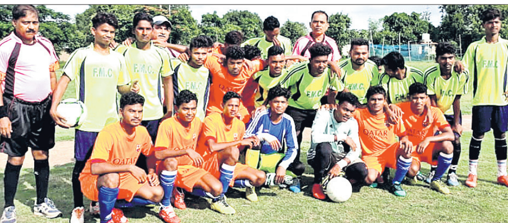
ପଡ଼ିଆରେ ଉଭୟ ଦଳର ଖେଳାଳି।

କଲିକତା ଯାଇ ଏକ ହୋଟେଲରେ ରହି କାବିକା ଅର୍ଜନ କରୁଥିଲେ। ଏବେ ସେ ହୋଟେଲରେ ନାହିଁ କି ଘରେ ମଧ୍ୟ ପହଞ୍ଚିନାହିଁ। ଏ ନେଇ ମା'ବାପା କଲିକତାର ଦୁର୍ଗାପୁର ଓ ରୂପସା ଥାନାରେ ଲିଖିତ ଭାବେ ଜଣାଇଛନ୍ତି। ଯେଲିଏ ପକ୍ଷରୁ ମଧ୍ୟ ନିଷେଧକ ପୁଅର ସନ୍ଧାନ ଜାରି ରହିଛି। ଦେହାନ୍ତ ବାଟିଲାଇଁ। ମା'ବାପାଙ୍କ ଯେଉଁଠି ସାମା ଚପି ଗଲାଣି। ପୁଅର ଆସିବା ବାଟକୁ ଚାହିଁ ଘରେ କେବେ ଚାଲି ଜିଲ୍ଲା ତ କେବେ ଭୋକ ଉପାସରେ ଦିନ ବିତାଇବାକୁ ପଡ଼ୁଛି।