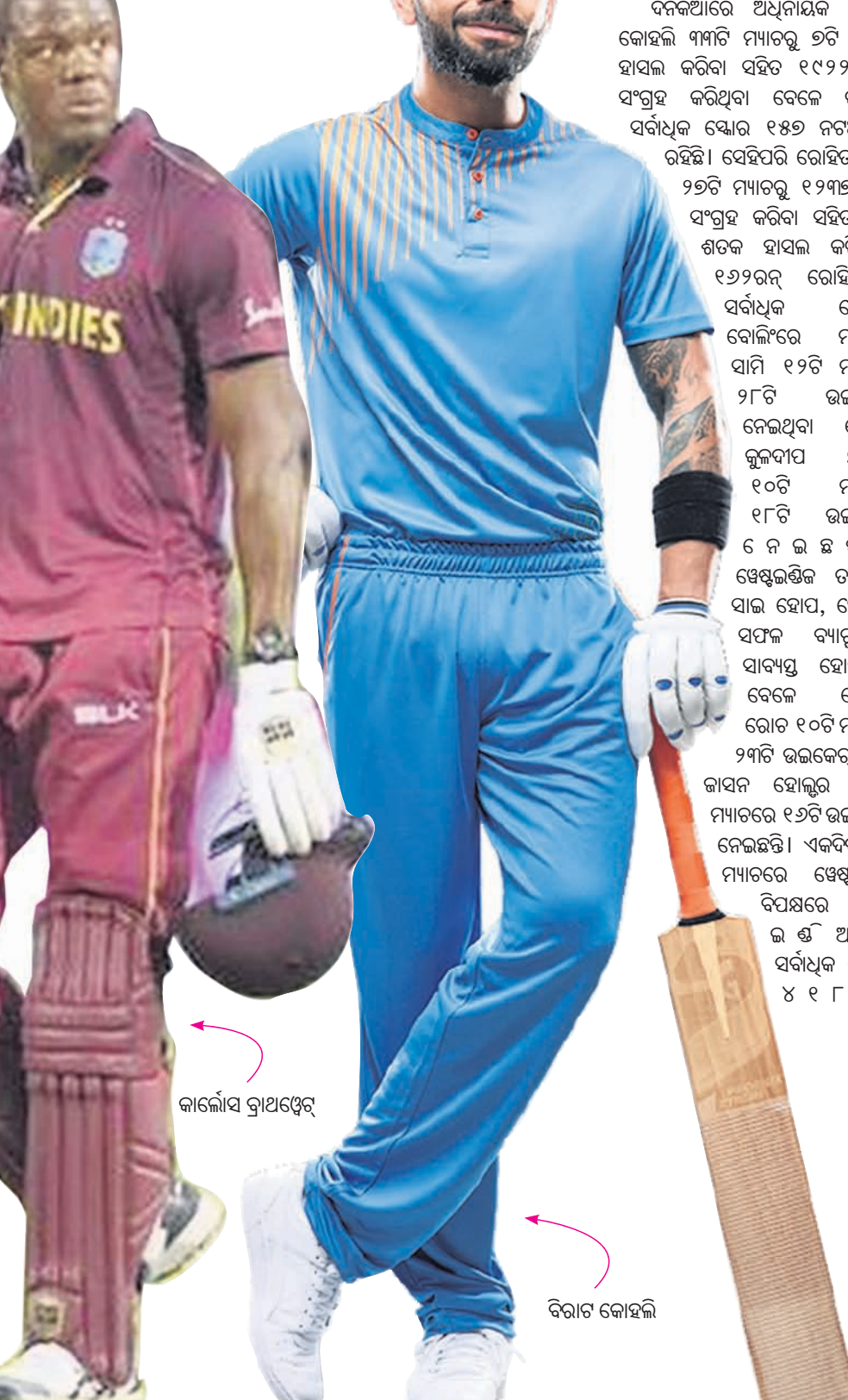
ରାଜ୍ୟରେ ଭାରତ ପ୍ରଥମ ସ୍ଥାନରେ ରହିଥିବା ବେଳେ ଷ୍ଟେସ୍‌ଲଣ୍ଡିଜ୍ ୮ମ ସ୍ଥାନରେ ରହିଛି। ଏକଦିବସୀୟ ମ୍ୟାଚ ରାଜ୍ୟରେ ଟିମ୍ ଇଣ୍ଡିଆ ୨ୟ ସ୍ଥାନରେ ରହିଥିବାବେଳେ ଷ୍ଟେସ୍‌ଲଣ୍ଡିଜ୍ ୯ମ ସ୍ଥାନରେ ରହିଛି। ସେହିପରି ଟି-୨୦ ମ୍ୟାଚ ରାଜ୍ୟରେ ଟିମ୍ ଇଣ୍ଡିଆ ୫ମ ସ୍ଥାନରେ ରହିଥିବା ବେଳେ ଷ୍ଟେସ୍‌ଲଣ୍ଡିଜ୍ ୯ମ ସ୍ଥାନରେ ରହିଛି। ୩ଟି ଯାକ

ଏପର୍ଯ୍ୟନ୍ତ ଭାରତ ୫୩୩ଟି ଟେଷ୍ଟ ମ୍ୟାଚ, ୯୭୫ଟି ଏକଦିବସୀୟ ଏବଂ ୧୧୫୮ଟି ଟି୨୦ ମ୍ୟାଚ ସହିତ ମୋଟ ୧୬୧୧୧ଟି ଅନ୍ତର୍ଗତୀୟ ମ୍ୟାଚ ଖେଳିଛି। ଏଥିମଧ୍ୟରୁ ଭାରତ ୧୫୦୮ଟି ଟେଷ୍ଟ, ୫୦୭୮ଟି ଏକଦିବସୀୟ ଏବଂ ୭୦୮୮ଟି ଟି୨୦ ମ୍ୟାଚରେ ବିଜୟୀ ହୋଇ ମୋଟ ୬୨୦୮ଟି ମ୍ୟାଚରେ ବିଜୟ ହାସଲ କରିଛି। ସେ ହି ପ ର୍ ଆଇସିସି ଟେଷ୍ଟ