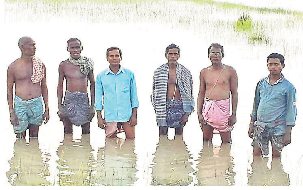
ପାଣିରେ ବୁଡ଼ି ରହିଥିବା ଚାଷଜମିରେ ଚାଷୀମାନେ ଠିଆ ହୋଇଛନ୍ତି।

ଭଦ୍ରକ ଜିଲ୍ଲା ତିହିଡ଼ି ତହସିଲ ଅଧୀନ କୁବରା ପଞ୍ଚାୟତର ୩ଟି ମୌଜାରେ ୩ ଶହ ଏକର ଚାଷଜମି ପାଣିରେ ବୁଡ଼ି ରହିଛି। ଏଥିଯୋଗୁଁ ଧାନ ଚାଷ କାର୍ଯ୍ୟ ଆରମ୍ଭ ହୋଇପାରୁ ନାହିଁ। ଗୋପାଳିଆ କେନାଲ ସଂସ୍କାର ହୋଇ ନ ଥିବାରୁ ଏ ପ୍ରକାର ସମସ୍ୟା ଉପୁଜିଛି। ଜଗନ୍ନାଥ ଗ୍ରାମବାସୀ ଗୁରୁବାର ଏ ସମ୍ପର୍କରେ ଭଦ୍ରକ ସାଲଦା କେନାଲ ଡିଭିଜନର ନିର୍ବାହୀ ସମ୍ପ୍ରଦାୟକୁ ଜଣାଇଛନ୍ତି। ଚାଷଜମିରୁ ଜଳ ନିଷ୍କାସନ ପାଇଁ କେନାଲ ସଂସ୍କାର କରିବା ଦିଗରେ ପଦକ୍ଷେପ ନେବାକୁ ସେମାନେ ଦାବି ଜଣାଇଛନ୍ତି। ପ୍ରକାଶ ଯେ, ଜଣାଣପୁରଠାରୁ କଷିତ ପର୍ଯ୍ୟନ୍ତ ଏକ ତଳେଇ ରାସ୍ତା ନିର୍ମାଣ ଯୋଗୁଁ ଜଳ ନିଷ୍କାସନରେ ବାଧା ସୃଷ୍ଟି ହୋଇଛି। ଏଥିଯୋଗୁଁ ଜଗନ୍ନାଥ, କଷିତ ଓ ପେଡ଼ଳା ମୌଜାର ୩ ଶହ ଏକର ଚାଷଜମି ପାଣିରେ ବୁଡ଼ି ରହିଛି। ପୂର୍ବରୁ ଏ ସମ୍ପର୍କରେ ବିଭାଗୀୟ କର୍ତ୍ତୃପକ୍ଷଙ୍କ ଦୃଷ୍ଟି ଆକର୍ଷଣ କରାଯିବା ପରେ କେନାଲ ଆଡ଼ିରେ ଏକ ବନ୍ଧ ନିର୍ମାଣ କରାଯାଇଥିଲା। ଉପରପୁଞ୍ଜରୁ ପାଣି ଛାଡ଼ିବା ଦ୍ୱାରା ଜଳ ନିଷ୍କାସନ ହୋଇ ନ ପାରି କଷିତ ଭାଙ୍ଗିଯାଇଥିଲା। କେନାଲ ବନ୍ଧ ହୋଇଥିବା ସ୍ଥାନର ଉତ୍ତରପାଶ୍ୱରେ ଥିବା କଳଭୈରବ କେତେକ ଲୋକ