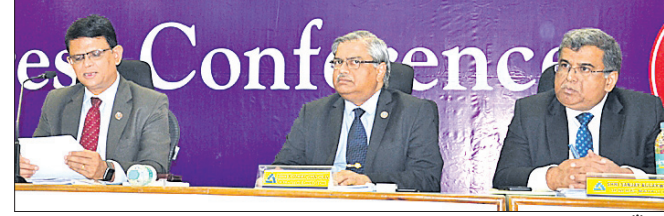
ଭୁବନେଶ୍ୱର, ୧-୮: ଆଲ୍ଲାହାବାଦ ବ୍ୟାଙ୍କର ଆର୍ଥିକ ଫଳାଫଳ ଘୋଷଣା କରାଯାଇଛି।

ଆଲ୍ଲାହାବାଦ ବ୍ୟାଙ୍କ ପକ୍ଷରୁ ଜୁନ ଟ୍ରେମାସ ଆର୍ଥିକ ଫଳାଫଳ ଘୋଷଣା କରାଯାଇଛି। ଏହି ସମୟ ସୁଦ୍ଧା ବ୍ୟାଙ୍କର ମୋଟ କାରବାର ୩.୬୭ ଲକ୍ଷ କୋଟି ଟଙ୍କା ଛୁଇଁଛି। ଗତ ବର୍ଷ ସମାନ ସମୟରେ ଏହା ୩.୬୫ ଲକ୍ଷ କୋଟି ଟଙ୍କା ରହିଥିଲା। ୨୦୧୯-୨୦ ଆର୍ଥିକ ବର୍ଷର ପ୍ରଥମ ଟ୍ରେମାସରେ ବ୍ୟାଙ୍କ ୧୨୮ କୋଟି ଟଙ୍କା ଲାଭ କରିଛି। ଏହି ସମୟରେ ବ୍ୟାଙ୍କର ପରିଚାଳନାଗତ ଲାଭ ୮୫.୫୫ କୋଟି ଟଙ୍କା ରହିଛି। ମୋଟ ଜମା କ୍ଷେତ୍ରରେ କାସାର ଅଂଶ