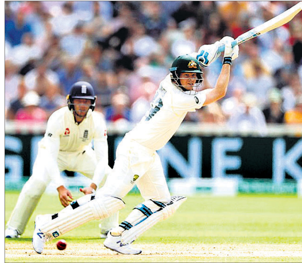
ଏକବାସ୍ତୁନାରେ ଲୁଚୁଆ ଶତକୀୟ ଇନିଂସ୍ ଅବସରରେ ଅଷ୍ଟ୍ରେଲିଆର ଷ୍ଟିଭ୍ ବ୍ଲିଥ ।