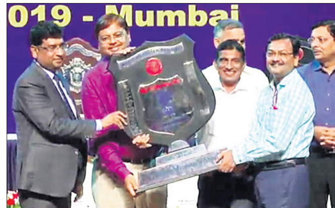
ଭୁବନେଶ୍ୱର, ୧-୮: ପୂର୍ବତନ ରେଳପଥକୁ ସମ୍ମାନନୀୟ ପୁରସ୍କାର ପ୍ରଦାନ କରାଯାଇଛି।

ପୂର୍ବତନ ରେଳପଥକୁ ସମ୍ମାନନୀୟ ପୁରସ୍କାର ପ୍ରଦାନ କରାଯାଇଛି। ପୂର୍ବତନ ରେଳପଥ ମହାପ୍ରବନ୍ଧକ ବିଦ୍ୟା ଭୂଷଣ ଓ ରେଳପଥର ପ୍ରଗତି ବିର ଉପଦେଷ୍ଟା ମ୍ୟାନେଜମେଣ୍ଟ ଶିଳ୍ପ ଓ କମ୍ପ୍ରେହେନ୍ସିଭ୍ ହେଲ୍ପ କେୟାର ଶିଳ୍ପ ପୁରସ୍କାର ପ୍ରଦାନ କରାଯାଇଛି। ମୁମ୍ବାଇରେ ଆୟୋଜିତ ରାଷ୍ଟ୍ର ସ୍ତରୀୟ ରେଳବାଇ ପୁରସ୍କାର ବିତରଣ ଉତ୍ସବରେ ପକ୍ଷତା ଲାଗି ରେଳଡିଏ ଏହି ପୁରସ୍କାର ଲାଭ କରିଛି। ରେଳ ବୋର୍ଡ୍ ଅଧ୍ୟକ୍ଷ ବିନୋଦ କୁମାର କେୟାର ଶିଳ୍ପ ଗ୍ରହଣ କରିଥିଲେ।