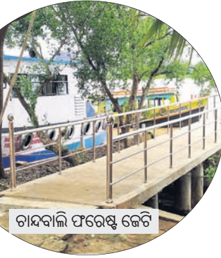
ଚାନ୍ଦବାଲି ପରେଷ୍ଟି ଜେଟି

ପାଇଲିନ, ହୁକୁହୁକୁ ଭଳି ସାପ୍ତମିକ ଝଡ଼ ସାଙ୍ଗକୁ ନିର୍ମାଣାଧୀନ ଭଦ୍ରକ-ଚାନ୍ଦବାଲି ରାସ୍ତା ଗଡ଼ କିଛିବର୍ଷ ହେବ ଚାନ୍ଦବାଲିର ପର୍ଯ୍ୟଟନକୁ ବହୁଳ ଭାବେ ପ୍ରଭାବିତ କରିଛି। ପର୍ଯ୍ୟଟନ ରତ୍ନରେ ଚାନ୍ଦବାଲିରୁ ଦୈନିକ ୧୦ରୁ ୧୨ଟି ବୋର୍ଡିଂ ପର୍ଯ୍ୟଟକ ଭିତରକନିକା ଯାଉଥିବା ବେଳେ ଏହା କମି ଦୈନିକ ୪ରୁ ୫ଟି ବୋର୍ଡିଂ ପହଞ୍ଚିଥିଲା ବୋଲି କେତେକ ରୁଟ୍ ଅପରେଟର ସୂଚନା