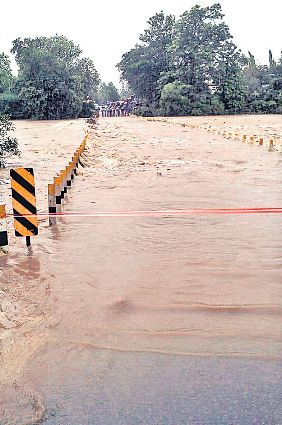
ମାଲକାନଗିରି ଜିଲ୍ଲା କାଲିମେଳା ବ୍ଲକ୍‌ର କାଙ୍ଗୁରୁକୋଣ୍ଡା ପୋଲ ଉପରେ ଶୁକ୍ରବାର ବନ୍ୟାଜଳ ପ୍ରବାହିତ ହେଉଛି। (ରିପୋର୍ଟ: ପୃଷ୍ଠା-୩)