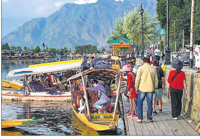
ଜମ୍ମୁ-କଶ୍ମୀରରେ ଆତଙ୍କବାଦୀ ଆକ୍ରମଣ ଆଶଙ୍କା କରି ହାଇଆଲର୍ଟ ଜାରି ପରେ ତାଲୁକା ସ୍ତରକୁ ଫେରୁଛନ୍ତି ଯାତ୍ରୀମାନେ।

ପାକିସ୍ତାନୀ ଆତଙ୍କବାଦୀ (ପିଓକେ)ରୁ ଜେଣ୍ଡ-ଇ-ମହମ୍ମଦ (କେଲଏମ) ସମେତ ଆଉ କେତେକ ସଙ୍ଗଠନର ଆତଙ୍କବାଦୀମାନେ ଉପତ୍ୟକାରେ ଅନୁପ୍ରବେଶ କରିଛନ୍ତି। କୁଲାଇ ଶେଖ ସପ୍ତାହରେ ୫ ସଶସ୍ତ୍ର ଆତଙ୍କବାଦୀ ନିୟନ୍ତ୍ରଣକର୍ତ୍ତା (ଏଲଡିଏ) ଅତିକ୍ରମ କରି ଜମ୍ମୁ-କଶ୍ମୀରରେ ଗୁଳିଚାଳି ପାକିସ୍ତାନୀର ଉଚ୍ଚ ଚାଲିମୁଦ୍ରାପୁ ଏହି ଆତଙ୍କବାଦୀମାନେ ଅମରନାଥ ଯାତ୍ରୀ ଓ ସୁରକ୍ଷା ଦାୟିତ୍ଵରେ ଥିବା ଯବାନମାନଙ୍କୁ ଆକ୍ରମଣ କରିପାରନ୍ତି ବୋଲି ଗୋଲ୍ଡା ସୂଚନା ମିଳିବା ପରେ ଉପତ୍ୟକାରେ ହାଇଆଲର୍ଟ ଜାରି କରାଯାଇଛି। ସେହିପରି ଅମରନାଥ ରାସ୍ତାରେ ପାକିସ୍ତାନୀ ନିର୍ମିତ ମାଇନ୍ ଓ ଅସ୍ତ୍ରଶସ୍ତ୍ର ମିଳିବା ପରେ ପ୍ରସ୍ତୁତ ହେଉଛି। ଏହିକ୍ରମରେ ଶୁକ୍ରବାର ଶୁକ୍ରବାର ତୁରନ୍ତ ଫେରିଆସିବା ପାଇଁ ଯାତ୍ରୀମାନଙ୍କୁ ନିର୍ଦ୍ଦେଶ ଦିଆଯାଇଛି। ଫେବୃୟାରୀ ୧୪ ମୂଲ୍ୟାମାନା ଆକ୍ରମଣରେ ୫୦ ସିଆରପିଏସ୍ ଯବାନଙ୍କ ଜୀବନ ନେଇଥିବା ଜେଲଏମ୍ ଜମ୍ମୁ-କଶ୍ମୀରରେ ପୁଣି ଏକ ବଡ଼ପରାୟଣ