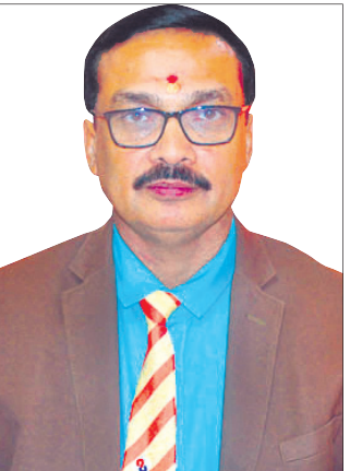
ରହିଛି। ପ୍ରତିଷ୍ଠାତା ବ୍ୟାଙ୍କର ଅଭିଭୂକ୍ତି, କୃଷି ଏବଂ ଏମ୍‌ଏସ୍‌ଏମ୍‌ଇକୁ ଅଧିକ ସହାୟତା କ୍ଷେତ୍ରରେ ଡାକ୍ତର ଅଭିଜିତା

ବର୍ଷ ମଧ୍ୟ ଭଲ ବୁକିଂ ମିଳିବା ନେଇ ଆଶାବାଦୀ ଥିବା ସେ ପ୍ରକାଶ କରିଛନ୍ତି। ସେ ଆହୁରି ମଧ୍ୟ କହିଛନ୍ତି, ଅନ୍ୟ ପ୍ରମୁଖ ପର୍ଯ୍ୟଟନ ତେଷ୍ଟନେଶନଗୁଡ଼ିକ ମଧ୍ୟରେ କ୍ୟାମ୍ପେନ୍, ପିଲିପାଇନ୍, ଅଷ୍ଟ୍ରେଲିଆ ଏବଂ ଇଣ୍ଡୋନେସିଆ ଭଳି ସ୍ଥାନ ରହିଛି।