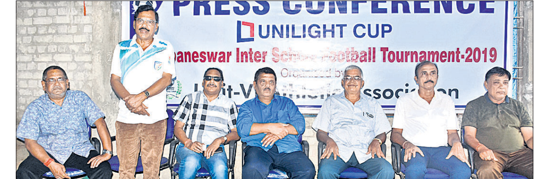
କର୍ମକର୍ମୀମାନେ ଟୁର୍ଣ୍ଣାମେଣ୍ଟ ସମ୍ପର୍କରେ ସୂଚନା ଦେଉଛନ୍ତି।

ଭୁବନେଶ୍ୱର, ୨୮ (କ୍ରୀଡ଼ା ପ୍ରତିନିଧି) ଯୁନିଟ୍-୧ ଆଥଲେଟିକ୍ ଆସୋସିଏସନ୍ ଆନୁକୁଲ୍ୟରେ ଯୁନିଟ୍‌ଲଭ୍ କପ୍ ଭୁବନେଶ୍ୱର ଆନ୍ତଃସ୍କୁଲ ଫୁଟବଲ ଟୁର୍ଣ୍ଣାମେଣ୍ଟ ଚଳିତମାସ ୫ରୁ ଆରମ୍ଭ ହେବ। ଯୁନିଟ୍-୧ ବାଳକ ଉଚ୍ଚ ବିଦ୍ୟାଳୟ ଖେଳ ପଡ଼ିଆରେ ଏହା ସେପ୍ଟେମ୍ବର ୧ ପର୍ଯ୍ୟନ୍ତ ଚାଲିବ। ଟୁର୍ଣ୍ଣାମେଣ୍ଟର ୩୦ତମ ସଂସ୍କରଣରେ ଏଥର ମୋଟ ୨୪ଟି ଦଳ ଅଂଶଗ୍ରହଣ କରିବେ। ଦଳ ଗୁଡ଼ିକୁ ୮ଟି ଗ୍ରୁପରେ ବିଭକ୍ତ କରାଯାଇ ପ୍ରତି ଗ୍ରୁପରେ ୩ଟି ଲେଖାଏ ଦଳକୁ ସ୍ଥାନୀତ କରାଯାଇଛି। ଗ୍ରୁପ୍‌ଏ’ରେ ଯୁନିଟ୍-୨ ସରକାରୀ ବାଳକ ଉଚ୍ଚ ବିଦ୍ୟାଳୟ, କିସ୍, ଆଇଆରସି ସରକାରୀ ଉଚ୍ଚ ବିଦ୍ୟାଳୟ, ଗ୍ରୁପ୍‌ବି’ରେ କଲିଙ୍ଗ ବିଦ୍ୟାପାଠ, ରଞ୍ଜନପୁର ଶ୍ରୀ ଅରବିନ୍ଦ ନୋଡାଲ ବିଦ୍ୟାପାଠ, ଲୋୟଲା ଓଡ଼ିଆ ସ୍କୁଲ, ଗ୍ରୁପ୍‌ସି’ରେ ଡିଏଭି ଚନ୍ଦ୍ରଶେଖରପୁର, ମଦର୍ସ ପବ୍ଲିକ୍ ସ୍କୁଲ, ରାମକୃଷ୍ଣ ଶିକ୍ଷାକେନ୍ଦ୍ର, ଗ୍ରୁପ୍‌ଡି’ରେ ଚାଇମ୍ବୁ ରୁରୁକ୍ଲ, ବିଜେଇଏମ୍-୧, ଡିଏମ୍ ସ୍କୁଲ, ଗ୍ରୁପ୍‌ଇ’ରେ ଯୁଏଚ୍‌ସି ଭୁବନେଶ୍ୱର ସ୍କୁଲ,