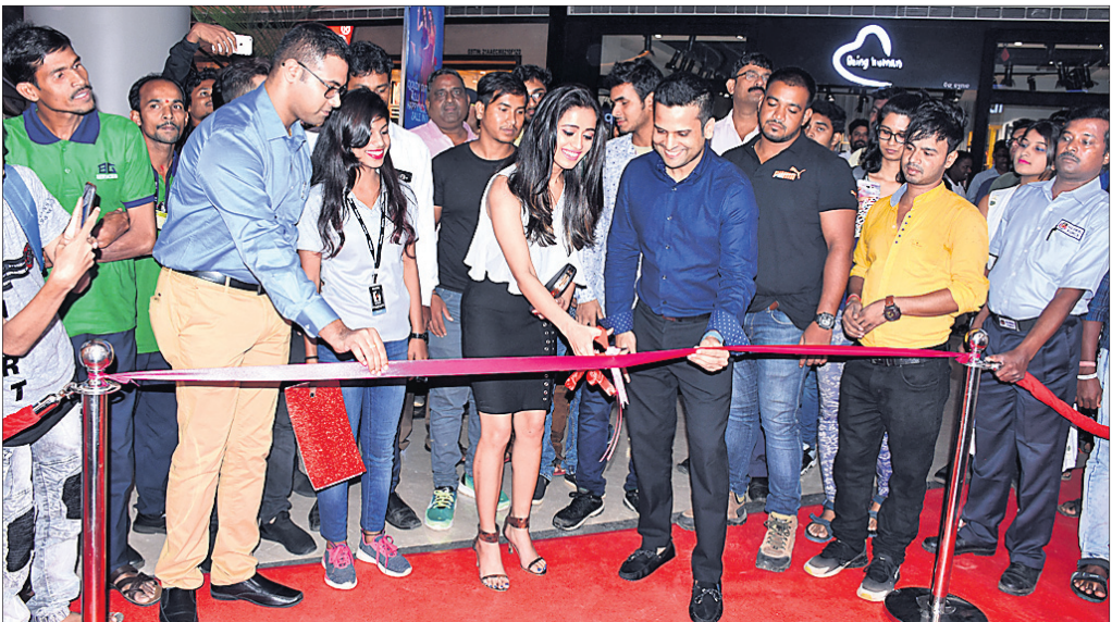
ଆଇଡେଷ୍ଟିନିର ନୂଆ ଷ୍ଟୋର ଶୁଭାରମ୍ଭ

କେନ୍ଦ୍ର ଅର୍ଥମନ୍ତ୍ରୀ ନିର୍ମଳା ସୀତାରାମନ୍ ସୋମବାର ରାଷ୍ଟ୍ରାୟତ୍ତ ଓ କେନ୍ଦ୍ରର ବୃହତ୍ ଘରୋଇ ବ୍ୟାଙ୍କ (ସିଏସ୍‌ସ୍‌)ର ସିଲଡକୁ ଭେଟିବେ।