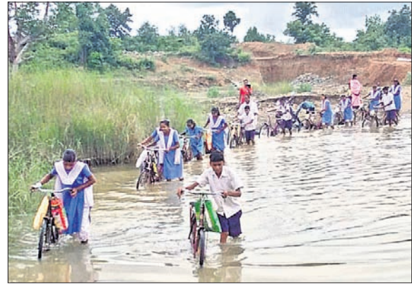
ଛାତ୍ରାଛାତ୍ରମାନେ ବିପଦପୂର୍ଣ୍ଣ ଭାବେ ହରିହରଯୋର ପାରି ହୋଇ ସ୍କୁଲ ଯାଉଛନ୍ତି।

ପ୍ରତ୍ୟହ ଉଚ୍ଚ ବାରଦେଇ ସାଗରୋରୀ ସ୍କୁଲକୁ ଯାଉଥାନ୍ତି। ପୂର୍ବରୁ ହରିହରଯୋର ପ୍ରକଳ୍ପ ଉପର ଆସି ବେଳ ଛାତ୍ରାଛାତ୍ର ଯିବା ଆସିବା କରୁଥିଲେ। ମାତ୍ର ଉଚ୍ଚ ରାସ୍ତା ଏବେ ଖାଲଖାମା ପୂର୍ଣ୍ଣ ହେବା ସହିତ ଶୋରନାୟ ହୋଇପଡିଛି। ବାରମ୍ବାର ଅଭିଯୋଗ କଲେ ମଧ୍ୟ ଏଥିପ୍ରତି କେହି ଦୃଷ୍ଟି ଦେଇ ନାହାନ୍ତି। ଫଳରେ ସେହି ବାରରେ ଏବେ ଯିବା ଆସିବା ସମ୍ଭବ ହେଉନାହିଁ। ଏହି ରାସ୍ତାରେ ଅନେକ ସମୟରେ ଭୂର୍ଜନଶାଳା ମଧ୍ୟ ହେଉଛି। ତେଣୁ ଛାତ୍ରାଛାତ୍ରମାନେ ବାଧ୍ୟ ହୋଇ ଯୋର ପାରି ହୋଇ ସ୍କୁଲ ଯାଉଛନ୍ତି। ଡିକିଏ ବର୍ଷା ହେଲେ ଯୋରରେ ପାଣି ଆସୁଛି। ପିଲାଏ ବହିସ୍ତ୍ର ଓ ସାଲକେଲ ଧରି ୩୫ ଟୁଟା ପାଣି ପାରି ହେଉଥିବା ଦେଖିବାକୁ