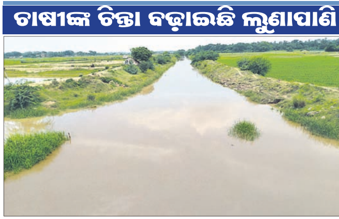
ଚାଷୀଙ୍କ ଚିତ୍ତା ବହାଇଛି ଲୁଣାପାଣି

ଭଦ୍ରକ ଜିଲ୍ଲା ଚାନ୍ଦବାଲି ବ୍ଲକ ଅଧୀନ ବିଭିନ୍ନ ନଦୀ ଓ ଏହାର ଶାଖାନଦୀରେ ସଂଯୁକ୍ତ ଜଳସେଚନ ପାଇଁ ଉଦ୍ଦିଷ୍ଟ କେନାଲଗୁଡ଼ିକ ଚିତ୍ତୁଡ଼ି ଚାଷୀଙ୍କ କର୍ତ୍ତାରେ ରହିଛି। ନଦୀ ଓ କେନାଲକୁଳିଆ ଚାଷକର୍ମୀ, ଗୋଚର ଓ ଅନାବାଦୀରେ ବେଆଇନ ଚିତ୍ତୁଡ଼ି ଘେରି ଖୋଳାଯାଇଛି। ଏବେ ଚିତ୍ତୁଡ଼ି ଫାର୍ମକୁ ଲୁଣାପାଣି ପ୍ରବେଶ କରାଇବା ପାଇଁ ଚାଷୀ କେନାଲର ଛୁଇଁ ଗେର୍ବକୁ ନିୟନ୍ତ୍ରଣ କରିବା ଓ ଆଡ଼ିବନ୍ଧ କାଟିବା କାରଣରୁ ଅବାଧରେ କେନାଲରେ ଲୁଣାପାଣି ପ୍ରବେଶ କରୁଛି। ଫଳରେ ଏହା ଅନ୍ୟ ଚାଷ ଅନୁପଯୋଗୀ ହେଉଛି।