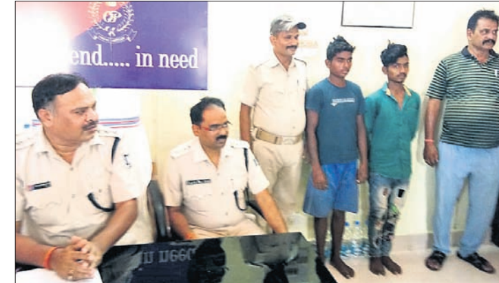
ପୋଲିସ୍ ହେପାକଟରେ ଅଭିଯୁକ୍ତ ଦୁଇ ଭାଇ ।