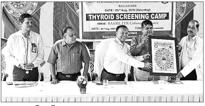
ଉତ୍ସବରେ ଉପସ୍ଥିତ ଅତିଥି।

ବାଲେଶ୍ୱର ସେକ୍ସଲ ସ୍କୁଲ ଛକ ନିକଟ ଆଇଟିଆର୍ କଲୋନୀରେ ଏମ୍ସ ସାଟେଲାଇଟ୍ ଓପିଡି ସେଣ୍ଟରର ଏକ ଶତ ଦିବସ ପୂର୍ଣ୍ଣ ଉପଲକ୍ଷେ ଏକ ସ୍ୱାସ୍ଥ୍ୟ ଶିବିର ଶନିବାର ଅନୁଷ୍ଠିତ ହୋଇଯାଇଛି।