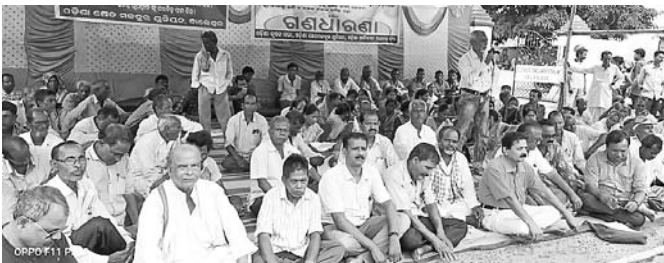
'କୃଷକ ସଂଘର୍ଷ ସମିତି' ବାଲେଶ୍ୱର ଶାଖା ପକ୍ଷରୁ ଗଣଧାରଣା ଦିଆଯାଇଛି।

ବାଲେଶ୍ୱର ଜିଲ୍ଲାକୁ ମଠୁଡ଼ି ଘୋଷଣା ଦାବିରେ 'କୃଷକ ସଂଘର୍ଷ ସମିତି' ବାଲେଶ୍ୱର ଶାଖା ପକ୍ଷରୁ ଗଣଧାରଣା ଦିଆଯାଇଥିଲା।