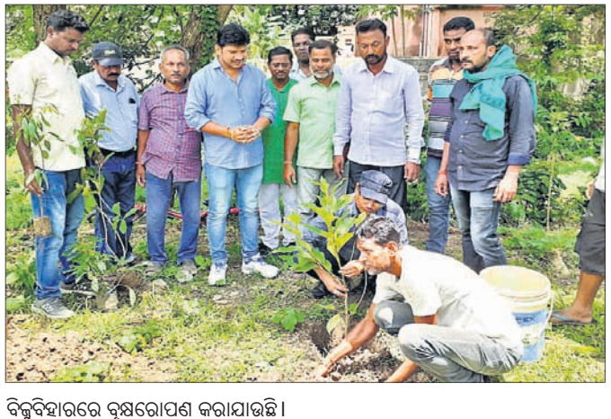
ବିଭୁବନୀରେ ବୃକ୍ଷରୋପଣ କରାଯାଇଛି।