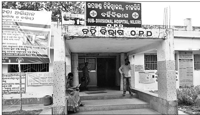
ନୀଳଗିରି ଉପଖଣ୍ଡ ଚିକିତ୍ସାଳୟ।

ବାଲେଶ୍ୱର ଜିଲା ନୀଳଗିରି ଉପଖଣ୍ଡ ଚିକିତ୍ସାଳୟରେ ସ୍ୱାସ୍ଥ୍ୟସେବା ବିପର୍ଯ୍ୟୟ ହୋଇପଡ଼ିଛି। ଉପଯୁକ୍ତ ସ୍ୱାସ୍ଥ୍ୟସେବା ନ ପାଇ ଘ୍ନାନାଥ ଅଞ୍ଚଳର ବାସିନ୍ଦା ସମସ୍ୟାର ସମ୍ମୁଖୀନ ହେଉଛନ୍ତି।