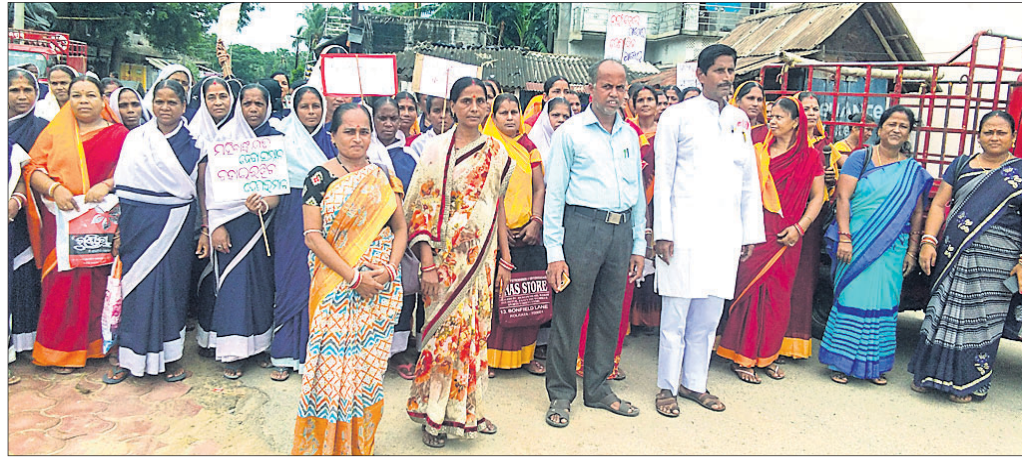
ଶୋଭାଯାତ୍ରାରେ ବାସୁଦେବପୁର ସିଡିପିଓ, ଅଜନଓଡି କର୍ମୀ ଓ ଅନ୍ୟମାନେ।