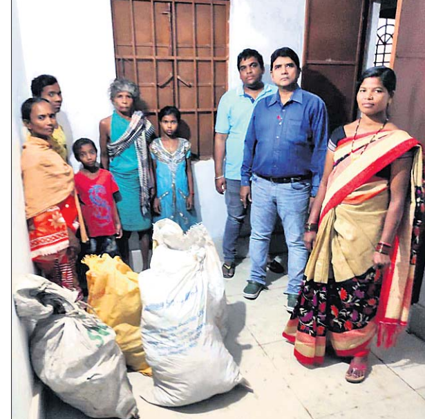
ପଞ୍ଚାୟତ କାର୍ଯ୍ୟାଳୟରେ ଅଭିଆନ ହୋଇଥିବା ପରିବାର ।

ହେଉଛି। ବନ୍ୟଜନ୍ତୁମାନେ ବିଲୋପନ ଦ୍ୱାରା ଦେଶରେ ପହଞ୍ଚିଲେଣି। ଜଙ୍ଗଲକୁ ବଞ୍ଚାଇବାକୁ ହେଲେ ଗଛ ନ କାଟିବା ଏବଂ ଗଛ ଲଗାଇବା ଆମର କର୍ତ୍ତବ୍ୟ ହେବା ଆବଶ୍ୟକ ବୋଲି ସେ କହିଥିଲେ। ବୃକ୍ଷର ଔଷଧୀୟ ଗୁଣ ଉପରେ ସୂଚନା ଦେଇ ସମ୍ମାନିତ ଅତିଥି ନାୟକ ବୃକ୍ଷରୋପଣ କ୍ଷେତ୍ରରେ ସଂସଦ ସଭାପତି ନାୟକଙ୍କ ଉଦ୍ୟମ ପ୍ରଶଂସନାୟ। ସେ ସାହିତ୍ୟ ସେବା କରିବା ସହ ପ୍ରତି ବର୍ଷ ରତ୍ନରେ ଗଛ ଲଗାନ୍ତି। ସେ ଆମପାଇଁ ପ୍ରେରଣାର ଉତ୍ସ ବୋଲି କହିଥିଲେ। କେବଳ ଓଡ଼ିଆ ଭାଷା ସାହିତ୍ୟର ପ୍ରଚାର ପ୍ରସାର କରିବା ବୃତ୍ତେ, କିଛି ସାମାଜିକ କାମ କରିବା ମୋର ଚୁଚି ବୋଲି ସଭାପତି ନାୟକ କହିଥିଲେ। ସାମାଜିକ ସେବାରେ ଧ୍ୟାନ ଦେଇଥିଲେ।