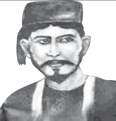
ପ୍ୟାରୀମୋହନ ଆଚାର୍ଯ୍ୟଙ୍କ ଜୟନ୍ତୀ ଉପଲକ୍ଷେ

ନାମକ ଏକ ଲେଖା ପ୍ରକାଶ କରିବାକୁ ମଧ୍ୟ ପଛନ୍ତୁଆ ଦେଇ ନ ଥିଲେ, ଯାହାର ପରିଣାମ ସ୍ୱରୂପ ତାଙ୍କର ପାଠପଢ଼ାରେ ଡୋରିବନ୍ଧିତା ପଡ଼ିଥିଲା। ସେ 'ଉଜ୍ଜ୍ୱଳପୁତ୍ର' ନାମରେ ୧୮୭୧ରେ ନିଜ ସମ୍ପାଦନାରେ ଏକ ଖବରକାଗଜ ପ୍ରକାଶ କରିଥିଲେ। ଇଂରେଜ ସରକାରଙ୍କ ଦ୍ୱାରା ପ୍ରତିଷ୍ଠିତ ସ୍କୁଲକୁ ସତକଥା କହି ବିଦାୟ ନେଲାପରେ ସେ ଗଭୀର ଭାବରେ ଚିନ୍ତା କରିଥିଲେ ସେସରକାରୀ ପ୍ରସ୍ତରରେ ଏକ ବିଦ୍ୟାଳୟ ପ୍ରତିଷ୍ଠା କରିବା ପାଇଁ। ବହୁ ପ୍ରତିବନ୍ଧକ ସତ୍ତ୍ୱେ କଟକ ବିଦ୍ୟାଳୟର ସ୍ଥିତି