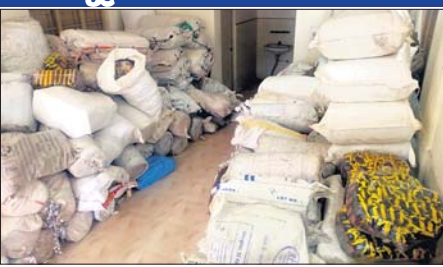
କଟକ ହୋଇଥିବା ଗୁରୁତ୍ୱା।