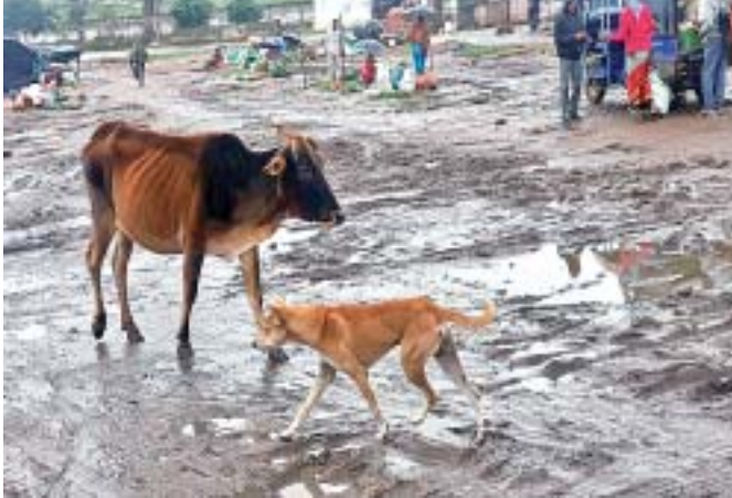
ଭେଣ୍ଟିଂ ଜୋନର ଅବସ୍ଥା ଶୋଚନୀୟ ହୋଇପଡ଼ିଛି ।

ସେମିଲିଗୁଡ଼ା, ୪୮ (ସ.ପ୍ର.) ସେମିଲିଗୁଡ଼ା ଭେଣ୍ଟିଂ ଜୋନରେ ଅବ୍ୟବସ୍ଥା ଭିତରେ ବେପାର କରୁଥିବା କ୍ଷୁଦ୍ର ଚାଷୀଙ୍କୁ ମିଳିବ ପିଣ୍ଡି ସୁବିଧା। ସେମାନଙ୍କର ଦୀର୍ଘଦିନର ଦାବି ପୂରଣ ହେବ। ଉଲ୍ଲେଖଯୋଗ୍ୟ ଯେ କ୍ଷୁଦ୍ରଚାଷୀଙ୍କ ପାଇଁ କୁହୁଲିଠାରେ ଏକ ପିଣ୍ଡି ଖୋଲାଯାଇଥିଲା; କିନ୍ତୁ ତାହା ସେମାନଙ୍କ କାମରେ ଲାଗୁ ନ ଥିବାରୁ ଚାଷୀମାନେ ରାଜରାସ୍ତାରେ ବେପାର କରୁଥିଲେ। ସେହିପରି ସେମିଲିଗୁଡ଼ା ଓ ସୁନାବେଡ଼ା ଜାତୀୟ ରାଜପଥ ନିକଟରେ ଏକ ଭେଣ୍ଟିଂ ଜୋନ ଖୋଲାଯାଇ ସେଠାରେ ସାମୁହିକ ହାଟ ବସୁଛି। ଖରା ଓ ବର୍ଷାରେ ପଦାରେ ପରିବା ରଖି ଦିନିକା ବେଳେ ଚାଷୀ ଅନେକ ଅସୁବିଧାର ସମ୍ମୁଖୀନ ହେଉଛନ୍ତି। ଏହି ଭେଣ୍ଟିଂ ଜୋନ ହାଟରେ ନନ୍ଦପୁର, କୁହୁଲି, ପଞ୍ଚାଙ୍ଗ, ସେମିଲିଗୁଡ଼ା, ସୁନାବେଡ଼ା, ସୁବାଇ, ଶୁଣ୍ଠିପୁଟ, ତୋଳିଆୟ, ମାଳତୋଳିଆୟ, ରେଙ୍ଗା ଅଞ୍ଚଳର ଶହ ଶହ କ୍ଷୁଦ୍ରଚାଷୀ