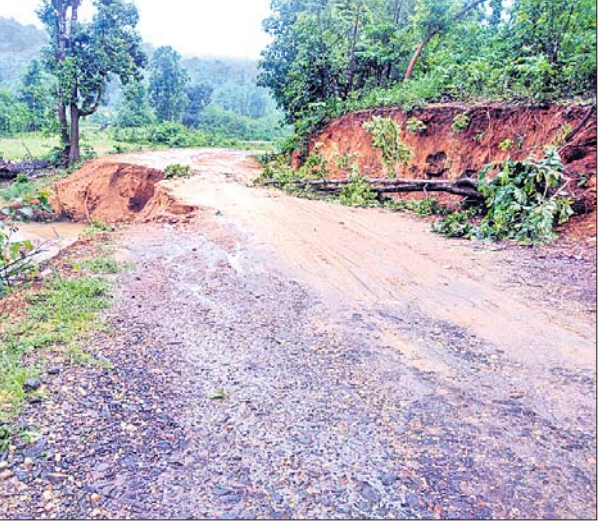
ବର୍ଷାଯୋଗୁ ରାସ୍ତା ଧୋଇହୋଇ ଯାଇଛି ।

ଖାଇଯିବ। ମାତକାପଦର ଓ ବଡ଼ଦୁରାଳ ପଞ୍ଚାୟତ ଜିଲ୍ଲାଠାରୁ ଯୋଗାଯୋଗରୁ ବିଚ୍ଛିନ୍ନ ହୋଇପଡ଼ିବ ବୋଲି ଅଞ୍ଚଳବାସୀ ଅଭିଯୋଗ କରିଛନ୍ତି। ଏନେଇ ବିଭାଗୀୟ ଅଧିକାରୀ କୌଣସି ପଦକ୍ଷେପ ନେଉନାହାନ୍ତି। ରାସ୍ତାକାମ ବେଳେ ବିଭାଗୀୟ ଗାଜରାଜଗୁମ୍ଫା ଉଭୟ ଠିକାଦାର ଓ ଅଧିକାରୀ ଅଣଦେଖା କରୁଥିବାରୁ ଏପରି ସମସ୍ୟା ଉତ୍ପନ୍ନ ହୋଇ ବୋଲି ଜଣାପଡ଼ିଛି।