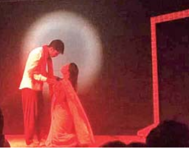
ମଞ୍ଚରୁ ନାଟକର ଏକ ଦୃଶ୍ୟ ।

ରପ୍ତାନ୍ତି ହେଉଛି। କ୍ଷୁଦ୍ରଚାଷୀମାନେ ବିକ୍ରି କରିବାକୁ ହେଲେ ସେମାନେ ଏହା ପୂର୍ବଦିନ ସନ୍ଧ୍ୟାରେ ଆସି ସ୍ଥାନ ନିରୂପଣ କରିବା ସହ କୌଣସି ସୁବିଧା ନଥିବାରୁ ସାରା ରାତି ଖୋଲା ଆକାଶ ତଳେ ରହୁଛନ୍ତି, ଏହି କ୍ଷୁଦ୍ର ଚାଷୀଙ୍କ ପାଇଁ ଆଗାମୀ ଦିନରେ ପିଣ୍ଡି ବ୍ୟବସ୍ଥା କରାଯିବ।