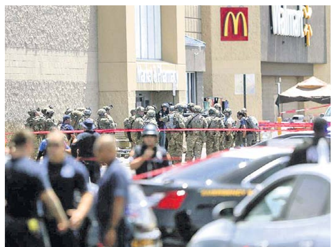
ଏଲ୍ ପାସୋରେ ଖୁଲ୍‌ମାର୍ଟ୍ ସ୍ଟୋରରେ ଆକ୍ରମଣ ପରେ ପୋଲିସ୍‌ର ତଦାୟନ।

ଓଶିଂଟନ/କ୍ୟୁଷ୍ଟନ, ୪୮୮ (ପି.ଟି.) ଆମେରିକାରେ ୨୪ ଘଣ୍ଟା ମଧ୍ୟରେ ୨ଟି ଭୁଲିକାଣ୍ଡ ଘଟିଛି। ଏଥିରେ ୩୦ ଜଣଙ୍କ ମୃତ୍ୟୁ ହେବା ସହ ଅନେକ ଆହତ ହୋଇଛନ୍ତି। ପ୍ରଥମ ଭୁଲିକାଣ୍ଡ ଶନିବାର ଟେକ୍ସାସ୍‌ର ସାମାନ୍ତ ସହର ଏଲ୍ ପାସୋରେ ଥିବା ଏକ ଜନଗହଳିପୂର୍ଣ୍ଣ ଖୁଲ୍‌ମାର୍ଟ୍ ସ୍ଟୋରରେ ହୋଇଥିଲା। ଜଣେ ୨୧ ବର୍ଷୀୟ ଯୁବକ ବନ୍ଧୁକକୁ ଆଖୁଡ଼କା ଭୁଲି ଚଳାଇବାରୁ ୨୦ ଜଣ ନିହତ ହୋଇଥିବାବେଳେ ଅନ୍ୟ ୨୬ ଜଣ ଆହତ ହୋଇଥିଲେ। ଏହାର କିଛି ଘଣ୍ଟା ପରେ ଓହାରେୟାର ଡେଲ୍‌ସ୍‌ରେ ଅନ୍ୟ ଏକ ଭୁଲିକାଣ୍ଡରେ ୯ ଜଣଙ୍କ ମୃତ୍ୟୁ ହୋଇଛି ଏବଂ ୧୬ ଜଣ ଆହତ ହୋଇଛନ୍ତି। ପୁରୁଣା କର୍ମାଳ୍ ଭୁଲିରେ ଆକ୍ରମଣକାରୀ ନିହତ ହୋଇଛନ୍ତି। ଭୁଲି ଭୁଲିକାଣ୍ଡକୁ ନେଇ ଆମେରିକାରେ ଆତଙ୍କର ବାତାବରଣ ସୃଷ୍ଟି ହୋଇଛି। ଶନିବାର ସକାଳେ ଖୁଲ୍‌ମାର୍ଟ୍ ସ୍ଟୋର ଚକଟେଇ ଥିଲା। ଲୋକମାନେ