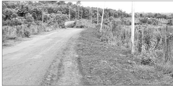
ରାୟାରେ ପୋତା ହୋଇଥିବା ବିଦ୍ୟୁତ୍ ଖୁଣ୍ଟ।

କନସାଧାରଣକୁ ମୌଳିକ ସୁବିଧା ଯୋଗାଇ ଦେବା ପାଇଁ ଚଞ୍ଚୁଆ ଏନଏସିରେ ପଥପ୍ରାନ୍ତ ଆଲୋକ ସହ ବିଭିନ୍ନ ଖାତରେ ବିଭିନ୍ନ ଆଲୁଅ ବ୍ୟବସ୍ଥା କରାଯାଇଛି।