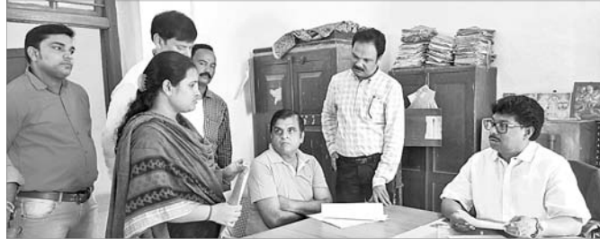
ରାଜ୍ୟ ମନ୍ତ୍ରୀ ସୁଦାମ ମାରାଣ୍ଡି ବାରିପଦା ତହସିଲରେ ସମାକ୍ଷା କରୁଛନ୍ତି