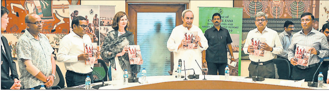
ପୁଣ୍ୟମନ୍ତ୍ରୀ ନବୀନ ପଟ୍ଟନାୟକ ଓ ଅନ୍ୟ ପଦାଧିକାରୀଙ୍କ ଦ୍ୱାରା ସଚିବାଳୟରେ ଫନୀ ସମ୍ପର୍କିତ ରିପୋର୍ଟ ଉନ୍ମୋଚନ କରାଯାଇଛି ।