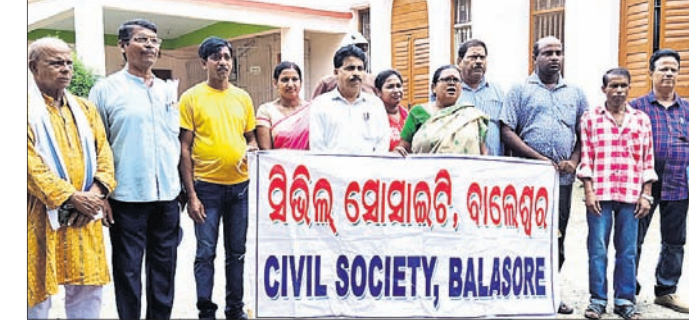
ଜିଲ୍ଲାପାଳଙ୍କ ଅଫିସ୍ ସମ୍ମୁଖରେ ସିଭିଲ ସୋସାଇଟିର ସଦସ୍ୟାସବସ୍ୟ।