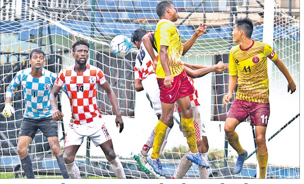
କଟକ: ବାରବାଟୀ ଷ୍ଟାଡିୟମରେ ମଙ୍ଗଳବାର ରାଧାରମ୍ଭ କ୍ଲବ୍ ଓ ଓଡ଼ିଶା ପୋଲିସ୍ ମଧ୍ୟରେ ଅନୁଷ୍ଠିତ ପାଠିକ ଟ୍ରାଣିଂଗ୍ ଏକ ମ୍ୟାଚ୍।