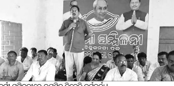
ଉଦକା ନିର୍ବାଚନପଞ୍ଚକାରେ ସାଂଗଠନିକ ସ୍ଥିତି ସକାଞ୍ଚିତ ପାଇଁ ବିକଳ ପ୍ରୟାସ ଆରମ୍ଭ କରିଛି।

ଉଦକା, ୬।୮ (ଡି.ଏନ୍.ଏ.) ଉଦକା ନିର୍ବାଚନପଞ୍ଚକାରେ ସାଂଗଠନିକ ସ୍ଥିତି ସକାଞ୍ଚିତ ପାଇଁ ବିକଳ ପ୍ରୟାସ ଆରମ୍ଭ କରିଛି। ଏଥିନେଇ ରବିବାର ନିର୍ବାଚନପଞ୍ଚକାପ୍ରଧାନ ଏକ କର୍ମୀ ସମ୍ମିଳନୀ ସ୍ଥାପନା ଏନଏସିର ୧୨ ନଂ ୱାର୍ଡ ସ୍ଥିତ ବିଜୁ ବାଗାନ ପଡ଼ିଆଠାରେ ଅନୁଷ୍ଠିତ ହୋଇଥିଲା। ବିଧାନସଭା ଓ ଲୋକସଭା ନିର୍ବାଚନରେ ସକଳ ପରାଜୟକୁ ନେଇ ଉପସ୍ଥିତ ନେତା ଏବଂ କର୍ମୀ ସମୀକ୍ଷା କରିଥିଲେ। ତେବେ ଆଗାମୀ ଦିନରେ ଏନଏସି ନିର୍ବାଚନକୁ ଦୃଷ୍ଟିରେ