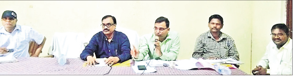
ସିପୁଲିଆ ବ୍ଲକ ସମ୍ମିଳନୀ ପ୍ରକୋଷ୍ଠରେ ଅନୁଷ୍ଠିତ ଆଲୋଚନାଚକ୍ରରେ ବିଭାଗ ସୂଚନା ଦେଉଛନ୍ତି।

କାଠିକର ପାଠ ହୋଇ ପଡିଥିଲା। ଅଣ୍ଟାଏ ପାଣିରେ ପଶି ଜମିକୁ ଯିବା ସମ୍ଭବ ନ ହେବାରୁ ଗ୍ରାମୀଣ ଅଞ୍ଚଳରେ ଚାଷୀ ଜମିକୁ ଯିବା ପାଇଁ ଗୋଟିଏ ଦି ବୁଲିଥିଲେ।