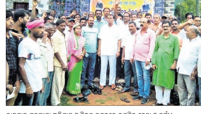
ଭାଜପାର ସଦସ୍ୟତା ଅଭିଯାନ ଓ ବିଜୟ ଉତ୍ସବରେ ଉପସ୍ଥିତ ନେତା ଓ କର୍ମୀ।