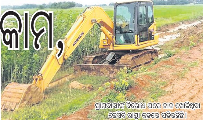
ଗ୍ରାମବାସୀଙ୍କ ବିରୋଧ ପରେ ନାଳ ଖୋଳିଥିବା ଚେସିକି ରାସ୍ତା କଡରେ ପଡିଛି।