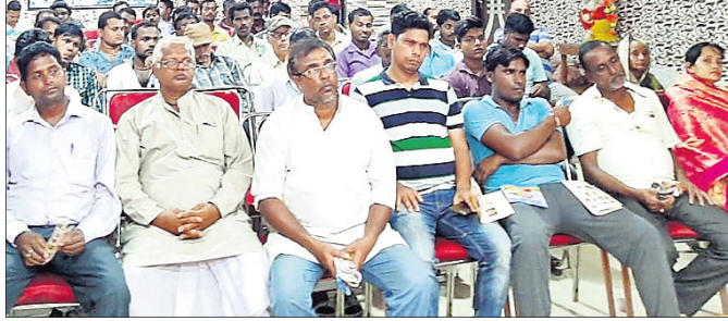
ଭାଜପାର ସଦସ୍ୟତା ଅଭିଯାନରେ ଉପସ୍ଥିତ ନେତା ଓ କର୍ମୀ।