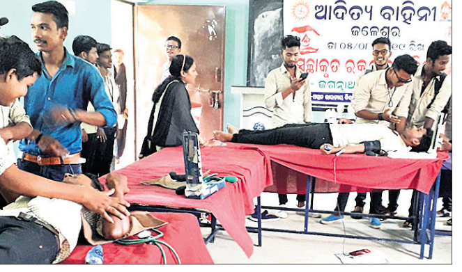
ଶିବିରରେ ଛାତ୍ରମାନେ ରକ୍ତଦାନ କରୁଛନ୍ତି।