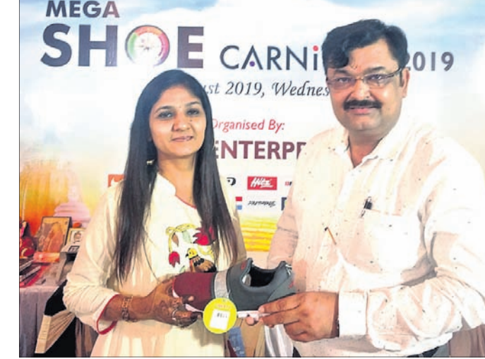
ଭୁବନେଶ୍ୱର, ୭-୮ (ବ୍ୟୁରୋ)