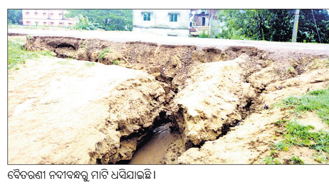
ବୈତରଣୀ ନଦୀବନ୍ଧକୁ ମାଟି ଧସିଯାଇଛି ।

ନଦୀବନ୍ଧ ନିର୍ମାଣ ଲାଗି ସରକାରଙ୍କ ପକ୍ଷରୁ କୋଟି କୋଟି ଟଙ୍କା ଖର୍ଚ୍ଚ କରାଯାଇଛି । ଏହାଛଡ଼ା କାନ୍ଥପଡ଼ି ଗ୍ରାମରେ ଗୋଟିଏ ଗୃହପାଳିତ ଗୋରୁ ମୃତ୍ୟୁ ବରଣ କରିଛି ।