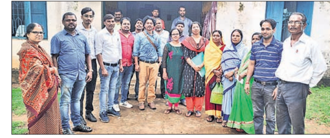
ମାଳତକେନ୍ଦ୍ରରେ ଉପସ୍ଥିତ ଡାକ୍ତରୀ ଦଳ।