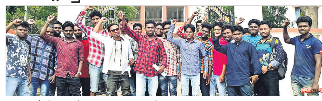
ମାରିସାର କର୍ମକର୍ତ୍ତାମାନେ କାର୍ଯ୍ୟାଳୟ ସମ୍ମୁଖରେ ବିରୋଧ ପ୍ରଦର୍ଶନ କରୁଛନ୍ତି।

ବାରିପଦା ଅଫିସ, ୭।୮ ମୟୂରଭଞ୍ଜ ଜିଲାର ଥିବା ଆଦିବାସୀ ଓ ହରିଜନ ଛାତ୍ରାଛାତ୍ରୀମାନଙ୍କ ଶିକ୍ଷା ଉଦ୍ଦେଶ୍ୟରେ ଆନ୍ଦୋଳନ ଆରମ୍ଭ ହୋଇଛି।