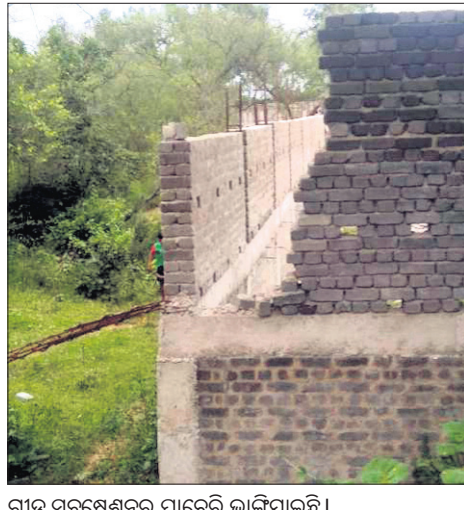
ଗ୍ରୀଡ଼ ସର୍ବ୍ଵେକ୍ଷଣ ପାଟେରି ଭାଙ୍ଗିଯାଇଛି ।

ବନ୍ତ, ୭।୮ (ଡି.ଏନ.ଏ.) - ଉତ୍ତୁକ ଜିଲ୍ଲା ବନ୍ତ ବ୍ଲକ୍ ଅନ୍ତର୍ଗତ ରାମକୃଷ୍ଣପୁର ପଞ୍ଚାୟତ ଗୋପାଳସାହିରୁତ କପାଳି ନଦୀ କୂଳରେ ଓପିଟିସିଏଲ୍(ଓଡ଼ିଶା ପାୱାର ଡାଭ୍‌ମିସର୍ବ୍ଵ କର୍ପୋରେସନ ଲିମିଟେଡ୍) ପକ୍ଷରୁ କାମ ଆରମ୍ଭ ହୋଇଛି ।