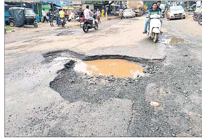
ରାସ୍ତାରେ ଦୃଷ୍ଟିହୋଇଥିବା ଖାଲ