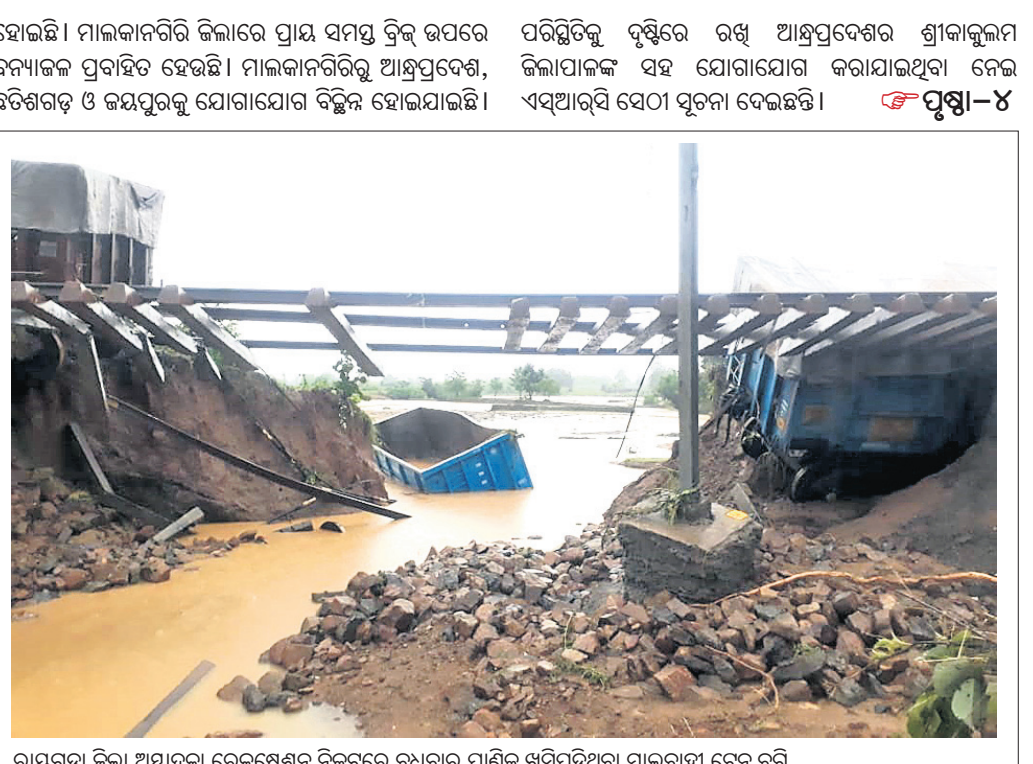
ଧାରଣଗଡ଼ା ଜିଲ୍ଲା ଅଞ୍ଚଳରେ ବନ୍ୟା ପରିସ୍ଥିତି ସୃଷ୍ଟି ହୋଇଛି। ଧାରଣଗଡ଼ା ଜିଲ୍ଲା ଅଞ୍ଚଳରେ ବନ୍ୟା ପରିସ୍ଥିତି ସୃଷ୍ଟି ହୋଇଛି।

ଭୁବନେଶ୍ଵର, ୭।୮ (ବୁଧବାର) - ଭୁବନେଶ୍ଵର ଅଞ୍ଚଳରେ ପ୍ରବଳ ବର୍ଷା ହେଉଛି। ସାରା ରାଜ୍ୟରେ ପ୍ରବଳ ବର୍ଷା ହେଉଛି।