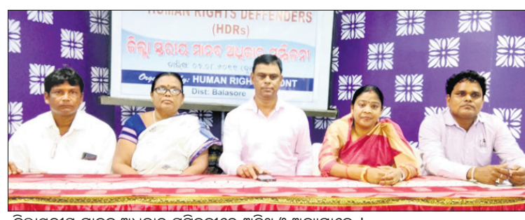
ଜିଲ୍ଲାସ୍ତରୀୟ ମାନବ ଅଧିକାର ସମ୍ମିଳନୀରେ ଅତିଥି ଓ ଅଧ୍ୟକ୍ଷମାନେ ।

ବାଲେଶ୍ଵର ଅଫିସ, ୭।୮ - ବର୍ତ୍ତମାନ ସମୟରେ ମାନବ ଅଧିକାର ସୁରକ୍ଷା ଏକ ଗୁରୁତ୍ଵପୂର୍ଣ୍ଣ ପ୍ରଶ୍ନ ହୋଇଛି । ଗଣତାନ୍ତ୍ରିକ ଶାସନ ବ୍ୟବସ୍ଥାରେ ମାନବ ଅଧିକାର ଯେଉଁଭଳି ଶୁଣି ନ ହେବ ସେଥିଲାଗି ଗୁରୁତ୍ଵ ଦିଆଯାଉଛି ।