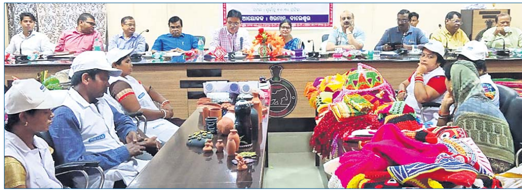
କର୍ମଶାଳାରେ ମଞ୍ଚାସୀନ ଅତିଥି ଓ ବିପଣନ ଗୋଷ୍ଠୀର ସଭ୍ୟସଭ୍ୟା ।

୪୯ ନଂ ରେ ବିରାଟ ବଡ଼ ଖାଲ ହୋଇଛି । ମାଟି ପକାଇ ପୂରଣ କରାଯାଇଥିଲେ ହେଁ ବର୍ଷ ପରେ ବହୁ ସଂଖ୍ୟାରେ ଗାଡ଼ି ଚଳାଚଳ କରୁଥିବାରୁ ପୁଣି ଖାଲ ହୋଇଯାଇଛି । ଏଣୁ ଶୁଖିଲା ସମୟରେ ଘାୟା ମରାମତି କରାଯାଉ ନ ଥିବାରୁ ଘାୟା ଲୋକ ଅସନ୍ତୋଷ ବ୍ୟକ୍ତ କରୁଛନ୍ତି । ସେହିପରି ପ୍ରତିକାର କରାଯାଉନାହିଁ । ବର୍ଷା ଯୋଗୁଁ ରାସ୍ତାରେ ପାଣି ଭର୍ତ୍ତି ହୋଇଥିବାରୁ ଖାଲଖମା ଓ ସାମଗ୍ରୀ ନାପକିନ ବ୍ୟବସାୟୀଙ୍କ ସଂଯୋଗାକରଣ ବ୍ୟବସ୍ଥାକୁ ଆନୁଷ୍ଠାନିକ ଭାବେ ମଧ୍ୟ ଉଦ୍‌ଘାଟନ କରାଯାଇଥିଲା ।