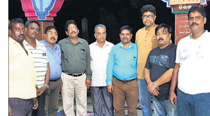
ସଭାରେ ଉପସ୍ଥିତ ପୁରାତନ ଛାତ୍ର ସଙ୍ଗଠନ କର୍ମକର୍ତ୍ତା।