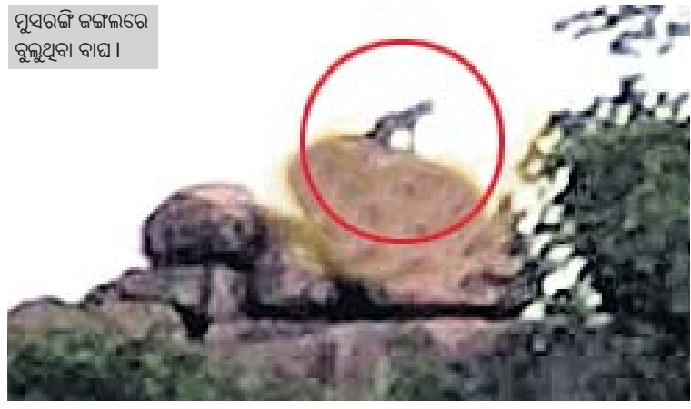
ମୁସରଙ୍ଗି ଜଙ୍ଗଲରେ ବୁଲୁଥିବା ବାଘ ।

କୂଆପଡ଼ା ଅଫିସ, ୭।୮: ଗ୍ଲାମାୟ ସରଫ ଫରେଷ୍ଟ ରେଞ୍ଜ ଅନ୍ତର୍ଗତ ମୁସରଙ୍ଗି ଫରେଷ୍ଟ ଜଙ୍ଗଲରେ ୨ଟି କଲରାପତରୀଆ ବାଘ ବୁଲୁଥିବା ନେଇ ଗ୍ଲାମାୟ ଗ୍ରାମବାସୀ ଆତଙ୍କିତ ହୋଇପଡ଼ିଛନ୍ତି।