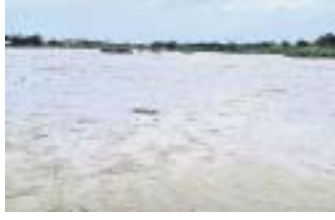
ରକ୍ଷିକୂଳ୍ୟାରେ ବନ୍ୟାଜଳ ପ୍ରବାହିତ ହେଉଛି।

ଆସିକା, ୭୮୮ (ଡି.ଏନ୍.ଏ.): ଗତ ସୋମବାର ଠାରୁ ଆସିକା ତଥା ଆଖପାଖ ଅଞ୍ଚଳରେ ଲଘୁତାପ ଜନିତ ଲଗାଣ ବର୍ଷା ଲାଗି ରହିଛି। ବୁଧବାର ମଧ୍ୟାହ୍ନରେ ଆସିକାର ଉଚ୍ଚ ସ୍ତରରେ ପ୍ରବାହିତ ରକ୍ଷିକୂଳ୍ୟା ଓ ବଡ଼ନଦୀରେ ପ୍ରଥମ ବନ୍ୟାଜଳ ପ୍ରଦେଶ କରିଛି। ଆସିକାଠାରେ ରକ୍ଷିକୂଳ୍ୟା ବିପଦ ସଙ୍କେତ ୬.୬ ଫୁଟ ରହିଥିବାବେଳେ ବର୍ତ୍ତମାନ ୪.୬ ଫୁଟରେ ବନ୍ୟାଜଳ ପ୍ରବାହିତ ହେଉଛି। ସେହିଭଳି ବଡ଼ନଦୀର ବିପଦ ସଙ୍କେତ ୧୧ ଫୁଟ ରହିଥିଲା ବେଳେ ବର୍ତ୍ତମାନ ୨.୮ ଫୁଟରେ ବନ୍ୟାଜଳ ପ୍ରବାହିତ ହେଉଛି। ଗତ ଗନ୍ଧିନ ଧରି ଲାଗି ରହିଥିବା ଏହି ବର୍ଷାରେ ଆସିକା ଠାରେ ୧୦୩ ମି.ମି. ବୃଷ୍ଟିପାତ ରେକର୍ଡ କରାଯାଇଥିବା ବେଳେ ଉପରମୁଖ ଚାନ୍ଦିବିଲିଠାରେ ୧୦୫ ମି.ମି., ଉପରମୁଖ ସୋରଡ଼ା ଠାରେ ଗତ ୨୪ ଘଣ୍ଟାରେ ୮୫ ମି.ମି. ବୃଷ୍ଟିପାତ ହୋଇଥିବା ଜଳସମ୍ପଦ ବିଭାଗ ପକ୍ଷରୁ ରେକର୍ଡ କରାଯାଇଛି।