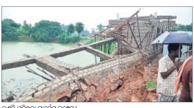
ଭୁଶୁଡ଼ି ପଡ଼ିଥିବା ମାର୍କେଟ କମ୍ପ୍ଲେକ୍ସ।