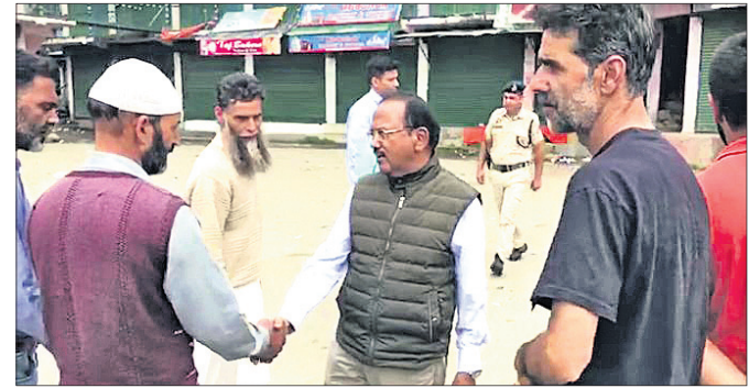
ଶୋପିଆନ୍ରେ ଶ୍ରୀନାୟ ଲୋକଙ୍କ ସହ ଭାବବିନିମୟ କରୁଛନ୍ତି ଏନ୍ଏସ୍ଏ ଅଧିକତାଭାଳ।