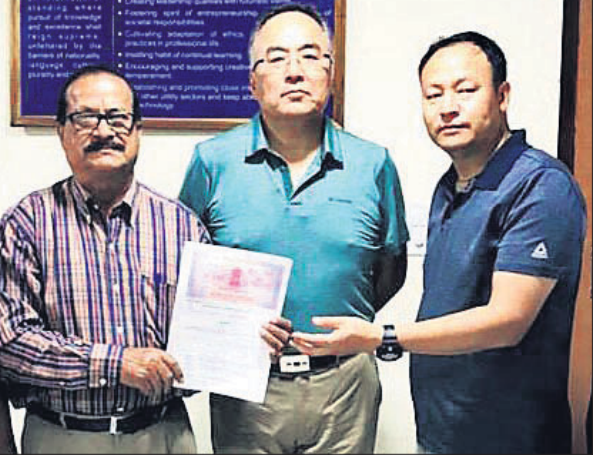
ସିସିଏ ଓ ଡ୍ରିପ୍ସ କର୍ମକର୍ତ୍ତାଙ୍କ ମଧ୍ୟରେ ବୁଝାମଣାପତ୍ର ସ୍ୱାକ୍ଷର ହୋଇଥିଲା ।