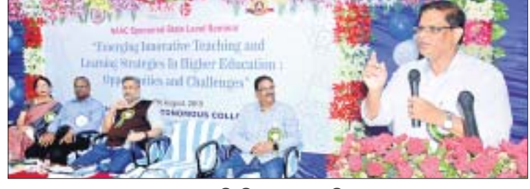
ଉଦ୍‌ଘାଟନା ଅଧିବେଶନରେ ରେଭେନ୍‌ଶା ବିଶ୍ୱବିଦ୍ୟାଳୟ କୁଳପତି ପ୍ରଫେସର ଇଶାନ୍ କୁମାର ପାତ୍ର ବକ୍ତବ୍ୟ ରଖୁଛନ୍ତି ।