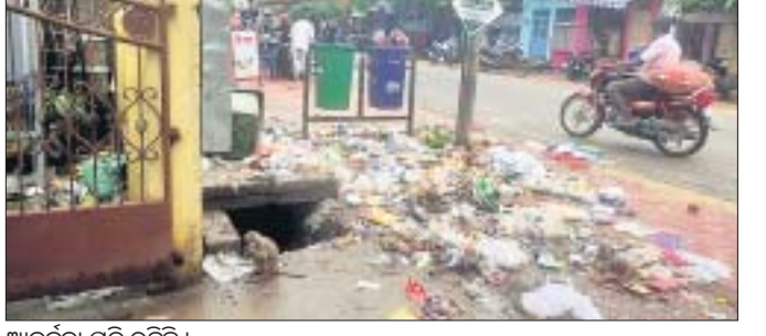
ଆବର୍ଜନା ପଡି ରହିଛି।

ସଂଗ୍ରହ କରାଯାଇଛି। ତଥାପି କେତେକ ଏନଏସି ପକ୍ଷରୁ ନିଆଯାଇଥିବା ତବାରେ ମଇଳା ନ ପକାଇ ବାହାରେ ପକାଉଛନ୍ତି। ଯଦ୍ୱାରା ଏଭଳି ପରିସ୍ଥିତି ସୃଷ୍ଟି ହେଉଛି। ବୁଧବାର ସକାଳେ ଛତ୍ରପୁର ବଜାରରେ ଥିବା ମାର୍କେଟ କମ୍ପ୍ଲେକ୍ସ ଆଗରେ କୁଡ଼ କୁଡ଼ ମଇଳା ପଡିଥିବା ଦେଖିବାକୁ ମିଳିଥିଲା। ଫଳରେ କମ୍ପ୍ଲେକ୍ସ ପରିସରକୁ ବୋକାଳା ଓ ଗ୍ରାହକ ଯିବାରେ ଅସୁବିଧା ହୋଇଥିଲା। ଏପରିକି ପୂର୍ବିକାଳରେ ସେଠାରେ ରହିବା ମୁସିଲ ହୋଇପଡିଥିଲା।