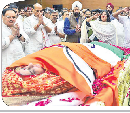
ସୁଷମାଙ୍କ ଶେଷକୃତ୍ୟରେ ପ୍ରଧାନମନ୍ତ୍ରୀ ନରେନ୍ଦ୍ର ମୋଦି, ଲାଲକୃଷ୍ଣ ଆଡ଼ବାନୀ, ପ୍ରତିରକ୍ଷାମନ୍ତ୍ରୀ ରାଜନାଥ ସିଂଓ ସ୍ଵରାଷ୍ଟ୍ରମନ୍ତ୍ରୀ ଅମିତ ଶାହ।

ସୁଷମା ସ୍ଵରାଜଙ୍କ ପାର୍ଥିବ ଶରୀର ଦେଖି କାନ୍ଧି ପକାଇଛନ୍ତି ଏମତିଏର୍ କମ୍ପାନୀର ମାଲିକ ଧର୍ମପାଳ ଗୁଲାରୀ। ୯୭ବର୍ଷୀୟ ଗୁଲାରୀ ସୁଷମାଙ୍କ ଶେଷ ଦର୍ଶନ ପାଇଁ ଭାଜପା କାର୍ଯ୍ୟକାରୀତା ଯାଇଥିଲେ। ସେଠାରେ ତାଙ୍କୁ ଦେଖିବା ପରେ ତଳେ ବସି କାନ୍ଧିବାକୁ ଲାଗିଥିଲେ। ଉପସ୍ଥିତ କିଛି ଲୋକ ତାଙ୍କୁ ସମାଲିଖିଥିଲେ। ସୁଷମାଙ୍କ ମରଣୋତ୍ତର ପ୍ରଥମେ ତାଙ୍କ ଦିଲ୍ଲୀସ୍ଥିତ ବାସଭବନକୁ ନିଆଯାଇଥିଲା। ସେଠାରେ ପ୍ରଧାନମନ୍ତ୍ରୀ ନରେନ୍ଦ୍ର ମୋଦି, ରାଷ୍ଟ୍ରପତି ରାମନାଥ କୋବିନ୍ଦଙ୍କ ସମେତ ଦେଶର ବିଭିନ୍ନ ନେତା ସୁଷମାଙ୍କୁ ଶ୍ରଦ୍ଧାଞ୍ଜଳି ଜଣାଇଥିଲେ।