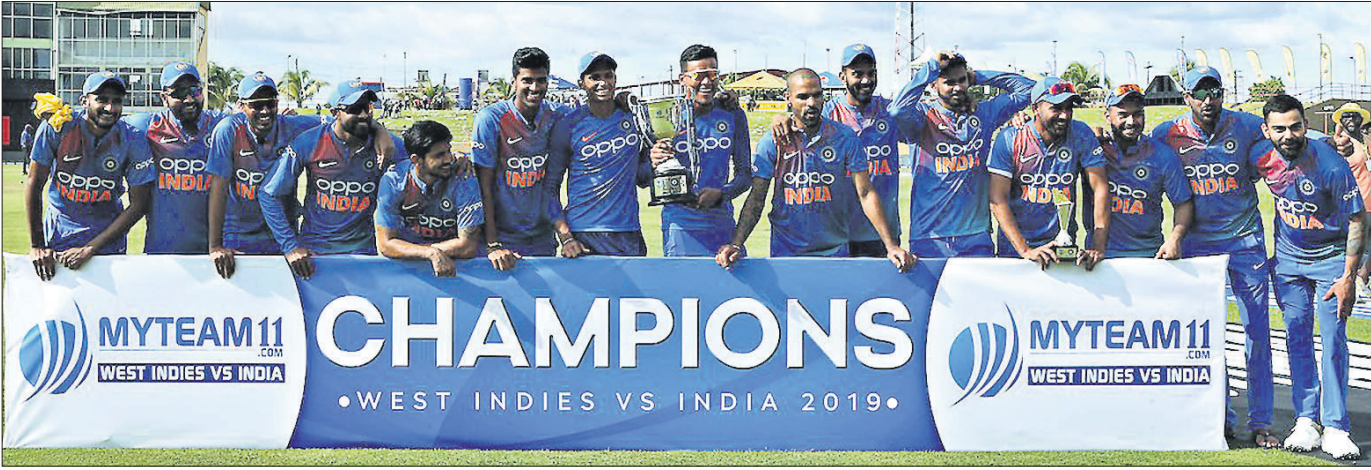
ତିନିଦିନିକିଆ ଭାରତୀୟ ଦଳ ।