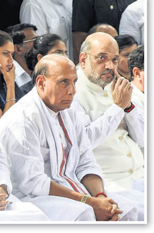
ସୁଷମାଙ୍କ ଶେଷକୃତ୍ୟରେ ପ୍ରଧାନମନ୍ତ୍ରୀ ନରେନ୍ଦ୍ର ମୋଦି, ଲାଲକୃଷ୍ଣ ଆଡ଼ବାନୀ, ପ୍ରତିରକ୍ଷାମନ୍ତ୍ରୀ ରାଜନାଥ ସିଂଓ ସ୍ଵରାଷ୍ଟ୍ରମନ୍ତ୍ରୀ ଅମିତ ଶାହ।

ପୂର୍ବତନ ବହିର୍ବାପାର ମନ୍ତ୍ରୀ ସୁଷମା ସ୍ଵରାଜଙ୍କ ପାର୍ଥିବ ଶରୀର ଦେଖି ପ୍ରଧାନମନ୍ତ୍ରୀ ନରେନ୍ଦ୍ର ମୋଦି ଆବୁଜ ହୋଇପଡ଼ିଛନ୍ତି। ତାଙ୍କ ଆଖି ଲୁହରେ ଜଳକଣ୍ଠି ଆସିଥିବାବେଳେ ନିଜକୁ ସେ ନିୟନ୍ତ୍ରଣ କରିଥିଲେ। ଭାଜପାର ବରିଷ୍ଠ ନେତାମାନେ ସୁଷମାଙ୍କ ବାସଭବନରେ ଶେଷ ଦର୍ଶନ କରିଛନ୍ତି। ଭାଜପାର ବରିଷ୍ଠ ନେତା ଲାଲକୃଷ୍ଣ ଆଡ଼ବାନୀ, ଅମିତ ଶାହ ପ୍ରମୁଖ ବୁଧବାର ସକାଳୁ ସେଠାରେ ପହଞ୍ଚିଛନ୍ତି।