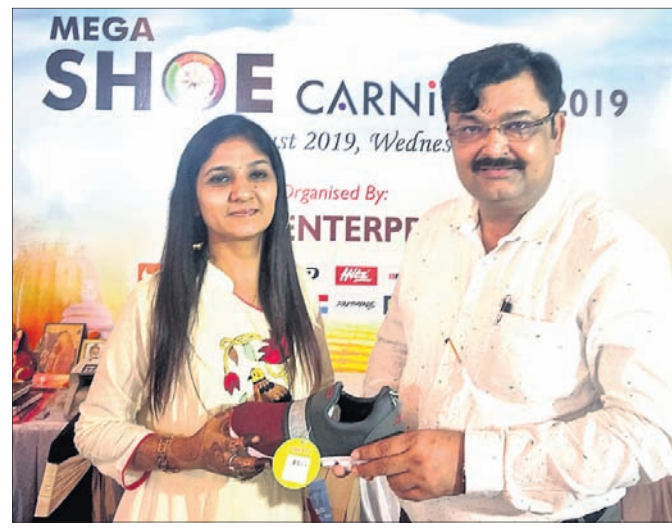
ଭୁବନେଶ୍ୱର, ୭-୮ (ବ୍ୟୁରୋ)

ଯୋଗ ଦେଲେ ୧୧୦ ଡିଲର ୧୪ ଜାତୀୟ-ଅନ୍ତର୍ଜାତୀୟ ବ୍ରାଣ୍ଡ ସାମିଲ