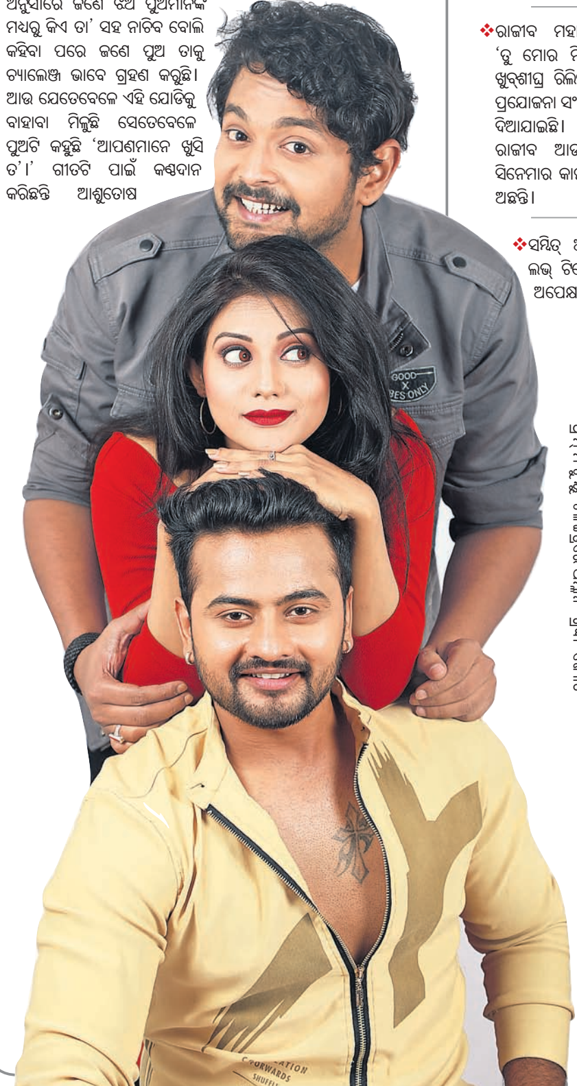
ପ୍ରାଣନିରୁହୁ-ଅମିତାଭ ବଚନ, ଓଡ଼ିଆ ଓଡ଼ିଆ