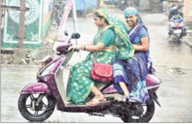
ବର୍ଷା ସତ୍ତ୍ୱେ ଦୁଇଜଣ ମହିଳା ଗତବ୍ୟସ୍ଥକକୁ ଯାଉଛନ୍ତି ।

ବୋଲି ସୂଚନା ମିଳିଛି । ଯୁକ୍ତ ୩ ବିତୀୟ ଓ ତୃତୀୟ ସେମିଷ୍ଟର ବ୍ୟାକପେପର ପରୀକ୍ଷା ଖାତା ମୂଲ୍ୟାୟନ ଜୁଲାଇ ୩୧କୁ ଶେଷ ହୋଇଛି । ଫଳ ପ୍ରକାଶ ନେଇ ବିଳମ୍ବ ହେଉଛି । ତଥାପି ଆସନ୍ତା ୨୦ ରୁ ୨୨ ପୂର୍ଣ୍ଣା ଫଳ ପ୍ରକାଶ କରିବା ନେଇ ଏନିଆଇସି ସୂଚନା ଦେଇଥିବା ପରୀକ୍ଷା ନିୟନ୍ତ୍ରକ ସ୍ତରେନ୍ଦ୍ର ସେଠୀ ସୂଚାଇଛନ୍ତି ।