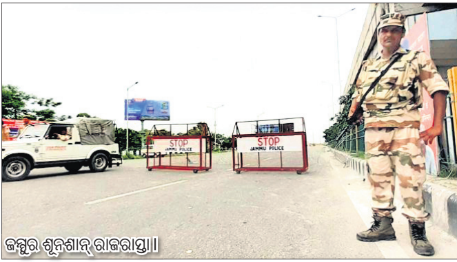
କଣ୍ଠୀର ଶ୍ରୀନଗର ରାଜରାୟା

ଅନୁରୋଧ ୩୭୦ ଉଲ୍ଲେଦ ପରେ କଣ୍ଠୀ-କଣ୍ଠୀରା ରାସ୍ତାଯାତ ଶ୍ରୀନଗର। ସବୁଠି ଅଖଣ୍ଡ ନୀରବତା ରାଜୁତି କରୁଛି। ଶ୍ରୀନଗର ସମେତ ବିଭିନ୍ନ ସହରରେ ପୋଲିସ୍ ଓ ସଶସ୍ତ୍ର ବଳର କଡ଼ା ପ୍ରହର। ଏଥିସହ ସହ ବିଭିନ୍ନ ଯାତ୍ରା ଚାଲିଥିବାକୁ ଅଧିକାଂଶ ଲୋକ ଘରୁ ବାହାରୁନାହାନ୍ତି। କୌଣସି ପ୍ରକାର ଗୁଳବଜନିତ ବିଚ୍ଛିନ୍ନତା ଏତାଜବା ଲାଗି ମୋବାଇଲ୍ ଇଣ୍ଟରନେଟ ସେବାକୁ