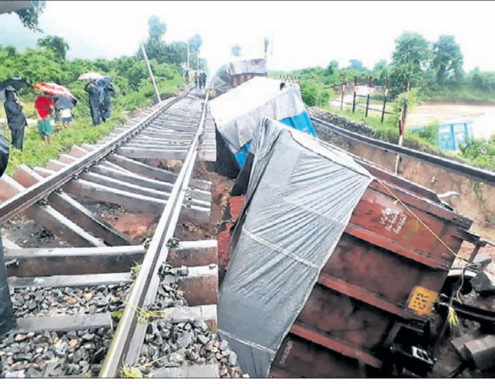
ରାୟଗଡା ଅଫିସ୍/ପୁନିଗୁଡା/ ଅଧ୍ୟକ୍ଷ ଡା. ଡି.ଏ.ଏ.ଏ.

ରାୟଗଡା ଜିଲ୍ଲାରେ ଗତ ୪୦ ଘଣ୍ଟାକୁ ଅଧିକ ସମୟ ଧରି ଲଗାଣ ବର୍ଷା ଯୋଗୁ ବନ୍ୟା ପରିସ୍ଥିତି ସୃଷ୍ଟି ହୋଇଛି । ଜିଲ୍ଲାରେ ପ୍ରବାହିତ ନାଗାବଳୀ, କଳାଖାଣୀ, ବଂଶଧାରା, ଝଞ୍ଜାବତୀ ଓ କୁଟକେର ନଦୀର କଳସ୍ତର ବଢିବାରେ ଲାଗିଛି ।