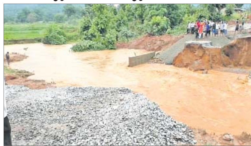
ମଣ୍ଡଳପଦର ନିକଟରେ ଅସ୍ଥାୟୀ କଳଭର୍ତ୍ତୀ ଧୋଇ ଯାଇଛି। ସମ୍ପୂର୍ଣ୍ଣ ହେଉଛି। ଅନେକ ଅଞ୍ଚଳକୁ ଯାତାୟାତ ବ୍ୟାହତ ହୋଇଛି। ପ୍ରଭାବିତ ହେବା ସହ ଆଖ୍ୟାନ୍ତରାଣ ସେହିପରି ଭୁର୍ଜମଗଡ଼ ପାଖରେ ମଧ୍ୟ

କନ୍ୟାମାଳ ଜିଲ୍ଲାରେ ଲଘୁତାପ ଜନିତ ବର୍ଷା ଲାଗି ରହିଛି। ବର୍ଷା ପ୍ରଭାବରେ ଜନଜୀବନ ଅସୁବିଧା ହୋଇପଡିଛି। ସୋମବାର ରାତିଠାରୁ ବର୍ଷା ଆରମ୍ଭ ହୋଇଛି। ବର୍ଷା ପ୍ରଭାବରେ ଫୁଲବାଣୀରୁ ବ୍ରହ୍ମପୁର ଏବଂ ବାଲିଗୁଡ଼ାରୁ କଳାହାଣ୍ଡି ଯୋଗାଯୋଗ ବିଚ୍ଛିନ୍ନ ହୋଇପଡିଛି। ବିକାସାଳି ଲୁକର କୋଟିଲାଗଡ଼ ପାଖରେ ଥିବା ଡାକଭର୍ତ୍ତୀନ୍ ରୋଡ଼ ଉପରେ ବର୍ଷାଜଳ ପ୍ରବାହିତ ହେଉଥିବାରୁ ଫୁଲବାଣୀ ବ୍ରହ୍ମପୁରକୁ ଗାଡ଼ି ଚଳାଚଳ ବନ୍ଦ ହୋଇଯାଇଛି। ଡୁଗୁଡ଼ିବନ୍ଧ ବ୍ଲକ ମଣ୍ଡଳପଦର ନିକଟରେ ୫୯ନଂ. କଳାହାଣ୍ଡି ଜାତୀୟ ରାଜପଥରେ ଏକ ଅସ୍ଥାୟୀ କଳଭର୍ତ୍ତୀ ଧୋଇ ଯାଇଛି। ଫଳରେ ରାସ୍ତାର ଦୁଇ ପାର୍ଶ୍ୱରେ ବହୁ ସଂଖ୍ୟାରେ ଗାଡ଼ି ଅଟକି ରହିଛି। ଯାତ୍ରୀମାନେ ନାହିଁ ନ ଥିବା ଅସୁବିଧାର