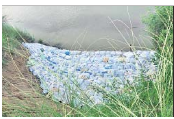
ବଡ଼ନଦୀର ଧୂମୁଛାଇ ନିକଟରେ ଆଡିବନ୍ଧରେ ବାଲିବସ୍ତା ପକାଇ ରଖାଯାଇଛି। ଭଞ୍ଜନଗର ଜଳଭଣ୍ଡାରରେ ୫୭୦୦ ଥିବାବେଳେ ବୁଧବାର ଅପରାହ୍ନ ୨ଟା ହେଲେନିକଟର ଜଳଧାରଣ କ୍ଷମତା ୩୫୦୦ ହେଲେନିକଟର ପାଣି ଥିଲା।

ଲଘୁତାପଜନିତ ଲଗାଣ ବର୍ଷା ଯୋଗୁ ରାଜ୍ୟର ବିଭିନ୍ନ ଅଞ୍ଚଳରେ ବନ୍ୟା ପରିସ୍ଥିତି ସୃଷ୍ଟି ହୋଇଛି। ଏହାର ପ୍ରଭାବ ମଧ୍ୟ ଭଞ୍ଜନଗର ଉପଖଣ୍ଡରେ ପଡିବା ସମ୍ଭାବନା ରହିଛି। ତେଣୁ ଭଞ୍ଜନଗର ଉପଖଣ୍ଡ ପ୍ରଶାସନ ଓ ଜଳସମ୍ପଦ ବିଭାଗ ପକ୍ଷରୁ ଆରମ୍ଭ ପଦକ୍ଷେପ ନିଆଯାଇଛି। ମଙ୍ଗଳବାର ଭଞ୍ଜନଗରରେ ବର୍ଷା ଲାଗି ରହିଛି। ଜଳଭଣ୍ଡାରର ଜଳସ୍ତର ବୃଦ୍ଧି ପାଇଛି। ବୁଧବାର ସନ୍ଧ୍ୟା ପୁଞ୍ଜା ଅଞ୍ଚଳରେ ବନ୍ୟା ପରିସ୍ଥିତି ଉପସ୍ଥିତ। ଜଳଭଣ୍ଡାର ରୁଡିକରେ ବହୁତ କମ୍ ପାଣି ଥିବାରୁ ପାଣି ମଧ୍ୟ ଛଡ଼ାଯାଉନାହିଁ। ବର୍ଷା ଜଳ ହିଁ ବର୍ତ୍ତମାନ ଉପରମୁଖରୁ ଆସୁଛି।