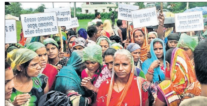
ମହିଳାମାନେ ଅନଶନରେ ବସିଛନ୍ତି ।

ରାଜନଗର ବ୍ଲକ ଭିତରଗଡ଼ ଛକ ଠାରେ ଖୋଲା ଯାଇଥିବା ବିଦେଶୀ ମଦ ଦୋକାନ ଉଚ୍ଛେଦ ଦାବିରେ ଶତାଧିକ ମହିଳା ଆନ୍ଦୋଳନକୁ ଓହ୍ଲାଇଛନ୍ତି । ବୁଧବାର ପ୍ରବଳ ବର୍ଷାକୁ ବେଝାତିର କରି ମହିଳାମାନେ ମଦ ଦୋକାନ ସମ୍ମୁଖ ରାସ୍ତା ଉପରେ ଆମରଣ ଅନଶନରେ ବସି ରହିଛନ୍ତି । ଦାବି ପୂରଣ ନ ହେବା ପର୍ଯ୍ୟନ୍ତ ଆନ୍ଦୋଳନ ଚାଲୁ ରହିବ ବୋଲି ସେମାନେ ଟୋକା ଦେଇଛନ୍ତି । ପ୍ରକାଶ ଯେ, ରାଜନଗର ବ୍ଲକ ଚାନ୍ଦିବାଞ୍ଜିମୁଳ ପଞ୍ଚାୟତର ଜରିମୁଳ ଠାରେ ଠିକିଏ ବିଦେଶୀ ମଦ ଦୋକାନ ଓ ଚାନ୍ଦିବାଞ୍ଜିମୁଳ ଠାରେ ଠିକି ଖୋଲା ମଦ ଦୋକାନ ଥିଲା । ମହିଳାମାନଙ୍କ ଆନ୍ଦୋଳନ ଫଳରେ ମାସାସତଳେ ୨ଟି ମଦଦୋକାନକୁ ବନ୍ଦ କରାଯାଇଥିଲା । ତେବେ ଗତମାସ ୨୪ ତାରିଖ ଠାରୁ ଏକ ଠିକି ବନ୍ଦ ବିଦେଶୀ ମଦ ଦୋକାନ ଭିତରଗଡ଼ ଛକ ଠାରେ ଖୋଲାଯାଇଛି । ଏହି ମଦଦୋକାନ