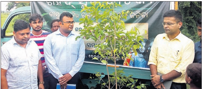
ଶହାଦ ସ୍ମୃତି ପୀଠରେ ଚାରା ରୋପଣ କରାଯାଇଛି ।