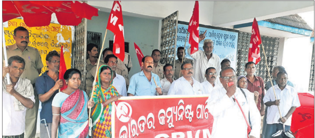
ବିଚିତ୍ କୃଷକ କାର୍ଯ୍ୟାଳୟ ଆଗରେ ସିପିଆଇଏମ୍ କର୍ମୀମାନେ ବିରୋଧ ପ୍ରଦର୍ଶନ କରୁଛନ୍ତି।

କେନ୍ଦ୍ର ସରକାର କଳ୍ପ-କଳ୍ପାଚରୁ ୨ ଭାଗ କରିବାର ନିଷ୍ପତ୍ତି ଓ ୩୭୦ ଧାରା ଉଲ୍ଲେଖ ବିଚିତ୍ କୃଷକ ସିପିଆଇଏମ୍ ପକ୍ଷରୁ ବିରୋଧ କରାଯାଇଛି। ଏନେଇ ରୁଧିବାର ପାର୍ଟି ପକ୍ଷରୁ ରାଷ୍ଟ୍ରପତିଙ୍କ ଉଦ୍ଦେଶ୍ୟରେ ୪ ଦିନୀ ସମ୍ବନ୍ଧିତ ଏକ ସ୍ମାରକପତ୍ର କୁଳ ବିତ୍ତଂ କରିଆଣେ ପ୍ରଦାନ କରାଯାଇଛି। ସିପିଆଇଏମ୍ ଜଗତ୍‌ସିଂହପୁର ଜିଲା ସମ୍ପାଦକ