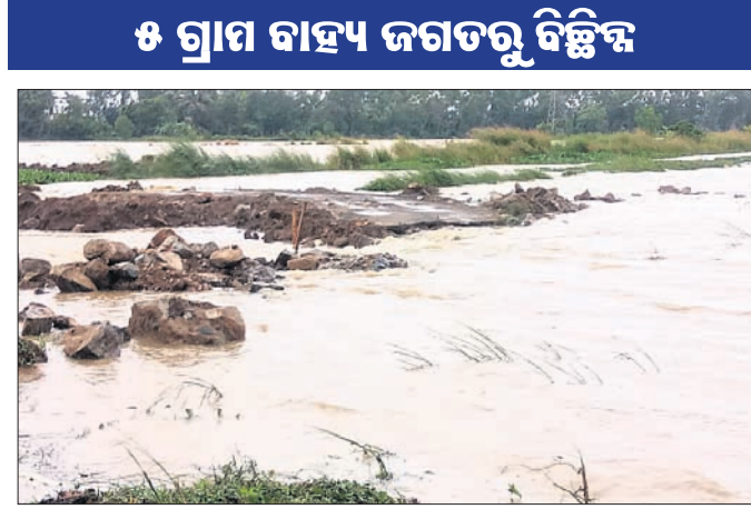
ସବଳଙ୍ଗଠାରେ ରାସ୍ତା ଧୋଇ ଯାଇଛି ।

ଡେରାବିଶ ବ୍ଲକ ପଲେଇ ପଞ୍ଚାୟତ ଗ୍ରାମ ରାସ୍ତା ଦେଇ ଯାଇଥିବା ଗ୍ରାମ୍ୟ ଉନ୍ନୟନ ରାସ୍ତା ନିର୍ମାଣ ଚାଲିଥିବା ବେଳେ ସାଧାରଣ ଲୋକଙ୍କ ଯା'ଆସ ଲାଗି ନିର୍ମାଣ ହୋଇଥିବା ଅସ୍ଥାୟୀ ରାସ୍ତା ଧୋଇ ହୋଇଯାଇଛି । ଏଥିସହ ଏହି ଗ୍ରାମରେ ପାଣି ଚାଲୁଥିବାରୁ ସାଧାରଣ ଯାତାୟାତ ବାଧାପ୍ରାପ୍ତ ହୋଇଛି । ଫଳରେ ପଲେଇ, ବାଲିଆ ଓ କୁକୁରଜା ପଞ୍ଚାୟତର ୫ ଗ୍ରାମ ବାହ୍ୟ ଜଗତକୁ ବିଚ୍ଛିନ୍ନ ହୋଇପଡ଼ିଛି । ଯାହାକୁ ନେଇ ସାଧାରଣରେ ଚାତୁ ଅସନ୍ତୋଷ ଦେଖାଦେଇଛି । ପ୍ରକାଶ ଯେ, ସବଳଙ୍କ ଗ୍ରାମ ଦେଇ ଯାଇଥିବା ଗ୍ରାମ୍ୟ ଉନ୍ନୟନ ରାସ୍ତା ନିର୍ମାଣ ଲାଗି କେନ୍ଦ୍ରାପଡ଼ା ଜିଲା ଗ୍ରାମ୍ୟ ଉନ୍ନୟନ ବିଭାଗ ପକ୍ଷରୁ ଜନିତ ଠିକଦାରଙ୍କୁ ଚେଣ୍ଡର ଦିଆଯାଇଛି । ମାତ୍ର ନିର୍ମାଣ କାର୍ଯ୍ୟ ମନ୍ଦ ଗତିରେ ଚାଲିଥିବା ବେଳେ ଗତ ଜୁନ୍ରେ