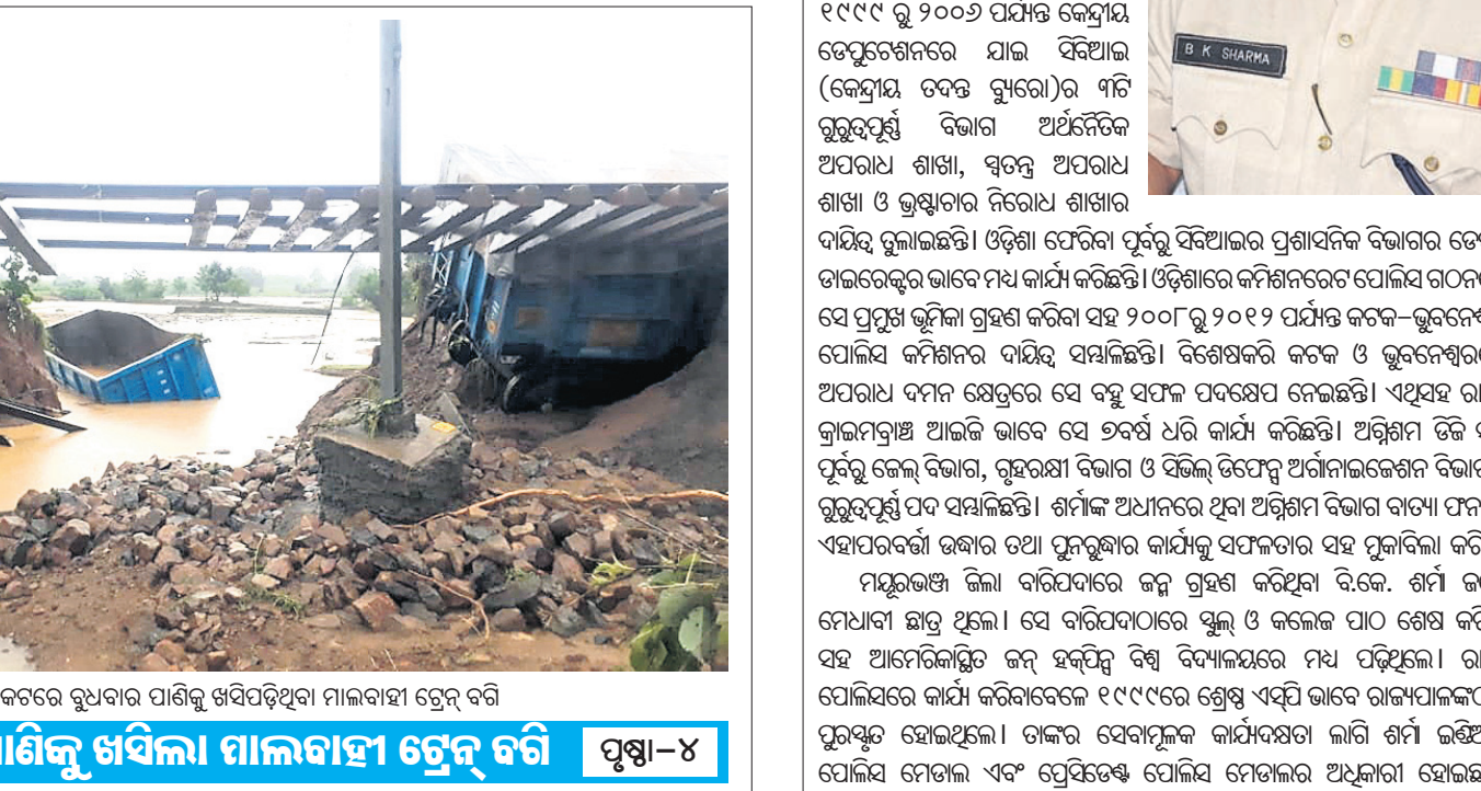
ରାୟଗଡ଼ା ଜିଲ୍ଲା ଅଧ୍ୟକ୍ଷା ରେକର୍ଡ଼େସନ ନିକଟରେ ରୁଧିରା ପାଣିକୁ ଖସିପଡ଼ିଥିବା ମାଲବାହୀ ଟ୍ରେଲ୍ ବରି