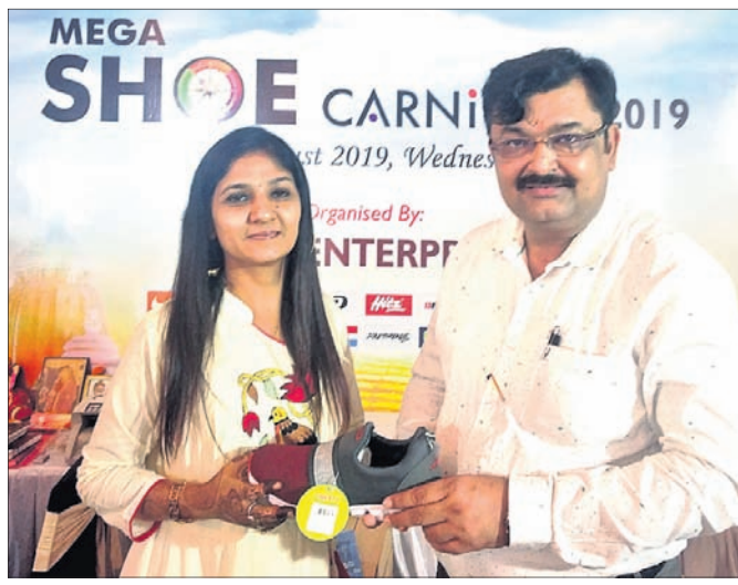
ଭୁବନେଶ୍ୱର, ୭-୮ (ବ୍ୟୁରୋ)

ଜାତୀୟ ତଥା ଅନ୍ତର୍ଜାତୀୟ ବ୍ରାଣ୍ଡ ପୁର ପୁର ଷ୍ଟିଲ୍ସ ରାମଜୀ ଏଣ୍ଟରପ୍ରାଇଜେସ୍ ପକ୍ଷରୁ 'ମେଗା ଷୁ କାର୍ନିଭାଲ' ଘାନ୍ତାୟ ଏକ ହୋଟେଲରେ ରୁପସାର ଅନୁଷ୍ଠିତ ହୋଇଯାଇଛି।