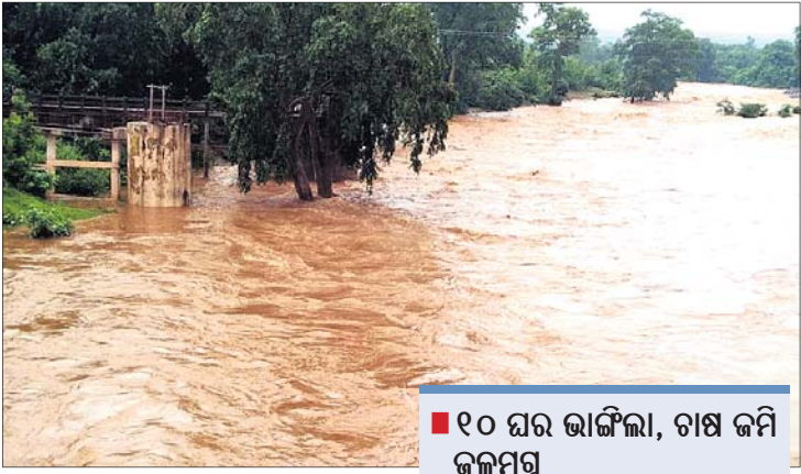
୧୦ ଘର ଭାଙ୍ଗିଲା, ଗଣ ଜମି ଜଳମୟ ବନ୍ୟା ଜଳରେ ଭାସି ଯାଇ ଯୁବକ ନିଖୋଜ

ସେହିପରି ଲଗାଣ ବର୍ଷା ମଙ୍ଗଳପୁର ବ୍ୟାପକରେ ୫ଟି ଗୋଷ୍ଠୀଗୋଷ୍ଠୀରେ ଯେଠାକୁ ସେଇଠାକୁ ପ୍ରତି ୧୩୫ କୁସେକ ଜଳ ହାତୀନଦୀରେ ଛତାଯାଇଛି।