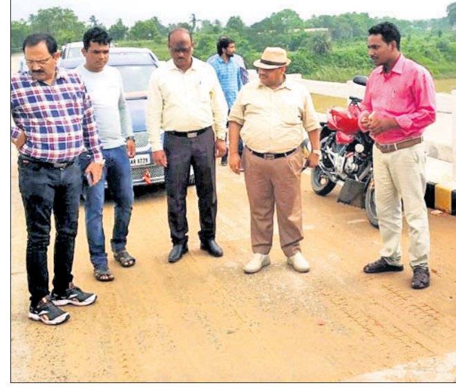
ବିଶ୍ୱବ୍ୟାଙ୍କ ମୁଖ୍ୟମନ୍ତ୍ରୀ ଓ ଅନ୍ୟମାନେ ତାରପୁର ବ୍ରିଜ୍ ଅନୁଧ୍ୟାନ କରୁଛନ୍ତି।