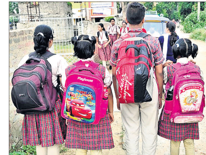
ଯାକପୁର ଅଫିସ, ୭।୮