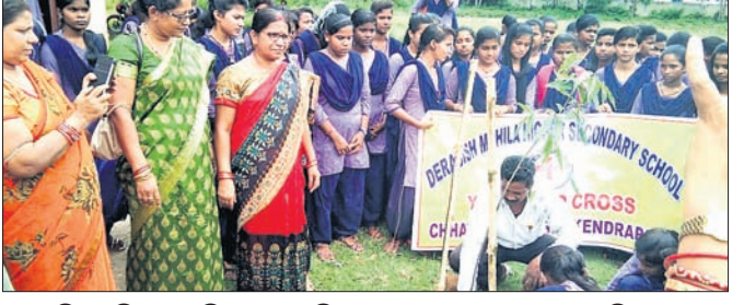
ଡେରାବିଶ ମହିଳା ମହାବିଦ୍ୟାଳୟ ପରିସରରେ ବୃକ୍ଷରୋପଣ କରାଯାଇଛି ।

ଡେରାବିଶ ବ୍ଲକ ଅଧୀନ ବିଭିନ୍ନ ଶିକ୍ଷାନୁଷ୍ଠାନରେ ଇତିମଧ୍ୟରେ ବନ ମହୋତ୍ସବ ପାଳିତ ହୋଇଯାଇଛି । ଏହି ଉପଲକ୍ଷେ ଚାରୋଟିକଡ଼ା ପଞ୍ଚାୟତର ଛତାସ୍ଥିତ ଡେରାବିଶ ମହିଳା ଉଚ୍ଚ ମାଧ୍ୟମିକ ବିଦ୍ୟାଳୟ ଏବଂ ଏଣ୍ଡର ପଞ୍ଚାୟତ ଅଧୀନ ଅରାଖଣ୍ଡ ଉନ୍ନତ ଉଚ୍ଚ ପ୍ରାଥମିକ ବିଦ୍ୟାଳୟ ପରିସରରେ ଛାତ୍ରଛାତ୍ରୀଙ୍କ ଦ୍ୱାରା ବୃକ୍ଷରୋପଣ କରାଯାଇଥିଲା । ଡେରାବିଶ ମହିଳା ଉଚ୍ଚ ମାଧ୍ୟମିକ ବିଦ୍ୟାଳୟର ଯୁବ ରେଡକ୍ରସ୍ କାରଗିରି ମୁଣ୍ଡରେ ଭାରତୀୟ ଯବାନ ଦେଖାଉଥିବା ବାଗିଚା ଓ ସାହସିକତା ସମ୍ପର୍କରେ ଛାତ୍ରଛାତ୍ରୀମାନଙ୍କୁ କହିଥିଲେ ।