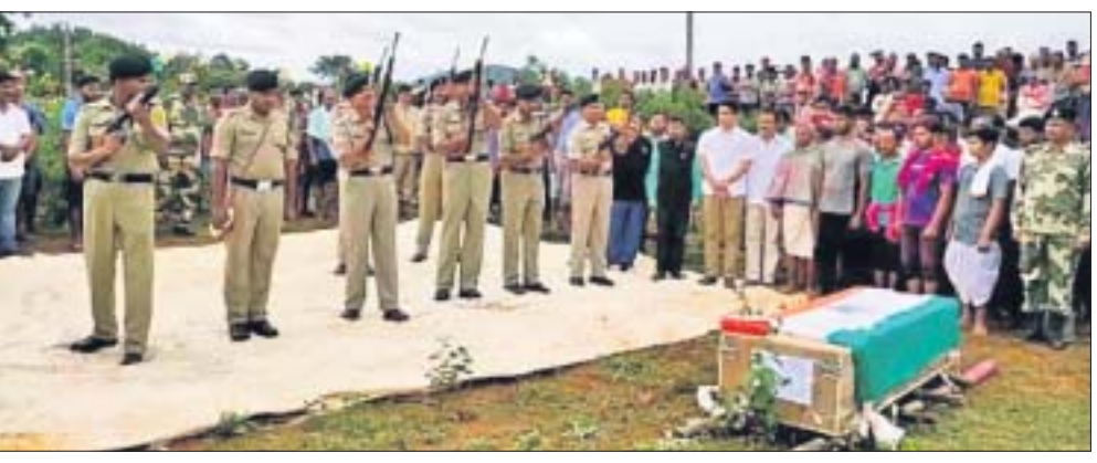
ଶହୀଦ ଯବାନଙ୍କୁ ଗାର୍ତ୍ ଅଫ୍ ଅନର ଦିଆଯାଇଛି।