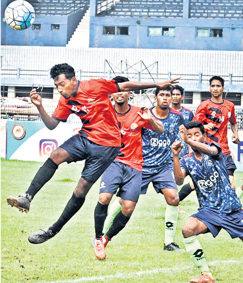
କଟକରେ ରାଜକିଂ ଷ୍ଟୁଡେଣ୍ଟ ପ୍ରଥମ ଡିଭିଜନ ପୁରୁଷ ଲିଗରେ ଗୁରୁବାର ରାଜକିଂ ଷ୍ଟୁଡେଣ୍ଟ ଓ ଯଙ୍ଗ ଉତ୍କଳ କ୍ଲବ ମଧ୍ୟରେ ଅନୁଷ୍ଠିତ ମ୍ୟାଚ୍ ।

ପାକିସ୍ତାନ କ୍ରିକେଟ ବୋର୍ଡ ସେଣ୍ଟ୍ରାଲ କଣ୍ଟ୍ରୋଲରେ ସ୍ଥାନ ପାଇଥିବା ଖେଳାଳି ଭଲ ପ୍ରଦର୍ଶନ କରିବେ ବୋଲି ଆମର ଆଶା ଓ ଭରସା ରହିଛି ।