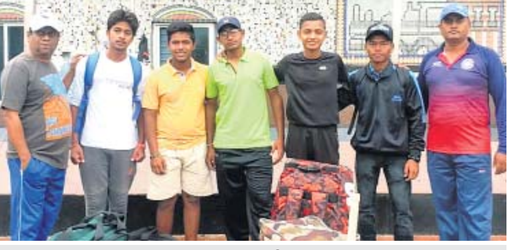
ଗଞ୍ଜାମ ଦଳର ଖେଳାଳିମାନେ।

ଜିଲାରୁ ଚିକିତ୍ସା ବନ୍ଧାବନ୍ଧା ଖେଳାଳିଙ୍କୁ ନେଇ ରାଜ୍ୟସ୍ତରୀୟ ଚୟନ ଶିବିର ଅନୁଷ୍ଠିତ ହେଉଛି। ସେଠାରେ ରାଜ୍ୟ ଦଳ ପାଇଁ ଖେଳାଳିଙ୍କୁ ଚୟନ କରାଯାଉଛି।