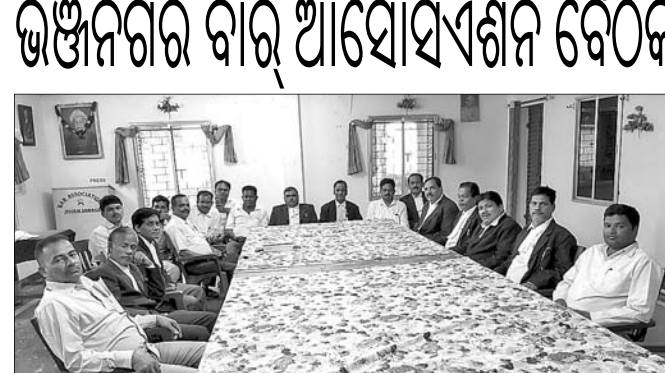
ବୈଠକରେ ଉପସ୍ଥିତ କର୍ମଚାରୀ।