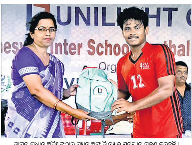
ସାଗର ପ୍ରଧାନ ଅତିଥିଙ୍କଠାରୁ ମ୍ୟାନ ଅଫ ଦି ମ୍ୟାଚ ପୁରସ୍କାର ଗ୍ରହଣ କରୁଛନ୍ତି । ସମାନ ପ୍ରସଙ୍ଗରେ ଷ୍ଟୁଲ ଆସିଥିଲେ । ବିଫାଲ୍ୟରେ ୧୬ଟି ମିନିଟରେ ଆଣ୍ଡର ଟାଇମ୍ ଉପରେ ମ୍ୟାଚରେ ସାଇ ଇଣ୍ଟରନାଶନାଲ ୨-୦ ଗୋଲରେ

ଭୁବନେଶ୍ୱର, ୮୮ (କ୍ରୀଡ଼ା ପ୍ରତିନିଧି) ଯୁନିଟ-୬ ଆଥଲେଟିକ ଆସୋସିଏସନ୍ ଆନୁକୁଲ୍ୟରେ ୬ ନମ୍ବର ହାଇସ୍କୁଲ ପଡ଼ିଆରେ ଚାଲିଥିବା ଯୁନିଲାଇଟ କମ୍ ଆନ୍ଧ୍ର ଷ୍ଟୁଲ ଫୁଲ୍ବଲ ଚୁନାବେଶରେ ଗୁରୁବାର ୨ଟି ମ୍ୟାଚ ଅନୁଷ୍ଠିତ ହୋଇଛି । ଏଥିରେ ଡିଏଭି ପୋଖରିପୁଟ ଓ ସାଇ ଇଣ୍ଟରନାଶନାଲ ଷ୍ଟୁଲ ବିଜୟ ହାସଲ କରିଛନ୍ତି । ପ୍ରଥମ ମ୍ୟାଚରେ ଡିଏଭି ପୋଖରିପୁଟ ୨-୧ ଗୋଲରେ ପୁସର ଭୁବନେଶ୍ୱର ଷ୍ଟୁଲକୁ ପରାସ୍ତ କରିଛି । ସଂପୂର୍ଣ୍ଣତାରେ ଶେଷ ହୋଇଥିବା ଏହି ମ୍ୟାଚରେ ୧୧ଟି ମିନିଟରେ ପୁସର ଷ୍ଟୁଲର ବିକାଶ ଘୁଟା ଗୋଲ ଦେଇ ଦଳକୁ ଅଗ୍ରଣୀ କରାଇଥିଲେ ।