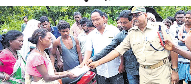
ମୃତକଙ୍କ ପରିବାର ଲୋକଙ୍କୁ ବନ ବିଭାଗ ପକ୍ଷରୁ ସହାୟତା ପ୍ରଦାନ।

ବାଲିଗୋଷି, ୮୮ (ବି.ଏ.ଏ.): ପ୍ରାଥମିକ ପର୍ଯ୍ୟାୟରେ ୪୦ ହଜାର ଟଙ୍କା ସରକାରୀ ସହାୟତା ରାଶିର ଏକ ଟେକ ପ୍ରଦାନ କରାଯାଇଥିଲା। ଅବଶିଷ୍ଟ ୩ ଲକ୍ଷ ୬୦ ହଜାର ଟଙ୍କା ପ୍ରଦାନ କରାଯିବ ବୋଲି ପ୍ରତିଶ୍ରୁତି ଦିଆଯାଇଥିଲା। ସେହିପରି ପଞ୍ଚାୟତ ଡେପ୍ୟୁଟି ହରିଶ୍ଚନ୍ଦ୍ର ଯୋଜନାରେ ୨୦୦୦ ଟଙ୍କା ଏବଂ ରେଡକ୍ରସ ପାଣ୍ଠିରୁ ଅଧୀନ ଭୁବନେଶ୍ୱର ଗ୍ରାମର ଦାମରୁ ମାଟି ନାମକ ଜଣେ ବୃଦ୍ଧଙ୍କୁ ହାତୀ ପାଦରେ ଦଳି ଦେବାରୁ ତାଙ୍କର ମୃତ୍ୟୁ ଘଟିଛି। ହାତୀକୁ ଘରୋଇବାକୁ ଯାଇ ସେ ପ୍ରାଣ ହରାଇଛନ୍ତି। ଏନେଇ ଗ୍ରାମରେ ଉତ୍ତେଜନା ପ୍ରକାଶ ପାଇଥିଲା। ଖବରପାଇ କରି ୯୦୦ ମେଗାୱାଟ୍ ଶକ୍ତି କ୍ରୟ କରୁଥିବା ଶକ୍ତିମନ୍ତ୍ରୀ କହିଛନ୍ତି। ଅପରପକ୍ଷରେ ୭୨ ଘଣ୍ଟା ମଧ୍ୟରେ ଏନ୍ଡିପିସି ୟୁନିଟ୍‌କୁ ବିକୋଲି ପଠାଇବାରେ କୌଶଳି ଦିବ୍ୟା ପକ୍ଷରୁ ମୃତକଙ୍କ ପରିବାରକୁ