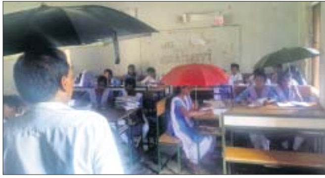
ଛତା ଧରି ଶ୍ରେଣୀ ଗୁହରେ ଛାତ୍ରୀଛାତ୍ର ପଢୁଛନ୍ତି।

କନ୍ଧମାଳ ଜିଲ୍ଲା କ. ନୂଆଗାଁ ବ୍ଲକ୍ ସାଇନପଡ଼ା ପଞ୍ଚାୟତର ତିନିଜପଙ୍ଗା ଭକ୍ତ ପ୍ରାଥମିକ ବିଦ୍ୟାଳୟ ଏବେ ଅସୁବିଧିତ। ସାମାନ୍ୟ ବର୍ଷା ହେଲେ ଶ୍ରେଣୀ ଗୁହରେ ପାଣି ବହୁଛି। ପିଲାମାନେ ପଢ଼ିବାକୁ ହଜିରାଶ ହେଉଛନ୍ତି। ପ୍ରାୟ ୬ ବର୍ଷ ପୂର୍ବେ ନୂତନ ଶ୍ରେଣୀ ଗୁହ ନିର୍ମାଣ ପାଇଁ ପ୍ରାୟ ୫୦ ଲକ୍ଷ ଟଙ୍କାର ଚେଣ୍ଡର ହୋଇଥିଲା। ହେଲେ କିଛି କାରଣ ଯୋଗୁଁ କାମ ହୋଇ ପାରିଲା ନାହିଁ। ଏବେ ସେତିକି ଟଙ୍କାରେ ସ୍କୁଲ ଗୁହ ନିର୍ମାଣ ସମ୍ଭବପଦ ନୁହେଁ ବୋଲି କାମ ନେଇଥିବା ଠିକାଦାର ବିଦ୍ୟାଳୟ କର୍ତ୍ତୃପକ୍ଷକୁ କହୁଛନ୍ତି। ଫଳରେ ଛାତ୍ରାଛାତ୍ରୀମାନେ ବର୍ଷାରେ ଫଳରେ ଛାତ୍ରାଛାତ୍ରୀମାନେ ବର୍ଷାରେ ଓଡ଼ା ହୋଇ ପଢ଼ିବାକୁ ବାଧ୍ୟ ହେଉଛନ୍ତି। ପାମାୟଜଳ ସମସ୍ୟା ରହିଥିବାବେଳେ