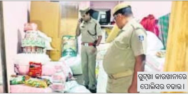
ଗୁରୁତ୍ଵା କାରଖାନାରେ ପୋଲିସର ଚଢ଼ାଉ।

ବଡ଼ବଜାର ପୋଲିସ ଗୁରୁବାର ପାଣିଗ୍ରାହୀ ପେଣ୍ଡରେ ଥିବା ଏକ ଗୁରୁତ୍ଵା କାରଖାନାରେ ଚଢ଼ାଇ କରି ବିପୁଳ ପରିମାଣର ଗୁରୁତ୍ଵା ଜବତ କରିଛି।