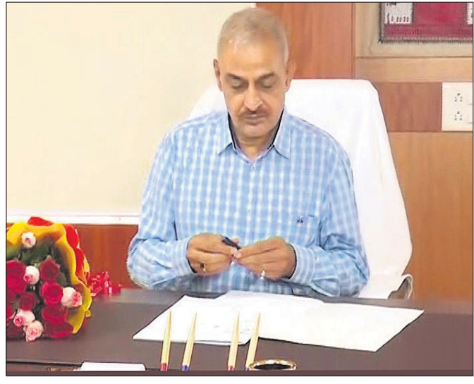
ଭୁବନେଶ୍ୱର, ଗୁରୁଗଣ (ସୁଧା)

ଲୋକାୟୁକ୍ତ ସଦସ୍ୟ ଭାବେ ମନୋନୀତ ହୋଇଥିବା ପୂର୍ବତନ ପୋଲିସ ଡି. ଡା. ରାଜେନ୍ଦ୍ର ପ୍ରସାଦ ଶର୍ମା ଗୁରୁବାର ବିଧିବଦ୍ଧ ଭାବେ କାର୍ଯ୍ୟରେ ଯୋଗଦେଇଛନ୍ତି। ଭୁବନେଶ୍ୱର ସଦନର ଉପସ୍ଥିତିରେ ତାଙ୍କର କାର୍ଯ୍ୟାଳୟରେ ଯୋଗଦେଇଛନ୍ତି। ଭୁବନେଶ୍ୱର ସଦନର ଉପସ୍ଥିତିରେ ତାଙ୍କର କାର୍ଯ୍ୟାଳୟରେ ଯୋଗଦେଇଛନ୍ତି। ଭୁବନେଶ୍ୱର ସଦନର ଉପସ୍ଥିତିରେ ତାଙ୍କର କାର୍ଯ୍ୟାଳୟରେ ଯୋଗଦେଇଛନ୍ତି।