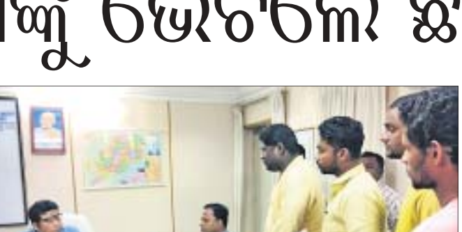
ଆରଡିସିଙ୍କୁ ସହ ଛାତ୍ରାଛାତ୍ର ଆଲୋଚନା କରୁଛନ୍ତି।

ଯୁକ୍ତ ୩ ଦ୍ଵିତୀୟ ଓ ତୃତୀୟ ସେମିଷ୍ଟର ବ୍ୟାକ ଫଳ ପ୍ରକାଶନରେ ବିଳମ୍ବ ନେଇ ରୁରୁବାର ଆରଡିସିଙ୍କୁ ଦ୍ଵାରସ୍ଥ ହୋଇଛନ୍ତି ଛାତ୍ରାଛାତ୍ର।