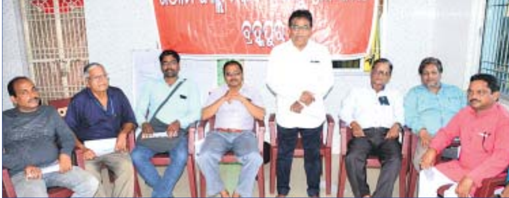
ଖବରଦାତା ସମ୍ମିଳନୀରେ କମିଟିର କର୍ମକର୍ତ୍ତା।

ଜିଲା ଶିକ୍ଷା ଅଧିକାରୀଙ୍କ କାର୍ଯ୍ୟାଳୟକୁ ବ୍ରହ୍ମପୁରରୁ ଛତ୍ରପୁରକୁ ସ୍ଥାନାନ୍ତର ପାଇଁ ରାଜ୍ୟ ସରକାର ଏବଂ ଜିଲାପାଳଙ୍କ ପ୍ରସ୍ତାବକୁ ନେଇ ବିବାଦ ବଢ଼ିବାରେ ଲାଗିଛି।