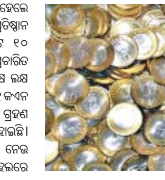
ପରେ ପରିସ୍ଥିତିରେ ସୁଧାର ଆସିଥିବା ବେଳେ ୧୦ ଟଙ୍କିଆ କ୍ୟାନ ଅତଳ ବୋଲି ରୁଜୁ ବସୁଛି ହୋଇଛି।

ବ୍ରହ୍ମପୁର ଅଫିସ, ଗଞ୍ଜାମ ଜିଲାରେ ୧୦ ଟଙ୍କିଆ କ୍ୟାନ ଏବେ ଅତଳ ହୋଇପଡ଼ିଛି। ଯାହା ଏବେ ଲୋକଙ୍କ ମୁଣ୍ଡବ୍ୟଥା ବଢ଼ାଇବାରେ ଲାଗିଛି।