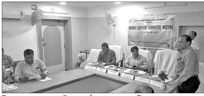
ଡିଏଫଓ ଅକ୍ଷୟ ଦଳେକ ବୈଠକ ସମ୍ପର୍କରେ ସୂଚନା ଦେଉଛନ୍ତି।

ଭଞ୍ଜନଗର, ୮।୮ (ଡି.ଏନ.ଏ.): ଜାପାନ ଲଞ୍ଜର ନ୍ୟାସନାଲ କୋ ଅପରେସନ ଏଜେନ୍ସି (ଜିକା) ଓଡ଼ିଶାରେ ଜଙ୍ଗଲର ଉନ୍ନତି, ପରିବେଶ ସୁରକ୍ଷା ଏବଂ ଜଙ୍ଗଲ ନିକଟବର୍ତ୍ତୀ ଲୋକଙ୍କ ଆର୍ଥିକ ମାନବସ୍ତରେ ଉନ୍ନତି ପାଇଁ ଆର୍ଥିକ ସହାୟତା ଦେଇଛି।