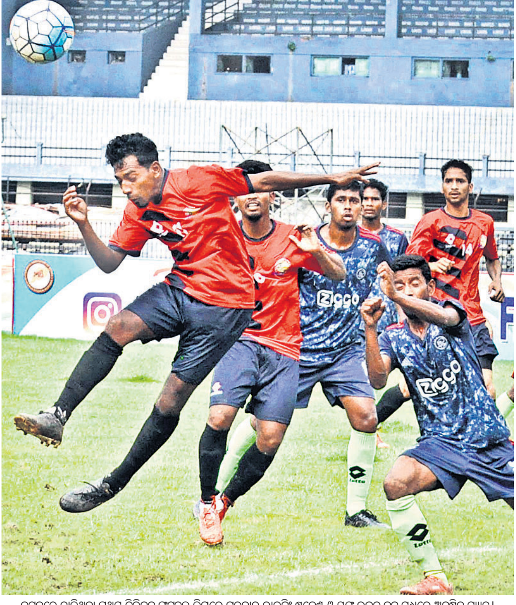
କଟକରେ ରାଜକିଂ ଷ୍ଟୁଡେଣ୍ଟସ୍ ପ୍ରଥମ ଡିଭିଜନ ପୁରୁଷ ଲିଗରେ ଗୁରୁବାର ରାଜକିଂ ଷ୍ଟୁଡେଣ୍ଟସ୍ ଓ ଯଙ୍ଗ ଉତ୍କଳ କ୍ଲବ ମଧ୍ୟରେ ଅନୁଷ୍ଠିତ ମ୍ୟାଚ୍।