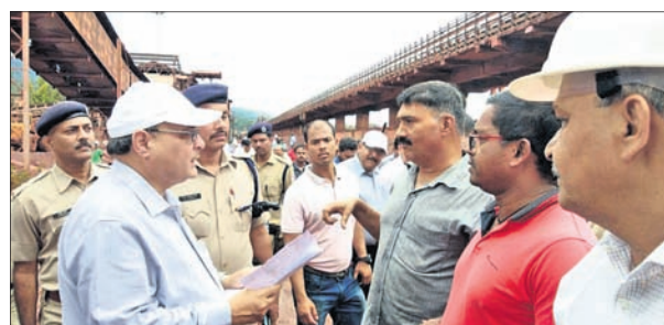
ଦକ୍ଷିଣ-ପୂର୍ବ ରେଳପଥର ମହାପ୍ରବନ୍ଧକ ଅନ୍ୟ ଅଧିକାରୀଙ୍କ ସହ ଅଲୋଡ଼ା କରୁଛନ୍ତି।