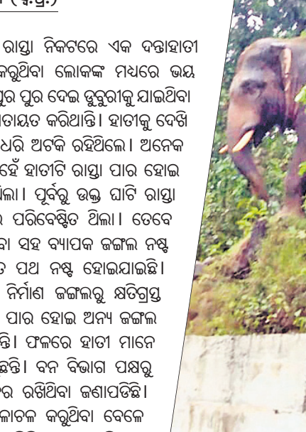
ଘାଟିରେ ଦନ୍ତା ହାତୀ।

ହରିତନ୍ଦନପୁର ବ୍ଲକ୍ କୁଆଖରଣ ଘାଟି ରାସ୍ତା ନିକଟରେ ଏକ ଦନ୍ତାହାତୀ ଏଣେତେଣେ ବୁଲୁଥିବାରୁ ଯାତାୟାତ କରୁଥିବା ଲୋକଙ୍କ ମଧ୍ୟରେ ଭୟ ବେଶାଦେଇଛି। ନରଣପୁର- ହରିତନ୍ଦନପୁର ପୁର ଦେଇ ଚୁରୁଣାକୁ ଯାଇଥିବା ଏହି ରାସ୍ତାରେ ବହୁ ସଂଖ୍ୟାରେ ଗାଡ଼ି ଯାତାୟତ କରିଥାନ୍ତି। ହାତୀକୁ ଦେଖି ରାସ୍ତାରେ ଅନେକ ଯାତ୍ରୀ ଦୀର୍ଘ ସମୟ ଧରି ଅଟକି ରହିଥିଲେ।