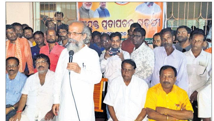
କେନ୍ଦ୍ରମନ୍ତ୍ରୀ ପ୍ରତାପ ଷଡ଼ଙ୍ଗୀ ଉଦ୍‌ବୋଧନ ଦେଉଛନ୍ତି।