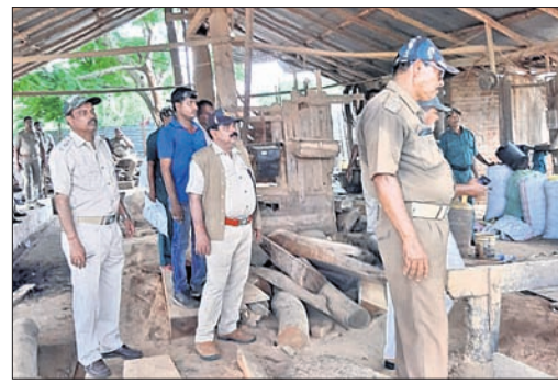
ନିମାପଡ଼ା, ୯୮୮ (ଡି.ଏ.ଏ.ଏ.)