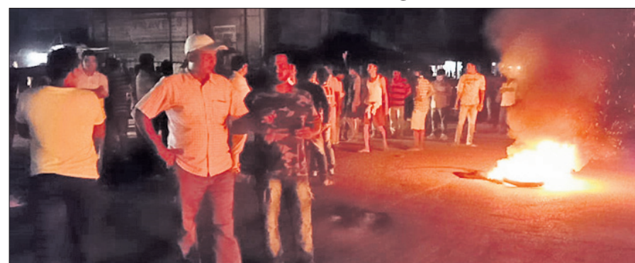
ଗ୍ରାମବାସୀ ରାତ୍ରା ଉପରେ ଚାନ୍ଦାର ଜାଳି ବିସ୍ଫୋର ପ୍ରଦର୍ଶନ କରୁଛନ୍ତି।