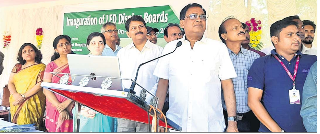
କ୍ୟାପିଟାଲ ହସ୍ପିଟାଲରେ ଏଲ୍.ଇଡି ଡିସ୍‌ବୋର୍ଡ ଉନ୍ନୋଡ଼ିତ ଅବସରରେ ସ୍ୱାସ୍ଥ୍ୟ ଓ ପରିବାର କଲ୍ୟାଣ ମନ୍ତ୍ରୀ ନବକିଶୋର ଦାସ ଓ ଅନ୍ୟମାନେ ।

କୁବନେଶ୍ୱର, ୯୮ (ଭୁବନେଶ୍ୱର) ସ୍ୱାସ୍ଥ୍ୟସେବା କ୍ଷେତ୍ରରେ ସଚେତନତା ବୃଦ୍ଧି ତଥା ସ୍ୱାସ୍ଥ୍ୟସେବା ସମ୍ପର୍କିତ ସମସ୍ତ ଅପ୍ଡେଟ୍ ସୂଚନା ଲୋକଙ୍କ ନିକଟରେ ପହଞ୍ଚାଇବା ଉଦ୍ଦେଶ୍ୟରେ ସ୍ୱାସ୍ଥ୍ୟ ଓ ପରିବାର କଲ୍ୟାଣ ମନ୍ତ୍ରୀ ନବକିଶୋର ଦାସ ଶୁକ୍ରବାର କ୍ୟାପିଟାଲ ହସ୍ପିଟାଲ ପରିସରରେ ଏଲ୍.ଇଡି ଡିସ୍‌ବୋର୍ଡ ବୋର୍ଡ ଉନ୍ନୋଡ଼ିତ କରିଛନ୍ତି । ସ୍ୱାସ୍ଥ୍ୟସେବା ସମ୍ପର୍କରେ ସଚେତନତା ବୃଦ୍ଧି ଏଭଳି ମୋଡ୍ ୧୨ଟି ସ୍ଥାନରେ ଏକାଧରରେ ଏହି ବୋର୍ଡ ଉନ୍ନୋଡ଼ିତ କରାଯାଇଛି । ପ୍ରଥମ ପର୍ଯ୍ୟାୟରେ ବିକ୍ଟୁ ସ୍ୱାସ୍ଥ୍ୟ କଲ୍ୟାଣ ଯୋଜନା, ମ୍ୟାଲେରିଆ, କନଟାଣ୍ଡା କ୍ଷେତ୍ରରେ ମିଳୁଥିବା ସୁଫଳକୁ ଲୋକଙ୍କ ନିକଟରେ ପହଞ୍ଚାଇବା ସହ ବିଭିନ୍ନ ଯୋଜନା ଓ କାର୍ଯ୍ୟକ୍ରମ ସମ୍ପର୍କରେ ସୂଚନା ପ୍ରଦାନ ଉଦ୍ଦେଶ୍ୟରେ ରାଜ୍ୟର ସରକାରୀ ମେଡିକାଲ କଲେଜ ଓ ହସ୍ପିଟାଲ ଏବଂ ଅନ୍ୟ ଡାକ୍ତରଖାନା