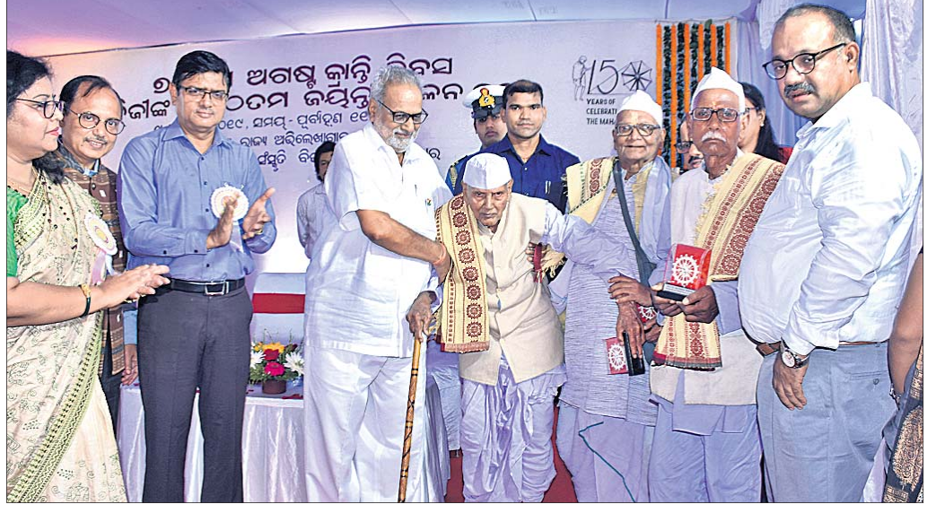
୩ ବର୍ଷୀୟାନ୍ ସ୍ୱାଧୀନତା ସଂଗ୍ରାମୀଙ୍କୁ ରାଜ୍ୟପାଳ ପ୍ରଫେସର ଗଣେଶ ଲାଲ ସମ୍ବର୍ଦ୍ଧିତ କରୁଛନ୍ତି।