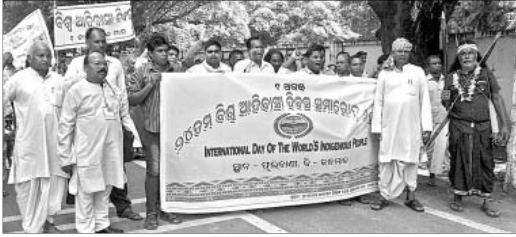
ଅନୁଷ୍ଠିତ ରାଲିରେ ଆଦିବାସୀ ଏବଂ ଅନ୍ୟମାନେ।

କୁଳ ସମାଜ ସେବା ସମିତି ପକ୍ଷରୁ ଶୁକ୍ରବାର ବିଶ୍ୱ ଆଦିବାସୀ ଦିବସ ପାଳିତ ହୋଇଯାଇଛି। ଏହି ଅବସରରେ ଏକ ରାଲି ମାଦିକୁ ନେଇ ସମାଜ ସେବା ସମିତି ଆଦିବାସୀ ପାରମ୍ପରିକ ବେଶରେ ସଜ୍ଜିତ ହୋଇ ଅନ୍ତର୍ଗତ ଧର୍ମପୁର ଯାଇଥିଲେ। ସମସ୍ତେ ଶୋଭାଯାତ୍ରାରେ ସହର ପରିକ୍ରମା କରି ଜିଲାପାଳଙ୍କ କାର୍ଯ୍ୟାଳୟ ସମ୍ମୁଖରେ ପହଞ୍ଚିଥିଲେ। ସେଠାରେ ଏକ ପ୍ରତିବାଦ ସଭାର ଆୟୋଜନ କରାଯାଇଥିଲା।