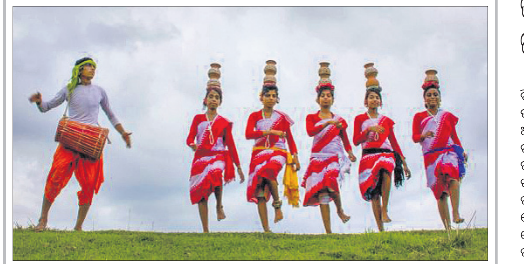
ପଶ୍ଚିମବଙ୍ଗର ନଦୀୟା ଜିଲ୍ଲାରେ ବିଶ୍ୱ ସ୍ୱଦେଶୀ ଲୋକ ବିବସ ପାଳନ ଅବସରରେ କଳାକାରମାନେ ଲୋକନୃତ୍ୟ ପ୍ରଦର୍ଶନ କରୁଛନ୍ତି ।

ଏକ ଭଙ୍ଗସ୍ତରୀୟ ଭେଦକର କରୁଥିବାବେଳେ ଲୋଡ଼ିଛନ୍ତି । କଂଗ୍ରେସ ନେତା ରାଜୁଲ ଗାନ୍ଧୀ ପ୍ରଧାନମନ୍ତ୍ରୀ ନରେନ୍ଦ୍ର ମୋଦିଙ୍କ ସହ କେରଳ ବନ୍ୟା ସ୍ଥିତି ସମ୍ବନ୍ଧରେ ଆଲୋଚନା କରିଛନ୍ତି । ସେ ନିଜ ନିର୍ବାଚନଞ୍ଚଳା ଆୟତ୍ତ ସମେତ ବନ୍ୟା ପ୍ରଭାବିତ ଅନ୍ୟ ଅଞ୍ଚଳର ବିପତ୍ତୀମାନଙ୍କୁ ସହାୟତା ଯୋଗାଇଦେବାକୁ ସେ ପ୍ରଧାନମନ୍ତ୍ରୀଙ୍କୁ ଅନୁରୋଧ କରିଛନ୍ତି । ପ୍ରଧାନମନ୍ତ୍ରୀ ସମସ୍ତ ସହାୟତା ଯୋଗାଇଦିଆଯିବାର ପ୍ରତିଶ୍ରୁତି ଦେଇଥିବା ରାଜୁଲ କୁହୁଛନ୍ତି । ମହାରାଷ୍ଟ୍ରର ବିଭିନ୍ନ ଜିଲ୍ଲାରେ ବନ୍ୟା ସଜୀବ ରହିଛି । ସର୍ବାଧିକ ପ୍ରଭାବିତ ସାଙ୍ଗଲି ଓ କୋଲ୍‌ପୁର ଜିଲ୍ଲାରେ ସେନା କେରଳ ମୁଖ୍ୟମନ୍ତ୍ରୀ ପିନାରାୟା ବିଜୟନ ରିଲିଫ୍ ଓ ଉଦ୍ଧାର କାର୍ଯ୍ୟ ନେଇ