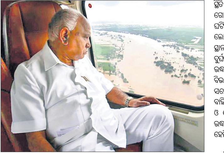
ପୁରୀମନ୍ତ୍ରୀ ଡି.ଏମ୍. ଘେଡୁରସ୍ତା ଆକାଶ ମାନ୍ତ୍ରୀଙ୍କୁ ବନ୍ୟାଅଞ୍ଚଳ ପରିଦର୍ଶନ କରୁଛନ୍ତି ।