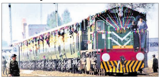
ନୂଆଦିଲ୍ଲୀ, ୯୮୮ (ପି.ଟି.)