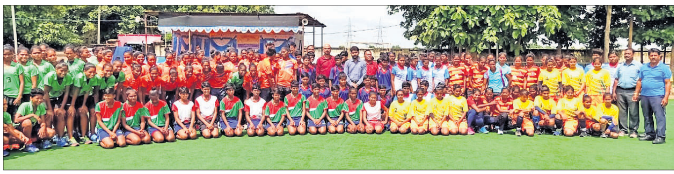
ରାଉରକେଲାରେ ଶୁକ୍ରବାର ଆରମ୍ଭ ହୋଇଥିବା ରାଜ୍ୟ ମହିଳା ହକି ଚାମ୍ପିୟନଶିପରେ ଭାଗ ନେଇଥିବା ୮ ଦଳର ଖେଳାଳିମାନେ କର୍ମକର୍ତ୍ତାଙ୍କ ସହ ।

ନହରାଇ ୯ ରନ କରିଥିବାବେଳେ ବର୍ଷା ଅପରାଜିତ ରହିଥିଲେ । ଓପନର କ୍ରିସ୍ ଗେଲ୍ ୩୧ ବଲ୍‌ରୁ ମାତ୍ର ୪ ରନ କରି କୁଲଟାପ ଯାଦବଙ୍କ ବଲ୍‌ରେ କ୍ଲିନ୍ ବୋଲ୍ଡ ହୋଇଥିଲେ । ବର୍ଷା କ୍ରିକେଟର ଛାଡ଼ିଥିଲେ ହେଁ ପୁଣି ବର୍ଷା ହେବାରୁ ଫିଲ୍ଡ କର୍ତ୍ତାମାନଙ୍କୁ ଦୃଷ୍ଟିରେ ରଖି ଅଧିକାର ମ୍ୟାଚକୁ ବାତିଲ କରିଥିଲେ । ଦ୍ୱିତୀୟ ଦିନିକିଆ ୧୧ ତାରିଖରେ ପୋର୍ଟ ଅଫ୍ ଷ୍ଟେନର କୁଲଟାପ ପାଇଁ ଓଭର ଗ୍ରାଉଣ୍ଡରେ ଅନୁଷ୍ଠିତ ହେବ ।