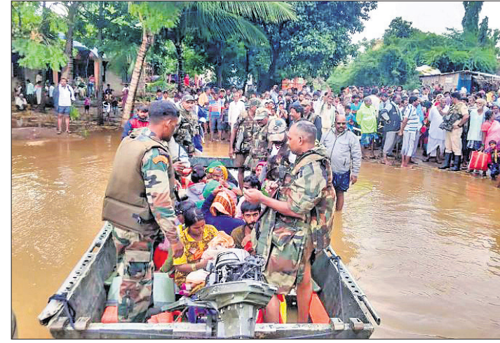
କର୍ନାଟକର ବେଲଗାଭି ଜିଲ୍ଲାରେ ସେନା ସହାୟକ ଭାବେ ଉଦ୍ଧୃତ ଲୋକଙ୍କୁ ଉଦ୍ଧାର କରୁଛନ୍ତି ।