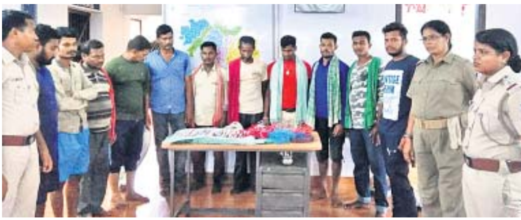
ଜବତ ବିସ୍ଫୋରକ ସାମଗ୍ରୀ ସହ ଗିରଫ ୧୨ ଅଭିଯୁକ୍ତ।