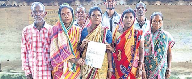
୪ ଯୁବକ ଅଭିଭାବକ।