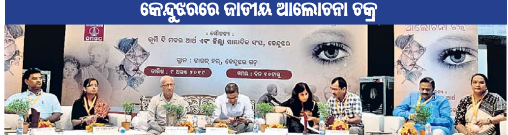
କର୍ମଶାଳାରେ ଉପସ୍ଥିତ ଅତିଥି।