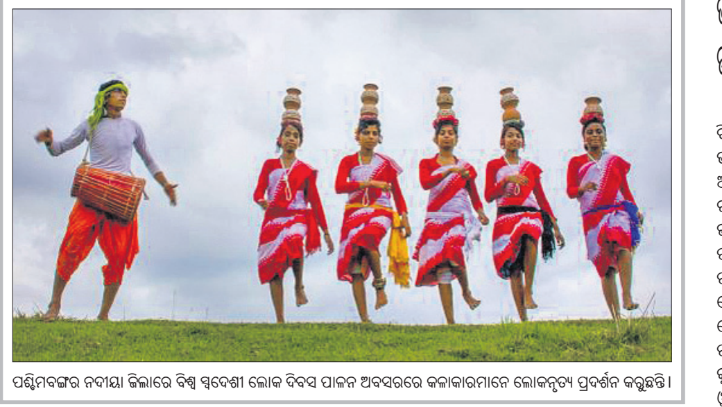
ପଶ୍ଚିମବଙ୍ଗର ନଦୀୟା ଜିଲ୍ଲାରେ ବିଶ୍ୱ ସ୍ୱଦେଶୀ ଲୋକ ବିବସ ପାଳନ ଅବସରରେ କଳାକାରମାନେ ଲୋକନୃତ୍ୟ ପ୍ରଦର୍ଶନ କରୁଛନ୍ତି।