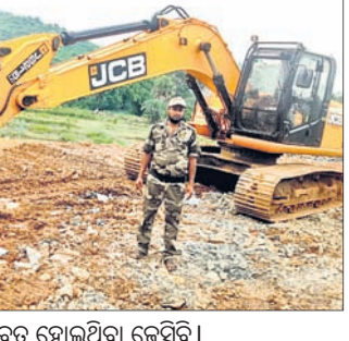
ଜବତ ହୋଇଥିବା ହେଭି ମେଶିନ।