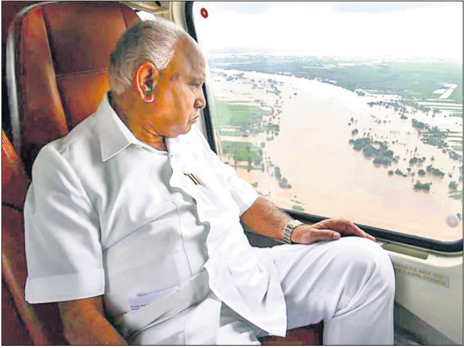
ପୁସ୍ତକପୁର ବି.ଏସ୍. ଯେତୁରସ୍ତା ଆକାଶ ମାର୍ଗରୁ ବନ୍ୟାଜନିତ ପରିଦର୍ଶନ କରୁଛନ୍ତି।

ଭୁଜରାଟକୁ ରାଜ୍ୟକୁ ଏନଡିଆରଏଫ୍ ୮୩ ଟିଏ ପଠାଯାଇଛି। ଏହାବ୍ୟତୀତ ତିନି ସେନା ଓ ତତସୁରକ୍ଷା ସାହାଯ୍ୟ ମୋଟ ୧୭୩ ଟିଏ ଉଦ୍ଧାର କାର୍ଯ୍ୟରେ ନିୟୋଜିତ ଅଛନ୍ତି। ସ୍ୱରାଷ୍ଟ୍ର ରାଷ୍ଟ୍ରମନ୍ତ୍ରୀ ନିତ୍ୟାନନ୍ଦ ରାୟଙ୍କ ଅଧିକାରରେ ଉଚ୍ଚସ୍ତରୀୟ ଟିଏ ବିଭିନ୍ନ ରାଜ୍ୟର ବନ୍ୟା ପରିସ୍ଥିତି ସମୀକ୍ଷା କରାଯାଇଛି। କେରଳରେ ବର୍ଷା ଓ ଭୃଷ୍ଟକଳ ଯୋଗୁ ଟ୍ରେନ୍ ଚଳାଚଳ ବାଧାପ୍ରାପ୍ତ ହୋଇଛି। ଅଧିକାଂଶ ନଦୀ ବିପଦ ସଙ୍କେତ ଉପରେ ପ୍ରବାହିତ ହେବା ସହ ବିଭିନ୍ନ ସ୍ଥାନରେ ବନ୍ୟା ସୃଷ୍ଟି ହୋଇଛି। ଓଡ଼ିଶାରେ ମାଲକାନଗିରି, କରାୟାପାଳି, କଟୁର ଏବଂ ଭୁବନେଶ୍ୱର ଜିଲ୍ଲା ସର୍ବାଧିକ ପ୍ରଭାବିତ ହୋଇଛି। କୋଟି ବିମାନ ବନ୍ଦରକୁ ରବିବାର ପର୍ଯ୍ୟନ୍ତ ବନ୍ଦ ରଖି କେରଳ, ମହାରାଷ୍ଟ୍ର, କର୍ଣ୍ଣାଟକ ଓ