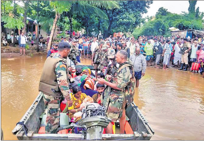
କର୍ଣ୍ଣାଟକର ବେଲଗାଭି ଜିଲ୍ଲାରେ ସେନା ସହାୟକ ଭାବେ ଯେତୁର ଲୋକଙ୍କୁ ଉଦ୍ଧାର କରୁଛନ୍ତି।

ପ୍ରବଳ ବର୍ଷା ଯୋଗୁ ମହାରାଷ୍ଟ୍ର, କର୍ଣ୍ଣାଟକ, ଉତ୍ତରାଞ୍ଚଳ ଓ କେରଳ ସମେତ ୭ଟି ରାଜ୍ୟରେ ବନ୍ୟାରେ କରାଳ ରୂପ ଦେଖିବାକୁ ମିଳିଛି। କେରଳରେ ବର୍ଷା ଓ ଭୃଷ୍ଟକଳ ଜନିତ ମୃତ୍ୟୁସଂଖ୍ୟା ୩ ଦିନରେ ୩୦ରେ ପହଞ୍ଚିଥିବାବେଳେ ୨୨ ହଜାରରୁ ଅଧିକ ଲୋକଙ୍କୁ ବିଭିନ୍ନ ରିଲିଫ୍ କେନ୍ଦ୍ରକୁ ସ୍ଥାନାନ୍ତର କରାଯାଇଛି। ସେହିପରି ମହାରାଷ୍ଟ୍ରରେ ୫ ଲକ୍ଷରେ ବନ୍ୟାଜନିତ ମୃତ୍ୟୁସଂଖ୍ୟା ୩୭ରେ ପହଞ୍ଚିଛି। କର୍ଣ୍ଣାଟକ ସରକାର ଆଲଫାଡି ୩୮୦ ୪.୮୦ ଲକ୍ଷ କ୍ୟୁସେକ୍ ଜଳ ଛାଡ଼ିଥିବାରୁ ମହାରାଷ୍ଟ୍ର ବନ୍ୟା ପରିସ୍ଥିତି ଆହୁରି ସଜୀବ ହେବାକୁ ଯାଉଛି। କର୍ଣ୍ଣାଟକରେ ବନ୍ୟା ସ୍ଥିତି ଗମ୍ଭୀର ରହିଛି। ବେଲାଗାଭି ଜିଲ୍ଲା ସର୍ବାଧିକ କ୍ଷତିଗ୍ରସ୍ତ ହୋଇଛି। ହଜାର ହଜାର ଲୋକ ବନ୍ୟାପୀଡ଼ିତ ହେବାରେ ରହିଥିବାବେଳେ ଲକ୍ଷାଧିକ ଏକର ଚାଷଜମି ଜଳମଗ୍ନ ହୋଇଛି। ପୁସ୍ତକପୁର ବି.ଏସ୍. ଯେତୁରସ୍ତା ଆକାଶମାର୍ଗରୁ ବନ୍ୟାସ୍ଥିତି ଅନୁଧ୍ୟାନ କରିଛନ୍ତି। ଭୁଜରାଟର ପ୍ରବଳ ବର୍ଷା ଯୋଗୁ ସାଧାରଣ ଜୀବନଯାତ୍ରା ବ୍ୟାଧତ ହୋଇଛି। ନର୍ମଦା ନଦୀର ସର୍ବାଧିକ ସରୋବର ତ୍ୟାମ୍ବରେ ଜଳସ୍ତର ପ୍ରଥମ ଥର ପାଇଁ ୧୩୧ ମିଟରରେ ପହଞ୍ଚିଛି। ୨୧ ହଜାରରୁ ଅଧିକ ଲୋକଙ୍କୁ ସ୍ଥାନାନ୍ତର କରାଯାଇଛି। ଓଡ଼ିଶାରେ ମାଲକାନଗିରି ଓ ରାୟଗଡ଼ା ଜିଲ୍ଲାରେ ବନ୍ୟା ପରିସ୍ଥିତି ସୃଷ୍ଟି ହୋଇଛି। ଉତ୍ତର ଓ ରିଲିଫ୍ କାର୍ଯ୍ୟ ଲାଗି କେରଳ, ମହାରାଷ୍ଟ୍ର, କର୍ଣ୍ଣାଟକ ଓ