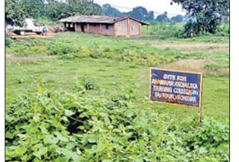
ନୂଆଘର ପାଇଁ ଚିହ୍ନଟ କାଗା।

ଫକୀରପୁରରେ ଥିବା ଆନନ୍ଦପୁର ଆଞ୍ଚଳିକ ତାଲିମ କେନ୍ଦ୍ର ଭିତ୍ତିଭୂମି ପାଇଁ ସ୍ଥିତି ହରାଇବା ଭଳି ପରିସ୍ଥିତି ସୃଷ୍ଟି ହୋଇଛି। ଏଠାରେ ବିଏଡ଼ କଲେଜର ନୂତନ ଗୃହ ନିର୍ମାଣ ଲାଗି କାଗା ଚିହ୍ନଟ କରାଯାଇଛି, ହେଲେ ଗୃହ ନିର୍ମାଣ କାର୍ଯ୍ୟ ଆରମ୍ଭ ଲାଗି ପଥ ପରିଷ୍କାର ହୋଇପାରୁ ନାହିଁ। ଏହାପରେ ଗ୍ଲାନ୍ ନିରୁପଣ କମିଟିର ଚେର ୫ ଅର ବସିଯାଇଛି। ଏହା ଅନୁଦାନ ଆସି ଫେରିଥିବା ବେଳେ ଗ୍ଲାନ୍ ଅନୁଦାନ ଆସି ଫେରିବାକୁ ବସିଛି। ଏନେଇ ପରିସରରେ କାରଣ ଦର୍ଶାଏ ନୋଟିସ୍ କାରି ବିଏଡ଼ କଲେଜ କର୍ତ୍ତୃପକ୍ଷଙ୍କ