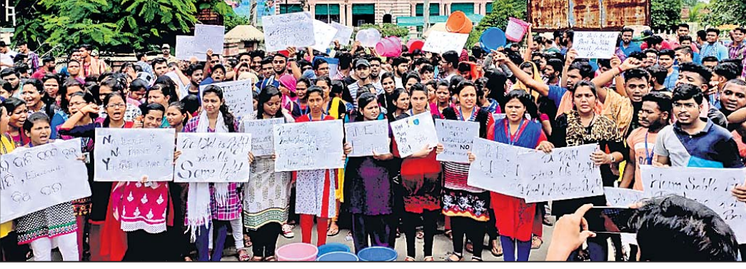
ସରକାରୀ ଲକ୍ଷ୍ମୀକାନ୍ତ କଲେଜ ଛାତ୍ରାଛାତ୍ରୀ ବିକ୍ଷୋଭ ପ୍ରଦର୍ଶନ କରୁଛନ୍ତି।

ବିଭିନ୍ନ ସମସ୍ୟା ପ୍ରତିକାର ଦାବିରେ ଶ୍ରମିକ ସଂଘର ସଭାପତି ଲକ୍ଷ୍ମୀକାନ୍ତ କଲେଜର ଛାତ୍ରାଛାତ୍ରୀ ଶ୍ରମିକ ସଂଘର ଜିଲ୍ଲାପାଳଙ୍କ କାର୍ଯ୍ୟାଳୟ ଆଗରେ ବିକ୍ଷୋଭ ପ୍ରଦର୍ଶନ କରିଥିଲେ। ସେମାନେ ଦୀର୍ଘ ବର୍ଷ ହେଲା ବିଦ୍ୟୁତ୍, ପିଇବାପାଣି ଭଳି ସମସ୍ୟା ଭୋଗ କରି ଆସୁଥିବାକୁ ଏହାର ପ୍ରତିବାଦରେ ଗତ ରୁପସାରେ କଲେଜ ପରିସରରେ ବିକ୍ଷୋଭ ପ୍ରଦର୍ଶନ କରିଥିଲେ। ଏହାସହ କୌଣସି କାର୍ଯ୍ୟାଳୟର ନ ହେବାକୁ ସେମାନେ ଶ୍ରମିକ ସଂଘର ଜିଲ୍ଲାପାଳଙ୍କ କାର୍ଯ୍ୟାଳୟ ନିକଟକୁ ଶୋଭାଯାତ୍ରାରେ ଆସି ବିକ୍ଷୋଭ ପ୍ରଦର୍ଶନ କରିଥିଲେ। ଏ ପରିକ୍ଷେପରେ ପ୍ଲାକାର୍ଡ ଓ ପାଣି ବାଲିଟି ଧରି ଅଭିଭବ ଭଙ୍ଗରେ ବିରୋଧ ପ୍ରକଟ କରୁଥିଲେ। ଶ୍ରମିକ ସଂଘ କାର୍ଯ୍ୟକ୍ରମ ପ୍ରତିଆରୁ ସେମାନେ ଶୋଭାଯାତ୍ରାରେ ବାହାରି ବିଭିନ୍ନ ସମସ୍ୟାକୁ ଗୋଟାଇ ଦେଇ ସହର ପରିକ୍ରମା କରିଥିଲେ। ଜିଲ୍ଲାପାଳ କାର୍ଯ୍ୟାଳୟରେ ନ ଥିବାରୁ ତାଙ୍କୁ ଭେଟିବା ଲାଗି ଛାତ୍ରାଛାତ୍ରୀ ଅପରାହ୍ଣ ପର୍ଯ୍ୟନ୍ତ ଅପେକ୍ଷା କରି ରହିଥିଲେ। ସହର ଠାରୁ ଅନତି ଦୂରରେ ଥିବା ଏକ ପାହାଡ଼ ତଳେ ଏହି କଲେଜ