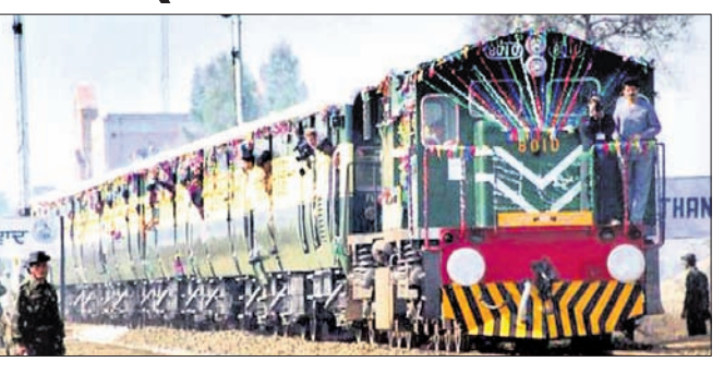
ନୂଆଦିଲ୍ଲୀ, ୯।୮ (ପି.ଟି.)

ଶିକ୍ଷାନୁଷ୍ଠାନ ଖୋଲିବା ପାଇଁ ଜିଲ୍ଲାପାଳ ପୁସ୍ତକାଳ ଶ୍ରୀନଗର ନିର୍ଦ୍ଦେଶ ଦେଇଛନ୍ତି। ଉଭୟ କଣ୍ଠୀରେ ଯୋଗାଯୋଗରେ ସୁରକ୍ଷା ବଳକୁ ଚେକାମାତ୍ର ହୋଇଥିବା ଜଣାପଡ଼ିଛି। କୌଣସି ପ୍ରକାର ଅସୁବିଧାକୁ ଏଡ଼ାଇବା ପାଇଁ ପ୍ରାୟ ସବୁ ସମ୍ବେଦନଶୀଳ ସ୍ଥାନରେ ସୁରକ୍ଷା କର୍ମୀ ପୂର୍ବଭଳି ରୁକ୍ଷୟନ ରହିଛନ୍ତି। ଅନ୍ୟପକ୍ଷରେ ୩୭୦ ଉଲ୍ଲେଦ ପ୍ରତିବାଦରେ ଦିଲ୍ଲୀରେ କଣ୍ଠୀରାମାନେ ବିକ୍ଷୋଭ ପ୍ରଦର୍ଶନ କରିଛନ୍ତି। କଣ୍ଠୀ-କଣ୍ଠୀରୁ ଆସି ଦିଲ୍ଲୀ-ଏନ୍‌ଏସ୍‌ଆରରେ ରହୁଥିବା ଛାତ୍ର ଓ କର୍ମଚାରୀମାନେ ସହରମଧ୍ୟରେ ଗୋଡ଼ୁର ପୁଲ୍ଲିରେ କଳାପଟି ବାନ୍ଧି ଓ ହାତରେ ପୁକାର୍ଡ ଧରି କେନ୍ଦ୍ର ବିରୋଧୀ ଘୋଷାଦାନ ଦେଇଛନ୍ତି। ଉପତ୍ୟକାରେ ଯୋଗାଯୋଗର ମାଧ୍ୟମ ବିଚ୍ଛିନ୍ନ ହୋଇଥିବାରୁ ୫ ଦିନ ହେଲା ସେମାନେ ନିଜ ପରିବାର ସହ ଫୋନ୍‌ରେ କଥା ହୋଇପାରି ନ ଥିବା ଦିଲ୍ଲୀ ଯୁଦ୍ଧିଭବିତ, ଜାମିଆ ମିଲିଆ ଇସ୍ଲାମିଆ ଏବଂ କେଏନ୍‌ସୁ ଛାତ୍ରଛାତ୍ରୀ ଅଭିଯୋଗ କରିଛନ୍ତି।