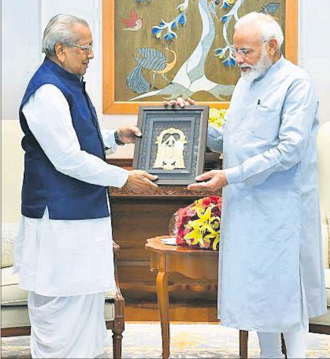
ଅନ୍ତ ପ୍ରବେଶ ରାଜ୍ୟପାଳ ବିଶ୍ୱକୃଷ୍ଣା ହରିଚନ୍ଦନ ନୂଆଦିଲ୍ଲୀରେ ପ୍ରଧାନମନ୍ତ୍ରୀ ନରେନ୍ଦ୍ର ମୋଦିଙ୍କୁ ସୌଜନ୍ୟପୂର୍ବକ ସାକ୍ଷାତ୍ ଅବସରରେ ଏକ ଉପହାର ପ୍ରଦାନ କରୁଛନ୍ତି।

ପହଞ୍ଚିଥିବାବେଳେ ଚଳିତବର୍ଷ ଶେଷଭାଗ ଏଥିରେ ରେଳ ଚଳାଚଳ ଆରମ୍ଭ କରିବାକୁ ଲକ୍ଷ୍ୟ ରହିଛି। ସେହିପରି ୩୫୫୦ କୋଟି ଟଙ୍କା ବିନିଯୋଗରେ ନିର୍ମାଣ ହେଉଥିବା ଖୋର୍ଦ୍ଧାକୁ ବଳାଙ୍ଗୀର ୧୧୨ କିମି ରେଳପଥ ପାଇଁ କମି ରେଳଫେଡ଼ରାସ୍ତା ହସ୍ତାନ୍ତର କରାଯାଇଛି। ଅବଶିଷ୍ଟ କମି ଅଧିଗ୍ରହଣ କାର୍ଯ୍ୟ ଦ୍ୱାରା ହୋଇଛି। ଅନ୍ୟପକ୍ଷରେ ୧୧୩୦ କୋଟି ଟଙ୍କା ବ୍ୟୟ ଅଟକଳ ହୋଇଥିବା ବାଣପାଣି-ଜଣପୁରା ରେଳ ରାସ୍ତାର ବୋହରାକରଣ, ରାଉରକେଲା-ଝାରସୁଗୁଡ଼ା ରେଳପଥ, କୋରାପୁଟ-ସିନ୍ଦ୍ୱାପୁର ରାସ୍ତାର ବେହରାକରଣ, ଜରପଦା-ବୁଢ଼ାପାଳ-ତାଳଚେର ରେଳପଥ ଓ ଫୁାପ ଓଲଟ, ଭଦ୍ରକ-ନିରୁକ୍ତି ରେଳପଥ, କୋଟାଭାଲ୍ୟା-କୋରାପୁଟ ରେଳପଥ, ବୁଢ଼ାପାଳ-ସାଲେଗାଁ ରେଳପଥ, ବିଜୟନଗର-ସଞ୍ଜଲପୁର ରେଳପଥ ଆଦି ପ୍ରକଳ୍ପର ଅଗ୍ରଗତି ସମ୍ପର୍କରେ ସମୀକ୍ଷା କରାଯାଇଛି।