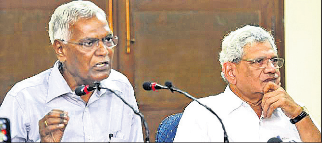
କର୍ଣ୍ଣାଟକର ଯେତୁରୀ ଓ ରାଜା ଶୁକ୍ରବାର ମିଳିତ ଭାବେ ସେମାନଙ୍କୁ ଗସ୍ତ ସମ୍ପର୍କରେ ଅବଗତ କରି ଅନୁମତି ମାଗିଥିଲେ।

ଅନ୍ୟ ସହଯୋଗୀଙ୍କୁ ଭେଟିବା ପାଇଁ ଶ୍ରୀନଗର ଯାଇଥିଲେ। ବିମାନବନ୍ଦରରେ ଓହ୍ଲାଇବା ପରେ ସୁରକ୍ଷା କାରଣରୁ ଉଭୟଙ୍କୁ ସେଠାରେ ଅଟକ ରଖାଯାଇଥିଲା। ପରେ ସେମାନଙ୍କୁ ଦିଲ୍ଲୀ ଫେରାଇ ଦିଆଯାଇଥିଲା। ଦୁଇନେତା ଯେତୁରୀ ଓ ରାଜା ଶୁକ୍ରବାର ମିଳିତ ଭାବେ ସେମାନଙ୍କୁ ଗସ୍ତ ସମ୍ପର୍କରେ ଅବଗତ କରି ଅନୁମତି ମାଗିଥିଲେ। ଏହାସତ୍ତ୍ୱେ ଯିବାକୁ ଅନୁମତି ନ ମିଳିବା କେନ୍ଦ୍ରର ଭାଜପା ସରକାରଙ୍କ ଏକଲୁତ୍ତବାଦୀ ଓ ଅଗଣତାନ୍ତ୍ରିକ କାର୍ଯ୍ୟ ବୋଲି ବାମପକ୍ଷୀ ନେତାମାନେ ସମାଲୋଚନା କରିଛନ୍ତି।