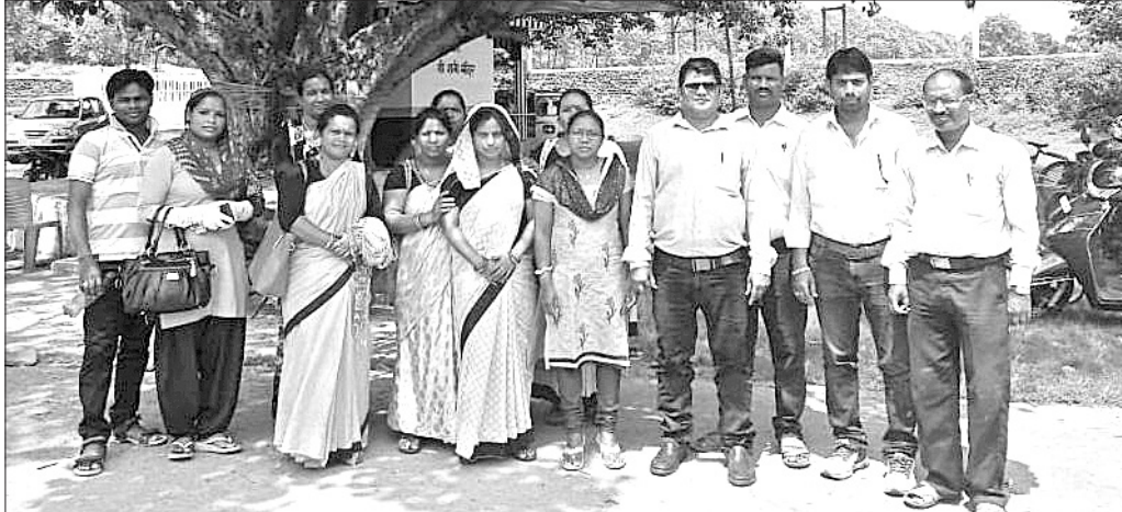
ଓଡ଼ିଇଟି ପରୀକ୍ଷାରେ ଓଡ଼ିଆ ଭାଷାରେ ଆସିଥିବା ପ୍ରଶ୍ନପତ୍ରରେ ଗୁରୁତର ତ୍ରୁଟିକୁ ଆଶାଯାମାନେ ଦୃଢ଼ ବିରୋଧ କରୁଛନ୍ତି ।