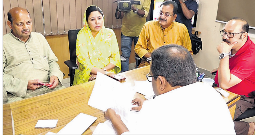
ଭାଜପା ପ୍ରତିନିଧି ଦଳ ଏସ୍ଆରସି ବିଷୟରେ ସେଠାକୁ ସାକ୍ଷାତ କରୁଛନ୍ତି ।