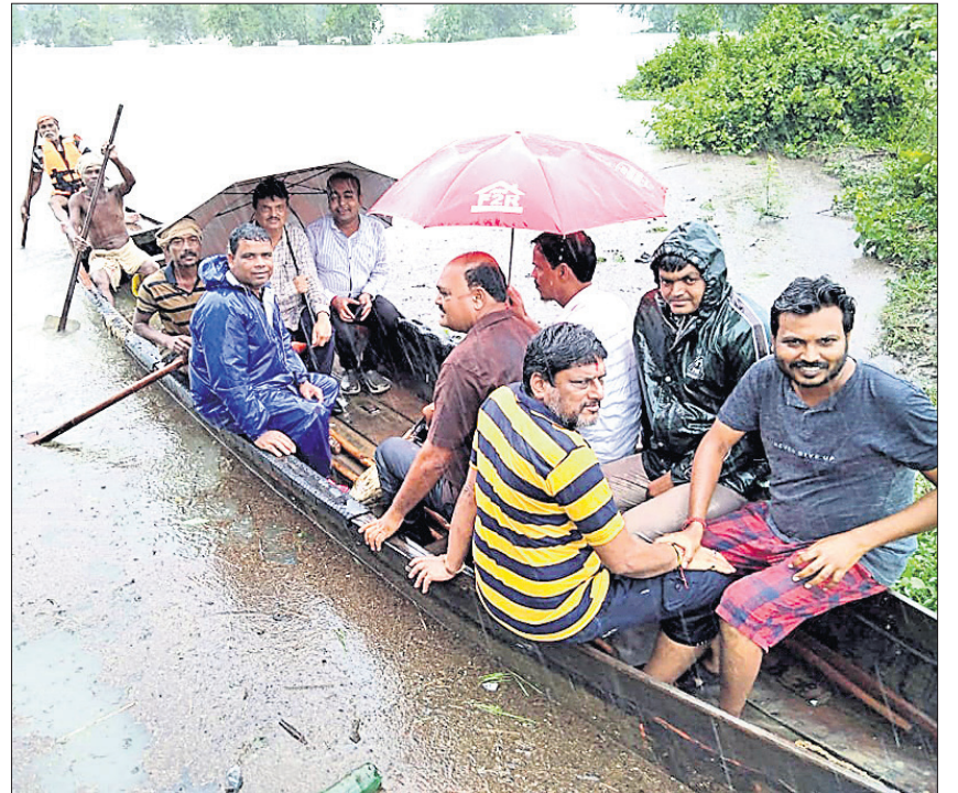
ଅର୍ଥମନ୍ତ୍ରୀ ନିରଞ୍ଜନ ପୂଜାରୀ ତତ୍ତ୍ୱାବେଶରେ ସୁବର୍ଣ୍ଣପୁର ଜିଲା ତରଭାର ଏକ ଜଳବନ୍ଦୀ ଗ୍ରାମକୁ ଯାଉଛନ୍ତି ।