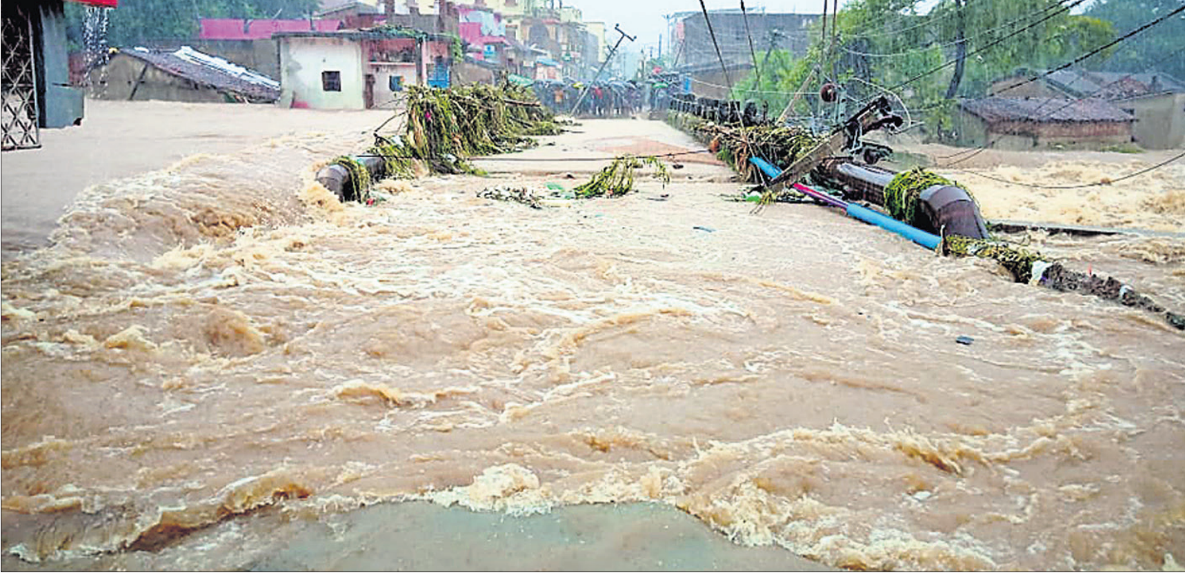
ବଲାଙ୍ଗୀର ସହର ବରପାଲିପଡା ପୋଲ ଉପରେ ବନ୍ୟାଜଳ ପ୍ରବାହିତ ହେଉଥିବାରୁ ଯୋଗାଯୋଗ ବିଚ୍ଛିନ୍ନ ହୋଇଛି ।