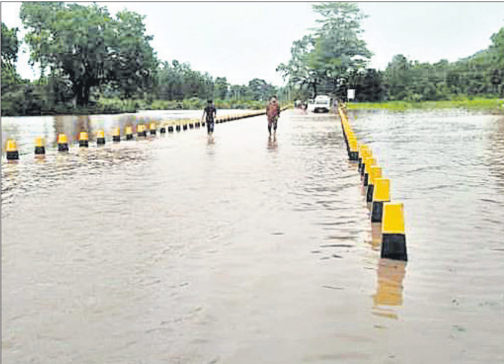
ବୌଦ୍ଧ ଜିଲା କଣ୍ଟାମାନ ବ୍ଲକ ମଲିକୁଦ ବ୍ଲକ ଉପରେ ବନ୍ୟାପାଣି ପ୍ରବାହିତ ହେଉଛି ।