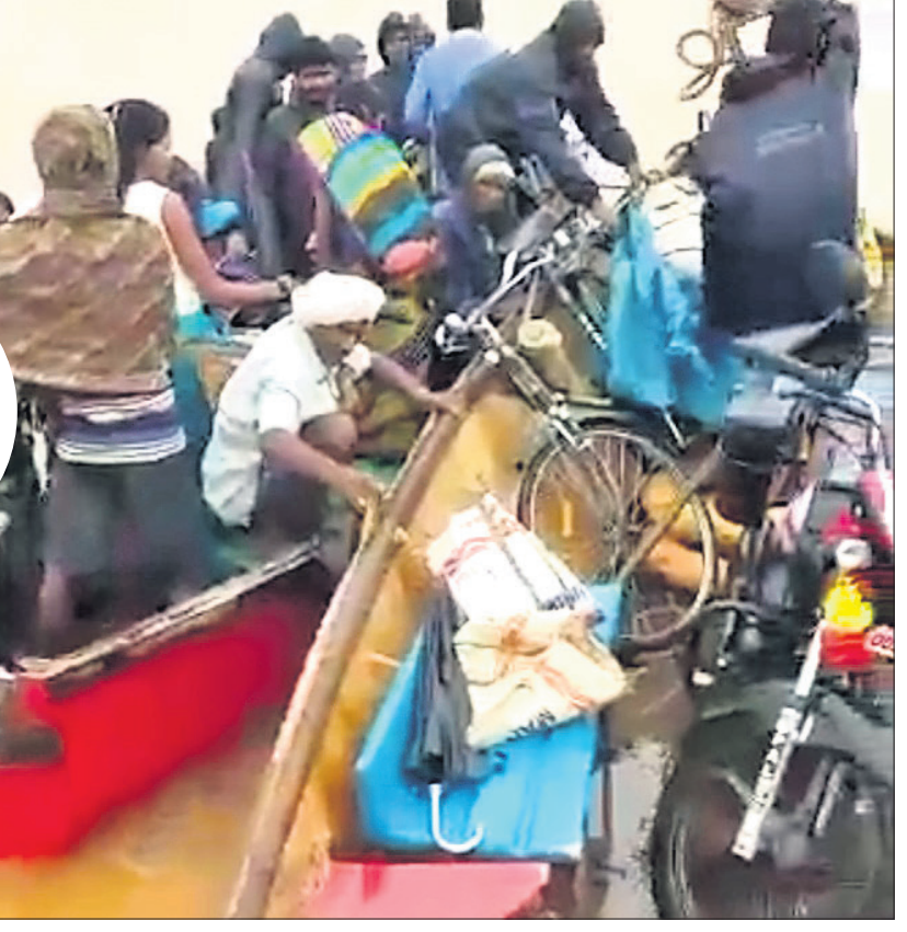
ଇନ୍ଦ୍ରାବତୀ ଜଳଭଣ୍ଡାର ମଝିରେ ଫସି ଥିବା ଯାତ୍ରୀଙ୍କୁ ଅନ୍ୟ ଏକ ତଳାରେ ଅଣାଯାଇଛି।