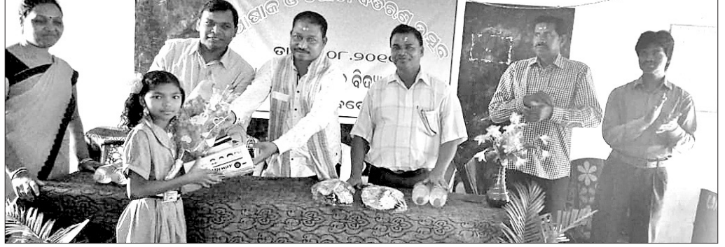
ଜଣେ ଛାତ୍ରୀଙ୍କୁ ପୋଷାକ ବିତରଣ କରାଯାଇଛି ।

ସବ୍‌ଡେଗା ବ୍ଲକର ବିଭିନ୍ନ ବିଦ୍ୟାଳୟରେ ପୋଷାକ ବିତରଣ ଉଦ୍ଦେଶ୍ୟରେ ଅନୁଷ୍ଠିତ ହୋଇଯାଇଛି । ସ୍ୱାଧୀନତା ଦିବସ ପୂର୍ବରୁ ସମସ୍ତ ବିଦ୍ୟାଳୟରେ ପୋଷାକ ବିତରଣ କରାଯିବାକୁ ବିଭାଗ ତରଫରୁ ନିର୍ଦ୍ଦେଶନାମା ଜାରି କରାଯାଇଛି । ବିଦ୍ୟାଳୟ ପରିଚାଳନା କମିଟି, ପିଟିଏ, ଗ୍ରାମ୍ୟ ଉପବ୍ୟକ୍ତି, ସିଆରସିସି, ବିଆରସିସି, ବ୍ଲକ ଶିକ୍ଷା ଅଧିକାରୀ ପ୍ରମୁଖଙ୍କ ଉପସ୍ଥିତିରେ ପୋଷାକ ବିତରଣ କରାଯାଇଛି । ଏହି କ୍ରମରେ ସରକାରୀ ଉଚ୍ଚ ପ୍ରାଥମିକ ବିଦ୍ୟାଳୟ ଯମୁନାଠାରେ ଏହି ଉଦ୍ଦେଶ୍ୟରେ କରାଯାଇଛି । ସ୍ଥାନୀୟ ଚଳସରା ବିଧାୟକ ଭବାନୀଶଙ୍କର ଭୋଇ, ସବ୍‌ଡେଗା ବ୍ଲକ ଶିକ୍ଷା ଅଧିକାରୀ ଅଜୟ କୁମାର ଏଙ୍କା,