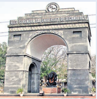
ଅଧ୍ୟାପକ ସଂଗଠନକୁ ବେଆଇନ ଘୋଷଣା

ରାଜ୍ୟପାଳଙ୍କ କାର୍ଯ୍ୟାଳୟ ଡିଠିର ଏ ନେଇ ଅବଗତ କରାଯାଇଥିଲା। ଅଧ୍ୟାପକ ସଂଘ ସଭାପତି ପୁଷ୍ପରାଜ ଦାସଙ୍କୁ ବହିଷ୍କାର, ସମ୍ପାଦକ ପ୍ରଦୀପ ଦାସ ଏବଂ ଉପସଭାପତି ପାଣ୍ଡବ ପାତ୍ରଙ୍କୁ ନିଲମ୍ବନ କରାଯାଇଥିଲା। ଅନ୍ୟ ୧୫ ଜଣଙ୍କୁ କାରଣବଶୀ ଅନୈସିକ କାର୍ଯ୍ୟକାରୀ କରାଯାଇଥିଲା। ପରବର୍ତ୍ତୀ ସମୟରେ ସଭାପତି ଦାସଙ୍କ ବହିଷ୍କାର ଆନ୍ଦୋଳନକୁ କୋଳ କରାଯାଇ ନିଲମ୍ବନରେ ପରିଣତ କରାଯାଇଥିଲା। ବିଶ୍ଵବିଦ୍ୟାଳୟ ପରିସରରେ ବିଶ୍ଵକଳିତ ଆଚରଣ, ଅଧ୍ୟାପକଙ୍କୁ ପ୍ରତାପିତ କରି ଆନ୍ଦୋଳନ କରିବା, କୁଳସଚିବ ବିରୋଧରେ ନାରାବାଦି, ଗଣେଶୀଙ୍କୁ ଆଗରେ ବିଶ୍ଵବିଦ୍ୟାଳୟ ଓ କୁଳସଚିବ ବିରୋଧରେ ମତ୍ତସ୍ତ ଦେବା ଯୋଗୁଁ ଶିକ୍ଷାନୁଷ୍ଠାନର ଗାରିମା ନଷ୍ଟ ହେଉଛି। ଶିକ୍ଷାଧାର ଓ ଖାତାବେଶା କାର୍ଯ୍ୟରେ ଅବହେଳା କରାଯାଉଥିବାରୁ ଏହାର ପ୍ରତାପ ଛାଡ଼ିବାକୁ ଓ ଅଧିକାରକ ଉପରେ ପଡ଼ୁଛି ଏହି