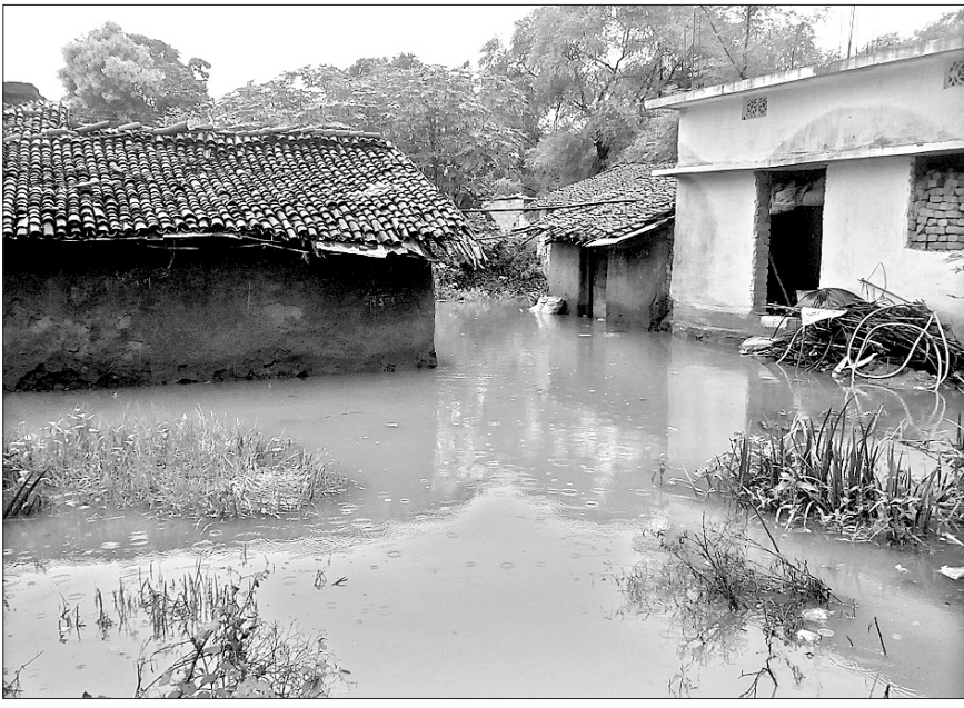
ବର୍ଷାରେ ସତନାମୀ ପଡ଼ାର ଅବସ୍ଥା ଶୋଚନୀୟ ହୋଇପଡ଼ିଛି (ବାମ) । ଗୋଡ଼ପୁଲ୍ଲା ଗାଁ ମଝିରେ ପାଣି ଜମି ରହିଛି ।