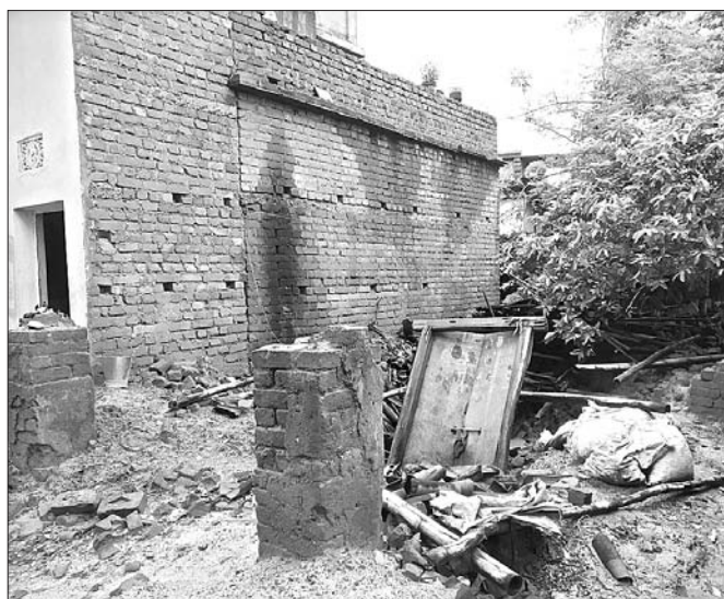
ଅଂଚଳରେ ବରଷାରେ ଭାଂଗି ଯାଇଥିବାର ରୁଚେ ଘର।

ଲଘୁଚାପ ପରଭାବରେ ବରଗଡ଼ ଜିଲ୍ଲା ବିଜେପୁର ଅଂଚଳରେ ଗଲା ରାଏବାର ବେଳରୁତାକୁ ସୋମବାର ଦୁଇପହର ତକ୍ ବରଷା ଲାଗି ରହିଥିଲା। ବରଷାରେ ଅଂଚଳର ବହୁତ ଲୁକ୍କିତ ଘରରୁଆର ଭାଂଗି ଯାଇଥିବାର ଜଣାଯାଇଛି। ହେଲେ ଲଘୁଚାପ କେହି ଖଡ଼ିଆଡ଼ିଆ ହେଉଥିବାର ଜଣା ନାହିଁ। ଏନ୍.ସି.ଏ. ସଦର ମହକୁମାରେ ଗୋଷ୍ଠୀ ସାମ୍ମ୍ୟ କେନ୍ଦ୍ର ପରିସରରେ ବରଷା ପାଏନ୍ ଜମା ହେଇ ରହିଥିଲା। ଏନ୍.ସି.ଏ. କରୁରପକ୍ଷ ଦମକଲ ବିଭାଗକେ ପାଏନ୍ ଶୁଖାବାକେ ଅନୁରୋଧ କରିଥିଲେ। ଦମକଲ ବିଭାଗ କରମତାରୀ ପମ୍ପ ଲଗେଇ ପରିସରକୁ ପାଏନ୍ ଶୁଖେଇଥିଲେ। ସେନ୍ଦ୍ରା ବହୁତ ଲୁକ୍କିତ ଘରକେ ବି ବରଷା ପାଏନ୍ ରୁକିଥିଲା, ସେନ୍ଦ୍ରୁରଲାଗି ସେ ପରିସରମାନେ ଦିନ୍ଦ ରାଏନ୍ ପାଏନ୍ ଶୁଖାବାର ଲାଗି ନାନା ସମସିଆର ସାମଗ୍ରୀ କରିଥିଲେ। ବିଜେପୁର, କହିରା, ବାଉଁଶପୋଲା, ଦେନିଆଁଗାଲ, ପଥାଳି ଲେଖି