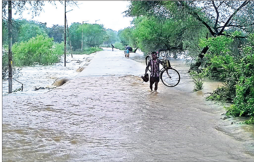
ବଲାଙ୍ଗୀର ଜିଲା ବୁଝୁରା ଅଞ୍ଚଳର ଏକ ରାସ୍ତାରେ ବର୍ଷାପାଣି ପ୍ରବାହିତ ହେଉଛି ।