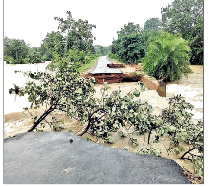
କଳାହାଣ୍ଡି ଜିଲା କର୍ଳାମୁଣ୍ଡା ବ୍ଲକ ପୁରିଗା ଆରଡି ରାସ୍ତା ବର୍ଷାରେ ଧୋଇଯାଇଛି ।