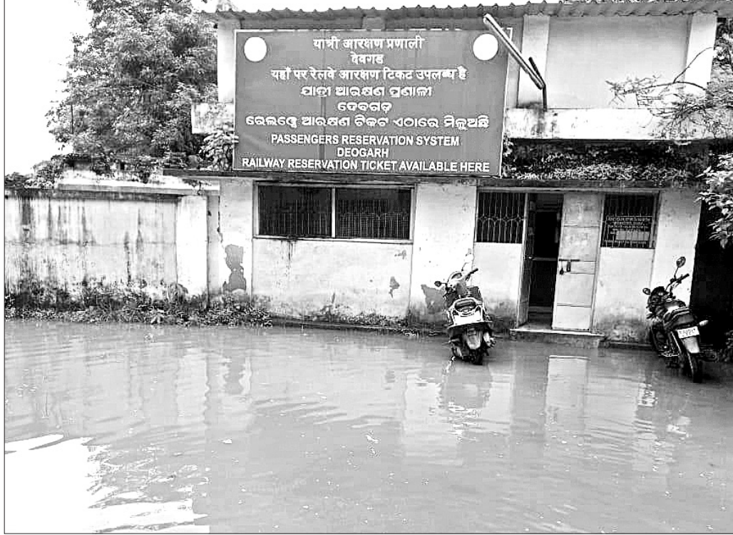
ବର୍ଷା ଯୋଗୁ ମଙ୍ଗଳବାର ଦେବଗଡ଼ ରେଳଷ୍ଟେ ଚିକିତ୍ସା କାର୍ଦ୍ଧର ସମ୍ମୁଖରେ ପାଣି ଜମି ରହିଥିବାରୁ ଗ୍ରାହକ ହଇଜାଣି ହୋଇଛନ୍ତି।