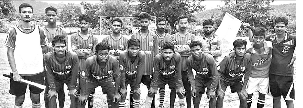
ଉଦ୍ଘାଟନା ମଧ୍ୟରେ ବୁଲ୍ ଦଳର ଖେଳାଳି ମାନେ।