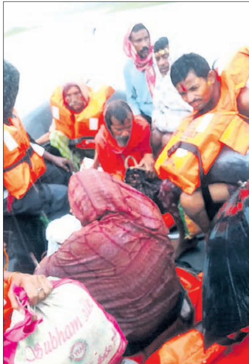
କଳାହାଣ୍ଡି ଜିଲା କେସିଙ୍ଗା ବ୍ଲକ ବେଲଖଣ୍ଡି ଶିବମନ୍ଦିରରେ ଫସି ରହିଥିବା ଲୋକଙ୍କୁ ଓଡ୍ରାଫ ଚିମ୍ପ ଉଦ୍ଧାର କରି ଆଣୁଛି ।