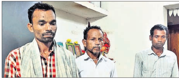
ବନ ବିଭାଗ ଦ୍ୱାରା ଗିରଫ ହୋଇଥିବା ବଜ୍ରକାୟା ଚାଲାଇ ରାଧାକେଶରୀ ଗିରଫ ହୋଇଥିବା ସମ୍ବନ୍ଧରେ ଗୋଟିଏ ଫୋଟୋ ଗ୍ରହଣ କରାଯାଇଛି।