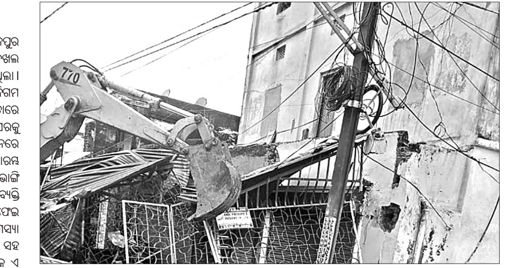
କ୍ଷେତ୍ରରାଜପୁର ଅଞ୍ଚଳରେ ଜବରଦଖଲ ଉଚ୍ଛେଦ କରାଯାଇଛି।

ସମ୍ବଲପୁର ମହାନଗର ନିଗମ କ୍ଷେତ୍ରରାଜପୁର ବାଲାଙ୍ଗା ଗଳି ନିକଟ ଡ୍ରେନ୍‌କୁ ଜବରଦଖଲ କରାଯାଇ ଏକ ଘର ନିର୍ମାଣ କରାଯାଇଥିଲା। ମଙ୍ଗଳବାର ଏହାକୁ ସମ୍ବଲପୁର ମହାନଗର ନିଗମ କ୍ଷେତ୍ରରାଜପୁର ଥାନା ପୋଲିସ୍ ସହାୟତାରେ ଉଚ୍ଛେଦ କରିଛି। କେସିଏ ଲାଗାଇ ପକ୍ଷା ଘରକୁ ଭାଙ୍ଗି ଦିଆଯାଇଛି। ଏହାସହ ସେହି ସ୍ଥାନରେ ଜରୁରୀକାଳୀନ ଭିତରେ ଡ୍ରେନ୍ କାମ ଆରମ୍ଭ ହୋଇଛି। ପାଖରେ ଥିବା ୪ଟି ଠୋଳାକୁ ମଧ୍ୟ ଭାଙ୍ଗି ଦିଆଯାଇଛି। ଡ୍ରେନ୍ ଜବରଦଖଲ କରି ଜଣେ ବ୍ୟକ୍ତି ଘର ନିର୍ମାଣ କରିଥିଲେ। ଫଳରେ ଡ୍ରେନ୍ ସଫେଦ କାର୍ଯ୍ୟ ବାଧାପ୍ରାପ୍ତ ହେଉଥିଲା। ବର୍ଷତମାମ ସମୟ ଲାଗି ରହିଥିଲା। ଏହି ବର୍ଷରେ ପାଣି ଜମିବା ସହ ରାସ୍ତା ଉପରେ ଭାସୁଥିଲା। ସ୍ଥାନୀୟ ଲୋକେ ଏ ନେଇ ମହାନଗର ନିଗମକୁ ଅଭିଯୋଗ କରିଥିଲେ।