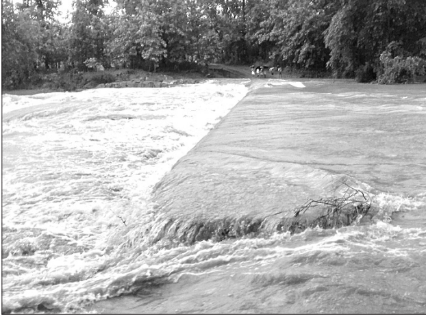
ମୋହନଗିରି ନିକଟସ୍ଥ କାଳିଗଙ୍ଗା ନଦୀର ବେକରଘାଟଠାରେ ବନ୍ୟାପାଣି ଯୋଗୁ ରାସ୍ତା ବନ୍ଦ ହୋଇଯାଇଛି (ବାମ)। କର୍ଳାମୁଣ୍ଡା ବ୍ଲକ କଣ୍ଠରେଇ ଗାଁ ଜଳବନ୍ଧି ହୋଇଛି (ମଝି)। ସାଗରପାଲି ଛକଠାରେ ଏକ ବସ ମାଟିରେ ଦବି ଅବନ ବିପଦକୁ ଅଳ୍ପକେ ରକ୍ଷା ପାଇଛି।