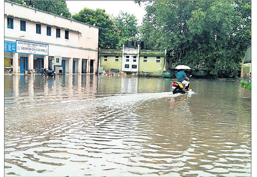
ଲଗାଶ ବର୍ଷାରେ ବରଗଡ଼ ସରକାରୀ ସ୍ୱସ୍ୱାସ୍ଥ୍ୟ କଳାଣ୍ଡି ।