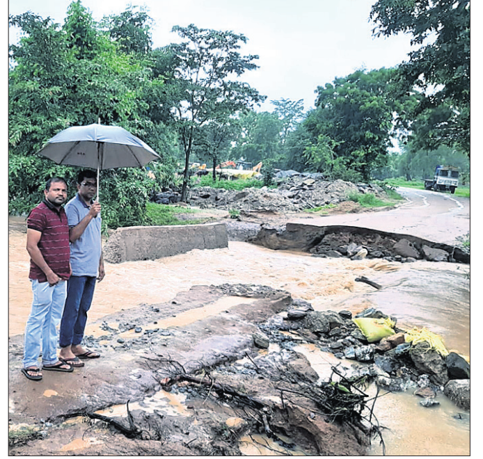
ଖପ୍ରାଖୋଳ-ଲାଠୋର ରାସ୍ତାର ବୁଝିଭଗା ଡାକରବସନ ରାସ୍ତା ଧୋଇଯାଇଛି ।