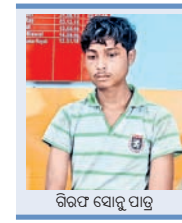
ଗିରଫ ହୋଇଥିବା ଯୁବକ

ବାରିପଦା ଅଧିକାରୀ, ୧୩୮୮ ମୁରୁଭଞ୍ଜ ଜିଲ୍ଲା ବାରିପଦା ଗଞ୍ଜମ ଥାନା ଅଞ୍ଚଳରେ ଜଣେ ନାବାଳିକାଙ୍କ ଗାଧୋଇବା ସମୟର ଦୃଶ୍ୟ ମୋବାଇଲରେ ରେକର୍ଡ଼ କରି ଜଣେ ଯୁବକ ଗିରଫ ହୋଇଛନ୍ତି।