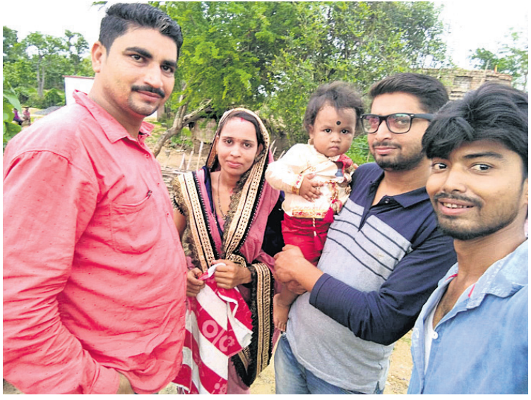
@ ସୂର୍ଯ୍ୟ ନାରାୟଣ