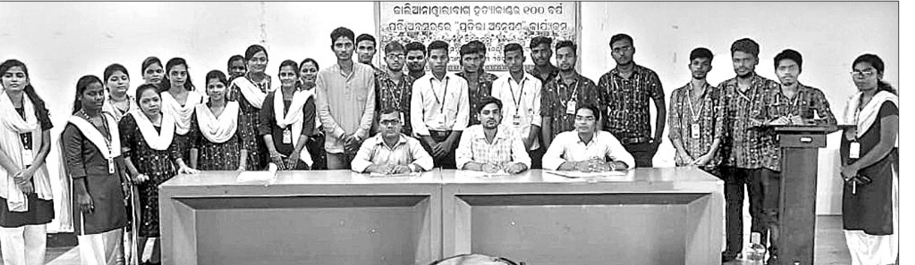
ମଙ୍ଗଳବାର ରାତିରେ ସମ୍ବଲପୁର ଖାଡୁଆପଡ଼ା ବଡ଼ୁଆପଡ଼ାଠାରେ ବରଗଡ଼ ଅର୍ଦ୍ଧଠାପାଳି କଳାକାରମାନେ ସଞ୍ଚାର ପରିବେଷଣ କରୁଛନ୍ତି(ବାମ)। ସମ୍ବଲପୁର ଗଙ୍ଗାଧର ମେହେର ଅଖିଳ ଭାରତୀୟ ବିଦ୍ୟାଳୀ ପରିଷଦ ପକ୍ଷରୁ ଆୟୋଜିତ କାଳିଆନାଶାଳାବାସ୍ ହତ୍ୟାକାଣ୍ଡର ୧୫ଶ ବର୍ଷ ପୂର୍ତ୍ତି ଉପଲକ୍ଷେ ପ୍ରତିଭା ଅଭିଷେକ କାର୍ଯ୍ୟକ୍ରମରେ କର୍ମଚାରୀ ଓ ଛାତ୍ରଛାତ୍ରୀ।