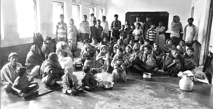
କର୍ଳାମୁଣ୍ଡା ବ୍ଲକ କଣ୍ଠରେଇ ସ୍କୁଲଠାରେ ଲୋକ ଆଶ୍ରୟ ନେଇଛନ୍ତି(ବାମ)। କାଳିଗଙ୍ଗା ନଦୀ କୂଳ ବେଉଳିପୁଲିଆ ଗ୍ରାମର ଲୋକେ ଏକ ସ୍କୁଲ ଘରେ ଆଶ୍ରୟ ନେଇଛନ୍ତି।

ମୋହନଗିରି, ୧୩୮୮ (ଡି.ଏନ.ଏ.): ଗତ ୩ ଦିନ ଧରି ଲୁଗାପାଟଜଳିତ ପ୍ରବଳ ବର୍ଷା ଯୋଗୁ କଳାହାଣ୍ଡି ଜିଲା ମୋହନଗିରି ଅଞ୍ଚଳରେ ମଧ୍ୟ ବନ୍ୟା ପରିସ୍ଥିତି ସୃଷ୍ଟି ହୋଇଛି। ଏଠାକାର କାଳିଗଙ୍ଗା ନଦୀରେ ଜଳସ୍ତର ବୃଦ୍ଧି ପାଇଛି। ଫଳରେ ନଦୀ ଆଉଁସପଡ଼େ ଥିବା ପଞ୍ଚାପଦର, ଚେଳିପଡା, ଲାଡେର ଡଳାବାହାଲି, ସରାବେତା, କୁରୁଗୁପଲା, ତଳାବଳୁ ଆଦି ୭ଟି ଗାଁର ଲୋକ ୩ ଦିନ ହେଲା ଜଳବନ୍ଧି ଭାବେ ରହିଛନ୍ତି। ଶହ ଶହ ଏକର ଧାନ ଚାଷ କମିରେ ବନ୍ୟା ପାଣି ପଶିଯାଇ ଜଳମଗ୍ନ ହୁଇଥିବା ବେଳେ ରୁଆ ଧାନ ଉପରେ ବାଲି ମାଡିଯାଇଛି। କାଳିଗଙ୍ଗା ନଦୀ ତଳି ଅଞ୍ଚଳରେ ଥିବା ବେଉଳିପଡା, କଲୋନାପଡା ସରାବେତା ଗ୍ରାମର ଲୋକେ ଭୟରେ ଗାଁ ଛାଡି ସ୍କୁଲ ଘରେ ଦେଇ ଶହରୁ ଉଚ୍ଚ ପରିବାର ଲୋକେ ଆଶ୍ରୟ ନେଇଛନ୍ତି। ମୋହନଗିରି ପଞ୍ଚାୟତ ତରଫରୁ ସେମାନଙ୍କୁ ରକ୍ଷଣ ଖାଦ୍ୟ ଯୋଗାଇ ଦିଆଯାଇଛି। ଶ୍ରାବଣ ମାସ ଶେଷ ସମୋଚାର ପଡୁଥିବାରୁ ଧବନେଶ୍ୱର ପୀଠକୁ ଆସିଥିବା ବହୁ ବୋଲକପ ଉକ୍ତ ମଧ୍ୟ ବନ୍ୟାପାଣିରେ ସମସ୍ତ ରାସ୍ତା ବନ୍ଦ ହୋଇଥିବା ଥିବାରୁ ଅତକି ରହିଛନ୍ତି। ମ.ରାମପୁର ବ୍ଲକ ପ୍ରଶାସନ ତରଫରୁ ବିଡିଓ ଏ ଅଞ୍ଚଳକୁ ଆସି ବନ୍ୟା ପରିସ୍ଥିତି ଅନୁଧ୍ୟାନ କରିବା ସହିତ ବନ୍ୟା ବିପଦକୁ ଅତ୍ୟବଶ୍ୟକ ସାମଗ୍ରୀ ଯୋଗାଇ ଦେବା ବ୍ୟବସ୍ଥା କରିଛନ୍ତି।