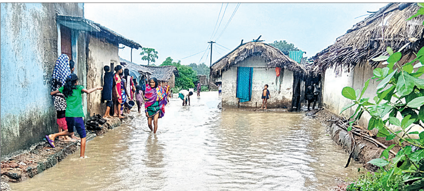
ବଲାଙ୍ଗୀର ଜିଲା ଲୋଇସିଂହା ବ୍ଲକ ଅନ୍ତର୍ଗତ ଚୁମ୍ବୁନି ଗାଁ ରାସ୍ତାରେ ବର୍ଷା ପାଣି ।