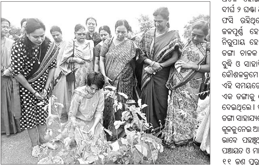
କରଣ ସମାଜ ମହିଳା ଶାଖା ପକ୍ଷରୁ ଚାରାରୋପଣ କରାଯାଇଛି।