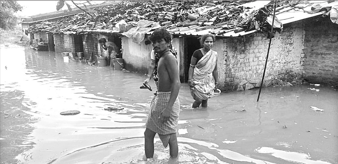
ବରଗଡ଼ ସହରର ଖାଡ଼ି ନଂ-୨ର ଘର ବର୍ଷାଜଳ ଘେରରେ ରହିଛି।