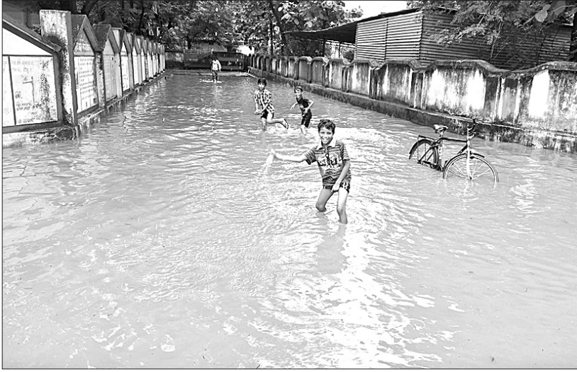
ବରଗଡ଼ ଜିଲ୍ଲାପାଇଁ ଅଫିସ୍ ସମ୍ମୁଖ ରାସ୍ତା ଜଳାଶୁବ୍ଧ, ବର୍ଷା ପାଣିରେ ପିଲାଏ ଖେଳୁଛନ୍ତି (ବାମ)। ଅଡ଼ଗାଁ ଗ୍ରାମରେ ଏକ ଘର ବର୍ଷାଜଳ ଘେରରେ ରହିଛି।

ବରଗଡ଼ ଅଫିସ୍, ୧୩୮୮ ବରଗଡ଼ ଜିଲ୍ଲାରେ ମଙ୍ଗଳବାର ଲଗାଣ ବର୍ଷା ଜନନୀବନକୁ ଅସ୍ତବ୍ୟସ୍ତ କରି ପକାଇଛି। ଲୋକଙ୍କୁ ଘରୁ ବାହାରିବା ମୁଷିଲ ହୋଇପଡ଼ିଛି। ଅନ୍ୟପକ୍ଷେ ବୋକାଳ, ବଜାର ଏକପ୍ରକାର ମାନ୍ଦା ହୋଇପଡ଼ିଛି। ତେବେ ମଙ୍ଗଳବାର ସକାଳ ୮ଟାରୁ ସନ୍ଧ୍ୟା ୫ଟା ପର୍ଯ୍ୟନ୍ତ ରେକର୍ଡ୍ କରାଯାଇଥିବା ବୃଷ୍ଟିପାତ ପରିମାଣ ଅନୁଯାୟୀ ଜିଲ୍ଲାର ବିଜେପୁର ବ୍ଲକ୍‌ରେ ସର୍ବାଧିକ ୧୫୮ ମି.ମି ବର୍ଷା ହୋଇଥିବା ବେଳେ ଅଧ୍ୟାୟୋଗ ବ୍ଲକ୍‌ରେ ସର୍ବନିମ୍ନ ୨୧.୯ ମି.ମି ବର୍ଷା ହୋଇଥିବା ରେକର୍ଡ୍ କରାଯାଇଛି। ସେହିପରି ସୋହେଲା ବ୍ଲକ୍‌ରେ ୧୫୨, ବରଗଡ଼ ବ୍ଲକ୍‌ରେ ୧୧୯, ବରପାଲି ବ୍ଲକ୍‌ରେ ୧୦୬, ଭେଡ଼େନରେ ୫୬, ଅତାବିରାରେ ୮୬.୨, ଭଟଲିରେ ୪୩, ପଦ୍ମପୁରରେ ୫୬.୬, ପାଇକମାଲରେ ୭୩, ଝାରବନ୍ଧରେ ୭୩ ଏବଂ ଗାନ୍ଧିବିଲେଟ୍ ବ୍ଲକ୍‌ରେ ୭୭.୩୦ ମି.ମି ବୃଷ୍ଟିପାତ ରେକର୍ଡ୍ କରାଯାଇଛି। ଅନ୍ୟପକ୍ଷେ ସୋମବାରରୁ ମଙ୍ଗଳବାର ସକାଳ ପୁଣ୍ୟା ରେକର୍ଡ୍ କରାଯାଇଥିବା ବୃଷ୍ଟିପାତ ପରିମାଣ ଅନୁଯାୟୀ, ପାଇକମାଲ ବ୍ଲକ୍‌ରେ ସର୍ବାଧିକ ୧୬୦ମି.ମି ବର୍ଷା ହୋଇଥିବା ବେଳେ ବରଗଡ଼ରେ ୨୧.୬, ବରପାଲିରେ ୧୪୫.୬, ଭେଡ଼େନରେ ୭୭.୩, ଅତାବିରାରେ ୪୬.୪, ଭଟଲିରେ ୨୨, ଅଧ୍ୟାୟୋଗରେ ୨୧, ପଦ୍ମପୁରରେ ୫୬, ଝାରବନ୍ଧରେ ୨୬, ଗାନ୍ଧିବିଲେଟ୍‌ରେ ୨୫.୧, ସୋହେଲାରେ ୧୬ ଏବଂ ବିଜେପୁରରେ ୪୧.୨ ମି.ମି ବର୍ଷା ହୋଇଥିବା ରେକର୍ଡ୍ କରାଯାଇଥିଲା।