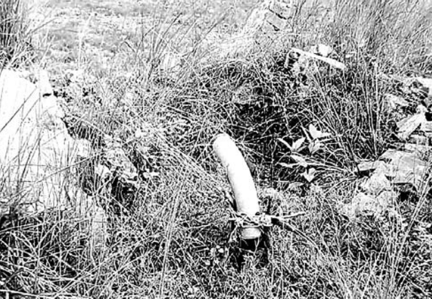
ଭାଙ୍ଗିଦେଇଥିବା ଉଠାଜଳସେଚନ ପ୍ରକଳ୍ପ ।

ବିତିଠେଇ ଲିଖିତ ଜଣାଇଥିଲେ । ପରେ ଗତ ମାସ ବିତିଠେ ସମାନିଧି ଭୋଇ ଓ ମେଡାସେଟ ପ୍ରକଳ୍ପର ଉଚ୍ଚ ଅଧିକାରୀମାନେ ଜାଙ୍ଗଲି ଗ୍ରାମକୁ ଯାଇଥିଲେ । ଭାଙ୍ଗିଥିବା ଉଠା ଜଳସେଚନ ପଦ୍ଧତିର ପାଇପ କର୍ମଚାରୀମାନେ କହିଥିଲେ ମଧ୍ୟ ଚାଷର କ୍ଷତିଭରଣା ଦେବାକୁ ମନା କରିଦେଇଥିଲେ । କୃଷକ ସାଙ୍କ ଠାରୁ ପ୍ରକାଶ, ଏହା ଉପରେ ସେ ଗତ ମାସ ଜିଲ୍ଲାପାଳଙ୍କୁ ଲିଖିତ ଜଣାଇଥିଲେ । କିନ୍ତୁ କେହି ଶୁଣିଲେ