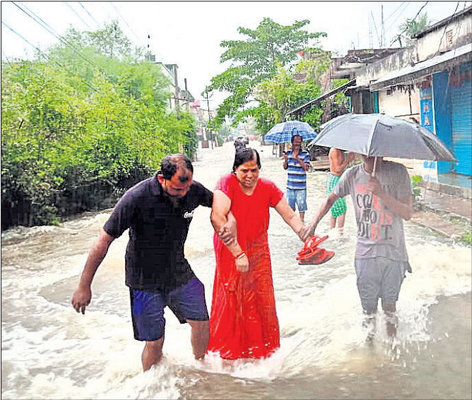
ବଲାଙ୍ଗୀର ସହର ଚିକ୍ରାପଡାରେ ଜଳସେଚନରେ ଥିବା ଜଣେ ମହିଳାଙ୍କୁ ବାହାରକୁ ନିଆଯାଇଛି ।