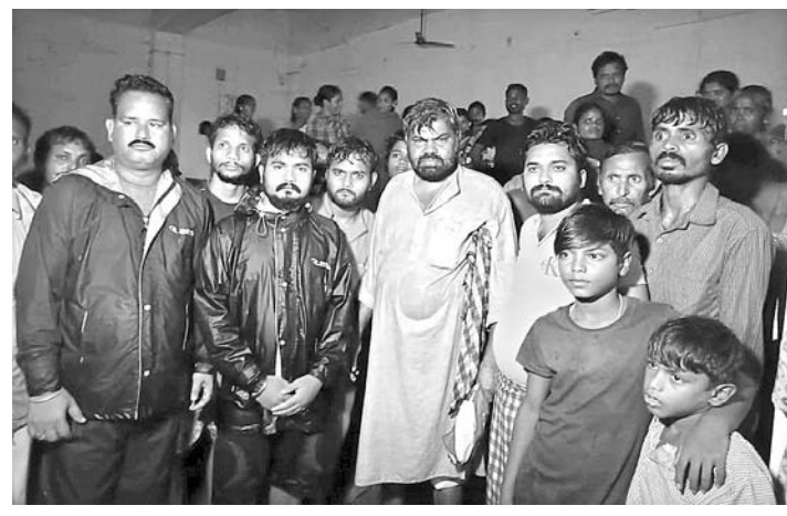
ବଲାଙ୍ଗୀର ମହଲା କଲେଜ ରିଲିଫ କ୍ୟାମ୍ପରେ ସାମାଜିକ କର୍ମୀମାନେ ଗାଡ଼େନ୍ଦ୍ରପଡ଼ାର ଜଳକ୍ଷୟ ଲୋକଙ୍କୁ ଉଦ୍ଧାର କରି ରଖିଛନ୍ତି।

ଠିକାଦାରପତା, ପୋଲିସ କଲୋନୀ ପଛପଡ଼ା, ବ୍ରାହ୍ମଣପଡ଼ା, ତିମିଳିକାଟି ପତା, ବରପାଲିପତା, ତାଳପାଲିପତା, ସତ୍ୟନାରାୟଣପତାରେ ଅଳ୍ପତ ପୂର୍ବ ଯୋମବାର ଓ ମଙ୍ଗଳବାର ଦିନ ତମାମ ଜାରି ରହିବା ଫଳରେ ବଲାଙ୍ଗୀର ସହର ଉପର ମୁଣ୍ଡରେ ଥିବା ଗନ୍ଧରେଇ ତ୍ୟାମ୍, ରାଜେନ୍ଦ୍ରପତା ତ୍ୟାମ୍ ଓ ଲକ୍ଷ୍ମୀପାଲି ତ୍ୟାମ୍ ପୂର୍ଣ୍ଣ ହୋଇଯାଇ ଆତିବନ୍ଧ ଉପର ଦେଇ ପାଣି ଉଠୁଛି ଥିଲା।