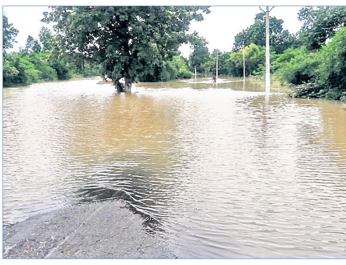
ବୀରମହାରାଜପୁର-ରେଡ଼ାଖୋଳ ରାସ୍ତାର ପିତାମହୁଲ ନିକଟ ବାଉରାଯୋର ପୋଲ ଉପରେ ବନ୍ୟାକଳ ପ୍ରବାହିତ ହେଉଛି।

ଭୁବନେଶ୍ୱର, ୧୩୮ (ବୁଧବାର) - ଲଘୁତାପଜନିତ ଲଗାଣ ବର୍ଷରେ ଦକ୍ଷିଣ-ପଶ୍ଚିମ ଓଡ଼ିଶା ଛୁଟି ସଜିନ ହୋଇପଡ଼ିଛି। ବିଶେଷ କରି ୫ ଜିଲ୍ଲା ବଲାଙ୍ଗୀର, ବୌଦ୍ଧ, କଳାହାଣ୍ଡି, ସୁବର୍ଣ୍ଣପୁର ଓ କନ୍ଧମାଳରେ ଅଧିକ ବର୍ଷା ହୋଇ ବନ୍ୟା ସୃଷ୍ଟି ହୋଇଛି। କଳାହାଣ୍ଡି ଜିଲ୍ଲାର କଳାପୁଣ୍ଡା ବ୍ଲକରେ ୨୪ ଘଣ୍ଟା ମଧ୍ୟରେ ସର୍ବାଧିକ ୬୦୮ ମିଲିମିଟର ବର୍ଷା ହୋଇଥିବା ରେକର୍ଡ କରାଯାଇଛି। ଏହାଛଡ଼ା କଳାହାଣ୍ଡିର ମଦନପୁର ରାମପୁର ବ୍ଲକରେ ୪୪୫ ମିମି, ନଳାରେ ୨୪୧, ବଲାଙ୍ଗୀରର ଗୁଡ଼ଭେଲ ବ୍ଲକରେ ୪୧୪, ବେଝାରୀରେ ୩୨୮, ସକଟକାରେ ୩୧୩, ପୁଲିଚିରରେ ୨୯୨, ବଲାଙ୍ଗୀରରେ ୨୬୩, ଚିଟିଲାଗଡ଼ରେ ୨୦୧, ବୌଦ୍ଧ ଜିଲ୍ଲାର କଣ୍ଟାମାଳରେ ୩୪୫, କନ୍ଧମାଳ ଜିଲ୍ଲାର ବାଲିଗୁଡ଼ାରେ ୩୦୨ ମି.ମି. ବର୍ଷା ରେକର୍ଡ କରାଯାଇଛି।