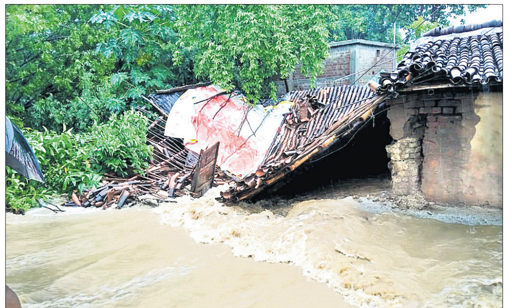
ବଲାଙ୍ଗୀର ସହର ବୁଝୁଡ଼ିପଡାରେ ଲଗାଶ ବର୍ଷାରେ ଭାଙ୍ଗିପଡିଥିବା ଏକ ଘର ।