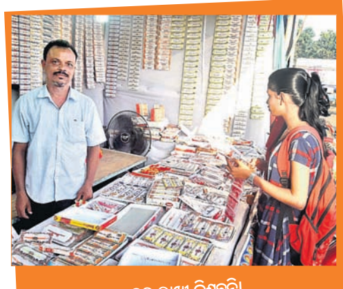
କଣେ ଛାତ୍ରୀ ଦୋକାନରୁ ରାଖୀ ବିଶୁଦ୍ଧି