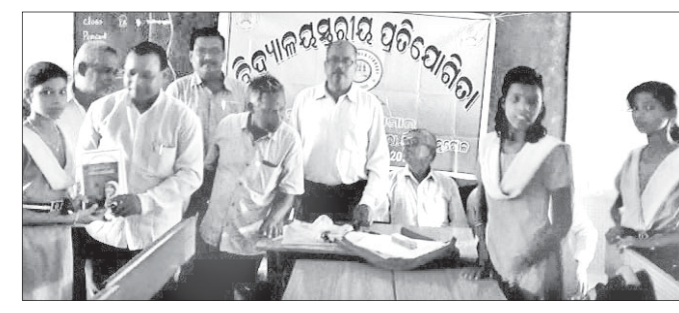
ଅତିଥିଙ୍କ ସହ ଛାତ୍ରଛାତ୍ରୀମାନେ ।