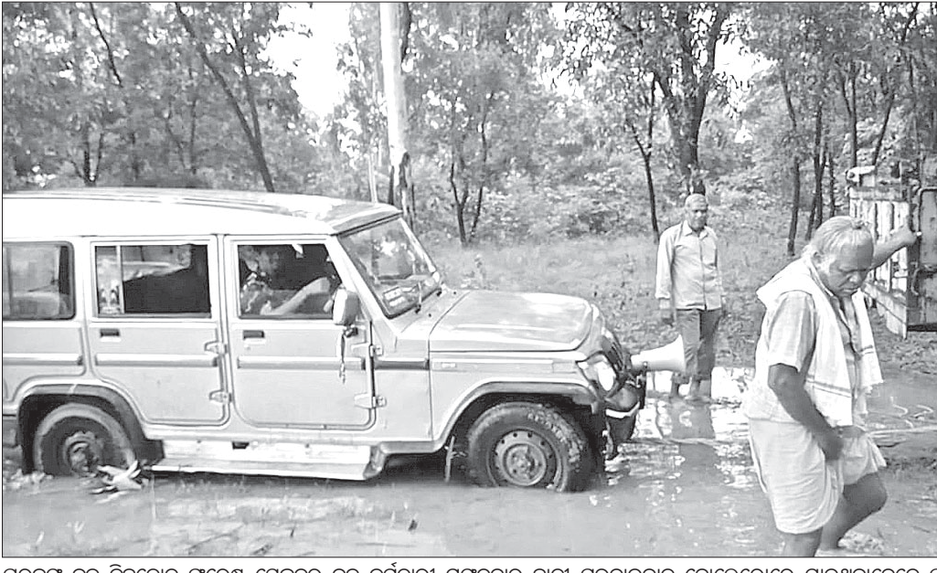
ପରଜଙ୍ଗ ରୁକ୍ ଡିଭିଜନ ଫରେଷ୍ଟ ସେକ୍ଟରର ବନ କର୍ମଚାରୀ ମଙ୍ଗଳବାର ହାତା ଉପଦ୍ରବରେ ଭାଙ୍ଗିଯାଇଥିବା ଘରକୁ ପରିଦର୍ଶନ କରିବାକୁ ଯାଇ କର୍ମଚାରୀ ନାକେଦମ ହୋଇଥିଲେ । ଶେଷରେ ଏକ ଟ୍ରାକ୍ଟର ସହାୟତାରେ ଗାଡ଼ିକୁ ବାହାର କରାଯାଇଥିଲା ।