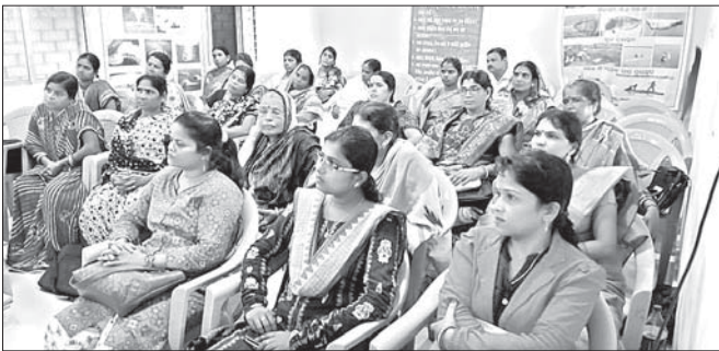
କାର୍ଯ୍ୟକ୍ରମରେ ଉପସ୍ଥିତ ଶିବିରୀଆମାନେ ।