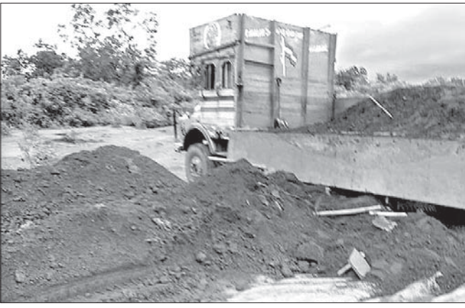
କ୍ରୋମାଇଟ ଅପମିଶ୍ରଣ କରାଯାଇଥିବା ସ୍ଥାନ ।