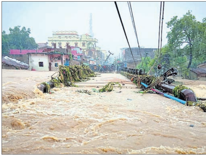
ବଲାଙ୍ଗୀର ସହର ବରପାଲିପଡ଼ା ପୋଲ ଉପରେ ପ୍ରବାହିତ ବନ୍ୟାଜଳ ।

ଭୁବନେଶ୍ୱର, ୧୩।୮ (ବୁଧବେ) ଲଢୁଚାପକଳିତ ଲଗାଣ ବର୍ଷାରେ ଦକ୍ଷିଣ-ପଶ୍ଚିମ ଓଡ଼ିଶା ଛୁଟି ସଜନି ହୋଇପଡ଼ିଛି। ବିଶେଷ କରି ୫ ଜିଲ୍ଲା ବଲାଙ୍ଗୀର, ବୌଦ୍ଧ, କଳାହାଣ୍ଡି, ସୁବର୍ଣ୍ଣପୁର ଓ କନ୍ଧମାଳରେ ଅଧିକ ବର୍ଷା ହୋଇ ବନ୍ୟା ବୃଦ୍ଧି ହୋଇଛି। କଳାହାଣ୍ଡି ଜିଲ୍ଲାର କର୍ଳାପୁଣ୍ଡା ବ୍ଲକରେ ୨୪ ଘଣ୍ଟା ମଧ୍ୟରେ ସର୍ବାଧିକ ୬୦୮ ମିଲିମିଟର ବର୍ଷା ହୋଇଥିବା ରେକର୍ଡ କରାଯାଇଛି। ଏହାଛଡ଼ା କଳାହାଣ୍ଡିର ମଦନପୁର ରାମପୁର ବ୍ଲକରେ ୪୪୫ ମିମି, ନଲିରେ ୨୪୧, ବଲାଙ୍ଗୀରର ରୁଡ଼ଭେଲା ବ୍ଲକରେ ୪୧୪, ଦେଓଗାଁରେ ୩୨୮, ସକଳାରେ ୩୧୩, ପୁଲିଚଳାରେ ୨୯୨, ବଲାଙ୍ଗୀରରେ ୨୬୩, ଚିଟଲାଗଡ଼ରେ ୨୦୧, ବୌଦ୍ଧ ଜିଲ୍ଲାର କନ୍ଧମାଳରେ ୩୪୫, କନ୍ଧମାଳ ଜିଲ୍ଲାର ବାଲିଗୁଡ଼ାରେ ୩୦୨ ମି.ମି. ବର୍ଷା ରେକର୍ଡ କରାଯାଇଛି। ସୋମବାର ରାତିତମାମ ବର୍ଷା ଯୋଗୁ ଏହି ଜିଲ୍ଲାଗୁଡ଼ିକ ଜଳମଗ୍ନ ହୋଇଯାଇଛି। ଅନେକ ଗାଁ ପାଣି ଘେରରେ ରହି ବାହ୍ୟଜଗତରୁ ବିଚ୍ଛିନ୍ନ ହୋଇଯାଇଛି। ବହୁ ଘର ବନ୍ୟାପାଣିରେ ବୁଡ଼ି ରହିଛି। ରେଳ ଟ୍ରାକ୍ ଉପରେ ବର୍ଷାପାଣି ରହିଥିବା ଯୋଗୁ ଟ୍ରେନ୍ ଚଳାଚଳକୁ ସାମୟିକ