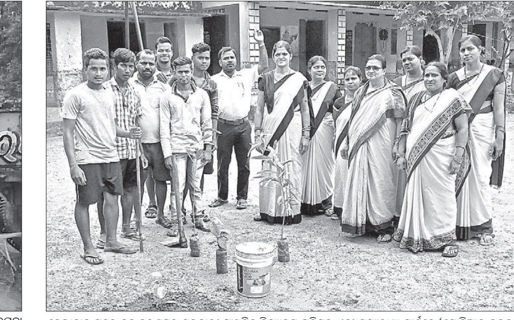
ଡେକାନାଲ ସଦର ବ୍ଲକ୍ ନରଣପୁର ସରକାରୀ ପ୍ରାଥମିକ ବିଦ୍ୟାଳୟ ପରିସର ଏବଂ ପୁଖ୍ୟରାସ୍ତା ପାର୍ଶ୍ୱରେ 'ସେସିଆଲ କଲଚର ଗ୍ରୁପ୍' ପକ୍ଷରୁ ଚାରୋପଣ କରାଯାଇଛି । ଏଥିରେ ସ୍ତୁର ଛାତ୍ରାଛାତ୍ରୀ, ଶିକ୍ଷୟିତ୍ରୀଶିକ୍ଷକ ସାମିଲ ହୋଇଥିଲେ ।