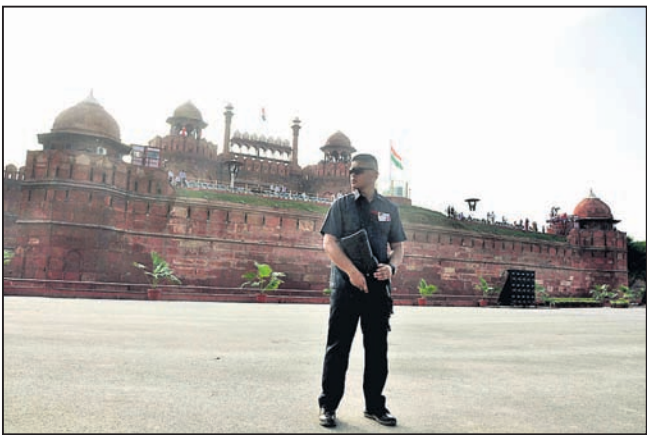
ଲାଲକିଲ୍ଲାରେ ସାଧାନତା ଦିବସ ପାଇଁ ପରେ ଅଭ୍ୟାସ ବେଳେ ଅନୁଷ୍ଠାନ କରୁଛନ୍ତି ଜଣେ ପୁରୁଷ।

କମ୍ପାନୀ, ୧୩୮ (ପି.ଟି.): ପୂର୍ବତନ ପ୍ରଧାନମନ୍ତ୍ରୀ ମନମୋହନ ସିଂ ରାଜ୍ୟ ସଭା ଉପସଭାରେ ପାଇଁ ମଞ୍ଜୁରୀର ରାଜସ୍ୱାଧିକାର ପ୍ରାର୍ଥନା ଦାଖଲ କରିଛନ୍ତି।