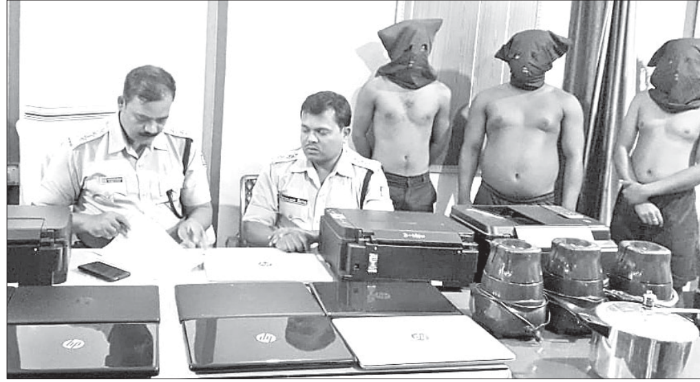
ଖବରଦାତା ସମ୍ମିଳନୀରେ ଏସ୍ପିଓ ଅଭିଯୁକ୍ତଙ୍କ ସମ୍ପର୍କରେ ସୂଚନା ଦେଉଛନ୍ତି ।