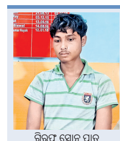
ଗିରଫ ହୋଇ ପାତ୍ର

ବାରିପଦା ଅଫିସ୍, ୧୩୮୮ ମୁରୁଭଞ୍ଜ ଜିଲ୍ଲା ବାରିପଦା ଗଞ୍ଜନ ଥାନା ଅଞ୍ଚଳରେ ଜଣେ ନାବାଳିକାଙ୍କ ଗାଧୁଆ ସମୟର ଦୃଶ୍ୟ ମୋବାଇଲରେ ରେକର୍ଡ଼ କରି ଜଣେ ମୁବକ ଗିରଫ ହୋଇଛନ୍ତି।