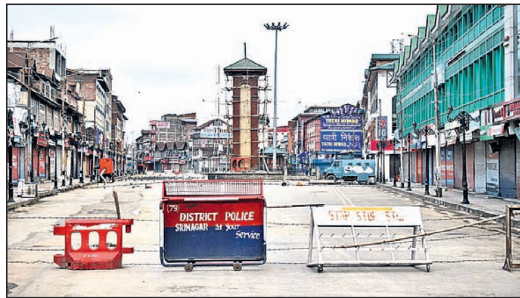
ଶ୍ରୀନଗରମ୍ଭିତ ଲାଲକିଲ୍ଲାରେ ପୋଲିସ୍ ବ୍ୟାରିକେଡ୍।