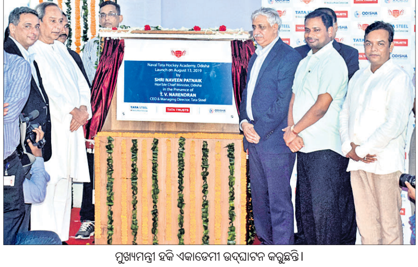
ପୂର୍ଣ୍ଣାମନ୍ତ୍ରୀ ହକି ଏକାଡେମୀ ଉଦ୍ଘାଟନ କରୁଛନ୍ତି ।

ସିନିୟର, ୧୩।୮ (ସିଟି): ଚଳିତ ବର୍ଷ ଚଳୁଥିବା ଉପରାଜ୍ୟ ଉପରେ ଅଧିକାଂଶ କରାଯାଇ ପରେ ଆଣ୍ଡି ମୁରୋଜ୍ ପ୍ରଥମ ଥର ପାଇଁ ପୁରୁଷ ସିଙ୍ଗଲ୍ ବର୍ଷକୁ ଫେରିଥିଲେ ।