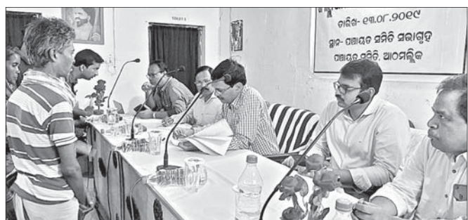
ଜନଶୁଣାଣିରେ ଉପସ୍ଥିତ ପ୍ରଶାସନିକ ଅଧିକାରୀମାନେ ।