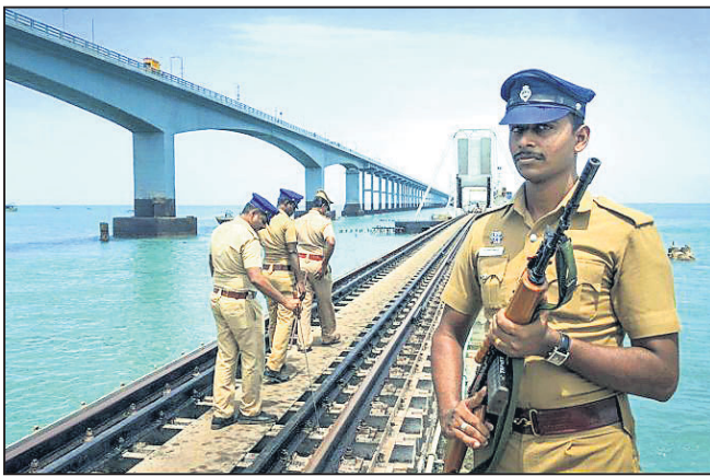
ରାମେଶ୍ୱରମ୍ଭିତ ପଥର ବ୍ରିକ୍ ରେଲୱେ ଟ୍ରାକ୍‌ରେ ଯାତ୍ରା କରୁଛି ପୋଲିସ୍।