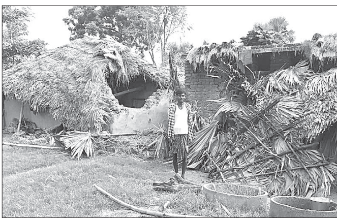
ହାତା ଉପଦ୍ରବରେ ଭାଙ୍ଗିଯାଇଥିବା ଘର ।

ଡେକାନାଲ ବନଖଣ୍ଡ ମହାବିରୋଧ ରେଞ୍ଜି ଡିଭିଜନ ଫରେଷ୍ଟ ସେକ୍ଟରରେ କିଛିଦିନ ବ୍ୟବଧାନରେ ପୁଣିଥରେ ନିଜର ଉପସ୍ଥିତି ଜାହିର କରିଛି ନରହତା ଦତ୍ତା । ଦାନ୍ତ କଟାଯିବା ସତ୍ତ୍ୱେ ଏହାର ହିଂସ୍ର ଆଚରଣରେ କୌଣସି ପରିବର୍ତନ ହେଉନାହିଁ । ଜନସହଚରରେ