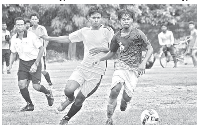
ଅନୁଗୋଳ ଅଫିସ, ୧୩୮