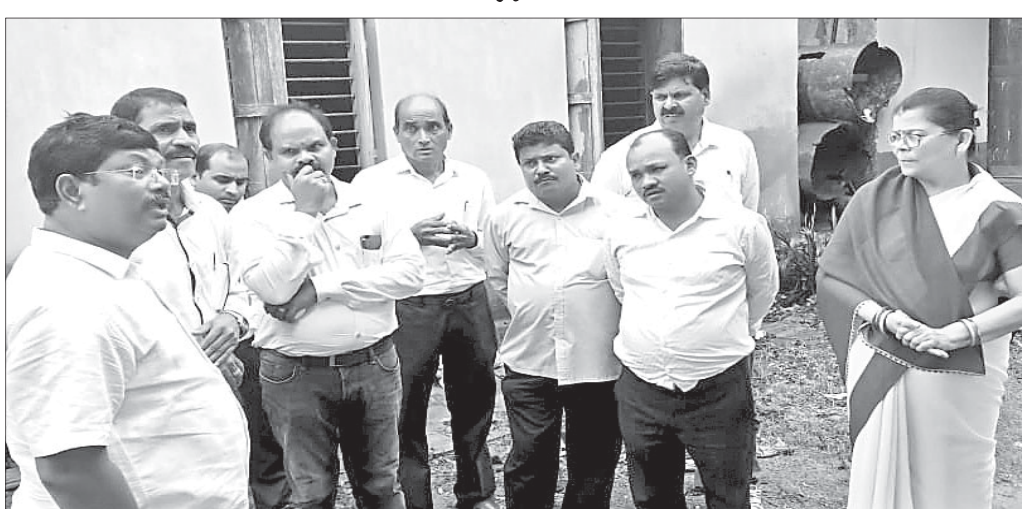
ଶିକ୍ଷୟିତ୍ରୀ ଶିକ୍ଷକଙ୍କ ସହ ବିଧାୟକ ଆଲୋଚନା କରୁଛନ୍ତି ।