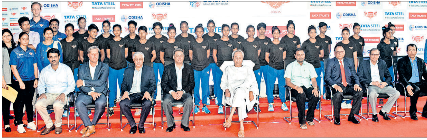
ନାଭାଲ ଟାଟା ହକି ଏକାଡେମୀର ଖେଳାଳିଙ୍କ ସହ ପୂର୍ଣ୍ଣାମନ୍ତ୍ରୀ ନବୀନ ପଟ୍ଟନାୟକ ଏବଂ କ୍ରୀଡ଼ା ବିଭାଗ ଓ ଟାଟା ଷ୍ଟିଲ୍ ଅଧିକାରୀମାନେ ।