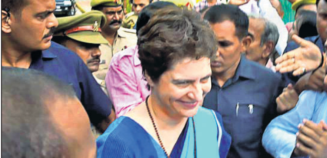
ପ୍ରିୟଙ୍କା ବାରାଣସୀଠାରୁ ୧୦୦ କି.ମି. ଜିଲ୍ଲାର ଏହି ଗାଁକୁ ଯାଇଥିଲେ। ପ୍ରିୟଙ୍କାଙ୍କ ସତକ ପଥରେ ଯାତ୍ରା କରି ସୋନଭଦ୍ର ପ୍ରିୟଙ୍କା ଉନ୍ନାତ ଗାଁରେ ପହଞ୍ଚିଥିବାର

ସୋନଭଦ୍ର(ସୁପ୍ରି), ୧୩୮ (ପି.ଟି.): କଂଗ୍ରେସ ସାଧାରଣ ସମ୍ପାଦକ ପ୍ରିୟଙ୍କା ଗାନ୍ଧୀ ଭଦ୍ରା ମଞ୍ଜୁରୀର ସୋନଭଦ୍ର ଜିଲ୍ଲାର ଉନ୍ନାତ ଗାଁ ଗସ୍ତକରି ଗଣହତ୍ୟାରେ ମୃତକଙ୍କ ପରିବାର ସଦସ୍ୟଙ୍କୁ ଭେଟିଛନ୍ତି।