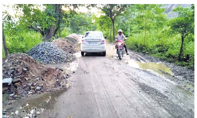
ଏହି ରାସ୍ତାରେ ଅନେକ ଛାତ୍ରାଛାତ୍ର, ସରକାରୀ ଓ ବେସରକାରୀ କର୍ମଚାରୀ ଏବଂ ଅଫିସରମାନେ ମଧ୍ୟ ଯାତାୟତ କରିପାରି ନାହାନ୍ତି। ଏହାର ଯୋଗୁ ଅନେକ ନିମନ୍ତେ ବାରମ୍ବାର ଦାବି କରାଯିବା ପରେ ମେଟ୍ରୋ ଓ ମୋରମ

ମେଟ୍ରୋଲିକା ରାଜ ଛକରୁ ଗୁଡ଼ା ଯାଏ ୫ କିମି ରାସ୍ତା। କିନ୍ତୁ ଏହି ରାସ୍ତା ଅବସ୍ଥା ସମ୍ପୂର୍ଣ୍ଣ ଶୋଚନୀୟ। ଖାଲ ଖମ୍ବାରେ ରାସ୍ତାଟି ଭରି ରହିଛି। ଏବେ ବର୍ଷାରୁ ହୋଇଥିବା ଯୋଗୁ ଅନେକ ଗ୍ଲାନରେ ପାଣି ଜମି ଯାତାୟତରେ ଅସୁବିଧା ହେଉଛି।