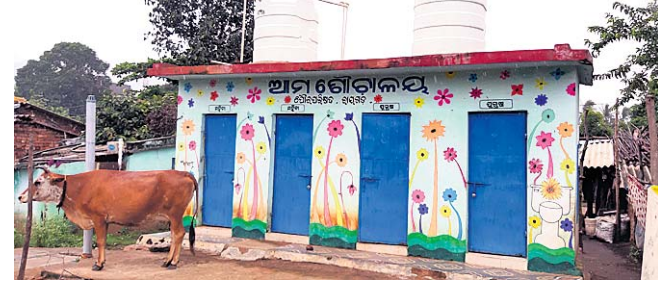
କୋଲିକାପଡ଼ା ଅଞ୍ଚଳରେ ଥିବା ଗୋଷ୍ଠୀ ଶୈତାଳୟ।

ରାଜ୍ୟକୁ ବାହ୍ୟ ମଳମୂଳ କରିବା ପାଇଁ ସରକାର ଅନେକ ଯୋଜନା ଘୋଷଣା କରିଅଛନ୍ତି। କିନ୍ତୁ ରାୟଗଡ଼ା ପୌରପାଳିକା ୨୩ ନମ୍ବର ଓଡ଼ିଆ ରଜତ କଲୋନୀ କୋଲିକାପଡ଼ା ଅଞ୍ଚଳ ଦେଖିଲେ ଏହା କେବେକାଳର କଳମରେ ସୀମିତ ରହିଲା ଭଳି ମନେ ହୁଏ।