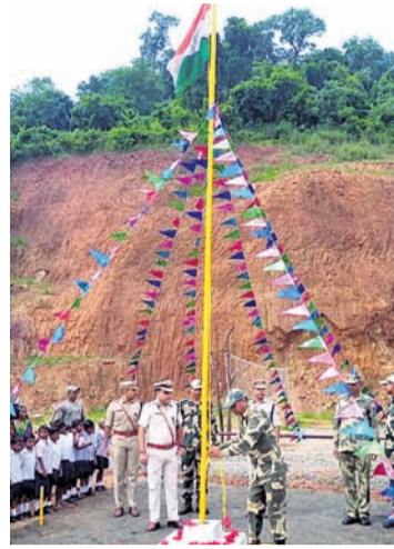
ଚିତ୍ରକୋଣ୍ଡାରେ ଯବାନମାନେ ପତାକା ଉତ୍ତୋଳନ କରୁଛନ୍ତି ।