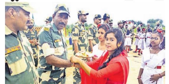
ସରସ୍ୱତୀ ଶିଶୁମନ୍ଦିରର ଛାତ୍ରାମାନେ ଯବାନମାନଙ୍କୁ ରାଖୀ ପିନ୍ଧାଉଛନ୍ତି । ଯବାନମାନେ ଆମକୁ ସୁରକ୍ଷା ଦେଉଛନ୍ତି । ସେମାନେ ବିଭିନ୍ନ ପର୍ବପର୍ବଣିରେ ପରିବାରଠାରୁ ଦୂରରେ ରୁହନ୍ତି । ସେହି ବୀର ଯବାନଙ୍କ ପ୍ରତି ସମ୍ମାନ ଓ ଭଲପାଇବା ପ୍ରଦର୍ଶନ କରି ରାଖୀ ବାନ୍ଧିଲେ ବୋଲି ଛାତ୍ରାଛାତ୍ରୀମାନେ କହିଛନ୍ତି ।

ଏନଏ-୭୯, ୧୬।୮ ଦେଶ ମାତୃଭାବ ସେବା କରି ସାଧାରଣ ଲୋକଙ୍କୁ ସୁରକ୍ଷା ଯୋଗାଇଥିବା ଯବାନଙ୍କୁ ରାଖୀ ବାନ୍ଧିଛନ୍ତି ଏନଏ-୭୯ସ୍ଥିତ ସରସ୍ୱତୀ ଶିଶୁମନ୍ଦିର ଛାତ୍ରା। ଗୁରୁତାର ବିଏସଏଫ କ୍ୟାମ୍ପରେ ପହଞ୍ଚି ଛାତ୍ରାଛାତ୍ରୀମାନେ ସେଠାରେ ଉପସ୍ଥିତ ଯବାନଙ୍କ ହାତରେ ରାଖୀ ବାନ୍ଧିଥିଲେ । ସେହିଭଳି ସାମାଜରେ ଥିବା ଯବାନଙ୍କ ପାଇଁ ମଧ୍ୟ ଏହି ଛାତ୍ରାଛାତ୍ରୀ ରାଖୀ ପଠାଇଛନ୍ତି । ଦେଶର ସୁରକ୍ଷା ଓ ଅଖଣ୍ଡତା ପାଇଁ ପ୍ରତିଜ୍ଞା ପରିଚ୍ଛେଦ ରହି ମଧ୍ୟ