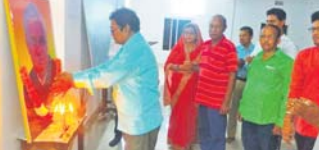
ଗୁଣପୁର, ୧୬।୮ (ଡି.ଏନ୍.ଏ.)

ରାୟଗଡ଼ା ଜିଲ୍ଲା ଗୁଣପୁରର ଗୋଷ୍ଠୀ ଶିକ୍ଷା ଓ ପ୍ରଶିକ୍ଷଣ ପ୍ରତିଷ୍ଠାନ ପରିସରରେ ପୂର୍ବତନ ପ୍ରଧାନମନ୍ତ୍ରୀ ସ୍ମୃତି ଅଟଳ ବିହାରୀଙ୍କ ଦୀର୍ଘକାଳୀନ ପ୍ରଥମ ଶ୍ରୀକ ଦିବସ କାର୍ଯ୍ୟକ୍ରମ ଶୁଭକାର ସନ୍ଧ୍ୟାରେ ପାଳିତ ହୋଇଛି।