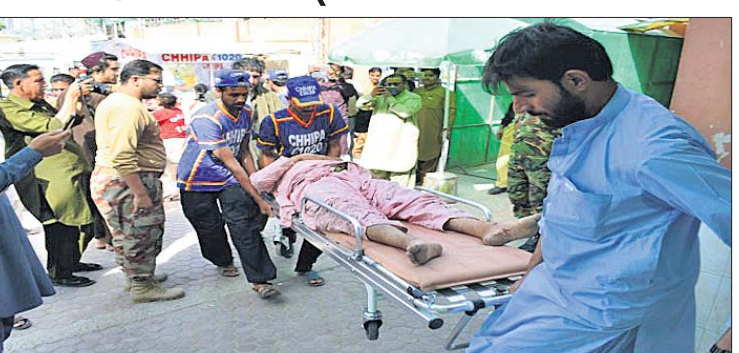
କସଲମାବାଦ, ୧୬।୮ (ପି.ଟି.)