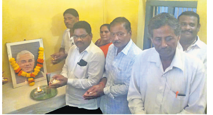
ଅତିଥିମାନେ ବାଜପେୟୀଙ୍କୁ ଶ୍ରଦ୍ଧାଘୂମନ ଅର୍ପଣ କରୁଛନ୍ତି ।