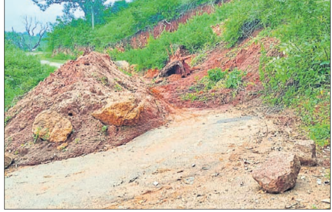
ବୁଜୁଲି ରାସ୍ତାରେ ଭୁକ୍ଷକନ ଯୋଗୁ ଅବରୋଧ ହୋଇ ରହିଛି ।

ମାଟି ଅତଡା ଧସି ବାରିଜବାଡ଼ି ବ୍ଲକ ପୁର୍ତ୍ତମ ହାତାମୁଣ୍ଡା ପଞ୍ଚାୟତର ବୁଜୁଲି ଗ୍ରାମକୁ ଗତ ଏକ ସପ୍ତାହ ହେଲେ । ଯୋଗାଯୋଗ ବିଚ୍ଛିନ୍ନ ହୋଇପଡ଼ିଛି । ସପ୍ତାହ ବିତିଥିଲେ ମଧ୍ୟ ପ୍ରଶାସନ ଏପର୍ଯ୍ୟନ୍ତ ଘଟଣାସ୍ଥଳରେ ପହଞ୍ଚିନାହିଁ । ଫଳରେ ବୁଜୁଲି ଗ୍ରାମର ଶହ ଶହ ଲୋକ ନାହିଁ ନଥିବା ହଇରାଣ ହୋଇଛନ୍ତି । ମାଓବାଦୀ ପ୍ରବଣ ବୁଜୁଲି ଗାଁର ବିକାଶ ହେବାଦିନ ପିଣ୍ଡିକ ପ୍ରଶାସନ ପକ୍ଷରୁ ପ୍ରଧାନ ମନ୍ତ୍ରୀ ଗ୍ରାମ୍ୟ ସଡ଼କ ଯୋଜନାରେ ଗାଁକୁ ପହଞ୍ଚାଣା ନିର୍ମାଣ କରାଯାଇଥିଲା । ପାହାଡ଼ ଉପରପୁଞ୍ଜରେ ଗ୍ରାମଟି ରହିଥିବାରୁ ପାହାଡ଼ର ବୁଜୁଲି କମାୟାଳ ରାସ୍ତା ନିର୍ମାଣ କରାଯାଇଥିଲା । ତେବେ ପାହାଡ଼ କମାୟାଳ ପରେ ବୁଜୁଲିରେ ପଥର