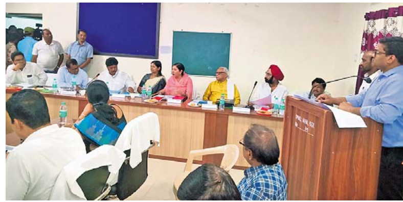
ବଲାଙ୍ଗୀର ଏକ ସମୀକ୍ଷା କ୍ରମରେ ରାଜ୍ୟ ମନ୍ତ୍ରୀଙ୍କ ସମୀକ୍ଷା ବୈଠକରେ ଉପସ୍ଥିତ ମନ୍ତ୍ରୀ, ଏମ୍ପି ବିଧାୟକ ଓ ପ୍ରଶାସନିକ ଅଧିକାରୀ ।

ବଲାଙ୍ଗୀର ଜିଲାର ଅଭୁତପୂର୍ବ ବନ୍ୟା କ୍ଷୟକ୍ଷତିରଣ ସମୀକ୍ଷା ବୈଠକ ଶୁକ୍ରବାର ସ୍ଥାନୀୟ ଏକ ସମୀକ୍ଷା କ୍ରମରେ ଅନୁଷ୍ଠିତ ହୋଇଥିଲା ।