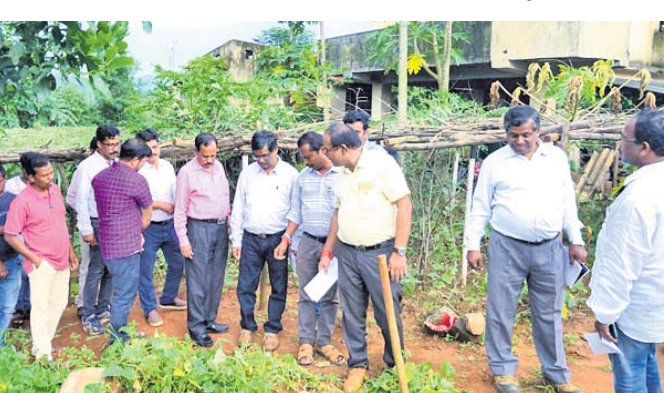
ଅତିରିକ୍ତ ଶାସନ ସଚିବଙ୍କ ସହ ଅନ୍ୟମାନେ ଚାଷକମି ବୁଝି ଦେଖୁଛନ୍ତି ।

କୋରାପୁଟ ଜିଲାର କନ୍ୟାପୁର ଅଞ୍ଚଳରେ ଯୁବ ଆଇପିଏସ୍ ଅଧିକାରୀଙ୍କ ଦାୟିତ୍ୱ ଗ୍ରହଣ ହୋଇଛି ।