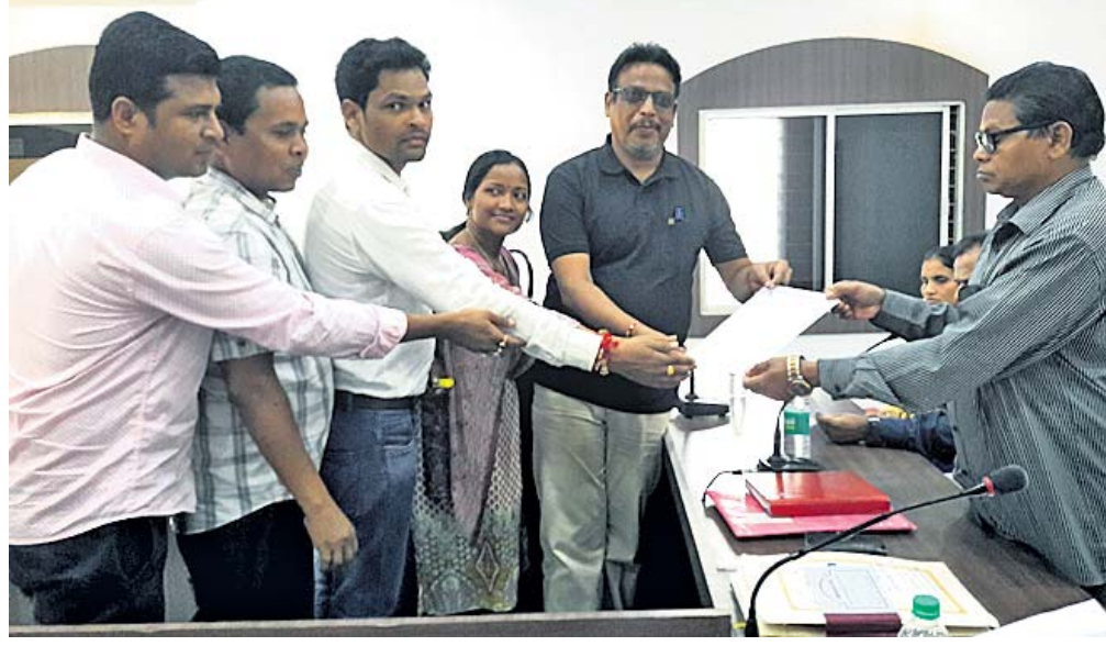
ଯନ୍ତ୍ରୀମାନେ ବିଡିଓ ଦାବିପତ୍ର ପ୍ରଦାନ କରାଯାଇଛି।

ଯୋଜିତର ଏକତରଫା ଗିରଫଦାରୀକୁ ବିରୋଧ କରି କୋରାପୁଟ ଜିଲ୍ଲା ପଟାଜି କୁଳ କାର୍ଯ୍ୟାଳୟ ଅଧୀନରେ କାର୍ଯ୍ୟ କରୁଥିବା ବିଭିନ୍ନ ବିଭାଗର ଯନ୍ତ୍ରୀ ଓ କୁଳର ଯନ୍ତ୍ରୀମାନେ କାର୍ଯ୍ୟବନ୍ଧ କରି ଆନ୍ଦୋଳନ ଚଳାଇଛନ୍ତି। ଯୋଜିତର ଏପରି କାର୍ଯ୍ୟକୁ ନିନ୍ଦା କରିଛନ୍ତି। ପରେ ଜିଲ୍ଲାପାଳ ଏବଂ ଜିଲ୍ଲା ପୋଲିସ ଆରକ୍ଷୀ ଅଧ୍ୟକ୍ଷଙ୍କ ଉଦ୍ଦେଶ୍ୟରେ ୨ ଦାବି ପତ୍ର ସ୍ଥାନୀୟ ଗୋଷ୍ଠୀ ଉଭୟର ଅଧିକାରୀ କରୁଣା କର ପ୍ରଧାନଙ୍କୁ ପ୍ରଦାନ କରିଛନ୍ତି। ଗତ ୧୪ ତାରିଖରେ ଜିଲ୍ଲାର ବନ୍ଧୁଗାଁ କୁଳର ଝଞ୍ଜାବତୀ ନଦୀ ନିକଟ ପାହାଡ଼ରୁ ମାଟି ଅତଡ଼ା ଧରି ୨ କଣ ଶ୍ରମିକଙ୍କ ମୃତ୍ୟୁ ହୋଇଥିଲା। ଏହି ଘଟଣାରେ ଯୋଜିତ ଠିକ ଭାବେ ତଦନ୍ତ ନ କରି ମାଟି ଉଠାଇବା କାର୍ଯ୍ୟରେ ଲାଗିଥିବା ଠିକାଦାରଙ୍କୁ ସୁରକ୍ଷା ଦେଇ କୁଳର ଏଇ ଅପଗ୍ରେଡ଼ କରାଯାଇଥିଲା। ଏହି ଗିରଫଦାରୀକୁ ଜିଲ୍ଲାର ସମସ୍ତ କୁଳସ୍ତରରେ କାର୍ଯ୍ୟରେ