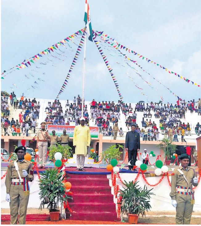
ଜିଲ୍ଲାସ୍ତରୀୟ ପରେତରେ ଅତିଥି ଅଭିବାଦନ ଗ୍ରହଣ କରୁଛନ୍ତି । ପ୍ରାତଃ ସ୍ମରଣୀୟ । ରାଜନୀତିଠାରୁ ଏମାଟି ଧନ୍ୟ ହୋଇଛି ବୋଲି ସେ ଆରମ୍ଭ କରି ସମାଜସେବା ଓ କଳା, କହିଥିଲେ । କାର୍ଯ୍ୟକ୍ରମରେ ପ୍ରଥମେ ସାହିତ୍ୟ ସମୀକ୍ଷା ଓ ନାଟ୍ୟ କରତର ମୁଖ୍ୟଅତିଥି ଅଭିବାଦନ ଗ୍ରହଣ ଅନ୍ୟ ପ୍ରତିଭାଧାରୀମାନଙ୍କୁ ପାଇ କରିବା ପରେ ପୁରୁଷ କମାଣ୍ଡର