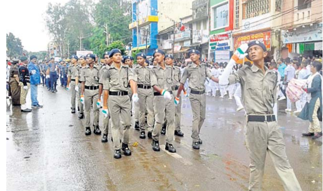
ପରେତରେ ଭାଗ ନେଇଥିବା ଛାତ୍ରାଛାତ୍ରୀମାନେ।