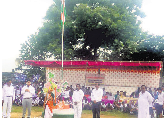
ଚିତ୍ରକୋଣ୍ଡାରେ ଯବାନମାନେ ପତାକା ଉତ୍ତୋଳନ କରୁଛନ୍ତି ।