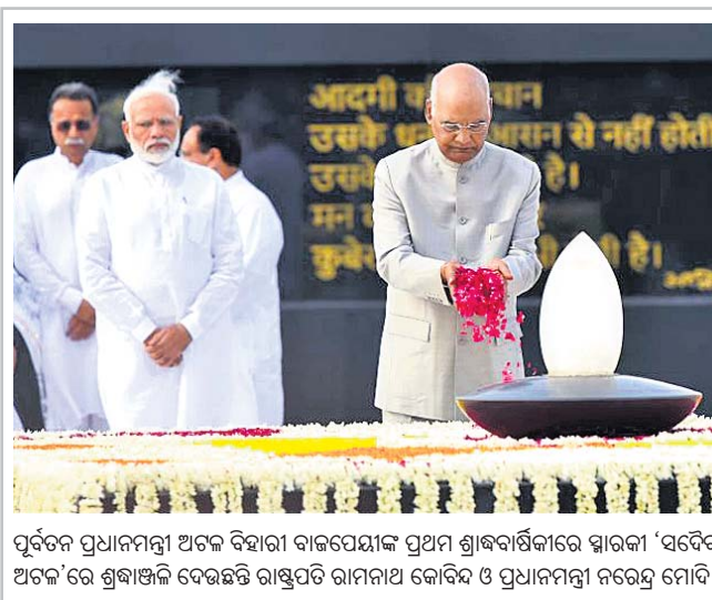
ପୂର୍ବତନ ପ୍ରଧାନମନ୍ତ୍ରୀ ଅଟଳ ବିହାରୀ ବାଜପେୟୀଙ୍କ ପ୍ରଥମ ଶ୍ରୀକର୍ମାଣ୍ଡଳରେ ସ୍ୱାଗତ। 'ସର୍ବୋତ୍ତମ'ରେ ଶ୍ରୀକର୍ମାଣ୍ଡଳରେ ରାଷ୍ଟ୍ରପତି ରାମନାଥ କୋବିନ୍ଦ ଓ ପ୍ରଧାନମନ୍ତ୍ରୀ ନରେନ୍ଦ୍ର ମୋଦି।