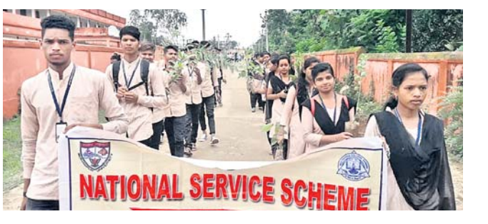
ଛାତ୍ରାଛାତ୍ରୀ ଶୋଭାଯାତ୍ରାରେ ଯାଉଛନ୍ତି ।