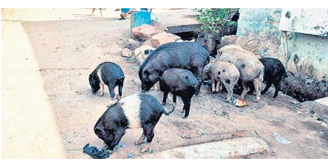
ରାସ୍ତାରେ ବୁଲୁଥିବା ଘୁଷୁରି ପଲ।

ଅତୀତସମୟ ବେଳେ ବା ଛିଗୁଲେଇ କରି କଥା କହିବା ବେଳେ ବିଭିନ୍ନ ପ୍ରକାର ଅଳିଭଳି ଦେଖାଇଥାନ୍ତି। ସାଧାରଣତଃ ଗାଁଗଣରେ ରହୁଥିବା ମହିଳାମାନେ ଅନଳକୁ ଆକ୍ଷେପ କଲାବେଳେ ମୁହଁ ଛିଆଡ଼ି ହୋଇ କଥା କହିଥାନ୍ତି। ଏପରିସ୍ଥିତିରେ ତାଙ୍କ ମୁହଁର ଆକୃତି ବଦଳିଯିବା ପରିପ୍ରେକ୍ଷାରେ ଏଭଳି ଉକ୍ତି ପ୍ରକାଶ କରାଯାଇଛି। ନିର୍ବାଚିତ ଜଗତମାଲି, ପ୍ରବାଦ, ପ୍ରବଚନ ଓ ଅନ୍ୟାନ୍ୟ - ପ୍ରାଣୀ ସାହିତ୍ୟ ପ୍ରତିଷ୍ଠାନ