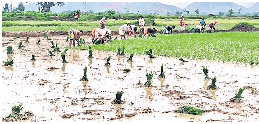
ବର୍ଷା ପରେ ଗଜପତି ଜିଲ୍ଲାରେ ଚାଷ କାର୍ଯ୍ୟ ଆଗେଇ ଚାଲିଛି।

ଗଜପତି ଜିଲ୍ଲାରେ ଗତ ୮ ଦିନ ତଳେ ଭଲ ବର୍ଷା ହେବାରୁ ଚାଷୀ ଏବେ ଚାଷକାର୍ଯ୍ୟରେ ଲାଗିପଡ଼ିଛନ୍ତି। ତେବେ ଏବେ ମଧ୍ୟ ପ୍ରାୟ ୧୫ ପ୍ରତିଶତ ଚାଷଜମି ପଡିଆ ପଡିଛି। ଏପରି କି ସେହି ଜମିରେ ମାଟି ବସିବା ପାଇଁ ହଳଲଙ୍ଗଳ ମଧ୍ୟ ବୁଲି ନ ଥିବା ଜଣାପଡିଛି। ଜିଲ୍ଲାରେ ଭଲ ବର୍ଷା ହେବାରୁ ଚାଷୀମାନେ ଆଶ୍ଚର୍ଯ୍ୟ ହୋଇଥିଲେ। କୁନ୍ଦମାସରେ ସ୍ୱାଭାବିକ ଠାରୁ ତେଜ କମ୍ ବର୍ଷା ହୋଇଥିଲେ ମଧ୍ୟ ଚାଷୀ ଲୁଲାଇ ମାସର ବର୍ଷାକୁ ଭରସା କରି କରଜ କରି ଚାଷ କାର୍ଯ୍ୟ ଆରମ୍ଭ କରିଦେଇଥିଲେ। ତଳ ଲଗାଇ ବିଲର ମାଟି ଚଷି ବର୍ଷାକୁ ଚାଷୀ ଚାହିଁ ରହନ୍ତି। ଏଭଳି କିଛି ଦିନ ଧରି ବର୍ଷା ନ ହେବା ଯୋଗୁ ଚାଷ ଜମିଗୁଡିକ ଖରାରେ ମାଟି ଫାଟିଯିବା ସହ ଲଗାଇଥିବା ତଳି ପୋତି ହଳକିଆ ପଡିଯାଇଥିଲା। ଅଗଷ୍ଟ ମାସର ୪ ତାରିଖ ପର୍ଯ୍ୟନ୍ତ ଚାଷୀଙ୍କୁ ଏଭଳି ଅଭାବି ବର୍ଷା ପରିସ୍ଥିତିର ସମ୍ମୁଖୀନ ହେବାକୁ ପଡିଥିଲା। ଜିଲ୍ଲାବ୍ୟାପୀ ୩ଦିନ ଧରି ଲଗାଣ ବର୍ଷା ହୋଇଥିଲା। ଏହା ଚାଷ ପରିସ୍ଥିତିକୁ ଅନେକ ପରିମାଣରେ ସୁଧାରି ଦେଇଥିଲା। ଚାଷୀ ଆସନ୍ତୁ ଲାଭ କରି ଚାଷ କାର୍ଯ୍ୟକୁ ଆଗେଇ ନେଇଛନ୍ତି। ବର୍ତ୍ତମାନ ସୁଦ୍ଧା ପ୍ରାୟ ୬୫ ପ୍ରତିଶତ ପତାରିବାରୁ ସେ କହିଛନ୍ତି ଯେ ଜିଲ୍ଲାରେ ତଳିତ ଖରିଫରେ ମୋଟ ୨୯ହଜାର