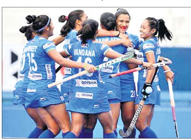
ଗୋଲ ଖୋର ପରେ ଉତ୍କଳବିତ ଭାରତୀୟ ଖେଳାଳି ।