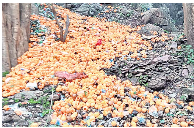
ପୀଠରେ ପଡ଼ୁଥିବା ପୁଷ୍ପକ ଦାନ ।

କୋରାପୁଟ ଜିଲାର ପ୍ରସିଦ୍ଧ ଶୈବପୀଠ ଗୁପ୍ତେଶ୍ୱର । ରାମଚନ୍ଦ୍ର କଳାଳର ପାହାଡର ଏକ ଗୁମ୍ଫା ମଧ୍ୟରେ ବିଶାଳକାୟ ଶିବ ଲିଙ୍ଗ ରହିଛି । ଏଥିସହ ଶାବରୀ ନଦୀର ମନାଲୋଭା ଦୃଶ୍ୟ ପ୍ରତିଦିନ ହଜାର ହଜାର ପର୍ଯ୍ୟଟକଙ୍କୁ ଆକୃଷ୍ଟ କରିଥାଏ । ଏବେ ଏହି ଶୈବ ପୀଠର ପରିଚାଳନାରେ ଘୋର ଅବ୍ୟବସ୍ଥା ଦେଖାଦେଇଛି । ଏହାର ପରିଚାଳନା ଦାୟିତ୍ୱ ଦେବତୋର ବିଭାଗ ହାତରେ ରହିଛି । ପ୍ରତି ସପ୍ତାହରେ ୫୦ ରୁ ୬୦ ହଜାର ଲୋକଙ୍କ ସମାଗମ ହେଉଛି । ପୀଠକୁ ଆସୁଥିବା ଭକ୍ତ ଓ ପର୍ଯ୍ୟଟକ ଶୋଷଣର ଶିକାର ହେଉଥିବା ଅଭିଯୋଗ ହୋଇଛି । ଦେବତୋର ବିଭାଗ ପକ୍ଷରୁ ବର୍ଷକୁ ପାଠିକ ଟିକେଟ ବାବଦକୁ ୫ ଟଙ୍କା ଧାର୍ଯ୍ୟ କରାଯାଇଛି । ହେଲେ ଭିଡ଼ ସମୟରେ ଦର୍ଶନ ଲାଗି ୨ ଶହରୁ ୫ ଶହ ଟଙ୍କା ପର୍ଯ୍ୟନ୍ତ ଆଦାୟ କରାଯାଉଛି । ମନ୍ଦିର ପରିଚାଳନା ପାଇଁ