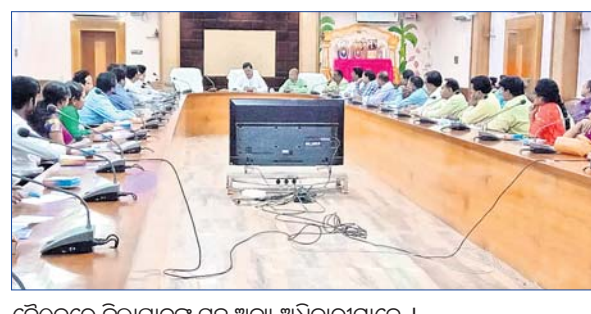
ବୈଠକରେ ଜିଲାପାଳଙ୍କ ସହ ଅନ୍ୟ ଅଧିକାରୀମାନେ।