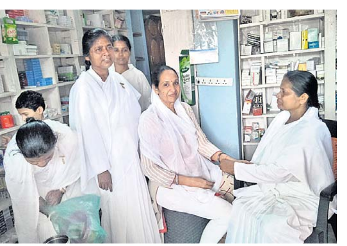
କ୍ଷତ୍ରୀୟ ପ୍ରକାପିତା ବ୍ରହ୍ମାକୁମାରୀ ପକ୍ଷରୁ ଜଣେ ମହିଳାଙ୍କ ହାତରେ ରାକ୍ଷ ବନ୍ଧାଯାଇଛି ।