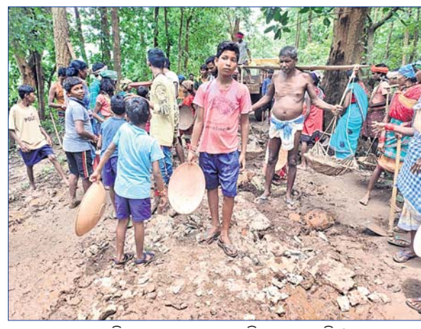
ଲୋକମାନଙ୍କ ସହ ପିଲାମାନେ ରାସ୍ତା ମରାମତି କାମ କରୁଛନ୍ତି।

ବର୍ଷ ବର୍ଷ ଧରି ଗାଁ ରାସ୍ତାରେ ମାଟି ପଡିଲା ନାହିଁ। ମରାମତି ଅଭାବରୁ ରାସ୍ତା ସାରା ଖାଲ ଖମାରେ ଭରି ହୋଇଗଲା। ବର୍ଷା ହେଲେ ଯାତାୟତରେ ଦେଖାଗଲା ସମସ୍ୟା। ଏପରିକି ଆୟୁରାଜ୍ଞି ଗାଁକୁ ଆସିଲା ନାହିଁ। କାନ୍ଥରାସ୍ତା ମରାମତି ଲାଗି ବାରମ୍ବାର ପ୍ରଶାସନକୁ ଗ୍ରାମବାସୀ ଜଣାଇଲେ ମଧ୍ୟ କିଛି ପଦକ୍ଷେପ ନିଆଗଲାନାହିଁ। ଶେଷରେ ପ୍ରଶାସନ ଉପରୁ ସମସ୍ତ ଆଶା ତୁଟାଇ ଗ୍ରାମର ଆବାଳ ବୁକ୍ସ ବନ୍ଦିତ ହାତରେ କୋଡି ଧରି ରାସ୍ତା କଲେ ମରାମତି। ନିଜସ୍ୱ ଉଦ୍ୟମରେ ରାସ୍ତା ତିଆରି ନବରଙ୍ଗପୁର ଜିଲ୍ଲା ପାପଡ଼ାହାଣ୍ଡି ବ୍ଲକ୍ ତରଫରେ ପଞ୍ଚାୟତ ପିପଲଗୁଡ଼ା ଗ୍ରାମବାସୀ ଅନ୍ୟମାନଙ୍କ ପାଇଁ ଉଦ୍‌ଘରଣ ସାଜିଛନ୍ତି। ପିପଲଗୁଡ଼ା ଠାରୁ ମୁଖ୍ୟ ରାସ୍ତାକୁ ସଂଯୋଗ କରୁଥିବା ୩ କିମି ରାସ୍ତା ଗତ ୧୫ ବର୍ଷ ହେଲା ମରାମତି ହୋଇନାହିଁ। ଏହି ରାସ୍ତା ଉପରେ ପିପଲଗୁଡ଼ା, ବରବେଲ, କନାରିଗୁଆଁ, ପୁଷ୍ପିଗୁଡ଼ା ଗ୍ରାମର ଲୋକେ ନିର୍ଭର କରିଥାନ୍ତି। ଲୋକଙ୍କ କହିବା ଅନୁଯାୟୀ ବର୍ଷା ହେଲେ ରାସ୍ତା କାନ୍ଥ ହୋଇପଡୁଛି। ରାସ୍ତାରେ ଚାଲି ଚାଲି ଯିବା ପୁସ୍ପିଲ ହୋଇପଡୁଛି। ଗତ ୨ ଦିନ ତଳେ