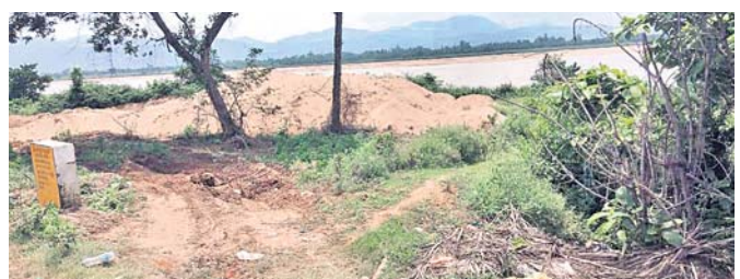
ବେଆଇନ ବାଲି ଉଠାଣ ସ୍ଥାନ।

ଗଜପତି ଜିଲ୍ଲା କାଶୀନଗରସ୍ଥିତ ବଂଶଧାରୀ ନଦୀରୁ ବେଆଇନ ବାଲି ଚାଲି ଉଠିବା ହେଉଥିବା ନେଇ ଅଭିଯୋଗ ହେବା ପରେ ଗତ ୧୪ ତାରିଖରେ ୫ଟି ବ୍ରହ୍ମଚରୀ ଲକ୍ଷ ୨୫ ହଜାର ଟଙ୍କା ଜରିମାନା ଆଦାୟ ହୋଇଥିଲା। ଏହି ବାଲି ଆନ୍ଧ୍ରକୁ ଚାଲି ଉଠିବା ଚାଷୀଙ୍କ ପରେ ତହସିଲଦାର ଓ ପୋଲିସ୍ ତତ୍ତ୍ୱ ନେଇ ବ୍ରହ୍ମଚରୀ ଜବତ କରିଥିଲେ। ଏହାର ସଠିକ୍ ତଦନ୍ତ ଲାଗି ତହସିଲଦାର ଏକ କମିଟି ଗଠନ କରିଥିଲେ। ଉକ୍ତ କମିଟି ରିପୋର୍ଟ ଗ୍ରହଣ କରି ପରିଦର୍ଶନ କରି ଫେରିଛନ୍ତି। ବର୍ତ୍ତମାନ ବଂଶଧାରୀ ନଦୀରେ ବନାଜକ ପ୍ରବାହିତ ହେଉଥିବାରୁ ରାମାମ୍ବୁ ବାଲି କାଢ଼ିବା ସମ୍ଭବ ନୁହେଁ। ତେବେ କେତେକ