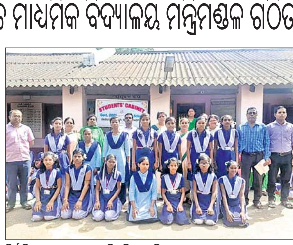
ନିର୍ବାଚିତ ଛାତ୍ରାଧିକାରୀଙ୍କ ସହ ଶିକ୍ଷୟିତ୍ରୀ ଓ ଶିକ୍ଷକ।