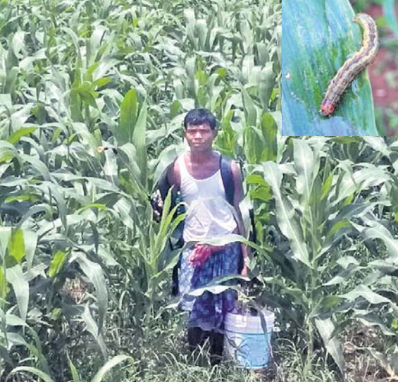
ମକା ଫସଲରେ ଚାଷୀ କାର୍ତନାଶକ ସିଞ୍ଚନ କରୁଛନ୍ତି।

ମକା ଫସଲରେ ଫଳ ଆର୍ତ୍ତ ଖର୍ଚ୍ଚ ଯୋଗ ବିହୀନ ରାଗରାତି ଏକର ଏକର ଫସଲ ଖାଇଯାଉଛି। ଯାହାକି ଚାଷୀଙ୍କ ନିଦ ହଜାଇ ଦେଇଛି। କିପରି ଏହି ଯୋଗ ଦାଉରୁ ଫସଲକୁ ରକ୍ଷା କରିବେ ସେହି ଚିତ୍କାରେ ନବରଙ୍ଗପୁର ଜିଲ୍ଲା ଚାଷୀ ରହିଛନ୍ତି। ନବରଙ୍ଗପୁର ଜିଲ୍ଲା କୋଷାଗୁମୁଡ଼ା ବ୍ଲକ୍ରେ ପ୍ରାୟ ୭୦ ଭାଗ ଲୋକ ଆଦିବାସୀ ଶ୍ରେଣୀର। ଏମାନଙ୍କର ମୁଖ୍ୟ ଜୀବିକା କୃଷି। ଧାନ, ମକା, ଆଖୁ, ମାଝିଆ, ବିରି, କୋଳଥ ଭତ୍ୟାଦି ସେମାନେ ଚାଷ କରିଥାନ୍ତି। କୋଷାଗୁମୁଡ଼ା ବ୍ଲକ୍ରେ ଅଣଜଳସେଚିତ ଅଞ୍ଚଳ। ୨ଟି ଚିରଶ୍ରେଣୀ ନଦୀ ଭାସେଲ, ଛନ୍ଦାବତୀ ରହି ମଧ୍ୟ କୌଣସି କେନାଲ ଛୁଟିଆ ନାହିଁ। ତେଣୁ ବ୍ଲକ୍ରେ ଚାଷୀ ମୁଖ୍ୟତଃ ଖରିଫ ଫସଲ ଉପରେ ହିଁ ନିର୍ଭର କରିଥାନ୍ତି। ଅର୍ଥକାରୀ ଫସଲ ଭାବେ ଅଞ୍ଚଳରେ ମକା ଏବଂ ଆଖୁ ଚାଷ କରାଯାଇ ପାଏ। ସରକାରୀ ସୂଚନା ଅନୁଯାୟୀ କୋଷାଗୁମୁଡ଼ା ବ୍ଲକ୍ରେ ୫୨୦୦ ହେକ୍ଟର ମକା ଚାଷ କରାଯାଇଛି। କିନ୍ତୁ ଫଳ ଆର୍ତ୍ତ ଖର୍ଚ୍ଚ ଯୋଗ ବିହୀନ ମକା ଫସଲ ନଷ୍ଟ ହୋଇ ଯାଉଛି। ମକା ଚାଷୀମାନେ ଏହି ଯୋଗକୁ ବ୍ୟବହାର କରିବା ପାଇଁ ନାକେଦମ୍