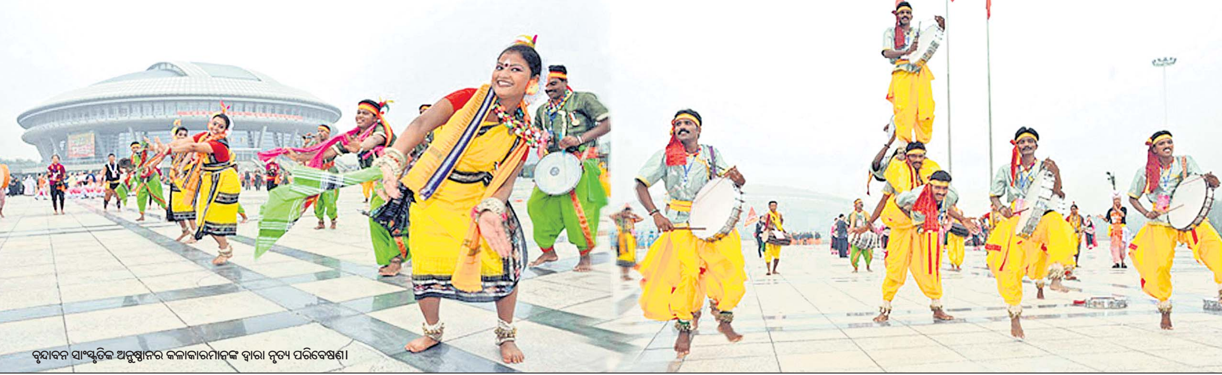
ବୃନ୍ଦାବନ ସାଂସ୍କୃତିକ ଅନୁଷ୍ଠାନର କଳାକାରମାନଙ୍କ ଦ୍ୱାରା ନୃତ୍ୟ ପରିବେଷଣ।

ଶହଶହ ରୋଗୀଙ୍କୁ ଚକ୍ଷୁ ଚିକିତ୍ସା ଶିବିର ଆୟୋଜନକରି ଚକ୍ଷୁ ଚିକିତ୍ସା ସହ ଅସ୍ତ୍ରୋପଚାର କରି ସେବା ଯୋଗାଇ ଆସୁଛି। ଏଥିପାଇଁ ଭାରତ ସରକାରଙ୍କ ନେତୃତ୍ୱ ସ୍ତରରେ ପକ୍ଷରୁ ଜିଲାର ଶ୍ରେଷ୍ଠ ସାମାଜିକ ଅନୁଷ୍ଠାନ ଭାବରେ