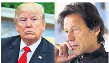
ଡୋନାଲ୍ଡ ଟ୍ରମ୍ପ ଇମ୍ରାନ୍ ଖାନ୍

ଗୁରୁତର ଆର୍ଥିକ ସଙ୍କଟ ମଧ୍ୟରେ ଗତି କରୁଥିବା ପାକିସ୍ତାନକୁ ଆଉ ଏକ ବଡ଼ ଝଟକା ଲାଗିଛି। ଆମେରିକା ପାକିସ୍ତାନକୁ ଯୋଗାଉଥିବା ଆର୍ଥିକ ସହାୟତାକୁ ୪୪୦ ନିୟୁତ ଡଲାର ହ୍ରାସ କରିଛି। ପାକିସ୍ତାନ ବର୍ଷିତ ସହାୟତା ରାଜିନାମା (ପିଇପିଏ), ୨୦୧୯ ଅନୁଯାୟୀ ଆମେରିକା ଇସ୍ଲାମାବାଦକୁ ଏହି ସହାୟତା ଯୋଗାଇଥାଉଛି। ପାକ୍ ପ୍ରଧାନମନ୍ତ୍ରୀ ଇମ୍ରାନ୍ ଖାନଙ୍କ ଖିଂଚନ ଗପ୍ତର ତିନି ସପ୍ତାହ ପୂର୍ବରୁ ଆମେରିକା ସହାୟତା ହ୍ରାସ ସମ୍ପର୍କରେ ଜଣାଇଦେଇଥିଲା। ପୂର୍ବରୁ ଏହି ସହାୟତା ପରିମାଣ ୪.୫ ବିଲିୟନ ଡଲାର ଥିଲା। ୪୪୦ ନିୟୁତ ଡଲାର କମାଇବା ପରେ ତାହା ୪.୧ ବିଲିୟନ ଡଲାରକୁ ହ୍ରାସ ପାଇଛି। ଇସ୍ଲାମାବାଦ ଆତଙ୍କବାଦ ଦମନ କ୍ଷେତ୍ରରେ ବିଫଳ ହୋଇଥିବାରୁ ଆମେରିକା ଦେବାକୁ ଥିବା ୩୩୦ ନିୟୁତ ଡଲାର ପ୍ରତିରକ୍ଷା ସହାୟତାକୁ ଗତବର୍ଷ ସେପ୍ଟେମ୍ବରରେ ବାତିଲ କରିଦେଇଥିଲା। ହକାନ୍ଦି ଆତଙ୍କବାଦୀ ନେତୃତ୍ୱକୁ ଦମନ କରିବାରେ ବିଫଳ ପାକିସ୍ତାନକୁ ଗତବର୍ଷ ଜାନୁଆରୀରେ ପେଣ୍ଟାଗନ