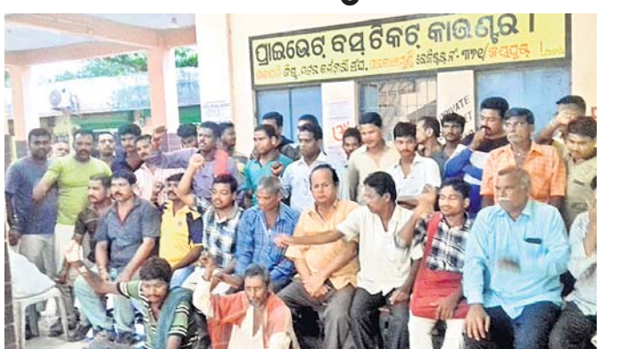
ଧାରଣରେ ବସିଥିବା ମୋଟର କର୍ମଚାରୀ ସଂଘର କର୍ମକର୍ତ୍ତା।