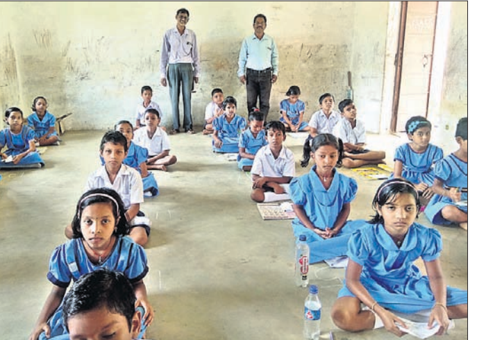
ବୃତ୍ତି ପରୀକ୍ଷା ଦେଉଥିବା ଛାତ୍ରୀଛାତ୍ର।

ଭାପୁର ବ୍ଲକର ୧୨୨ ଛାତ୍ରୀଛାତ୍ର ଶନିବାର ତୃତୀୟ ଶ୍ରେଣୀ ବୃତ୍ତି ପରୀକ୍ଷା ଦେଇଛନ୍ତି। ଭାପୁର ନୋଡାଲ ଉଚ୍ଚ ପ୍ରାଥମିକ ବିଦ୍ୟାଳୟରେ ଏହି ପରୀକ୍ଷା ୧୦ଟା ୩୦ମିନିଟ୍ ସମୟରେ ଆରମ୍ଭ ହୋଇ ମଧ୍ୟାହ୍ନ ୧୨ଟା ୩୦ରେ ଶେଷ ହୋଇଛି। ବ୍ଲକର ୮୦ ବିଦ୍ୟାଳୟରୁ ୧୨୬ଜଣ ଛାତ୍ରୀଛାତ୍ର ପରୀକ୍ଷା ପାଇଁ ନାମ ପଞ୍ଜୀକରଣ କରିଥିବା ବେଳେ ସେମାନଙ୍କ ମଧ୍ୟରୁ ୪ଜଣ ଅନୁପସ୍ଥିତ ରହିଥିଲେ। ପରୀକ୍ଷାସମାପନେ ସାହିତ୍ୟ, ଗଣିତ, ସାମାଜିକ ବିଜ୍ଞାନ ଓ ମାନବିକ ଦକ୍ଷତା ବିଷୟରେ ପରୀକ୍ଷା ଦେଇଛନ୍ତି।