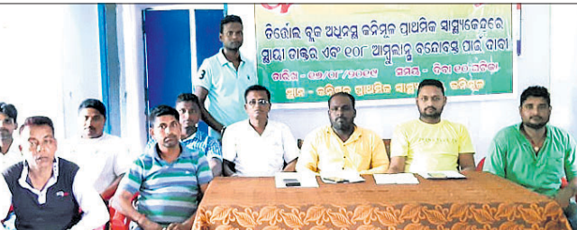
ଖବରଦାତା ସମ୍ମିଳନୀରେ ଉପସ୍ଥିତ ଗ୍ରାମବାସୀ।

ମଣିଜଙ୍ଗ ଗୋଷ୍ଠୀ ସ୍ୱାସ୍ଥ୍ୟକେନ୍ଦ୍ର ଅଧୀନରେ ଥିବା କନିମୂଳ ପିଏଚସି(ପ୍ରାଥମିକ ସ୍ୱାସ୍ଥ୍ୟକେନ୍ଦ୍ର)ରେ ସ୍ୱାସ୍ଥ୍ୟସେବା ବିପର୍ଯ୍ୟସ୍ତ ହୋଇପଡିଛି। ଫଳରେ ବିଶେଷତଃ, କନିମୂଳ, ଦାଲିଆ ଓ ଗୋପାଳପୁର ପଞ୍ଚାୟତର ୩୫ ହଜାରରୁ ଊର୍ଦ୍ଧ୍ୱ ଲୋକ ସ୍ୱାସ୍ଥ୍ୟସେବାରୁ ବଞ୍ଚିତ ହେଉଛନ୍ତି। ଏ ସମ୍ପର୍କରେ ଶୁକ୍ରବାର ଖବରଦାତା ସମ୍ମିଳନୀରେ ଉପସ୍ଥିତ ଗ୍ରାମବାସୀ।