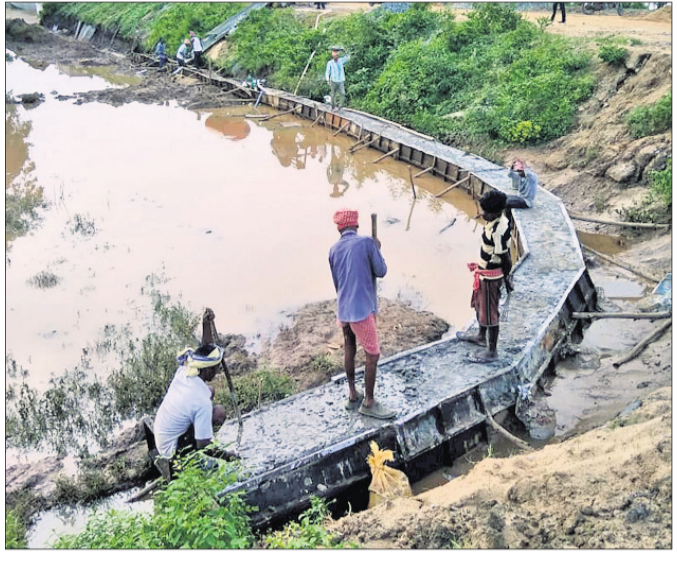
ସେତୁକୁ ସଂଯୋଗ କରୁଥିବା ରାସ୍ତାର ଗାର୍ଡ଼ଫ୍ରେମ ନିର୍ମାଣ କରାଯାଉଛି।

ନାଉରୀ ବ୍ଲକ କୋରୁଆ ପଞ୍ଚାୟତ ତାହାଣ୍ଡିଆ ଠାରେ ଦେବୀ ନଦୀ ଉପରେ ନିର୍ମାଣ ହୋଇଛି ବିକ୍ଷୁ ସେତୁ। ଏବେ ଏହାର ସଂଯୋଗାକରଣ ରାସ୍ତା କାମ ଚାଲିଛି। ତେବେ ସଂଯୋଗାକରଣ ରାସ୍ତା ନିର୍ମାଣ ନ ସମ୍ପୂର୍ଣ୍ଣ ନିର୍ମାଣର କାର୍ଯ୍ୟ ଯୋଗୁଁ ସେତୁରେ ପୀଡ଼ ସୃଷ୍ଟି ହୋଇଛି। କାର୍ଯ୍ୟସ୍ଥଳରେ ବିଭାଗୀୟ ଅଧିକାରୀ ଉପସ୍ଥିତ ରହି ନ ଥିବାରୁ ଠିକାଦାରମାନେ କାର୍ଯ୍ୟ କରୁଥିବା ସ୍ଥାନୀୟ ଲୋକେ ଅଭିଯୋଗ କରିଛନ୍ତି। ଏପରି କି ସଂଯୋଗାକରଣ ରାସ୍ତା ପାର୍ଶ୍ୱରେ ନିର୍ମାଣ ହୋଇଥିବା ଗାର୍ଡ଼ଫ୍ରେମ କାର୍ଯ୍ୟ ମଧ୍ୟ ନିର୍ମାଣର ହେଉଥିବା ସେମାନେ କହିଛନ୍ତି। ସୂଚନା ଅନୁଯାୟୀ, ଏହି ସେତୁ ପାଇଁ ପୁଞ୍ଜୀମଗ୍ନୀ ନବୀନ ପଟ୍ଟନାୟକ ୨୦୧୪ରେ ଭିତ୍ତିପ୍ରସ୍ତର ସ୍ଥାପନ କରିଥିଲେ। ଜଗତସିଂହପୁର ଗ୍ରାମ୍ୟ ଉନ୍ନୟନ ବିଭାଗ ପକ୍ଷରୁ ୨୬ କୋଟି ୨୮ ଲକ୍ଷ ଟଙ୍କା ବ୍ୟୟ ବରାଦ କରାଯାଇଥିଲା। ବିଭାଗ ପକ୍ଷରୁ ଟେଣ୍ଡର ଯୋଗେ କଳିକଟାର ରୟାଳ କନ୍ସ୍ଟ୍ରକ୍ସନ ସଂସ୍ଥାକୁ କାର୍ଯ୍ୟଦେଶ ଦିଆଯାଇଥିଲା। ରୁକ୍ମି ଅନୁସାରେ କାର୍ଯ୍ୟ ଆରମ୍ଭ ତାରିଖ ୧୫ ଜାନୁଆରୀ ୨୦୧୪ ଓ ଶେଷ ତାରିଖ ୧୪ ଜୁନ ୨୦୧୬ ରହିଥିଲା। ଗୁରୁତ୍ୱପୂର୍ଣ୍ଣ କଥା ହେଲା ଏହି କମ୍ପାନୀ ସେତୁ କାର୍ଯ୍ୟ ଆରମ୍ଭ କରିବା ସମୟରେ ଅଣକୃଷକା