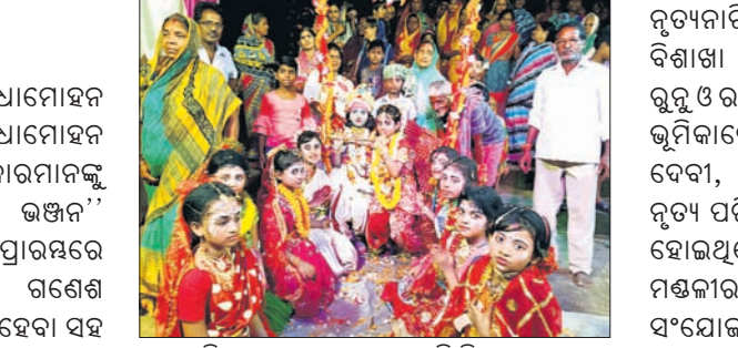
ନୃତ୍ୟନାଟିକାରେ ଭାଗ ନେଇଥିବା କୁନି ପିଲାମାନେ।