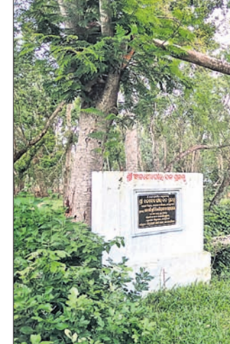
ସବକଳ କଣିପତାଠାରେ ଥିବା ବନ ପ୍ରକଳ୍ପ । ଫନୀରେ ଏହି ଜଙ୍ଗଲ ପ୍ରଭାବିତ ହୋଇ ୧୦୦୦ରୁ ଊର୍ଦ୍ଧ୍ୱ ଗଛ ଭାଙ୍ଗି ଯାଇଥିଲା ।

ରୁକ୍‌ସା କ୍ଷେତ୍ରାଧିପତି ଶ୍ରୀବଳଦେବଜୀଉଙ୍କ ମନ୍ଦିର ପାଇଁ ତେରାବିଶ ବୃକ୍ ଅଧୀନ ସବକଳ କଣିପତାଠାରେ କେନ୍ଦ୍ରାପଡ଼ା ଜିଲାର ଏକମାତ୍ର ବନ ପ୍ରକଳ୍ପ ପ୍ରତିଷ୍ଠା କରାଯାଇଛି ।