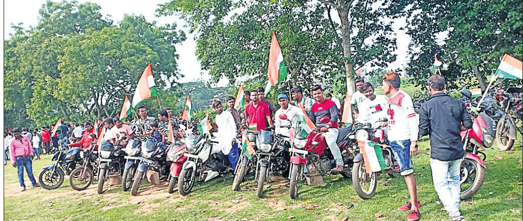
ମୁସଲିମ୍ ବହିର ଯୁବକମାନେ ଶୋଭାଯାତ୍ରାରେ ଯାଉଛନ୍ତି ।

ପଟ୍ଟାମୁଣ୍ଡାଳ, ୧୭୮ (ସ.ପ୍ର.) କନ୍ଧାରୁ ୩୭୦ଧାରା ଉତ୍ତେଜ ପରେ ମୁସଲମାନ ଯୁବକମାନଙ୍କ ମଧ୍ୟରେ ବେଶ ଉତ୍ସାହ ପରିଲକ୍ଷିତ ହୋଇଛି ।