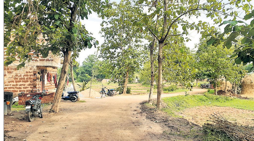
ନୟାଗଡ଼ ବୁଦ୍ଧି ଶକ୍ତି ଗ୍ରାମକୁ ପଡ଼ିଥିବା ରାସ୍ତା।

ନୟାଗଡ଼ ଜିଲ୍ଲାର ବିଭିନ୍ନ ପଞ୍ଚାୟତରେ ଆଲୋକୀକରଣ ବ୍ୟବସ୍ଥା ଫେଲ୍ ମାରିଥିବା ବେଶ୍ ବାବୁ ମିଳୁଛି। ଏ ନେଇ ପ୍ରତି ପଞ୍ଚାୟତକୁ ଅର୍ଥରାଶି ପ୍ରଦାନ କରାଯାଇଛି। ହେଲେ ପଞ୍ଚାୟତ ନିର୍ବାହୀ ଅଧିକାରୀ ଓ ସରପଞ୍ଚମାନେ ଧାନ ଦେଇ ନ ଥିବାରୁ ଏହି ବ୍ୟବସ୍ଥା ଫେଲ୍ ମାରିଥିବା କୁହାଯାଉଛି। ଅନ୍ୟପକ୍ଷେ ଲାଇଟ୍ ଲଗାଇବା ପରେ ରକ୍ଷଣାବେକ୍ଷଣା ଖର୍ଚ୍ଚ କିପରି କରିବେ ସେ ନେଇ ସରପଞ୍ଚମାନେ ବୁଦ୍ଧିରେ ଥିବାରୁ ଏଥିପ୍ରତି ଆଗଭର ହେଉ ନ ଥିବା ଜଣାପଡ଼ିଛି। ପ୍ରକାଶ ଯେ, ପ୍ରତି ଗ୍ରାମରେ ଆଲୋକୀକରଣ ବ୍ୟବସ୍ଥା ପାଇଁ କେନ୍ଦ୍ର ଅର୍ଥ କମିଶନ ଓ ରାଜ୍ୟ ଅର୍ଥ କମିଶନ ପଞ୍ଚାୟତକୁ ଟଙ୍କା ଦେଇଛନ୍ତି। ମିଳିଥିବା ସୁତରା ଅନୁସାରେ ୨ ବର୍ଷରେ ପ୍ରତି ପଞ୍ଚାୟତକୁ ୧ ଲକ୍ଷ ୭୬ ହଜାର ଟଙ୍କା ପ୍ରଦାନ କରାଯାଇଛି। ଏହିଭଳି ଭାବେ ଜିଲ୍ଲାର ୧୯୪ ପଞ୍ଚାୟତକୁ ୩ କୋଟି ୪୧ ଲକ୍ଷ ୪୪ ହଜାର ଟଙ୍କା ପ୍ରଦାନ କରାଯାଇଛି। ପୂର୍ବରୁ ମଧ୍ୟ ଏ ନେଇ ଅର୍ଥ ପ୍ରଦାନ କରାଯାଇଥିଲା। ହେଲେ