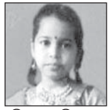
ବି. ସାଲ ଶିବାନୀ ପରିବାରବର୍ଗ