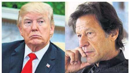
ଡୋନାଲ୍ଡ ଟ୍ରମ୍ପ ଇମ୍ରାନ୍ ଖାନ୍

ଗୁରୁତର ଆର୍ଥିକ ସଙ୍କଟ ମଧ୍ୟରେ ଗତି କରୁଥିବା ଆମେରିକାକୁ ଆଉ ଏକ ବଡ଼ ଝଟକା ଲାଗିଛି। ଆମେରିକା ପାକିସ୍ତାନକୁ ଯୋଗାଉଥିବା ଆର୍ଥିକ ସହାୟତାକୁ ୪୪୦ ନିୟୁତ ଡଲାର ହ୍ରାସ କରିଛି। ପାକିସ୍ତାନ ବର୍ଷିତ ସହାୟତା ରାଜିନାମା (ପିଇପିଏ), ୨୦୧୦ ଅନୁଯାୟୀ ଆମେରିକା ଇସ୍ଲାମାବାଦକୁ ଏହି ସହାୟତା ଯୋଗାଇଥିଲା। ପାକ୍ ପ୍ରଧାନମନ୍ତ୍ରୀ ଇମ୍ରାନ୍ ଖାନଙ୍କ ଖିଂଚନ ଗପର ତିନି ସପ୍ତାହ ପୂର୍ବରୁ ଆମେରିକା ସହାୟତା ହ୍ରାସ ସମ୍ପର୍କରେ ଜଣାଇଦେଇଥିଲା। ପୂର୍ବରୁ ଏହି ସହାୟତା ପରିମାଣ ୪.୫ ବିଲିୟନ ଡଲାର ଥିଲା। ୪୪୦ ନିୟୁତ ଡଲାର କମାଇବା ପରେ ତାହା ୪.୧ ବିଲିୟନ ଡଲାରକୁ ହ୍ରାସ ପାଇଛି। ଇସ୍ଲାମାବାଦ ଆତଙ୍କବାଦ ଦମନ କ୍ଷେତ୍ରରେ ବିଫଳ ହୋଇଥିବାରୁ ଆମେରିକା ଦେବାକୁ ଥିବା ୩୩୦ ନିୟୁତ ଡଲାର ପ୍ରତିରକ୍ଷା ସହାୟତାକୁ ଗତବର୍ଷ ସେପ୍ଟେମ୍ବରରେ ବାତିଲ କରିଦେଇଥିଲା। ହକାନ୍ଦି ଆତଙ୍କବାଦୀ ନେତୃତ୍ୱକୁ ଦମନ କରିବାରେ ବିଫଳ ପାକିସ୍ତାନକୁ ଗତବର୍ଷ ଜାନୁଆରୀରେ ପେଣ୍ଟାଗନ