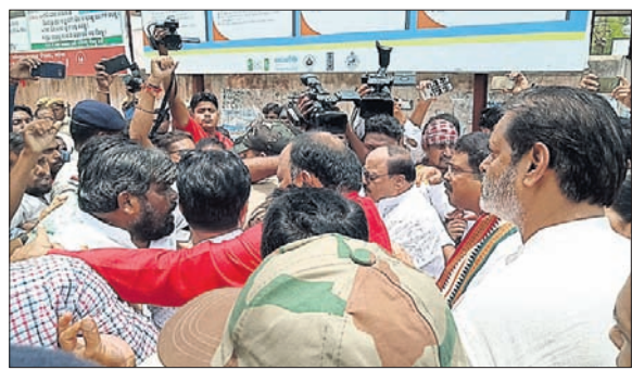
ବଲାଙ୍ଗୀର ଅଫିସ୍, ୧୭୮

କେନ୍ଦ୍ରମନ୍ତ୍ରୀ ଧର୍ମେନ୍ଦ୍ର ପ୍ରଧାନଙ୍କ ବନ୍ୟା ସମାକ୍ଷା ବିଠକରେ ଯୋଗଦେବାକୁ ଯାଉଥିବାବେଳେ ବଲାଙ୍ଗୀର ଏମ୍ପି ସମାଜୀୟ ବିପ୍ଳବୀୟ ସମାଜର ବିରୋଧ କରି ନାରାବାଜି କରିଥିଲେ । ପୁଲିସ୍ ସହ ଧସାଧସି କରିଥିଲେ ।