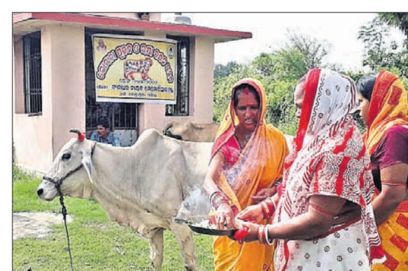
ମହିଳାମାନେ ଗୋମାତାଙ୍କ ପୂଜା କରୁଛନ୍ତି ।