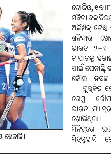
ଗୋଲ ଖୋର ପରେ ଉତ୍ସାହ ଭାରତୀୟ ଖେଳାଳି ।

ବୁଲ୍ଲୀୟ ଟ୍ରଫି ଇଣ୍ଡିଆ ଗ୍ରାନ୍ଦ ପକ୍ଷରୁ ତାହାଶହାତୀ ସୁତ ବୋଲର ଭଲ-ହନ୍ଦ ୨ ଓ ଅଜିତ ରାଜପୁତ ଗୋଟିଏ ଉଇକେଟ୍ ଅକ୍ରିଆର କରିଛନ୍ତି । ବର୍ଷା ଯୋଗୁ ପ୍ରଥମ ଦିବସରେ ମାତ୍ର ୪୯ ଓଭର ଖେଳ ସମ୍ପର୍କରେ ହୋଇପାରିଥିଲା ।