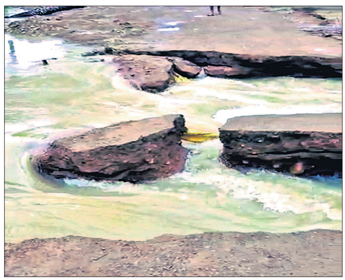
ନିର୍ମାଣାଧୀନ ପୋଲର ତାଳଭର୍ଷନ ଧୋଇ ହୋଇଯାଇଛି।

ଦେଶାନ୍ତର-ବଣସିଂହ ପୂର୍ବ ବିଭାଗ ରାସ୍ତାର ଖମାର ନିକଟରେ ପ୍ରବାହିତ ଧୋଇଗଲାଣି। ନାଳ ଉପରେ ନିର୍ମାଣାଧୀନ ପୋଲ ସଂଲଗ୍ନ ତାଳଭର୍ଷନ ରାସ୍ତା ଲଗାଣ ବର୍ଷାରେ ଧୋଇଯାଇଛି। ଫଳରେ ଜିଲ୍ଲା ସଦର ମହକୁମାଠାରୁ ୪ ପଞ୍ଚାୟତକୁ ଯୋଗାଯୋଗ ବିଚ୍ଛିନ୍ନ ହୋଇପଡ଼ିଛି। ଶନିବାର ରାତିରେ ପ୍ରବଳ ବର୍ଷା ଯୋଗୁ ନାଳର ଜଳସ୍ତର ବୃଦ୍ଧି ପାଇଥିଲା। ବର୍ଷାପାଣି ନାଳରୁ ଉତ୍ସୁକ ତାଳଭର୍ଷନ ରାସ୍ତା ଉପର ଦେଇ ପ୍ରବାହିତ ହୋଇଥିଲା। ରବିବାର ସକାଳୁ ସ୍ରୋତ ଆହୁରି ତୀବ୍ର ହୋଇଥିଲା। ଫଳରେ ଉକ୍ତ ତାଳଭର୍ଷନ ରାସ୍ତା