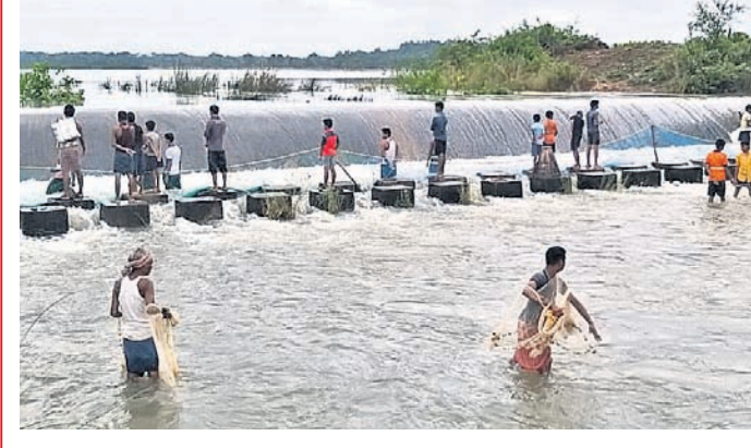
ଦେଶାନ୍ତର ଜିଲ୍ଲା ପରଜଙ୍ଗ ବ୍ଲକ୍ ଲୋଧଣି ପଞ୍ଚାୟତ ମେଣ୍ଟାପଦା ସ୍ତ୍ରୁତ ଜଳସେଚନ ପ୍ରକଳ୍ପରୁ ବାହାରୁଥିବା ଉଦ୍‌ବୃତ୍ତ ଜଳକୁ ରବିବାର ସ୍ଥାନୀୟ ଲୋକେ ମାଛ ଧରୁଛନ୍ତି। (ଫଟୋ-ନିମ୍ନମାନର)