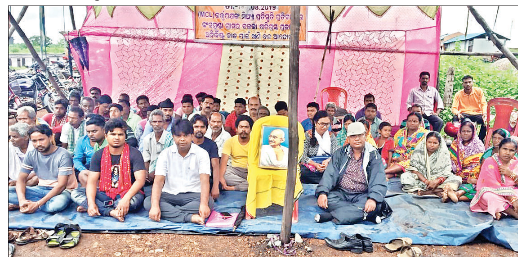
ଆନ୍ଦୋଳନରେ ସାମିଲ ହୋଇଥିବା ଗ୍ରାମବାସୀ।