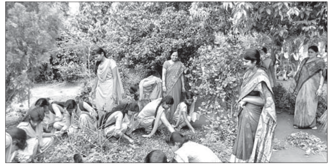
ସ୍ୱଚ୍ଛତା ଅଭିଯାନରେ ସଫେଇ କାର୍ଯ୍ୟ।