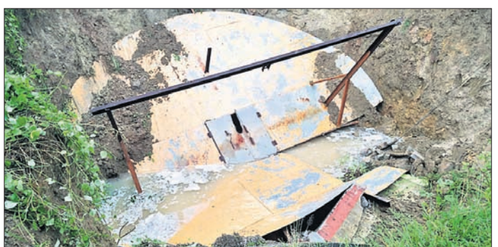
ଡିପ୍ରେସନ ଭୁବନେଶ୍ୱର ପଡ଼ିଛି।

ଦେଶାନ୍ତର ଜିଲ୍ଲା ପରଜଙ୍ଗ ବ୍ଲକ୍ କଳକ୍ରାନ୍ତୀ ଗ୍ରାମରେ 'ବସୁଧା' ଯୋଜନାରେ ନିର୍ମିତ ପାନୀୟ ଜଳ ଯୋଗାଣ ପ୍ରକଳ୍ପର ଡିପ୍ରେସନ ଶନିବାର ଭୁବନେଶ୍ୱର ଗତ ୧୫ଦିନ ମଧ୍ୟରେ ଏହା ହେଉଛି ଦ୍ୱିତୀୟ ଘଟଣା। ଏହା ପୂର୍ବରୁ ଅଗଷ୍ଟ ୩ରେ ନୂଆକୁଆଳୋ ଗ୍ରାମରେ ଅନୁରୂପ ଭାବେ ନବନିର୍ମିତ ଡିପ୍ରେସନ ଭୁବନେଶ୍ୱର ଅନୁକମ୍ପା ଏବଂ ବିଭାଗୀୟ ଅଧିକାରୀଙ୍କ ଦାୟିତ୍ୱହୀନତାକୁ ଲୋକାର୍ପଣର ୬ମାସ ମଧ୍ୟରେ ପ୍ରକଳ୍ପ ଭୁବନେଶ୍ୱର ଗ୍ରାମବାସୀ ଅଭିଯୋଗ କରିଛନ୍ତି। ଅନ୍ୟପଟେ କୂଅ ସମ୍ପୂର୍ଣ୍ଣ ନଷ୍ଟ ହୋଇଯିବା ପରେ ଏହା ଉପରେ ନିର୍ଭର କରୁଥିବା ୬୦୦ରୁ ଊର୍ଦ୍ଧ୍ୱ ପରିବାରକୁ ଘାରିଛି ପାନୀୟ ଜଳ ଚିନ୍ତା। ଅଞ୍ଚଳବାସୀଙ୍କୁ ବିଶ୍ୱାସ ପାନୀୟଜଳ ଯୋଗାଣ କରିବା ଲକ୍ଷ୍ୟ ନେଇ 'ବସୁଧା' ଯୋଜନାରେ ଉଚ୍ଚ ପ୍ରକଳ୍ପ ନିର୍ମାଣ କରାଯାଇଥିଲା। ଓଡ଼ିଶାରେ ପାଣିଟାଙ୍କି, ପାଇପ ବିଛାଇବା ଏବଂ ସମେତ ଅନ୍ୟାନ୍ୟ ଆନୁଷ୍ଠାନିକ କାର୍ଯ୍ୟରେ ଦେହକୋଟିରୁ ଊର୍ଦ୍ଧ୍ୱ ଟଙ୍କା ବ୍ୟୟ କରାଯାଇଥିଲା। କେବଳ କୂଅ ନିର୍ମାଣରେ ଖର୍ଚ୍ଚ ହୋଇଥିଲା ୬ ଲକ୍ଷ ଟଙ୍କା। ଗତ ମାର୍ଚ୍ଚ ୮ରେ ପ୍ରକଳ୍ପ ଲୋକାର୍ପଣ ହୋଇଥିବାବେଳେ ଏଥିରୁ ୬୦୦ରୁ ଊର୍ଦ୍ଧ୍ୱ ପରିବାର ସିଧାସଳଖ ପାଣି ପାଇଥିଲେ। ତେବେ ଶନିବାର ରାତିରେ ହଠାତ୍