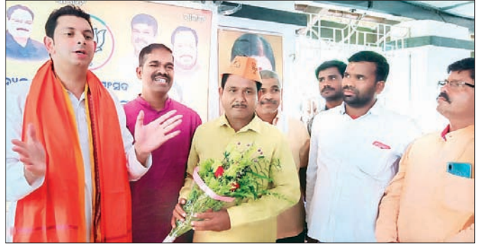
ନୂତନ କର୍ମୀଙ୍କୁ ଦଳରେ ସ୍ୱାଗତ କରାଯାଉଛି।