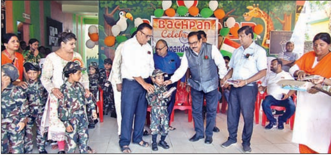
କୃତୀ ଛାତ୍ରଛାତ୍ରୀଙ୍କୁ ପୁରସ୍କୃତ କରାଯାଇଛି।