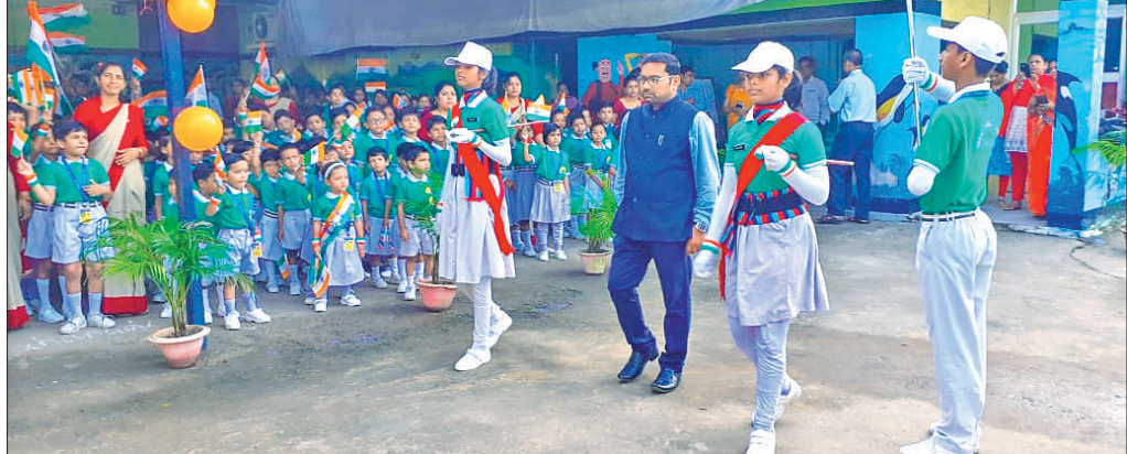
ସାଧାନତା ଦିବସ ପାଳନ ଅବସରରେ ଅତିଥି ଅଭିବାଦନ ଗ୍ରହଣ କରୁଛନ୍ତି।