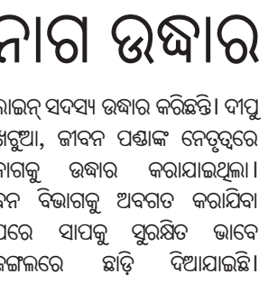
ନାଗକୁ ଉଦ୍ଧାର କରାଯାଇଥିଲା।

ଭାସ୍କର ପଞ୍ଚାୟତ ଅଧୀନ ମହୁଲପୁଣ୍ଡା ଗ୍ରାମର ଅନାମ ଦେହୁରାଙ୍କ ପାଇଖାନାରୁ ରବିବାର ସକାଳେ ଏକ ୬ ଫୁଟିଆ ନାଗସାପକୁ ଟ୍ରେକ୍ ହେଲ୍ ପ ଜଙ୍ଗଲରେ ଛାଡ଼ି ଦିଆଯାଇଛି।