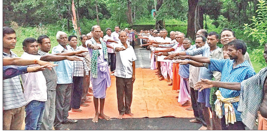
ଗ୍ରାମବାସୀ ବୈଠକରେ କମ୍ପାନୀକୁ ଜମି ନ ଦେବାକୁ ଶପଥ ନେଉଛନ୍ତି।