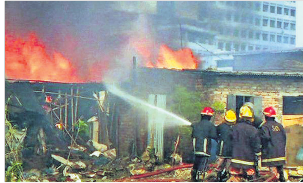
ଅଗ୍ନିଶମ ବାହିନୀ ନିଆଁ ଲିଭାଇଛନ୍ତି।

ଢାକା, ୧୮୮ (ଏସ୍‌ଏସ୍) ବାଂଲାଦେଶ ରାଜଧାନୀ ଢାକାର ଏକ ଜନଗହଳପୂର୍ଣ୍ଣ ବସ୍ତୁରେ ନିଆଁ ଲାଗି ନ ଥିଲେ। ଅଗ୍ନିକାଣ୍ଡରେ କେତେଜଣ ଆହତ ହୋଇଥିବା ଜଣାପଡ଼ିଛି। ବସ୍ତୁର ଅଧିକାଂଶ ଲୋକ ପୋଷାକ ଉର୍ଦ୍ଧ୍ୱ ଲୋକ ବେଘର ହୋଇଛନ୍ତି। ମିରପୁର ବସ୍ତିରେ ପାଖାପାଖି ୨୦୦୦