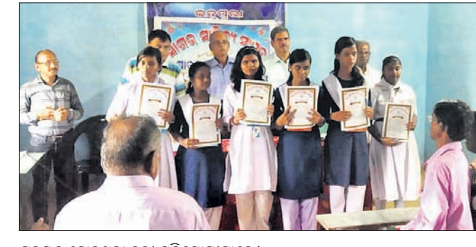
ପୁରସ୍କୃତ ହୋଇଥିବା କୃତୀ ପ୍ରତିଯୋଗୀମାନେ।