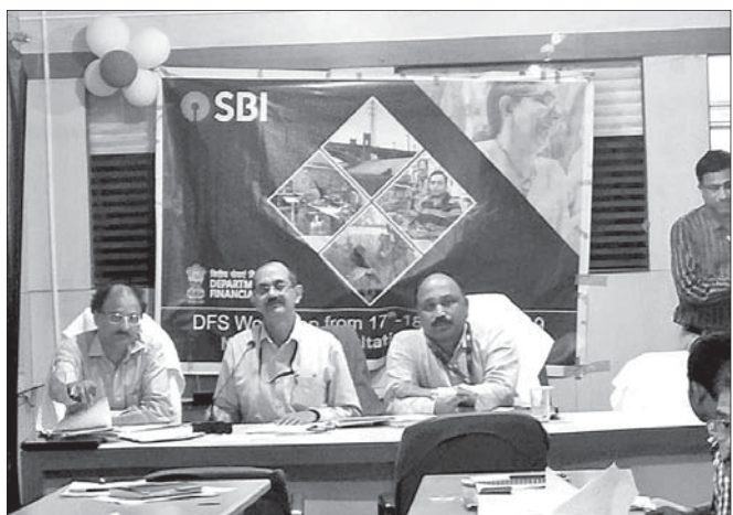
କର୍ମଶାଳାରେ ବ୍ୟାଙ୍କର ଅଧିକାରୀମାନେ। ବ୍ୟାଙ୍କିଙ୍ଗ କ୍ଷେତ୍ରରେ ପ୍ରତିଯୋଗିତାକୁ ଆଖିରେ ରଖି ବ୍ୟାଙ୍କର କାର୍ଯ୍ୟଧାରାରେ ଉନ୍ନତ ଓ ଏହାର ଭବିଷ୍ୟତ ରୂପରେଖ

କ୍ଷେତ୍ର ବ୍ୟାଙ୍କ ପକ୍ଷରୁ ଅନୁଗୋଳ ଆଞ୍ଚଳିକ କାର୍ଯ୍ୟାଳୟ ପରିସରରେ ୧୭ ଓ ୧୮ ତାରିଖ ଦୁଇଦିନିଆ କର୍ମଶାଳା ଅନୁଷ୍ଠିତ ହୋଇଯାଇଛି। ଏଥିରେ ଅନୁଗୋଳ ଓ ତେଜାନାଳରେ ଥିବା ଏହି ବ୍ୟାଙ୍କର ସମସ୍ତ ଶାଖା ପ୍ରବନ୍ଧକମାନେ ଯୋଗ ଦେଇଥିଲେ।