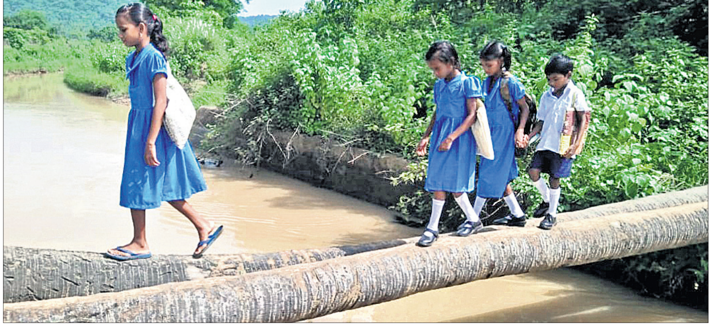
ସମ୍ବଲପୁର ଜିଲ୍ଲା ମାନେଶ୍ୱର ବ୍ଲକ୍ ଦାମଚିକ୍ରାପଡ଼ା ଛାତ୍ରାଛାତ୍ରୀମାନେ କେନାଳ ଉପରେ ପରିଥିବା ତାଳଗଣ୍ଡିରେ ଚଢ଼ି ଯାତାୟତ କରୁଛନ୍ତି।

ମାତୃଭାଷା କରିବା ପାଇଁ ବାଧ୍ୟ ହେଉଛନ୍ତି। ସରକାରଙ୍କ ବ୍ୟବସ୍ଥା ଅନୁଯାୟୀ ବାହାର ରାଜ୍ୟରେ ରହୁଥିବା ଓଡ଼ିଆ ଲୋକଙ୍କ ପିଲାମାନେ ଯଦି ଓଡ଼ିଆ ପାଠପଢ଼ି ନ ଥିଲେ ସେମାନେ ଏଠାରେ ଚାକିରି କରିପାରିବେ ନାହିଁ। ସେଥିପାଇଁ ସରକାରଙ୍କ ତରଫରୁ ଏକ ବ୍ୟବସ୍ଥା ରହିଛି। ବର୍ଷକୁ ଦୁଇ ଥର ଓଡ଼ିଆରେ ଏକ ପରୀକ୍ଷା ସରକାରଙ୍କ ପକ୍ଷରୁ କରାଯାଉଛି। ଏହି ପରୀକ୍ଷାରେ ଯଦି ଛାତ୍ରଛାତ୍ରୀ ପାସ୍ କରନ୍ତି ତେବେ ସେମାନେ ଓଡ଼ିଶାରେ ଚାକିରି କରିପାରିବେ। ମାତ୍ର ବହୁ ପିଲା ଏହି ସମୟ ମଧ୍ୟରେ ଆସି ପରୀକ୍ଷା ଦେବାରେ ବିଫଳ ହେଉଥିବା ଅଭିଯୋଗ ହେଉଛି। ଏହାକୁ ନେଇ ମଧ୍ୟ ବହୁ ପିଲା ଅଭିଯୋଗ କରିଛନ୍ତି। ତେବେ ଏନେଇ ପଦକ୍ଷେପ ମହାପାତ୍ର କହିଛନ୍ତି, ଦିଲ୍ଲୀଠାରେ ଏକ ସେଣ୍ଟର କରାଯିବ। ଓଡ଼ିଆ ଭାଷାରେ ପରୀକ୍ଷା ଦେବା ପାଇଁ ସେଠାକୁ ପିଲାଙ୍କୁ ଓଡ଼ିଶା ଆସିବାକୁ ପଡ଼ୁଛି। ସେମାନେ ଆଗକୁ ସେଠାରେ ଖୋଲାଯିବାକୁ ଥିବା ସେଣ୍ଟରରେ କିପରି ପରୀକ୍ଷା ଦେବେ ସେନେଇ ବ୍ୟବସ୍ଥା କରାଯାଉଛି। ୫ଟି ରାଜ୍ୟରେ ଓଡ଼ିଆ ପାଠପଢ଼ା ଚାଲିଥିବା ବେଳେ ଅନ୍ୟ ରାଜ୍ୟରେ ସରକାରଙ୍କ ତରଫରୁ ବହି ପ୍ରଦାନ କରାଯାଉଛି ବୋଲି ସେ କହିଛନ୍ତି।