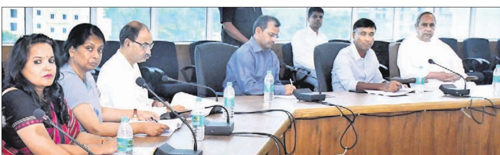
ପୁଞ୍ଜିନିବେଶ ନବୀନ ପଦନାୟକଙ୍କ ଅଧ୍ୟକ୍ଷତାରେ ବସିଥିବା ଏସ୍-ଏଲ୍-ସିଏ ବୈଠକ।

ଭୁବନେଶ୍ୱର, ୧୯୮୮ (ବୁଧବିହାର) ରାଜ୍ୟରେ ୨,୦୪,୦୨୯ କୋଟି ଟଙ୍କାର ପୁଞ୍ଜିନିବେଶ ହେବ। ସୋମବାର ଅପରାହ୍ନରେ ଖାରବେଳ ଭବନଠାରେ ପୁଞ୍ଜିନିବେଶ ନବୀନ ପଦନାୟକଙ୍କ ଅଧ୍ୟକ୍ଷତାରେ ଅନୁଷ୍ଠିତ ରାଜ୍ୟସ୍ତରୀୟ ଉଚ୍ଚ ସମତାସମ୍ପନ୍ନ କ୍ଲିୟରାନ୍ସ ଅଧିବେଶ (ଏସ୍-ଏଲ୍-ସିଏ) ବୈଠକରେ ୫ଟି ପ୍ରକଳ୍ପକୁ ଅନୁମୋଦନ କରାଯାଇଛି। ଏଥିରେ ୨୭,୬୪୫ ନିୟୁତ ସୁଯୋଗ ସୃଷ୍ଟି ହେବ। ପେଟ୍ରୋକେମିକାଲ ଓ ମେଟାଲ ଉଦ୍ଦିଷ୍ଟ ପ୍ରକଳ୍ପଗୁଡ଼ିକରେ ଏହି ପୁଞ୍ଜିନିବେଶ ହେବ। ଜିଲ୍ଲା (ଇଣ୍ଡିଆ) ଲିମିଟେଡ୍ ଯାଜପୁର ଜିଲ୍ଲା କଳିଙ୍ଗନଗରଠାରେ ୦.୫୦ ନିୟୁତ ଟଙ୍କାରେ କୋଲ୍ଡ ରୋଲିଂ କମ୍ପ୍ଲେକ୍ସ ଏବଂ ଷ୍ଟିଲ୍ ପ୍ରୋସେସିଂ ପ୍ଲାଣ୍ଟ ଗ୍ଲାସ୍ ଗ୍ରାହଣ କରିବ। ଏହି ପ୍ଲାଣ୍ଟରେ ଜିଲ୍ଲା ୧୬୭୬ କୋଟି ଟଙ୍କାର ପୁଞ୍ଜିନିବେଶ କରିବାକୁ ଲକ୍ଷ୍ୟଧାର୍ଯ୍ୟ କରିଛି। ପ୍ଲାଣ୍ଟ କାର୍ଯ୍ୟକ୍ରମ ହେଲେ ୧୩୫୫ ନିୟୁତ ସୁଯୋଗ ସୃଷ୍ଟି ହୋଇପାରିବ। ଏହି ପ୍ରକଳ୍ପକୁ ଉଚ୍ଚସ୍ତରୀୟ କ୍ଲିୟରାନ୍ସ ଅଧିବେଶ ବୈଠକରେ ଅନୁମୋଦନ କରାଯାଇଛି। ସେହିପରି ଚାଳଚେର ସାର କାରଖାନା ପକ୍ଷରୁ ଚାଳଚେରଠାରେ ବାର୍ଷିକ ୧୯୯ ନିୟୁତ ଟଙ୍କାରେ ଏକ କୋଲ୍ଡ ରୋଲିଂ ଫାକ୍ଟରୀ ଗ୍ରାହଣ କରାଯିବ। ସେଥିରେ ୧୪,୬୩୨ କୋଟି ଟଙ୍କାର ପୁଞ୍ଜି ନିବେଶ କରାଯିବ। ଏହି କମ୍ପ୍ଲେକ୍ସ କାର୍ଯ୍ୟକାରୀ ହେଲେ ୫୫୦ ଜଣଙ୍କୁ ନିୟୁତ ମିଳିପାରିବ। ପେଟ୍ରୋ କେମିକାଲ କ୍ଷେତ୍ରରେ ମଧ୍ୟ ଓଡ଼ିଶାରେ ବୃହତ୍ ପୁଞ୍ଜିନିବେଶ ହେବାକୁ ଯାଉଛି। ହଳଦିଆ ପେଟ୍ରୋ କେମିକାଲସ ଲିମିଟେଡ୍ ପକ୍ଷରୁ ବାଲେଶ୍ୱର ଜିଲ୍ଲା ସୁବର୍ଣ୍ଣରେଖା ବନ୍ଦର ନିକଟରେ ଟେକ ବିଶୋଧନାଗାର, ଏରୋପାଟିକ୍ସ କମ୍ପ୍ଲେକ୍ସ ଏବଂ ଏଥିଲିନ କ୍ରାକର କମ୍ପ୍ଲେକ୍ସ ନିର୍ମାଣ କରାଯିବ। ଏଥିରେ ୭୮.୨୨୫ କୋଟି ଟଙ୍କାର ପୁଞ୍ଜି ନିବେଶ ହେବ। ଏହି ପ୍ରକଳ୍ପ କାର୍ଯ୍ୟକାରୀ ହେଲେ ୧୦୫୫୫ ନିୟୁତ ସୁଯୋଗ ସୃଷ୍ଟି ହେବ। ପାରାଦୀପ ଟେକ