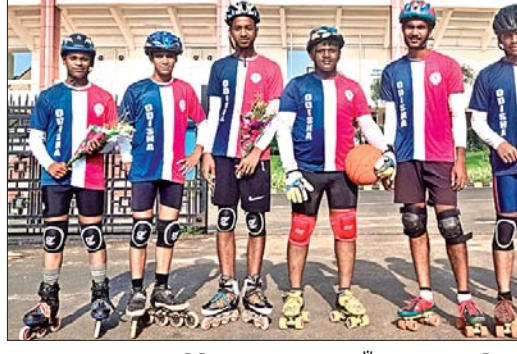
ଜାତୀୟ ସିନସିନାଟି ରୋଲ୍‌ବଲ୍ ପାଇଁ ମନୋନୀତ ଓଡ଼ିଶା ଦଳ