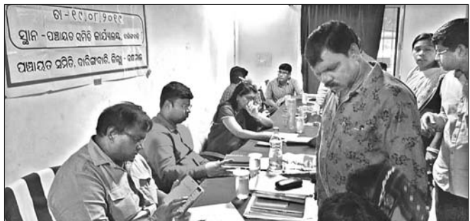
ଅଭିଯୋଗ ଶୁଣାଣିରେ ଉପସ୍ଥିତ ଥିବା ପ୍ରଶାସନିକ ଅଧିକାରୀ।