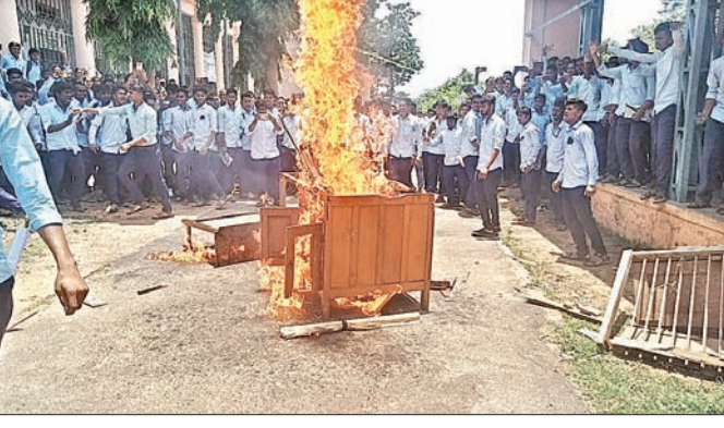
ଛାତ୍ରମାନେ କଲେଜ ସମ୍ମୁଖରେ ନିଆଁ ଜଳାଇ ବିକ୍ଷୋଭ ପ୍ରଦର୍ଶନ କରୁଛନ୍ତି।