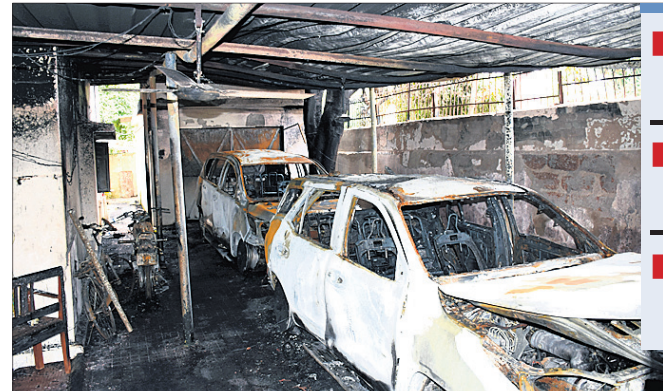
ଗମାଛରେ ପୋଡ଼ିଯାଇଥିବା ଗାଡ଼ି।