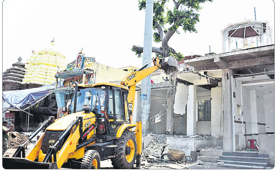
ପୂର୍ବଦ୍ୱାରସ୍ଥିତ ସୂଚନା କେନ୍ଦ୍ରକୁ ଭଙ୍ଗାଯାଇଛି।