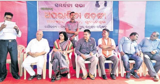
ସମ୍ବନ୍ଧନା ସଭାରେ ଏମ୍‌ପି ଅପରାଜିତା ଷଡ଼ଙ୍ଗା ଓ ପରିଷଦର କର୍ମକର୍ତ୍ତା।