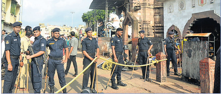
ଉଚ୍ଚେଦ ସମୟରେ ପୁତୟନ ହୋଇଥିବା ସୁରକ୍ଷା କର୍ମୀ।