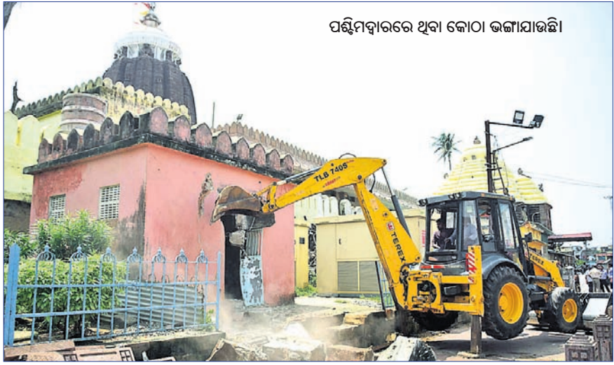
ପଶ୍ଚିମଦ୍ୱାରରେ ଥିବା କୋଠା ଭଙ୍ଗାଯାଇଛି।