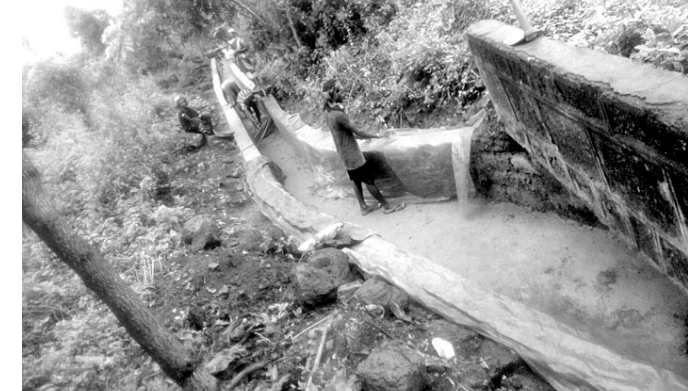
ବର୍ଷାରେ ପ୍ଲାଷ୍ଟର କାମ କରାଯାଉଛି।

ଖୋର୍ଦ୍ଧା ରେଲ ଡିଭିଜନ ଅଧୀନ ନିରାକାରପୁର ଡିଭିଜନ ପଶ୍ଚିମ ପାର୍ଶ୍ୱ କଲୋନୀରୁ ଜଳ ନିଷ୍କାସନ ନିମନ୍ତେ ସମ୍ପୂର୍ଣ୍ଣ ଡ୍ରେନ୍ ନିର୍ମାଣ କାର୍ଯ୍ୟ କରାଯାଉଛି। ତେବେ ରେଲଠାରେ ପକ୍ଷରୁ ପୂର୍ବରୁ ନିର୍ମାଣ କରା ନ ଯାଇ ବର୍ଷା ଲାଗି ରହିଥିବାବେଳେ ସିନେଖ ପ୍ଲାଷ୍ଟର କାର୍ଯ୍ୟ ହେଉଥିବାରୁ ସହାର ଘାୟିତ୍ୱ ନେଇ ସାଧାରଣରେ ପ୍ରଶ୍ନାବତୀ ସୃଷ୍ଟି ହୋଇଛି। ନିୟମ ଅନୁଯାୟୀ, ବର୍ଷାରେ ଏଭଳି ନିର୍ମାଣ କାର୍ଯ୍ୟ ପ୍ରତି ବାରଣ ରହିଥିଲେ ମଧ୍ୟ ଠିକାଦାର ତରଫରୁ ଆ ଭାବେ କାମ ସାରିଦେବା ଘଟଣା ସାଧାରଣରେ ସମ୍ଭବ ସୃଷ୍ଟି କରିଛି। ବର୍ଷାରେ କେହି ତଦାରଖ କରିବାକୁ ମଧ୍ୟ ଆସି ନ ପାରନ୍ତି।