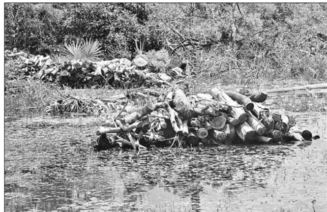
ଭାଙ୍ଗିଯାଇଥିବା ଗଛର କାଠଗୁଡ଼ିକ ବର୍ଷାପାଣିରେ ଭିଜୁଛି।

ବାଲୁଖଣ୍ଡ ଅଭୟାରଣ୍ୟର ସବୁଜିମାକୁ ଭଙ୍ଗାଡ଼ି ଦେଇଥିଲା ବାତ୍ୟା 'ଫନୀ'। ଭାଙ୍ଗି ପକାଇଥିଲା ଲକ୍ଷ ଲକ୍ଷ ମୂଲ୍ୟବାନ ଗଛ। ପରବର୍ତ୍ତୀ ସମୟରେ ବନ ବିଭାଗ ସେହି ଗଛଗୁଡ଼ିକକୁ କାଠ ସଂଗ୍ରହ ପାଇଁ ପ୍ରକ୍ରିୟା ଆରମ୍ଭ କରିଥିଲା। ଏହି କାର୍ଯ୍ୟ ଏବେ ବି ଚାଲିଛି। ବହୁସଂଖ୍ୟାରେ ଶ୍ରମିକଙ୍କୁ ଲଗାଇ କାଠ କଟାଯାଇଛି। ଅଭୟାରଣ୍ୟର ବିଭିନ୍ନ ସ୍ଥାନରେ କାଠକୁ ଗଦା କରି ରଖାଯାଇଛି। ଦୀର୍ଘଦିନ ହେଲାଣି କାଠକୁ ବନ ବିଭାଗ ପୁରୁଣିତ ସ୍ଥାନରେ ନେଇ ନ ରଖିବାରୁ ଏବେ ଏହା ବର୍ଷାପାଣିରେ ଭିଜୁଛି। ଏଥିଯୋଗୁ ଲକ୍ଷ ଲକ୍ଷ ଟଙ୍କାର ମୂଲ୍ୟବାନ କାଠ ନଷ୍ଟ ହେବାରେ ଲାଗିଛି।