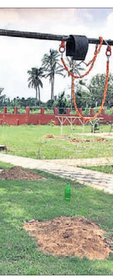
ବିଏସ୍ କଲୋନା ପୋଖରୀପୁର ପାର୍କ।