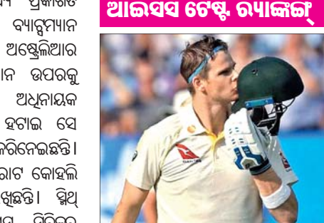
ଆଇସିସି ଚେଷ୍ଟା ର୍ୟାଙ୍କିଂ

୧୯୮୮: ସଦ୍ୟ ପ୍ରକାଶିତ ଆଇସିସି ଚେଷ୍ଟା ବ୍ୟାଟ୍ସମ୍ୟାନ ର୍ୟାଙ୍କିଂ ଚାଲିକାରେ ଅଷ୍ଟ୍ରେଲିଆର ସ୍କିଭ୍ ସ୍ମିଥ ଗୋଟିଏ ସ୍ଥାନ ଉପରକୁ ଉଠିଛନ୍ତି।