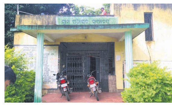
ଦୁର୍ଲଗା ପଞ୍ଚାୟତ କାର୍ଯ୍ୟାଳୟ।

ଝାରସୁଗୁଡ଼ା ଅଫିସ/ଲଖନପୁର, ୧୯।୮ (ଡି.ଏନ୍.ଏ.) ଝାରସୁଗୁଡ଼ା ଜିଲ୍ଲା ଚାକପଡ଼ିଆ ଫାଣ୍ଡି ଅଧୀନ ଦୁର୍ଲଗା ପଞ୍ଚାୟତ କାର୍ଯ୍ୟାଳୟ ଛାତ୍ର ଠେଲି ଯୁବକଙ୍କୁ ହତ୍ୟା କରାଯାଇଛି।