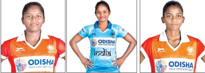
ଜୀବନ କିଶୋରୀ ଚପ୍ପୋ, ନୂଆଦିଲ୍ଲୀ, ୧୯୮୮ (ପି.ଟି.):

ଚଳିତ ବର୍ଷ ଶେଷ ଭାଗରେ ଅଷ୍ଟ୍ରେଲିଆରେ ହେବାକୁ ଥିବା ତ୍ରି-ରାଷ୍ଟ୍ରୀୟ ଭୂମିୟର ମହିଳା ହକି ପ୍ରତିଯୋଗିତା ପାଇଁ ସୋମବାର ୩୩ ଜଣିଆ ସମ୍ଭାଷଣ ଭାରତୀୟ ଦଳ ଘୋଷଣା କରାଯାଇଛି। ହକି ଇଣ୍ଡିଆ ପକ୍ଷରୁ ଘୋଷଣା କରାଯାଇଥିବା ଏହି ୩୩ ଜଣିଆ ଜାତୀୟ ଭୂମିୟର ମହିଳା ହକି ଦଳରେ ଓଡ଼ିଶାରୁ ୩ ଜଣ ଖେଳାଳି ସ୍ଥାନ ପାଇଛନ୍ତି। ସେମାନେ ହେଲେ ମିତ୍ତିଲ୍ଲର ମାରିଆନା କୁଜୁର ଓ ଆଜିମିନ କୁଜୁର