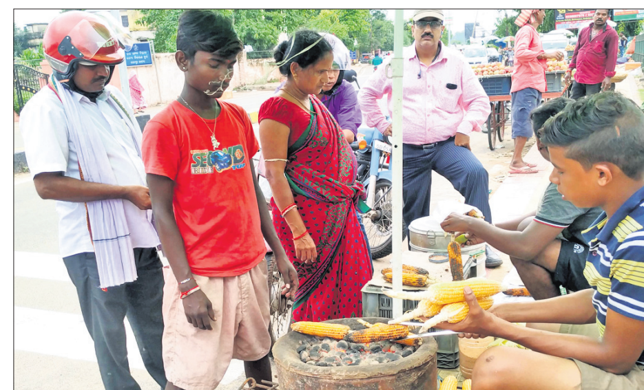
କଟକସ୍ଥିତ ଯୋଡ଼ା ଆନିକଟ୍ ପୁରୁପାଥରେ ଗ୍ରାହକମାନେ ପୋଡ଼ାମାଳା କିଣୁଛନ୍ତି।