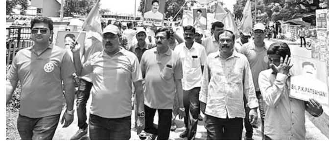
ଶ୍ରମିକ ଯୁନିୟନ ପକ୍ଷରୁ ବାହାରିଥିବା ଶୋଭାଯାତ୍ରା।

ରୁକ୍ମରେ କନିଷ୍ଠା ଯନ୍ତ୍ରାମାନେ ଆସି ପାଇଖାନା ସମ୍ପର୍କରେ ଏକ୍ସପ୍ରେସ୍ କରୁ ନ ଥିବା ଜଣାପଡ଼ିଛି। ହିତାଧିକାରୀଙ୍କ ନାମ ମଧ୍ୟ ଅନଲାଇନରେ ପଞ୍ଜୀକୃତ କରୁ ନାହାନ୍ତି। କନିଷ୍ଠା ଯନ୍ତ୍ରାମାନେ କାର୍ଯ୍ୟରେ ଅବହେଳା କରୁଥିଲେ ମଧ୍ୟ ବିଡିଓ ଟାଙ୍କି ତାରିବ କରୁ ନ ଥିବା ଅଭିଯୋଗ ହେଉଛି। କିନ୍ତୁ ହିତାଧିକାରୀଙ୍କୁ ତାରିବ କରି ପାଇଖାନା ନିର୍ମାଣ କରିବାକୁ ବିଡିଓ କହୁଛନ୍ତି। ଏ ନେଇ ଜଣେ ହିତାଧିକାରୀ ନାମ ଗୋପନ ରଖି କୁହନ୍ତି, ଆବାସ ଯୋଜନାରେ ଭଲ ପିସି ମିଳୁଛି। ପାଇଖାନାରେ ପିସି ନାହିଁ। ପିସି ନ ଥିବାରୁ କନିଷ୍ଠା ଯନ୍ତ୍ରା ଓ ବିଡିଓ ପାଇଖାନା ବିଲ୍ ମଞ୍ଜୁର କରାଇବାରେ ଆଗ୍ରହ ପ୍ରକାଶ କରୁ ନାହାନ୍ତି। ସମ୍ପୂର୍ଣ୍ଣ ଲୋଡ଼ ହୋଇନି କହି ବିଡିଓ ହିତାଧିକାରୀଙ୍କୁ କାର୍ଯ୍ୟାଳୟକୁ ଦିଆଯାଉଛି। ଏ ସମ୍ପର୍କରେ ବିଡିଓ ପ୍ରଶ୍ନ କରୁଥିବା ନାୟକ କୁହନ୍ତି, ଖୁବ୍ ସାମାନ୍ୟ ଆମେ ପାଇଖାନା ଟଙ୍କା କିପରି ହିତାଧିକାରୀ ପାଇବେ ତା'ର ବ୍ୟବସ୍ଥା କରିବୁ। ସମ୍ପୂର୍ଣ୍ଣ ଲୋଡ଼ ହୋଇ ନ ଥିବାରୁ ଅବ୍ୟବସ୍ଥା ହେଉଛି। ସମ୍ପୂର୍ଣ୍ଣ କ୍ରିଏଟିଭ୍ କରିବା ପାଇଁ କନିଷ୍ଠା ଯନ୍ତ୍ରାମାନଙ୍କୁ ନିର୍ଦ୍ଦେଶ ଦିଆଯାଇଛି।