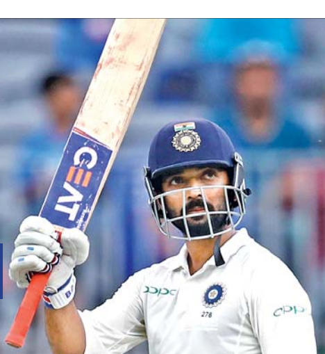
ଅଭ୍ୟାସ ମ୍ୟାଚ୍ ତ୍ରୁ

ଆଖିରୁଆ, ୧୯୮୮ ହାନୁମା କୁଳିକ କ୍ରିକେଟ ଗ୍ରାଉଣ୍ଡରେ ଯୋଗଦାନ ଶେଷ ହୋଇଥିବା ଭାରତ-ଓଷ୍ଟ୍ରେଲିଆ ଖେଳରେ 'ଏ' ଦିନିକିଆ ଅଭ୍ୟାସ ମ୍ୟାଚ୍ ଅମାମ୍ବିତ ଭାବେ ଶେଷ ହୋଇଛି।