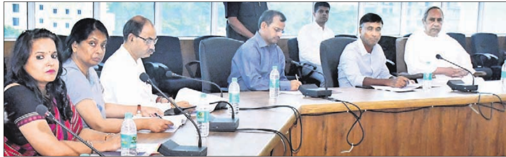
ପୁଞ୍ଜିମନ୍ତ୍ରୀ ନବୀନ ପଟ୍ଟନାୟକଙ୍କ ଅଧ୍ୟକ୍ଷତାରେ ବସିଥିବା ଏନ୍ଏଭିଏ ବୈଠକ।

ରାଜ୍ୟରେ ୨,୦୪,୦୨୯ କୋଟି ଟଙ୍କାର ପୁଞ୍ଜିନିବେଶ ହେବ। ସୋମବାର ଅପରାହ୍ନରେ ଖାରବେଳ ଭବନଠାରେ ପୁଞ୍ଜିମନ୍ତ୍ରୀ ନବୀନ ପଟ୍ଟନାୟକଙ୍କ ଅଧ୍ୟକ୍ଷତାରେ ଅନୁଷ୍ଠିତ ରାଜ୍ୟସ୍ତରୀୟ ଉଚ୍ଚ ସମତାସମ୍ପନ୍ନ କ୍ରିୟାରୁ ଅଧିକାଂଶ (ଏନ୍ଏଭିଏ)ବୈଠକରେ ୪ଟି ପ୍ରକଳ୍ପକୁ ଅନୁମୋଦନ କରାଯାଇଛି। ଏଥିରେ ୨୭,୬୪୫ ନିୟୁତ ସୁଯୋଗ ସୃଷ୍ଟି ହେବ। ଯେତେବେଳେକି କୋଲ ଓ ମେଟାଲ ଭାବନଷ୍ଟ୍ରୀମ ପ୍ରକଳ୍ପକୁ ଅଧିକ କରାଯିବ। ଏହି ପୁଞ୍ଜିନିବେଶ ହେବ।