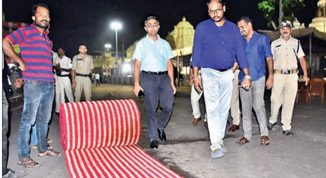
ଶ୍ରୀମନ୍ଦିର ଚଳାପଥରେ ପଡ଼ିବା ପାଇଁ ଆସିଥିବା କାପେଟରୁ ପୁରୀ ଜିଲାପାଳ ଓ ଏସ୍ପି ଅନୁଧ୍ୟାନ କରୁଛନ୍ତି।