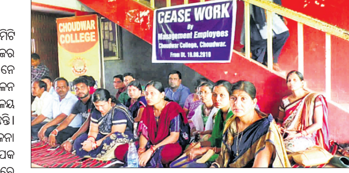
ଧାରଣାରେ ବସିଥିବା ଅଧ୍ୟାପିକା ଅଧ୍ୟାପକ ଓ କର୍ମଚାରୀ।

ବିଭିନ୍ନ ଦାବି ନେଇ ପରିଚାଳନା କମିଟି ଦ୍ୱାରା ନିୟୁତ୍ତିପ୍ରାପ୍ତ ଚୌଦ୍ୱାର କଲେଜର ଅଧ୍ୟାପିକା ଅଧ୍ୟାପକ ଓ କର୍ମଚାରୀମାନେ ଆନ୍ଦୋଳନ କରୁଛନ୍ତି।