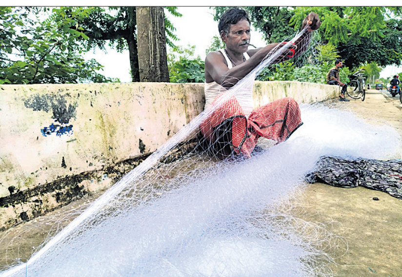
କଟକ ମାତାମଠା ରିଂବନ୍ଦ ରାସ୍ତା ପୁରୁପାଥରେ ଜଣେ ବ୍ୟକ୍ତି ମାଛ ଧରା କାଳ ବୁଝୁଛନ୍ତି।