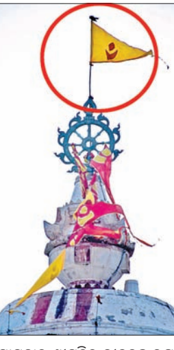
ସୋମବାର ଶ୍ରୀମନ୍ଦିର ନୀଳକଣ୍ଠ ଉପରେ ଏକ ଚିଲ ବସିଥିବାର ଦୃଶ୍ୟ।