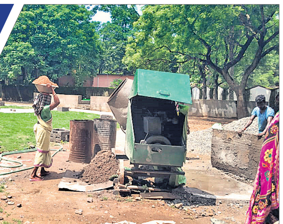
କରାଯାଇଥିବା ପାର୍କର କାର୍ଯ୍ୟ କେଉଁଠି ୫ ପ୍ରତିଶତ ତ ଆଉ କେଉଁଠି ୧୦ ପ୍ରତିଶତରେ ଅଧିକ ରହିଛି।