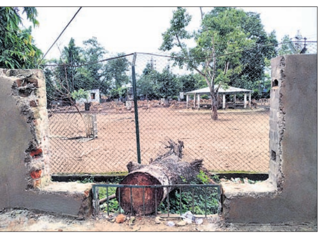
ମଧ୍ୟସ୍ତର ନଗରରେ ଦ୍ୱିତୀୟ ହରିଶ ପାର୍କ ପାଟେର ଭାଙ୍ଗିଯାଇଛି।

କଟକ ଅଫିସ, ୧୯୮୮: କଟକରେ ହେବାକୁ ଥିବା ଦ୍ୱିତୀୟ ହରିଶପାର୍କ ନେଇ ଏବେ ଅନିଶ୍ଚିତତା ଦେଖାଦେଇଛି। କଟକ ମହାନଗର ନିଗମ(ସିଏମ୍‌ସି) ଅନ୍ତର୍ଗତ ଚୁକାପାପୁର ମଧ୍ୟସ୍ତର ନଗରଠାରେ ଏକ ହରିଶ ପାର୍କ ରହିଛି।