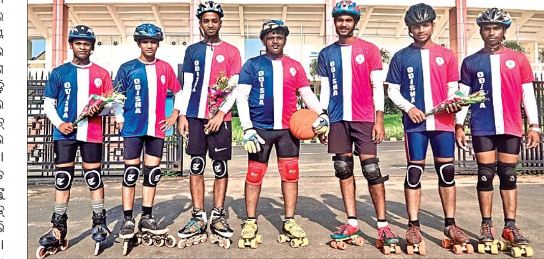
ଜାତୀୟ ଭୂମିୟର ରୋଲ୍ ବଲ୍ ପାଇଁ ମନୋନୀତ ଓଡ଼ିଶା ଦଳ।

ଭୁବନେଶ୍ୱର, ୧୯୮୮ (ଗ୍ରୀଡ଼ା ପ୍ରତିନିଧି): ରୁଜରାଟର ସୁରତଠାରେ ୧୬ତମ ଜାତୀୟ ଭୂମିୟର ରୋଲ୍ ବଲ୍ ଚାମ୍ପିୟନଶିପ୍ ଚଳିତମାସ ୨୧ରୁ ୨୪ ପର୍ଯ୍ୟନ୍ତ ଅନୁଷ୍ଠିତ ହେବ। ଏଥିପାଇଁ ଓଡ଼ିଶା ରୋଲ୍ ବଲ୍ ଆସୋସିଏସନ (ଓଆରବିଏ) ପକ୍ଷରୁ ସୋମବାର ଓଡ଼ିଶା (ପୁରୁଷ) ଦଳ ଘୋଷଣା କରାଯାଇଛି। ଏଥିରେ ରାଜ୍ୟର ବିଭିନ୍ନ ଜିଲ୍ଲାର ଖେଳାଳିମାନେ ସ୍ଥାନ ପାଇଛନ୍ତି। ମନୋନୀତ ଖେଳାଳିମାନଙ୍କୁ ପୂର୍ବହରେ କଳିଙ୍ଗ ଷ୍ଟାଡ଼ିୟମରେ ସମ୍ବର୍ଦ୍ଧିତ