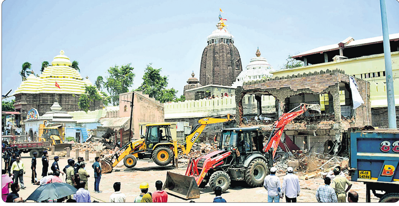
ସୋମବାର ଶ୍ରୀମନ୍ଦିର ଦକ୍ଷିଣଦ୍ୱାର ନିକଟରେ ଥିବା ଶୈଳାଳୟ ଓ ଷ୍ଟୋରରୁମକୁ କେସିବି ସାହାଯ୍ୟରେ ଭଙ୍ଗାଯାଇଛି।