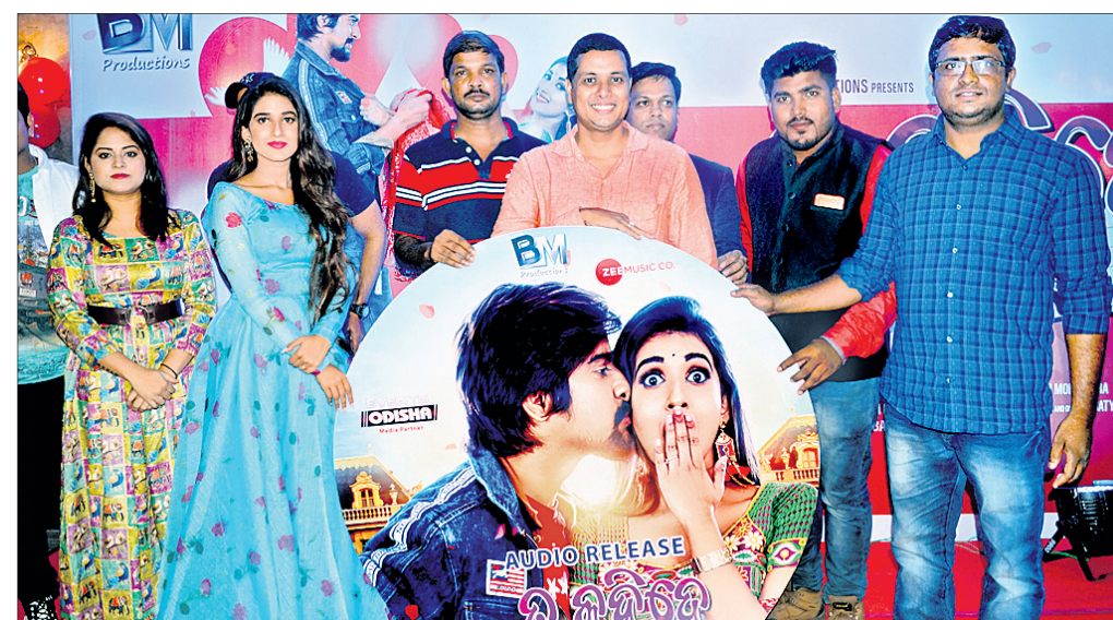
ଭୁବନେଶ୍ୱର ଏକ ହୋଟେଲରେ ଆୟୋଜିତ କାର୍ଯ୍ୟକ୍ରମରେ ଓଡ଼ିଆ ଚଳଚ୍ଚିତ୍ର 'ତୁ କହିବେ ଆଇ ଲଭ୍ ୟୁ'ର ଅତି ଶିତି ଉନ୍ମୋଚନ କରାଯାଇଛି।