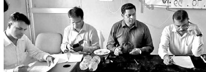
କନଶ୍ଚିଶାଣି ଶିବିରରେ ଜିଲାପାଳ ଓ ଅନ୍ୟମାନେ।