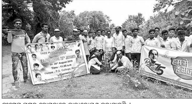
କଂଗ୍ରେସ ପକ୍ଷରୁ କୋମନାରେ ଚାରାରୋପଣ କରାଯାଇଛି।