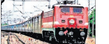
ଭୁବନେଶ୍ୱର, ୨୦-୮ (ବ୍ୟୁରୋ)