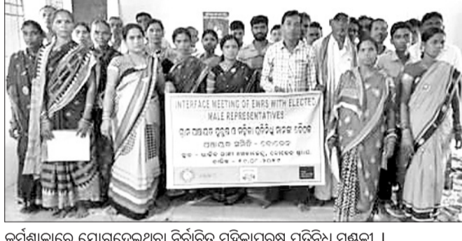
କର୍ମାମୁଖାରେ ଯୋଗଦେଇଥିବା ନିର୍ବାଚିତ ମହିଳାପୁରୁଷ ପ୍ରତିନିଧି ମଣ୍ଡଳ।