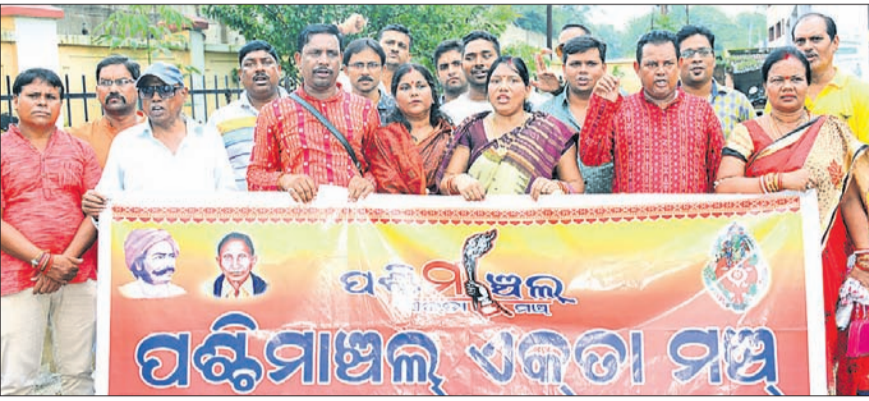
ସମ୍ବଲପୁର ପଶ୍ଚିମାଞ୍ଚଳ ଏକତାମଞ୍ଚ ପକ୍ଷରୁ ବିରୋଧ ଓ ରାଲି।