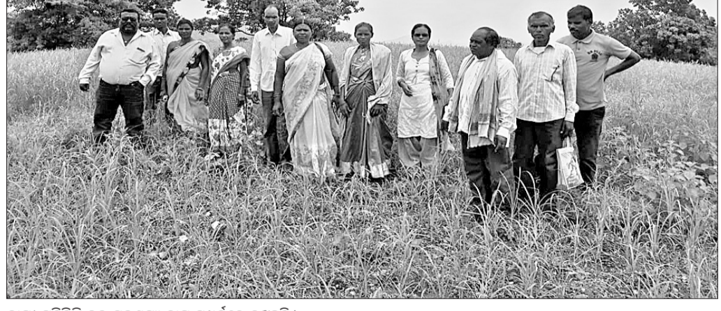
ଚାଷୀ ପ୍ରତିନିଧି ଦଳ କ୍ଷୁଦ୍ରଶସ୍ୟ ଚାଷ ସମ୍ପର୍କରେ ବୁଝୁଛନ୍ତି।