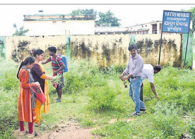
ସୋନପୁର କେଳିକେ ପକ୍ଷରୁ ସହରର ଯାତ୍ରା ନିବାସ ନିକଟରେ ଗାଈର ଘାସକୁ ମାରିବା ପାଇଁ ଶ୍ରେଣୀକରାଯାଇଛି।

ସୋନପୁର, ୨୦୧୮ (ନି.ପ୍.) ଗାଈର ଘାସ। ଜୀବନକୁ ପାଇଁ ବିଷାକ୍ତ ସବୁଜ ଏହି ଘାସ ଏବେ ସୁବର୍ଣ୍ଣପୁର ସହରରେ ବ୍ୟାପି ଗଲାଣି।