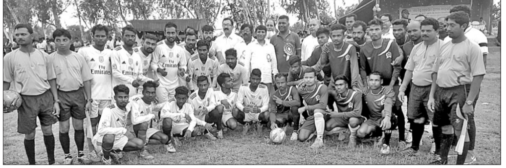
ଫୁଟବଲ ଟୁର୍ନାମେଣ୍ଟର ଉଦ୍ଘାଟନୀରେ ଅତିଥିଙ୍କ ସହ ଖେଳାଳି।

ବାଲିଶଙ୍କରା ବ୍ଲକ୍ ରୁମ୍‌ଲିଆ ପଞ୍ଚାୟତର ଏସଏନଟି ସ୍ଵାଂ ଏବଂ କଳଚରାଳ ଆସୋସିଏସର୍ ରୁମ୍‌ଲିଆ ଆନୁକୂଲ୍ୟରେ ଗତ ୧୬ ରୁ ଚାଲିଥିବା ବିକ୍ଟ ପଟ୍ଟନାୟକ ଫୁଟବଲ ଟୁର୍ନାମେଣ୍ଟ ଉତ୍ସବର ଉଦ୍ଘାଟିତ ହୋଇଯାଇଛି। ସର୍ବମୋଟ ୧୮ଟି ଦଳ ଅଂଶ ଗ୍ରହଣ କରିଥିବା ବେଳେ ପାଇନାଲ ମ୍ୟାଚ ସମ୍ବଲପୁର ଜିଲ୍ଲାର କେସେଇବାହାଳ ଓ ଜିଏଫ୍ସି କିଞ୍ଚିରକେଲା ଉତ୍ସବ ମଧ୍ୟରେ ସଂଘର୍ଷପୂର୍ଣ୍ଣ ମ୍ୟାଚ ହୋଇଥିଲା। ଏଥିରେ କିଞ୍ଚିରକେଲା ଉତ୍ସବ ୧ ଗୋଲରେ ଚାମ୍ପିୟନ ହୋଇଥିଲେ। ଚାମ୍ପିୟନ ଦଳକୁ ୧୫ ହଜାର ଓ ଟ୍ରଫି, ରତ୍ନର୍ଥ ଅର୍ପଣ କେସେଇବାହାଳକୁ ୧୦ ହଜାର ଟଙ୍କା ସହ ଟ୍ରଫି ଅର୍ପଣ ଦ୍ଵାରା ପ୍ରଦାନ କରାଯାଇଥିଲା। ଏହି ଅବସରରେ ପୁଞ୍ଜାଅତିଥି ଭାବେ ସୁନ୍ଦରଗଡ଼ ଜିଲ୍ଲା ସ୍ଵତନ୍ତ୍ର ବିକାଶ ପରିଷଦ