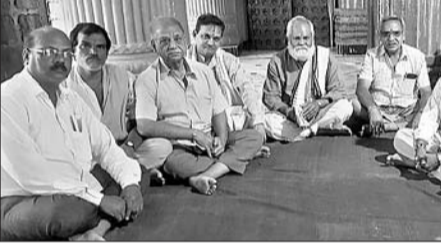
ନୂଆଖାଇ ଲଗ୍ନ ଧାର୍ଯ୍ୟ ନିମନ୍ତେ ବ୍ରାହ୍ମଣ ସମାଜ ଉପସ୍ଥିତ।