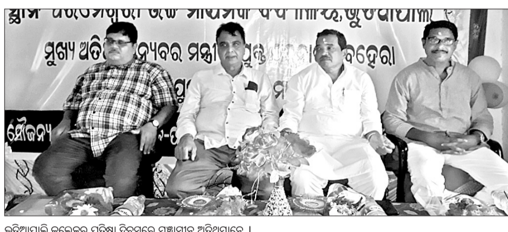
ଭୂତିଆପାଲି କଲେଜର ପ୍ରତିଷ୍ଠା ଦିବସରେ ମଞ୍ଚାଧୀନ ଅତିଥିମାନେ।

ଅଞ୍ଚଳର ବିକାଶରେ ଶିକ୍ଷା ଉପରେ ଗୁରୁତ୍ୱପୂର୍ଣ୍ଣ। ଶିକ୍ଷା ପାଇଁ ଶିକ୍ଷାନୁଷ୍ଠାନର ଆବଶ୍ୟକତା ରହିଛି।