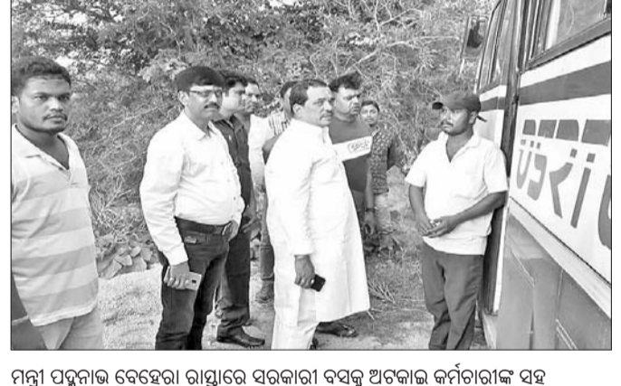
ମନ୍ତ୍ରୀ ପଦ୍ମନାଭ ବେହେରା ରାସ୍ତାରେ ସରକାରୀ ବସକୁ ଅଟକାଇ କର୍ମଚାରୀଙ୍କ ସହ ଆଲୋଚନା କରୁଛନ୍ତି।

ସରକାରୀ ବସକୁ ରାସ୍ତାରେ ଅଟକାଇଲେ ମନ୍ତ୍ରୀ। ମଙ୍ଗଳବାର ସନ୍ଧ୍ୟାରେ ବାଣିଜ୍ୟ ପରିବହନ ଏବଂ ଯୋଜନା ଓ ସଂଯୋଜନାମନ୍ତ୍ରୀ ପଦ୍ମନାଭ ବେହେରା ବାରମହାରାଜପୁର-ପୁରୁଷୋତ୍ତମ ରାସ୍ତାରେ ଯାଉଥିବା ସରକାରୀ ବସକୁ ଅଟକାଇଥିଲେ।