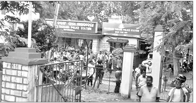
ଲୋକେ ଧାନ ଘେରାଇ କରୁଛନ୍ତି।

ରେକ୍ଟିଫିକେସନ କରାଯାଇଥିଲା। ଏହା ଜଣାପଡ଼ିବା ପରେ କେତେକ ତାଲିକାରେ ଗତବର୍ଷ ଜୁନ ୧୩ ତାରିଖ ଭୁବନେଶ୍ଵର ରେକ୍ଟିଫିକେସନ ଲିଖିତ ଅଭିଯୋଗ ପଠାଇଥିଲେ। ଲ୍ୟାଣ୍ଡ୍ରେ ସାର ହେଉଥିବା ଓ ଜିଲ୍ଲା ବାହାର ଜମି ପତ୍ତାରେ ଧାନ କିଣା ଉପରେ ରେକ୍ଟିଫିକେସନରେ ଅଭିଯୋଗ ହେଲାପରେ ସେ ତାଙ୍କ ଚିଠି ନଂ. ୧୫୪୮୮/୯/୮/୨୦୧୮ରେ ୭ ଦିନ ମଧ୍ୟରେ ତଦନ୍ତ କରି ରିପୋର୍ଟ ଦେବାକୁ ସୁନ୍ଦରଗଡ଼ ଡିଆରଙ୍କୁ ନିର୍ଦ୍ଦେଶ ଦେଇଥିଲେ। ଡିଆର ଚିଠି ନଂ. ୨୧୭୧ରେ ଏଆରଙ୍କୁ ୫ ଦିନ ମଧ୍ୟରେ ତଦନ୍ତ କରି ରିପୋର୍ଟ ଦେବାକୁ ନିର୍ଦ୍ଦେଶ ଦେଇଥିଲେ। ଏଆର ଏସ୍ଏଆରସିଏସ୍ଙ୍କୁ ତଦନ୍ତ ନିର୍ଦ୍ଦେଶ ଦେଇଥିଲେ। ଏହା ଉପରେ ତଦନ୍ତ କରି ରିପୋର୍ଟ ଦେବା ବଦଳରେ ଘଟଣାକୁ ଚାପି ଦିଆଯାଇଥିବାରୁ ଶେଷ ବିଚିରଣ ପରେ ମଧ୍ୟ କାହାରି ତିରା ନାହିଁ। ଉଚ୍ଚ ଅଧିକାରୀ ୭ ଦିନ ମଧ୍ୟରେ ତଦନ୍ତ ରିପୋର୍ଟ ମାରିଥିଲେ ମଧ୍ୟ