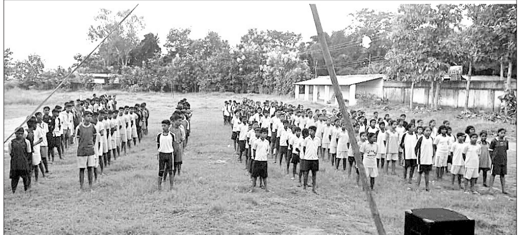
ଶାରଦୀୟ କ୍ରୀଡ଼ା ପ୍ରତିଯୋଗିତାରେ ଅଂଶଗ୍ରହଣ କରିଥିବା ଛାତ୍ରଛାତ୍ରୀମାନେ।

ସୁବର୍ଣ୍ଣପୁର ଜିଲ୍ଲା ବିନିକା ବ୍ଲକ୍ ସେଲେକ୍ଟି ଉଚ୍ଚ ବିଦ୍ୟାଳୟରେ ମଙ୍ଗଳବାର ଶାରଦୀୟ କ୍ରୀଡ଼ା ପ୍ରତିଯୋଗିତା ଆରମ୍ଭ ହୋଇଯାଇଛି।