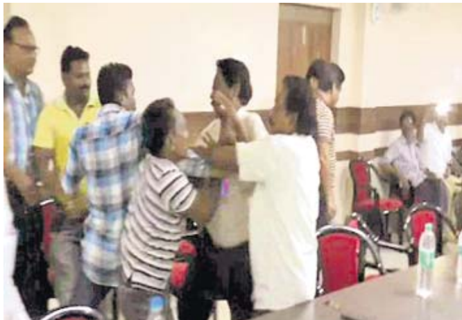
ବୈଠକରେ ଅଧିକାରୀ ଓ ଶ୍ରାଧର ହାତାହାତି ହେଉଛନ୍ତି।

ପ୍ରକାଶ ଯେ, ଗତ ଅକ୍ଟୋବର ୧୫ରେ ପଞ୍ଚାୟତ ସମିତି ବୈଠକ ହେବାର ଦୀର୍ଘ ୧୦ ମାସ ବ୍ୟବଧାନ ପରେ ରୁଧିବାର ପୁଣିଥରେ ବୈଠକ ଡକାଯାଇଥିଲା।