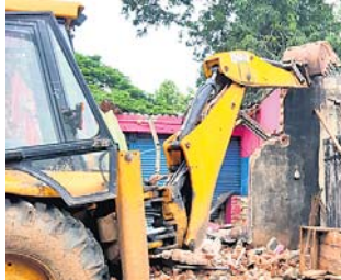
କବରଦଖଲ ଉଚ୍ଛେଦ କରାଯାଇଛି।

ଜିଲ୍ଲା ପରିଷଦ ସଭ୍ୟ ମାତ୍ର ମାରିଥିବା ନେଇ ଆନାରେ ଏତଲା ଦେଲେ ସମିତି ସଭ୍ୟ