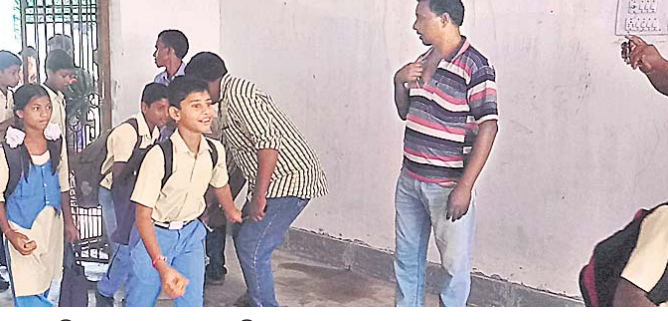
ପିଲାମାନେ ସ୍କୁଲ ଯାଉଛନ୍ତି।

ଯାଇଥିଲା। କିନ୍ତୁ ତାର କିଛି ମାସ ପରେ ଉଚ୍ଚ ନ୍ୟାୟାଳୟ ଜିଲ୍ଲା ପ୍ରଶାସନ ସଂସଦରେ ଆଦର୍ଶ ଦେଇଥିଲେ। ଭାଇଲି ଠାରେ ହିଁ ବିଦ୍ୟାଳୟ ଗଠନ ହେବ ବୋଲି ନ୍ୟାୟାଳୟ ନିର୍ଦ୍ଦେଶ ଦେଇଥିଲେ।