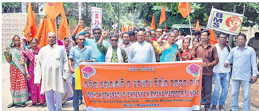
ଭାରତୀୟ ମଜଦୁର ସଂଘ ପକ୍ଷରୁ ବାହାରି ଥିବା ଶୋଭାଯାତ୍ରା।

୧୦ ଦିନ ଧରିରେ ସହକାରୀ ଶ୍ରମ ଅଧିକାରୀଙ୍କୁ ମଜଦୁର ସଂଘର ଦାବିପତ୍ର