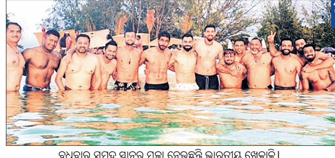
ରୁଧିରୀର ସମୁଦ୍ର ସ୍ନାନ ମନା ନେଇଛନ୍ତି ଭାରତୀୟ ଖେଳାଳି।

ଅପରପକ୍ଷରେ ଫ୍ରେଣ୍ଡ୍‌ସ୍‌ଫର ଟେଷ୍ଟ ଫର୍ମାରେ ଗତ କିଛି ବର୍ଷ ମଧ୍ୟରେ ଉତ୍ତମେ ଖେଳିବା ସମ୍ଭାବନା ରହିଛି।