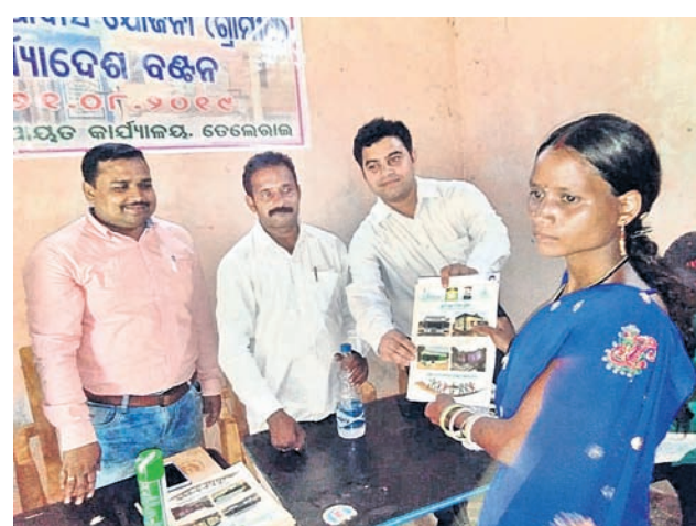
ଜଣେ ହିତାଧିକାରୀଙ୍କୁ କାର୍ଯ୍ୟାଦେଶ ପ୍ରଦାନ କରାଯାଇଛି ।

ମାଲକାନଗିରି ଜିଲ୍ଲା କାଲିମେଳା ବ୍ଲକ୍ ଅନ୍ତର୍ଗତ ତେଲଗାଲ ପଞ୍ଚାୟତରେ ଚୁଧାବାର ୨୦୧୯-୨୦ ବର୍ଷର ପ୍ରଧାନମନ୍ତ୍ରୀ ଆବାସ ଯୋଜନା କାର୍ଯ୍ୟାଦେଶ ବନ୍ଧନ କରାଯାଇଛି । ପଞ୍ଚାୟତ ଅଧୀନରେ ଥିବା ସମସ୍ତ ଗ୍ରାମକୁ ପ୍ରାୟ ୮୯ ଜଣ ହିତାଧିକାରୀ ଘର ପାଇବା ପାଇଁ ସେମାନଙ୍କ ମଧ୍ୟରୁ ପ୍ରଥମ ପର୍ଯ୍ୟାୟରେ ଚୁଧାବାର ୪୨ ଜଣ ହିତାଧିକାରୀଙ୍କୁ ଗୃହ ନିର୍ମାଣ ପାଇଁ କାର୍ଯ୍ୟାଦେଶ ପ୍ରଦାନ କରାଯାଇଛି । ଏହି କାର୍ଯ୍ୟକ୍ରମରେ କାଲିମେଳା ବ୍ଲକ୍ ଅଧ୍ୟକ୍ଷ ମାଲୀ ମାଝି ପୁଷ୍ପାଧିପତି ଭାବେ ଯୋଗଦେଇ ହିତାଧିକାରୀଙ୍କୁ କାର୍ଯ୍ୟାଦେଶ