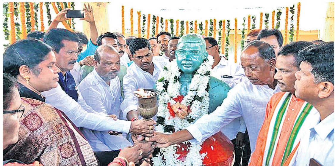
ଶହୀଦ ମଶାଇକୁ ପୁଷ୍ପଅର୍ପଣ କରାଯାଇଛି ।