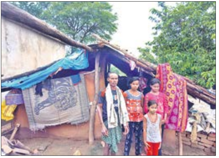
ନିଜର କୁଡିଆ ଆସେ ପରିବାର ସଂଗେ ଜନ୍ମରାମ।

କେନ୍ଦ୍ର ଆର ରାଧିକ୍ ସରକାର ଗରିବ ରୁଖି ବାସହାନ ପରିବାରମାନଙ୍କୁ ଭିତେ ଭିତେ ଯୋଜନାରେ ପକାଘର ଯୁଗେଇ ଦେଉଛନ୍ତି। ହେଲେ ଅନେକ କାରଣରୁ ହକ୍ଦାର ହେତୁକାରୀ ଯୋଜନାର ପୁଫଳ ପାଏବାକୁ ବର୍ତ୍ତିତ ହେଉଛନ୍ତି। ଏନ୍ତା ଗୁଡେ ଉଦାହରଣ ଦେଖିବାକେ ମିଲିଛେ ବଲାଙ୍ଗୀର ଜିଲ୍ଲା ଲାଠୋର ପର୍ଚେର୍ ଚଳିପଡ଼ାରେ।