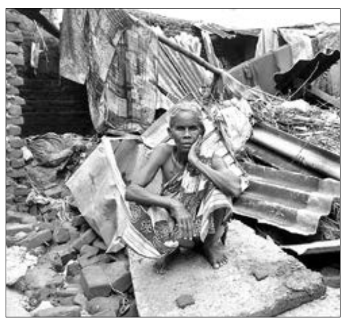
ବଲାଙ୍ଗୀର ସହରର ମେଘନାଥପଡ଼ାର ପୁରସର ମାଝି ଓ ଗାଙ୍ଗ ସ୍ତ୍ରୀ ବନ୍ୟାରେ ଭାସି ଯାଇଥିବା ଭଙ୍ଗା ଘରକୁ ସମାବୁଛନ୍ତି (ବାମ)। ବଲାଙ୍ଗୀର ସହରର ସତ୍ୟନାରାୟଣପଡ଼ାର ଅନୁବାସୀ ଗାତକ ଘର ବନ୍ୟାରେ ସମ୍ପୂର୍ଣ୍ଣ ଭାଙ୍ଗି ଯାଇଥିବା ବେଳେ ଅଶ୍ରୁସମ୍ପାଦକ ଖୋଲୁଛନ୍ତି। (ସୁମାଲ)