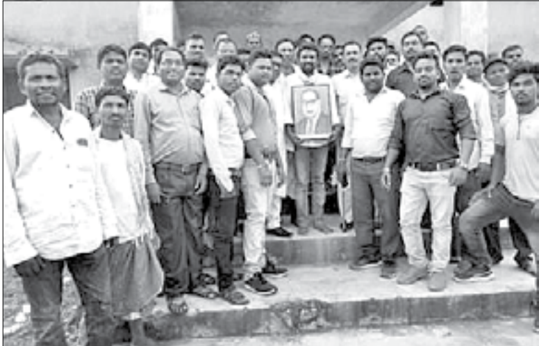
ଦଳିତ ଅଧିକାର ମଞ୍ଚ ବୈଠକରେ ଯୋଗଦେଇଥିବା କର୍ମକର୍ତ୍ତା।