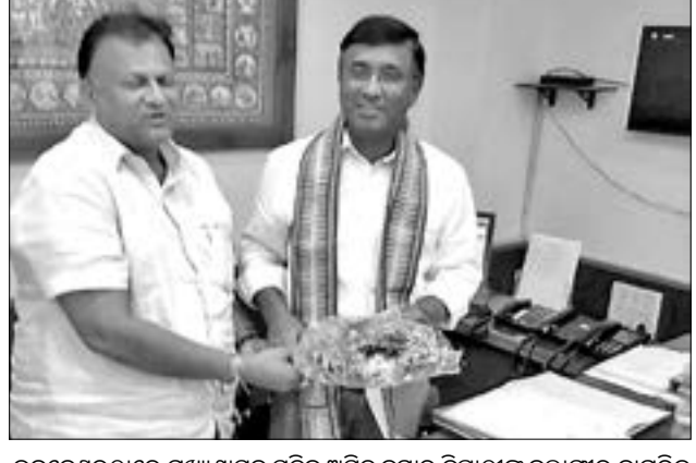
ଭୁବନେଶ୍ଵରଠାରେ ମୁଖ୍ୟଶାସନ ସଚିବ ଅଧିକାରୀଙ୍କୁ ବଲାଙ୍ଗୀର ନାଗରିକ କମିଟି ସାଧାରଣ ସମ୍ପାଦକ ଶୁଭେଚ୍ଛା କରାଯାଇଛି ।

ବଲାଙ୍ଗୀର ଅଧିକାରୀ, ୨୧।୮ ବୌରବ ଆଶିଷ୍ଟି ବୋଲି କହିଥିଲେ । ସାଧାରଣ ସମ୍ପାଦକ କେଟିଆ କିଛିଦିନ ତଳେ ବଲାଙ୍ଗୀର ଜିଲ୍ଲାରେ ଦେଖାଦେଇଥିବା ପ୍ରକୟକରୀ ବନ୍ୟା ଚଳାନ୍ତ ସମ୍ପର୍କରେ ଆଲୋଚନା କରି ବନ୍ୟା ପୀଡ଼ିତ ଲୋକଙ୍କ ପାଇଁ ଏସମ୍ପା ଓ ବନ୍ୟା ଜଳରେ ଉକ୍ତ ଯାଇଥିବା ଜିଲାର ଭିତ୍ତିଭୂମି ସଂରଚନା ଉପରେ ଆଲୋଚନା କରିଥିଲେ । ଆଗାମୀ ଦିନରେ ବଲାଙ୍ଗୀର ଜିଲ୍ଲା ଗସ୍ତରେ ଆସିବାକୁ ଆମନ୍ତ୍ରଣ କରାଯାଇଛି ।