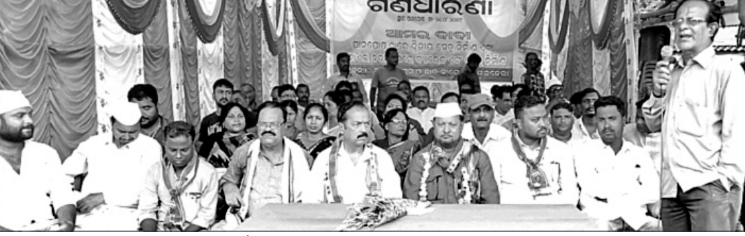
ବ୍ରାହ୍ମଣୀ ସେତୁ କୋଷ୍ଠାଳୀ ସେତୁ ଓ କୋଷ୍ଠାଳୀ ବ୍ୟାରେଜ୍ ନିର୍ମାଣ ଦାବିରେ କଂଗ୍ରେସ ପକ୍ଷରୁ ଧାରଣା ଦିଆଯାଇଛି।