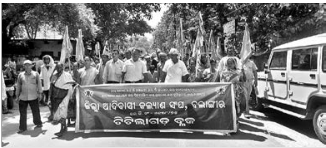
ଆଦିବାସୀ କଲ୍ୟାଣ ସଂଘ ବିକ୍ରାପଡ଼ା ଶାଖା ପକ୍ଷରୁ ରାଜଧାନୀରେ ଧାରଣା ଦିଆଯିବା ସହ ବିକ୍ଷୋଭ ପ୍ରଦର୍ଶନ କରାଯାଇଥିଲା।

ଆଦିବାସୀ କଲ୍ୟାଣ ସଂଘ ବିକ୍ରାପଡ଼ା ଶାଖା ପକ୍ଷରୁ ନିର୍ମାଣ କରାଯାଇଥିବା ଗୃହ ନିର୍ମାଣକୁ ବନ୍ଦ କରିବା ଦାବି ନେଇ ରାଜଧାନୀରେ ଉପକ୍ରମାପାଳଙ୍କ କାର୍ଯ୍ୟାଳୟ ସମ୍ମୁଖରେ ଧାରଣା ଦିଆଯିବା ସହ ବିକ୍ଷୋଭ ପ୍ରଦର୍ଶନ କରାଯାଇଥିଲା। ଆଦିବାସୀ ସଂଘର ଦାବି ମୁତାବକ, ବିକ୍ରାପଡ଼ା ଗୃହ ନିର୍ମାଣକୁ ବନ୍ଦ କରିବା ଦାବି ନେଇ ରାଜଧାନୀରେ ଉପକ୍ରମାପାଳଙ୍କ କାର୍ଯ୍ୟାଳୟ ସମ୍ମୁଖରେ ଧାରଣା ଦିଆଯିବା ସହ ବିକ୍ଷୋଭ ପ୍ରଦର୍ଶନ କରାଯାଇଥିଲା।