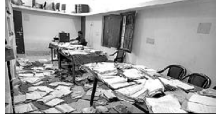
ବଲାଙ୍ଗୀର କ୍ଷୁଦ୍ର ଜଳସେଚନ ଅଫିସ ଭିତରେ ବନ୍ୟା ଜଳରେ ଭିଜି ଯାଇଥିବା ଗୁରୁତ୍ୱପୂର୍ଣ୍ଣ ଫାଇଲକୁ ଶୁଖାଯାଇଛି।

ବଲାଙ୍ଗୀର ସହରରେ ପ୍ରଳୟଜଳ ବନ୍ୟାରେ ଲୋକଙ୍କ ଘର ସହ ବିଭିନ୍ନ ସରକାରୀ ଅଫିସର ଗୁରୁତ୍ୱପୂର୍ଣ୍ଣ ଫାଇଲ, କମ୍ପ୍ୟୁଟର, ପାଚେରି ଓ ଅନ୍ୟାନ୍ୟ ଜିନିଷପତ୍ର ନଷ୍ଟ ହୋଇଯାଇଛି। ବଲାଙ୍ଗୀର ଉପକ୍ରମାପାଳ କାର୍ଯ୍ୟାଳୟକୁ ଲାଗି ରହିଥିବା କ୍ଷୁଦ୍ର ଜଳସେଚନ ବିଭାଗ (ଏମ୍‌ଆଇପି) ନିର୍ବାହୀ ଯନ୍ତ୍ରାଳୟ କାର୍ଯ୍ୟାଳୟ ବନ୍ୟା ପାଣିରେ ଅଧିକ କ୍ଷତିଗ୍ରସ୍ତ ହୋଇଛି। ୪ ଦିନ ଧରି ବନ୍ୟା ଜଳ ରହିବା ପରେ ଗୁରୁତ୍ୱପୂର୍ଣ୍ଣ ଫାଇଲଗୁଡିକ ଭିଜିଯାଇ ନଷ୍ଟ ହୋଇଯାଇଛି। ଏପରି କି ଅଫିସ ଭିତରେ ବିଶାଳ ସାପ ରହିଥିବା ଜଣାପଡିଛି। ଫଳରେ କର୍ମଚାରୀମାନେ ଭିତରକୁ ସଫା କରିବା ପାଇଁ ଯିବାକୁ ଭୟ କରୁଛନ୍ତି। ଅନ୍ୟପକ୍ଷେ ପ୍ରାୟ ୬ ଦିନ ହେଲା ଅଫିସର ଗୁରୁତ୍ୱପୂର୍ଣ୍ଣ ଫାଇଲଗୁଡିକୁ ଶୁଖାଇବା କାମ