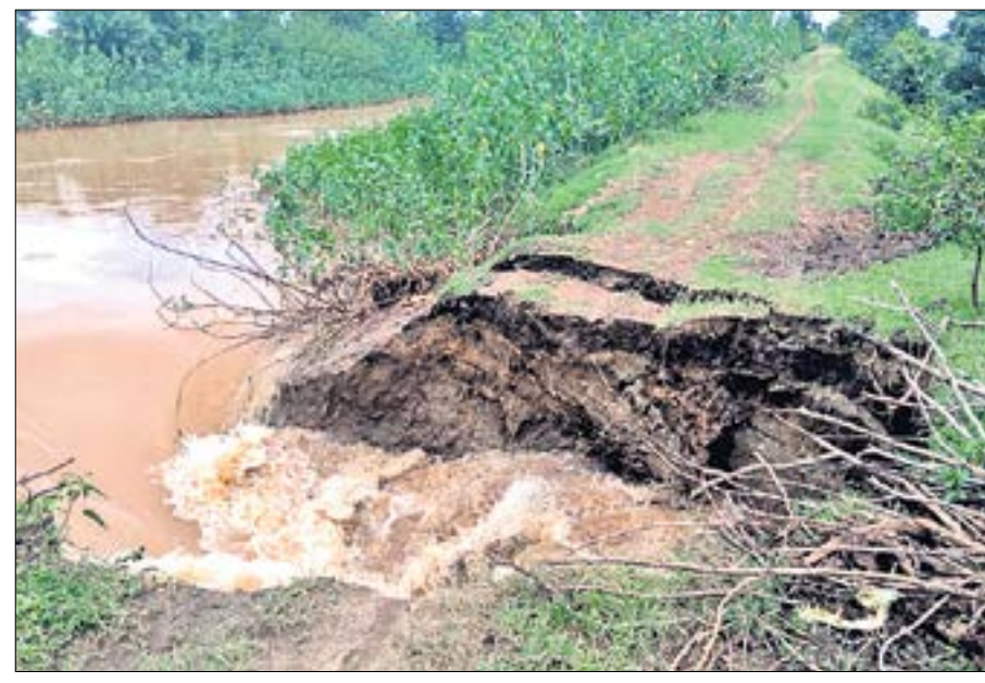
ପଞ୍ଚରାପଳାଠାରେ ଇନ୍ଦ୍ରାବତୀ ଦକ୍ଷିଣ ମୁଖ୍ୟ କେନାଲରେ ସୃଷ୍ଟି ହୋଇଥିବା ଘାଇ।

କୁଳାଗଡ଼, ୨୧।୮ (ଡି.ଏନ.ଏ.) କଳାହାଣ୍ଡି ଜିଲ୍ଲା କୁଳାଗଡ଼ ବ୍ଲକ ମୁଖରାଗୁଡ଼ା ପଞ୍ଚାୟତ ପଞ୍ଚରାପଳାରେ ଗୁଧବାର ମଧ୍ୟାହ୍ନରେ ଇନ୍ଦ୍ରାବତୀ ଦକ୍ଷିଣ ମୁଖ୍ୟ କେନାଲରେ ଘାଇ ସୃଷ୍ଟି ହୋଇଛି। ଏଥିଯୋଗୁ ଶତାଧିକ ଏକର ଚାଷ ଜମି ଜଳମଗ୍ନ ହୋଇଛି। ଫଳରେ ଧାନ ଫସଲ ନଷ୍ଟ ହେବା ଆଶଙ୍କା ରହିଛି। ମିଳିଥିବା ସୂଚନା ଅନୁଯାୟୀ, କୁଳାଗଡ଼ ବ୍ଲକ ପଞ୍ଚରାପଳାଠାରେ ହୁର୍ଦ୍ଦକ ହିଡ଼ (ବନ୍ଦ) ଯୋଗୁ ଗୁଧବାର ମଧ୍ୟାହ୍ନରେ ହଠାତ୍ ଦକ୍ଷିଣ ମୁଖ୍ୟ କେନାଲରେ ପ୍ରାୟ ୧୦ରୁ ୧୫ ଫୁଟର ଘାଇ ସୃଷ୍ଟି ହୋଇଥିଲା। ସେହି ଘାଇ ବେଲ କେନାଲ ପାଣି ନିକଟସ୍ଥ ଚାଷ ଜମିକୁ ମାଡ଼ି ଯିବାରୁ ଶତାଧିକ ଏକର ଚାଷ ଜମି ଜଳମଗ୍ନ ହୋଇଛି। ଫଳରେ ସେଠାରେ ଗୁଆ ହୋଇଥିବା ଧାନ ଫସଲ ନଷ୍ଟ ହୋଇଛି ବୋଲି ଗ୍ରାମୀଣ ଚାଷୀମାନେ କହିଛନ୍ତି। ଘାଇ ହେବା ଜାଣିବା ପରେ ବିଭାଗୀୟ କର୍ତ୍ତୃପକ୍ଷ ମଙ୍ଗଳପୁର ବ୍ୟାଚେରର ଦକ୍ଷିଣ ମୁଖ୍ୟ କେନାଲର ଏବଞ୍ଚାର