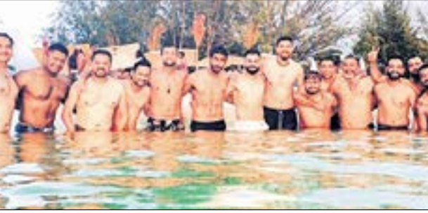
ଗୁରୁବାର ସମୁଦ୍ର ସ୍ନାନ ମନା ନେଇଛନ୍ତି ଭାରତୀୟ ଖେଳାଳି।

ସିରିଜରେ ପରାସ୍ତ କରିଥିଲା। ଆଣ୍ଡ୍‌ଗୁଆର ଏହି ଉଇକେଟରେ ଦ୍ରୁତ ବୋଲରଙ୍କୁ ବେଶ୍ ସହାୟତା ମିଳିବ। ଫଳରେ କୋହଲି ଓ ତାଙ୍କ ଖେଳାଳିମାନେ ପରାସ୍ତ ହେବା ସମ୍ଭାବନା ହେବେ। ଟେଷ୍ଟ କ୍ରିକେଟର ମାନ ଓ ଲୋକପ୍ରିୟତା କମୁଛି ବୋଲି ଚର୍ଚ୍ଚା ହେଉଛି। ତେବେ ଗତ କେତେବର୍ଷ ମଧ୍ୟରେ ଟେଷ୍ଟ ଫର୍ମାରେ ଚମକ ଓ ଲୋକପ୍ରିୟତା ବଢ଼ିଛି। ବିଭିନ୍ନ ବ୍ୟାଲୋକ୍ସ ଗ୍ରହଣ କରି ଦଳକୁ ଜିତାଇବାକୁ ଟେଷ୍ଟା କରିବାର ପ୍ରୟାସ ଖେଳାଳିମାନଙ୍କ ଉପରେ ନିର୍ଭର କରେ ବୋଲି କୋହଲି କହିଛନ୍ତି। ବିଶ୍ୱ ଟେଷ୍ଟ ଚାମ୍ପିୟନଶିପ୍ ପ୍ରାରମ୍ଭିକ ସଂସ୍କରଣ ଉପରେ ମତ ଦେଇ ସେ ଏହି କଥା କହିଛନ୍ତି। ଏହି ଚାମ୍ପିୟନଶିପ୍‌ରେ ଆଗାମୀ ଦିନରେ ମ୍ୟାଚ୍‌ରୁଟିକରେ ଜବରଦସ୍ତ ପ୍ରତିସ୍ପନ୍ଧିତା ଦେଖିବାକୁ ମିଳିବ। ଠିକ୍ ସମୟ ଓ ଅବକାଶରେ ଏହି ଚାମ୍ପିୟନଶିପ୍ ଆରମ୍ଭ ହୋଇଛି ବୋଲି ସେ କହିଛନ୍ତି। ଏହି ଗ୍ରାଉଣ୍ଡରେ ଶେଷଥର ପାଇଁ ଇଂଲଣ୍ଡ ଘରୋଇ ଫ୍ରେଣ୍ଡ୍‌ସ୍‌ଫର ବିପକ୍ଷରେ ଟେଷ୍ଟ ଖେଳିଥିଲା। ଏଥିରେ ଇଂଲଣ୍ଡ ୧୮୭ ଓ ୧୩୨ ରନ ସଂଗ୍ରହ କରିଥିଲା। ତେବେ ଏହା ବର୍ଷର ଭିନ୍ନ ସମୟରେ ଖେଳାଯାଇଥିଲା। ଘରୋଇ ଦ୍ରୁତ ବୋଲରଙ୍କୁ କିଛି ସାମନା କରାଯିବ ସେ ନେଇ କୋହଲି ଓ ହେଡ୍ କୋର୍ ରବି ଶାସ୍ତ୍ରୀ ଚିନ୍ତିତ ଥିବେ। କୋର୍ ପଦ ବଦାଇ ରଖିବା ପରେ ଶାସ୍ତ୍ରୀଙ୍କ ପାଇଁ ଏହି ସିରିଜ ପ୍ରଥମ ପରୀକ୍ଷା ସୃଷ୍ଟି କରିଛି। ଫ୍ରେଣ୍ଡ୍‌ସ୍‌ଫର ଦ୍ରୁତ ବୋଲର