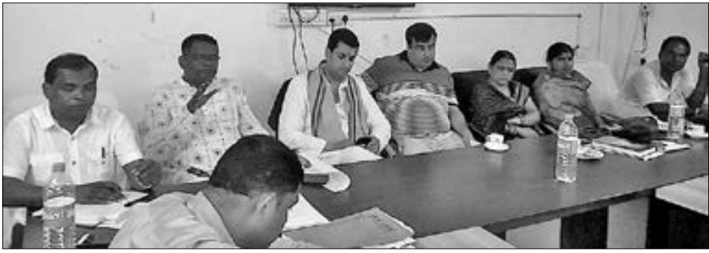
ନାକଟିଦେଉଳ ବ୍ଲକ କାର୍ଯ୍ୟାଳୟ ପରିସରରେ ରାଜ୍ୟ ଗୋଷ୍ଠୀ ସେବା କେନ୍ଦ୍ରରେ ରୁଧିରା ପଞ୍ଚାୟତ ସମିତି ବୈଠକରେ ଏମ୍ପି, ବିଧାୟକ ଓ ଅନ୍ୟମାନେ ।

ନାକଟିଦେଉଳ ବ୍ଲକ କାର୍ଯ୍ୟାଳୟ ପରିସରରେ ରାଜ୍ୟ ଗୋଷ୍ଠୀ ସେବା କେନ୍ଦ୍ରରେ ରୁଧିରା ପଞ୍ଚାୟତ ସମିତି ବୈଠକ ଅନୁଷ୍ଠିତ ହୋଇଥିଲା । ଏଥିରେ ଲୋକଙ୍କ ମୌଳିକ ସୁଧିଆ ସୁଯୋଗ ନେଇ ଯେତିକି ଆଲୋଚନା ହୋଇଥିଲା ତାହା ଅଧିକ ଥିଲା ଅଭିଯୋଗର ଲକ୍ଷ୍ୟ ତାଲିକା । ଉପସ୍ଥିତ ବିଧାୟକ, ଏମ୍ପିଙ୍କ ଉପାୟ ଶୁଣ ହୋଇ ପଡିଥିଲା ।