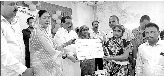
ବାରମହାରାଜପୁର ବ୍ଲକର ହିତାଧିକାରୀଙ୍କୁ ଭଦ୍ରା ବନ୍ଧନ କରାଯାଇଛି ।