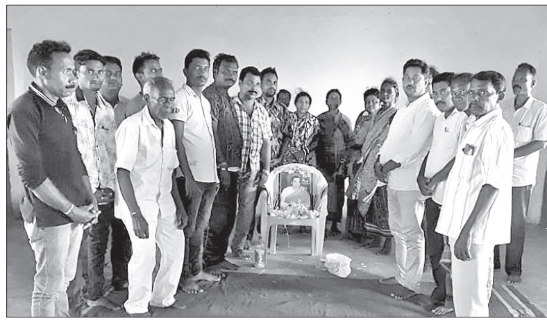
ରାଜୀବ ଗାନ୍ଧୀଙ୍କ ଜୟନ୍ତୀ କାର୍ଯ୍ୟକ୍ରମରେ ଉପସ୍ଥିତ କଂଗ୍ରେସ କର୍ମକର୍ମୀ