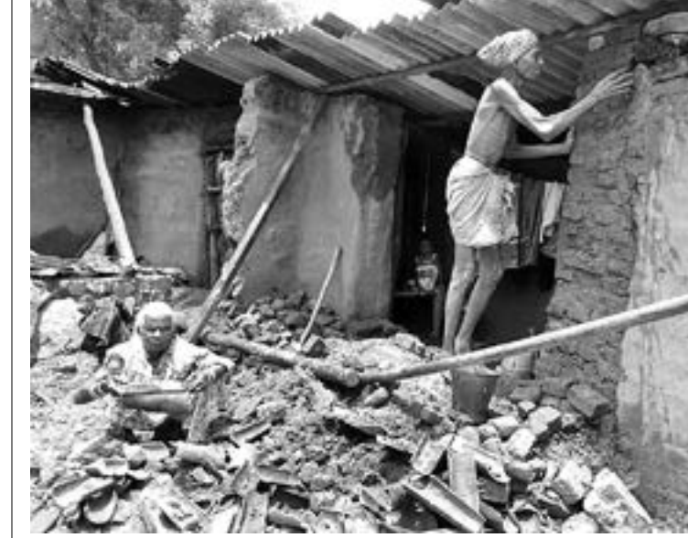
ବଲାଙ୍ଗୀର ସହରର ମେଘନାଥପଡ଼ାର ପୁରସର ମାଝି ଓ ଗାଙ୍ଗ ସ୍ତ୍ରୀ ବନ୍ୟାରେ ଭାସି ଯାଇଥିବା ଭଙ୍ଗା ଘରକୁ ସମାବୁଛନ୍ତି (ବାମ)। ବଲାଙ୍ଗୀର ସହରର ସତ୍ୟନାରାୟଣପଡ଼ାର ଅନୁବାସୀ ଗାତକ ଘର ବନ୍ୟାରେ ସମ୍ପୂର୍ଣ୍ଣ ଭାଙ୍ଗି ଯାଇଥିବା ବେଳେ ଅଶ୍ରୁସମ୍ପାଦକ ଖୋଲୁଛନ୍ତି। (ସୁମାଲ)