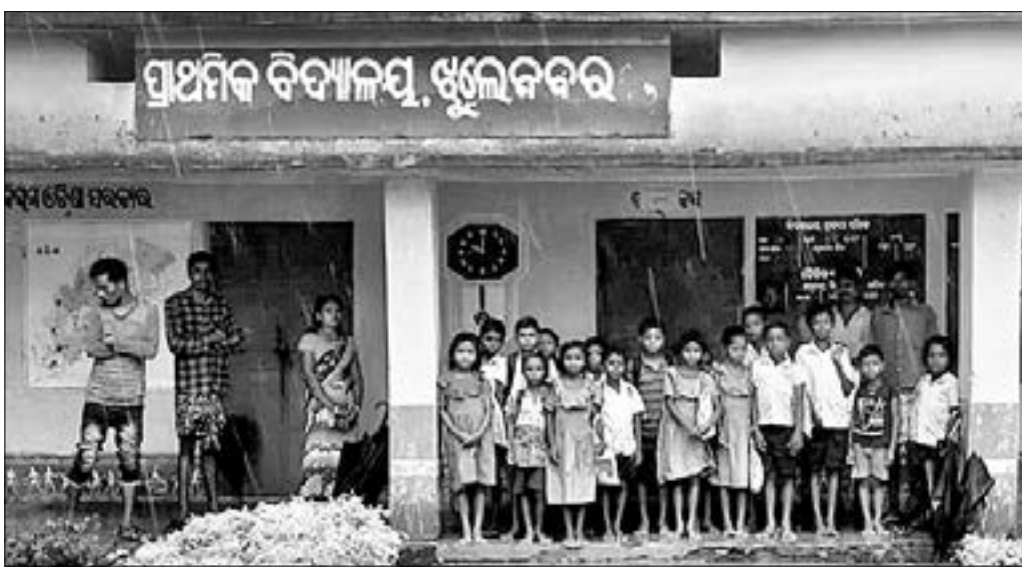
ସ୍କୁଲ ଶ୍ରେଣୀ ଗୃହ ଖୋଲା ନ ଥିବାରୁ ଅଭିଭାବକଙ୍କ ସହ ପିଲାମାନେ ବାରଣ୍ଡାରେ ଛିଡ଼ା ହୋଇଛନ୍ତି ।

କଳାହାଣ୍ଡି ଜିଲ୍ଲା କୋକସରା ବ୍ଲକ୍ ଶିକ୍ଷା ବିଭାଗ ଅଧୀନ ଆମପାଣି କ୍ଷେତ୍ରର ବଣପାହାଡ଼ ଘୋରା ଦୁର୍ଗମ ବରାଡ଼ୁଡ଼ା ପଞ୍ଚାୟତ ଝୁଲେନବର ପ୍ରାଥମିକ ବିଦ୍ୟାଳୟ । ଆଦିବାସୀ ବହୁଳ ଗ୍ରାମରେ ୧୯୭୫ରେ ଗଢ଼ାଯିବ ଏହି ପ୍ରାଥମିକ ବିଦ୍ୟାଳୟକୁ ନିୟମିତ ଶିକ୍ଷକ ଆସୁ ନ ଥିବା ଓ ମଧ୍ୟାହ୍ନଭୋଜନ ଖାଇ ସାରିବା ପରେ ଅଯୋଗ୍ୟ ରୁହେଇଥିବା ନେଇ ଅଭିଭାବକ ଗ୍ରାମବାସୀ ଅଭିଯୋଗ କରିଛନ୍ତି ।