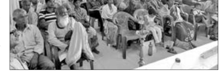
ସିସାଲ ଚାଷ, ବିହନ ପ୍ରସ୍ତୁତି ପ୍ରଶିକ୍ଷଣ ଶିବିରରେ ଯୋଗ ଦେଇଥିବା ବ୍ୟକ୍ତିମାନେ ।