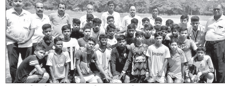
ପୁସ୍ତକ ପ୍ରତିଯୋଗିତାରେ ଅଂଶଗ୍ରହଣ କରିଥିବା ଛାତ୍ର ଓ ଅତିଥି