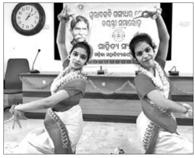
ରୁଧିରା ସମ୍ବଲପୁର ସରକାରୀ ମହିଳା କଲେଜରେ ଆୟୋଜିତ ଗମ୍ପାଧର ମେହେର ଇୟତା ଉତ୍ସବରେ ଛାତ୍ରୀମାନେ ନୃତ୍ୟ ପରିବେଷଣ କରୁଛନ୍ତି (ବାମ) ।