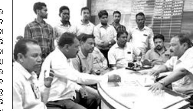
ସମ୍ବଲପୁର ବେବେକପାଲିରେ ଥିବା ହୋମିଓପାଥ କଲେଜ ଅଧିକାରୀ ସହ ବିଧାୟକ ଓ କର୍ମଚାରୀ ଆଲୋଚନା କରୁଛନ୍ତି ।