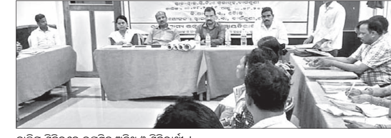
ଗାମିନ ଶିବିରରେ ଉପସ୍ଥିତ ଅତିଥି ଓ ଶିବିରୀୟା ।