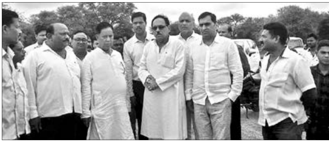
ମନ୍ତ୍ରୀ ଓ ବିଧାୟକ ଏବଂ ବିଭାଗୀୟ ଅଧିକାରୀଙ୍କ ସହିତ ଓଲଟ ବ୍ରୁକ ନିର୍ମାଣ ପାଇଁ ବୁଲି ଦେଖୁଛନ୍ତି ।

ବ୍ରୁକ ନିର୍ମାଣ କରିବା ପାଇଁ ନିର୍ମାଣ ବିଭାଗୀୟ ଅଧିକାରୀଙ୍କ ସହିତ ଓଲଟ ବ୍ରୁକ ନିର୍ମାଣ ପାଇଁ ବୁଲି ଦେଖୁଛନ୍ତି ।