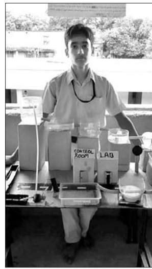
ଜଣେ ଛାତ୍ର ତାଙ୍କ ପ୍ରକଳ୍ପ ପ୍ରଦର୍ଶନ କରୁଛନ୍ତି ।

ସୋନପୁର, ୨୧।୮ (ନି.ପ୍ର.): ସୁବର୍ଣ୍ଣପୁର ଜିଲ୍ଲା ବାରମହାରାଜପୁର ସରକାରୀ ଶିଶୁ ବିଦ୍ୟାଳୟରେ ରୁଧିରାଣୀ ସ୍ମୃତିପୁସ୍ତକାଳୟ ଜ୍ଞାନବିଜ୍ଞାନ ମେଳା ଅନୁଷ୍ଠିତ ହୋଇଛି । ଏଥିରେ ୪ ବର୍ଗରେ ୭୨ ବିଜ୍ଞାନ ପ୍ରକଳ୍ପ ପ୍ରଦର୍ଶିତ ହୋଇଥିଲା । ପ୍ରଥମରୁ ତୃତୀୟ ଶ୍ରେଣୀ ପର୍ଯ୍ୟନ୍ତ ୩୦, ୪୦, ୫୦ ଓ ୬୦ ଶ୍ରେଣୀର ୧୨, ୧୫, ୧୫, ୧୫ ପ୍ରକଳ୍ପ ପ୍ରଦର୍ଶିତ ହୋଇଥିଲା ।