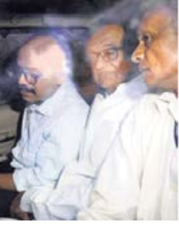
ସିବିଆଇ ଅଧିକାରୀମାନେ ଚିଦାମ୍ବରମକୁ ଗିରଫ କରି ନେଉଛନ୍ତି ।

ମଧ୍ୟ ବଳୀୟ କର୍ମୀଙ୍କ ପ୍ରବଳ ବିରୋଧ ଯୋଗୁ ଭିତରେ ପଶିପାରି ନ ଥିଲା । ଚିଦାମ୍ବରମ ତାଙ୍କ ବାସଭବନକୁ ଫେରିଯିବା ପରେ ସିବିଆଇର ୩ଟି ଚିନ୍ତା ସମେତ ଇଡି ଚିନ୍ତା ସେଠାରେ ପହଞ୍ଚିଥିଲେ । ସିବିଆଇ ଅଧିକାରୀମାନେ ପାଟେରୀ ଡେଇଁ ଚିଦାମ୍ବରମଙ୍କ ବାସଭବନରେ ପ୍ରବେଶ କରିବା ପରେ ତାଙ୍କୁ ଜେରା କରିଥିଲା । ପରେ ତାଙ୍କୁ କାରରେ ବସାଇ ସିବିଆଇ ପୁଞ୍ଜୀକରଣକୁ ନିଆଯାଇଥିଲା । ସେଠାରେ ସେ ରାତ୍ରିଯାପନ କରିବା ପରେ ଗୁରୁବାର ଏକ ଗ୍ଲାମରାଜ କୋର୍ଟରେ ତାଙ୍କୁ ହାଜର କରାଯିବ ବୋଲି ଜଣାପଡ଼ିଛି । ଆଇବନ୍ଦୁ ମିଡିଆ ଦୁର୍ଗତି ମାମଲାରେ ଚିଦାମ୍ବରମଙ୍କ ଆଇଆ କାମିନି ଆଦେଶ ଦିନ ହାଇକୋର୍ଟରେ ଖାରଜ ହୋଇଯିବା ପରେ ଗିରଫକୁ ବର୍ତ୍ତମାନ ଲାଗି ସେ ରୁଧିରା ରୁଖିଥିବା ପୁସ୍ତିକାଗାରରେ ଦାଖଲ ହୋଇଥିଲେ । ଚିଦାମ୍ବରମଙ୍କ ଅଭିଯୁକ୍ତ ହୋଇଥିଲେ । ତାଙ୍କୁ ଗିରଫ କରିବା ଲାଗି ମଙ୍ଗଳବାର ରାତିରୁ ଉଭୟ ସିବିଆଇ ଏବଂ ପ୍ରବର୍ତ୍ତନ ନିର୍ଦ୍ଦେଶାଳୟ (ଇଡି) ନେତାମାନଙ୍କୁ ଚଳାଇଥିଲେ । ମଙ୍ଗଳବାର ରାତିରେ ତାଙ୍କୁ ନୂଆଦିଲ୍ଲୀରୁ ଜୋରଦାଗ୍ ବାସଭବନରେ ନ ପାଇଁ ପୁଞ୍ଜୀ-୪