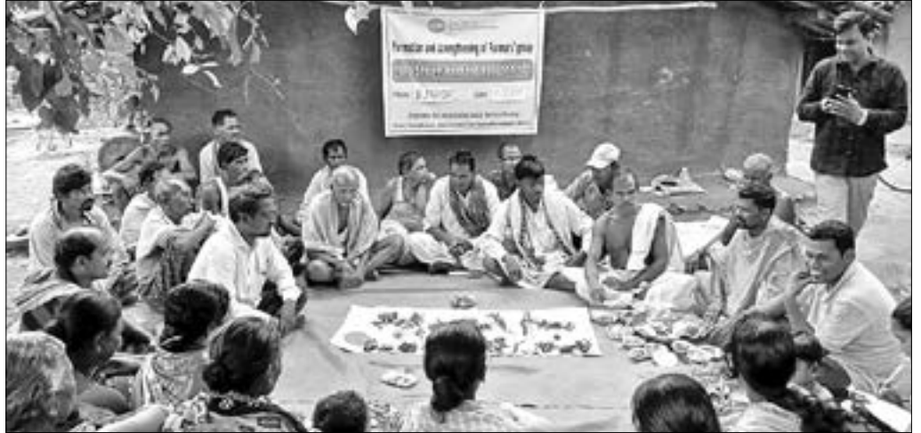
ଗାଷୀମାନଙ୍କୁ ନେଇ କୃଷକ ଉତ୍ସାହକ ଦଳ ଗଠନ ଉପରେ ତାଲିମ ଦିଆଯାଉଛି ।

କଳାହାଣ୍ଡି ଜିଲ୍ଲା କଳାମୁଣ୍ଡା ବ୍ଲକ୍ ଯୋଗକେଳା ପଞ୍ଚାୟତ କୁଟାପଦରଠାରେ ଇଣ୍ଡୋରୋବାଲ ସୋସିଆଲ ସର୍ଭିସ ସୋସାଇଟି ପକ୍ଷରୁ ଧର୍ମାନ୍ତରଣ, ବୁଢ଼ାପଦର, ସିରାବାହାଲ ଗାଁର ଅଗ୍ରଣୀ ଗାଷୀମାନଙ୍କୁ ନେଇ କୃଷକ ଉତ୍ସାହକ ଦଳ ଗଠନ ଉପରେ ତାଲିମ କାର୍ଯ୍ୟକ୍ରମ ଅନୁଷ୍ଠିତ ହୋଇଯାଇଛି । ଏହି ଅବସରରେ ସଂଗ୍ରାମ କାର୍ଯ୍ୟକ୍ରମ ଆଧାରରେ କୃଷି କୁଟାପଦରଠାରେ ଇଣ୍ଡୋରୋବାଲ ସୋସିଆଲ ସର୍ଭିସ ସୋସାଇଟି ପକ୍ଷରୁ ଧର୍ମାନ୍ତରଣ, ବୁଢ଼ାପଦର, ସିରାବାହାଲ ଗାଁର ଅଗ୍ରଣୀ ଗାଷୀମାନଙ୍କୁ ନେଇ କୃଷକ ଉତ୍ସାହକ ଦଳ ଗଠନ ଉପରେ ତାଲିମ କାର୍ଯ୍ୟକ୍ରମ ଅନୁଷ୍ଠିତ ହୋଇଯାଇଛି ।