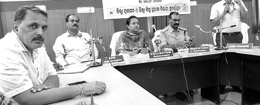
ବୈଠକରେ ମହାସାଧନ ଅତିଥି ବୃନ୍ଦ ।

ସୋନପୁର, ୨୧।୮ (ନି.ପ୍ର.): ସୁବର୍ଣ୍ଣପୁର ସମେତ ଓଡ଼ିଶାର ୯ଟି ଜିଲ୍ଲାରେ ଖୁବଶୀଘ୍ର ଆରମ୍ଭ ହେବାକୁ ଯାଉଛି ଚାଉଳ ଲାଇନ୍ ସେବା । ଚାଉଳ ଲାଇନ୍ କେନ୍ଦ୍ର ମହିଳା ଓ ଶିଶୁ ବିକାଶ ମନ୍ତ୍ରାଳୟ ପକ୍ଷରୁ ଏଥିପାଇଁ ମଞ୍ଜୁରି ମିଳିଛି । ଏବେକି ଜିଲ୍ଲାର ଶିଶୁ ସୁରକ୍ଷା ସମ୍ପର୍କିତ ଅଂଶାଦାରମାନଙ୍କୁ ନେଇ ଏକ ବୈଠକ ରୁଧିରାଣୀ ଅନୁଷ୍ଠିତ ହୋଇଥିଲା ।