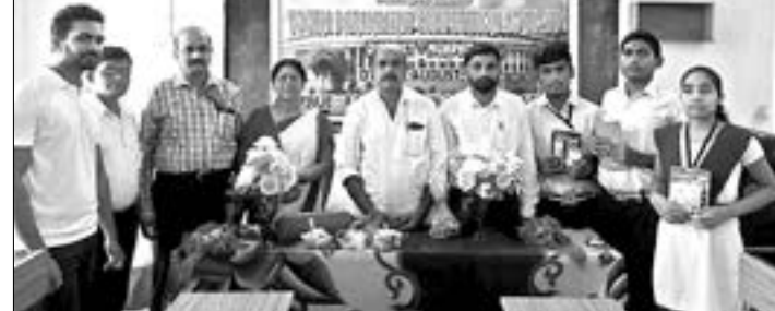
ପ୍ରତିଯୋଗିତାରେ ଅତିଥିଙ୍କ ସହ ଛାତ୍ରାଛାତ୍ରୀ ।