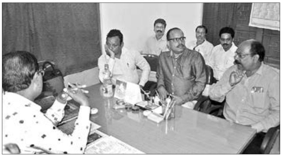
ବାମନେ ବିଭିନ୍ନ ଦାବି ଦେଇ ସମ୍ବଲପୁର ସମବାୟ ସହ ଉପ ନିୟୋଜନ ପ୍ରଦର୍ଶକ ସହ ଆଲୋଚନା କରୁଛନ୍ତି (ମଝି) ।