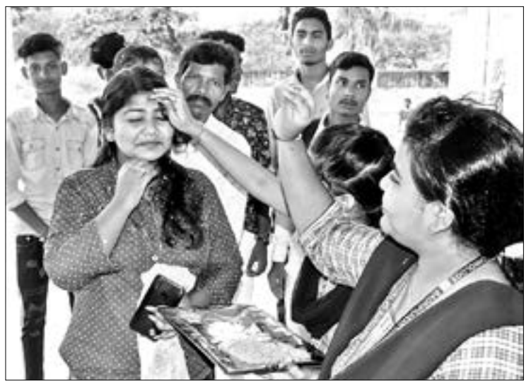
ଦ୍ରୁପଦାଦି ଉପକ୍ରମରେ ନଗର ଛାତ୍ରାଞ୍ଚଳକୁ ସ୍ୱାଗତ କରାଯାଇଛି ।