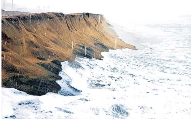
କୁଆର ମାଡ଼ରେ ପୁରୀ ବେଳାଭୂମି ଖାଇଯାଇଛି ।