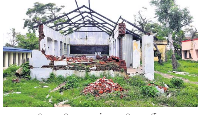
ବାତ୍ୟାରେ ଧ୍ୱସ୍ତବିଧ୍ୱସ୍ତ ଏକ ବିଦ୍ୟାଳୟ ଏପର୍ଯ୍ୟନ୍ତ ମରାମତି ହୋଇନାହିଁ ।

ବାତ୍ୟା 'ଫନୀ'ରେ ପୁରୀ ଜିଲ୍ଲାରେ ବ୍ୟାପକ କ୍ଷତି ଘଟିଥିଲା । ୨୫ଜାନୁଆରୀ ଉର୍ଦ୍ଧ୍ୱ ବିଦ୍ୟାଳୟ ପ୍ରଭାବିତ ହୋଇଥିଲା । ତନ୍ମଧ୍ୟରୁ ୧୬୨ଟି ଶିକ୍ଷାନୁଷ୍ଠାନ ବେଶି କ୍ଷତିଗ୍ରସ୍ତ ହୋଇଥିଲା । ଜିଲା ଶିକ୍ଷା ବିଭାଗ ପକ୍ଷରୁ ସରକାରଙ୍କୁ ୩୮ କୋଟି ଟଙ୍କାର କ୍ଷତିପୂରଣ ରିପୋର୍ଟ ଦିଆଯାଇଥିଲା ।