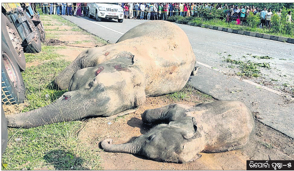
କେନ୍ଦ୍ରରେ ଲିକା ଅଟେଇ ସଂରକ୍ଷିତ ଜଙ୍ଗଲ ବାଲିଯୋଡ଼ି ଗ୍ରାମ ନିକଟରେ ରୁଚୁବାର ଗାଡ଼ି ଧକ୍କାରେ ପ୍ରାଣ ହରାଇଥିବା ମା' ଏବଂ ଛୁଆ ହାତୀ।