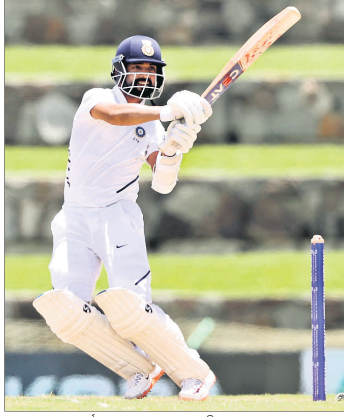
ଅର୍ଦ୍ଧଶତକ ହାସଲ ଅବସରରେ ଅଜିଙ୍କ୍ୟ ରାହାନେ।

ଶ୍ରୀମାତା ଭିକିଆନ ଚିତାଡ଼ି ଷ୍ଟାଡ଼ିୟମରେ ଚତୁର୍ଥଦିନୀ ଆରମ୍ଭ ହୋଇଥିବା ପ୍ରଥମ କ୍ରିକେଟ ଟେଷ୍ଟରେ ଫ୍ରେଷ୍ଟଲଣ୍ଡର ବୋଲରମାନେ ପ୍ରଭାବୀ ପ୍ରଦର୍ଶନ କରିଛନ୍ତି। ଭାରତ ପ୍ରାରମ୍ଭିକ ବ୍ୟାଟିଂ ବିପର୍ଯ୍ୟୟର ସମ୍ମୁଖୀନ ହୋଇଥିବାବେଳେ ଅଜିଙ୍କ୍ୟ ରାହାନେଙ୍କ ଅର୍ଦ୍ଧଶତକ ସହାୟତାରେ ସଂଘର୍ଷ ଜାରି ରହିଛି।