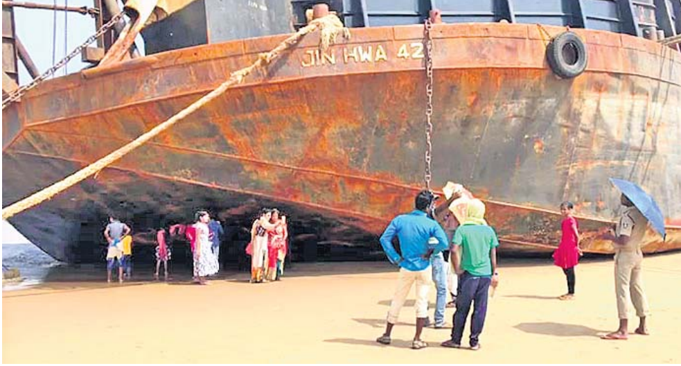
କୃଷ୍ଣପ୍ରସାଦ ବୁକ ରାଜହସ୍ୟ ନିକଟରେ ଲାଗିଥିବା ମାଲେସିଆ ଜାହାଜ ତଳେ ଲୋକମାନେ ବିପଦପୂର୍ଣ୍ଣ ଭାବେ ସେଲ୍ଫି ନେଉଛନ୍ତି ।

ପୁରୀ ଜିଲା କୃଷ୍ଣପ୍ରସାଦ ବୁକ ଅନ୍ତର୍ଗତ ରାଜହସ୍ୟ ନିକଟରେ ଲାଗିଛି ମାଲେସିଆର ଏକ ପଶ୍ୟାଦହାଜା ଜାହାଜ । ଜାହାଜ ଲାଗିବା ୧୫ ଦିନ ବିତିଲାଣି । ଏହି ଜାହାଜଟିକୁ ଦେଖିବା ପାଇଁ ସ୍ଥାନୀୟ ଲୋକଙ୍କ ଭିଡ଼ ଜମୁଛି ।