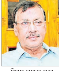
ବିମଳ ପ୍ରସାଦ ଦାସ

ରାଜ୍ୟ ସରକାର ରାଜ୍ୟ ମାନବାଧିକାର କମିଶନ (ଓଏସଆର୍ସି) ଅଧ୍ୟକ୍ଷ ଭାବେ ହାଇକୋର୍ଟର ପୂର୍ବତନ ବିଚାରପତି ବିମଳ ପ୍ରସାଦ ଦାସଙ୍କୁ ନିଯୁକ୍ତ ହୋଇଛନ୍ତି ।