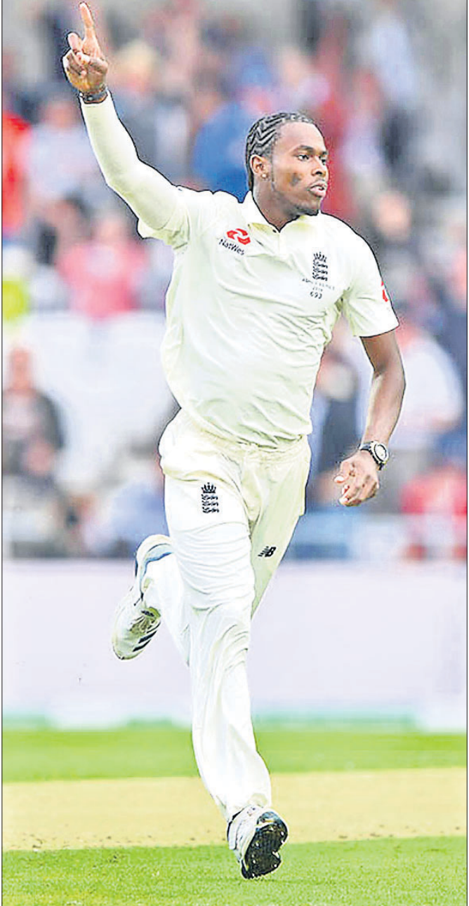
କୋପ୍ପା ଆର୍ଚର ୬/୪୫

କୋଲକାତା, ୨୨।୮ (ପି.ଟି.): ବେଙ୍ଗାଲ ଖ୍ରୀଷ୍ଟିୟର୍ସ ଅଲରାଉଣ୍ଡ ପ୍ରଦର୍ଶନ ବଳରେ ସ୍ଥାନୀୟ ନେହେରୁ ଇନ୍‌ଡୋର ଷ୍ଟାଡ଼ିୟମରେ ଗୁରୁବାର ଖେଳାଯାଇଥିବା ମ୍ୟାଚ୍‌ରେ ପାଟନା ପାଇରେଟ୍ସ ୩୫-୨୬ ପଏଣ୍ଟରେ ହରାଇ ହୋଇଛି।