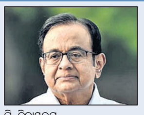
ପି. ଚିଦାମ୍ବରମ ■ ପ୍ରତି ୪୮ ଘଣ୍ଟାରେ ହେବ ଚିଦାମ୍ବରମଙ୍କ ସ୍ୱାସ୍ଥ୍ୟ ପରୀକ୍ଷା

ଚିଦାମ୍ବରମଙ୍କ ଓକିଲ ଓ ପରିବାର ଲୋକଙ୍କ ହାଜତରେ ତାଙ୍କୁ ଦିନକୁ ଅଧ୍ୟକ୍ଷ ଲେଖାଏ ଭେଟି ପାରିବେ। ପ୍ରତି ୪୮ ଘଣ୍ଟାରେ