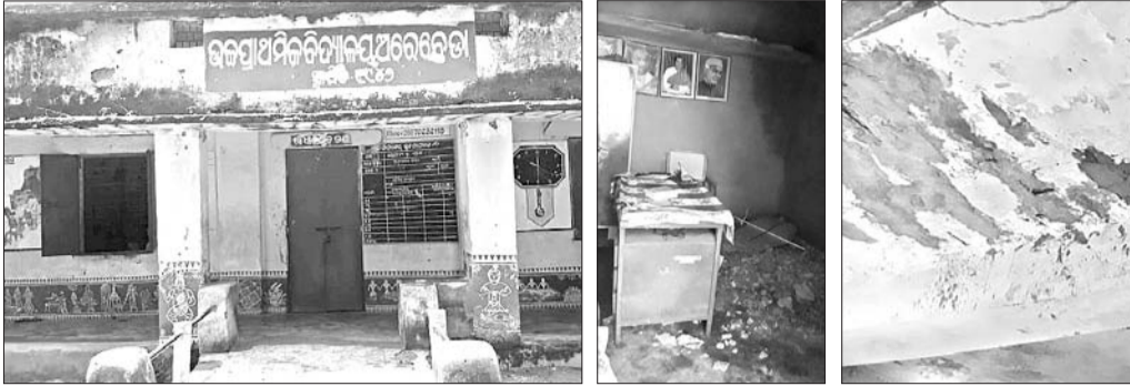
ଅରେବେଡ଼ା ସରକାରୀ ଉଚ୍ଚ ପ୍ରାଥମିକ ବିଦ୍ୟାଳୟ (ବାମ) । ଛାତ୍ରରୁ ସିମେଣ୍ଟ ଖସି ପଡ଼ିଛି।

କଳାହାଣ୍ଡି ଜିଲ୍ଲା କଳମପୁର ବ୍ଲକ୍ ରଖାମାଳ ପଞ୍ଚାୟତ ଅରେବେଡ଼ା ସରକାରୀ ଉଚ୍ଚ ପ୍ରାଥମିକ ବିଦ୍ୟାଳୟ ଅତ୍ୟନ୍ତ ଶୋଚନୀୟ ଅବସ୍ଥାରେ ରହି କରୁଛି। ୧୯୪୨ରେ ସ୍ଥାପିତ ଏହି ବିଦ୍ୟାଳୟରେ ପ୍ରଥମଠାରୁ ଅଷ୍ଟମ ଶ୍ରେଣୀ ପର୍ଯ୍ୟନ୍ତ ରହିଥିବା ବେଳେ ଏଠାରେ ସମୁଦାୟ ୧୮୦ ଜଣ ଛାତ୍ରଛାତ୍ରୀ ଅଧ୍ୟୟନ କରୁଛନ୍ତି। ସେଥି ମଧ୍ୟରୁ ପ୍ରଥମ ଶ୍ରେଣୀରେ ୧୨ ଜଣ ଦ୍ୱିତୀୟରେ ୨୫, ତୃତୀୟରେ ୧୫, ଚତୁର୍ଥରେ ୨୧, ପଞ୍ଚମରେ ୧୪, ଷଷ୍ଠରେ ୩୩, ସପ୍ତମରେ ୩୯ ଓ ଅଷ୍ଟମରେ ୨୧ ଜଣ ରହିଛନ୍ତି। ତେବେ ସେଥି ମଧ୍ୟରୁ ଛାତ୍ରୀ ୮୩ ଓ ଛାତ୍ର ସଂଖ୍ୟା ୯୬ ସମୁଦାୟ ୧୮୦ ଜଣ ଅଧ୍ୟୟନ କରୁଛନ୍ତି। ବିଦ୍ୟାଳୟରେ ମୋଟେ ୪ଟି କୋଠା ରହିଥିବାବେଳେ ତିନିଟି କୋଠା ଗୋଟିଏ ଏବଂ ଅନ୍ୟ କୋଠା ୩ଟି ରହିଛି। ସମୁଦାୟ ୪ଟି କୋଠାକୁ ୩ଟି କୋଠା ସମ୍ପୂର୍ଣ୍ଣ ଭାବେ ଅକାମୀ ହୋଇପଡ଼ିଛି। ଆଉ ଗୋଟାଏ କୋଠାରେ ସମସ୍ତ ଛାତ୍ରଛାତ୍ରୀ ପାଠ