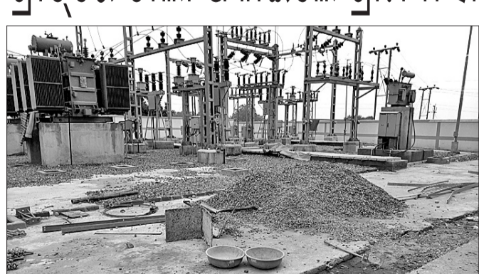
ଗୋଛା ଗ୍ରାମରେ ନିର୍ମାଣ ହେଉଥିବା ବିଦ୍ୟୁତ୍ ଗ୍ରାଡ଼ ସବ୍‌ଷ୍ଟେସନ ।

କୃତ୍ତିକା, ୨୨।୮ (ତି.ଏ.ଏ.ଏ.) : କୃତ୍ତିକା ବ୍ଲକ୍ ଗୋଛା ଗ୍ରାମରେ ବିଦ୍ୟୁତ୍ ବିଭାଗ ପକ୍ଷରୁ ୧ କୋଟିରୁ ଊର୍ଦ୍ଧ୍ୱ ଟଙ୍କା ବ୍ୟୟରେ ଏକ ବିଦ୍ୟୁତ୍ ଗ୍ରାଡ଼ ସବ୍‌ଷ୍ଟେସନ ନିର୍ମାଣ କାର୍ଯ୍ୟ ଚାଲିଛି । ହେଲେ ନିର୍ମାଣ କାମ ନିମ୍ନମାନର ହେଉଥିବା ଗ୍ରାମବାସୀ ଅଭିଯୋଗ କରି ଗୁରୁବାର ଗ୍ରାଡ଼ ପୂର୍ଣ୍ଣ ପାଟକରେ ତାଲା ପକାଇ ଆଲୋଚନା କରିଥିଲେ । ଗ୍ରାମବାସୀଙ୍କ ଆଭିଯୋଗ ପୂର୍ତ୍ତବକ, କୌଣସି ନିର୍ମାଣ କାର୍ଯ୍ୟ ଆରମ୍ଭ ହେବା ଆଗରୁ ସୂଚନା ପକାଇ