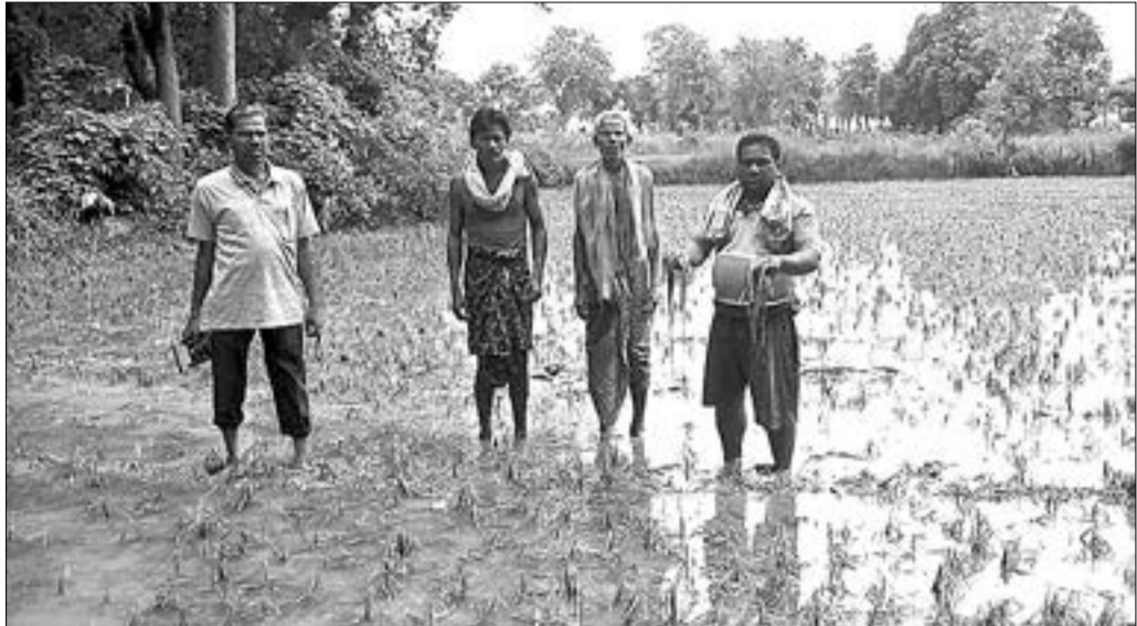
ବନ୍ୟାରେ ଚାଷଜମିରେ ଧାନଗଛଗୁଡ଼ିକ ପଡ଼ି ନଷ୍ଟ ହୋଇଯାଇଛି ।