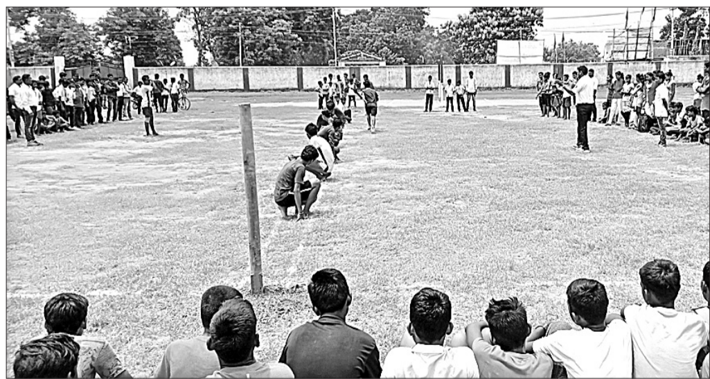
ବ୍ଲକ୍ ସ୍ତରୀୟ ବର୍ଷାକାଳୀନ ଖେଳକୁ ପ୍ରତିଯୋଗିତାରେ ଭାଗ ନେଇଥିବା ପ୍ରତିଯୋଗୀମାନେ ଖୋଖୋ ଖେଳ ସହିତ ଅନ୍ୟାନ୍ୟ ଖେଳ ଖେଳୁଛନ୍ତି।