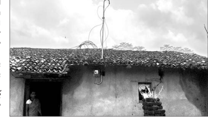
ସୌଭାଗ୍ୟ ଜ୍ୟୋତି ଯୋଜନାରେ ଏକ ଘରେ କେବଳ ବିଦ୍ୟୁତ୍ ନିତର ଲଗାଯାଇଛି।

ଠିକାଦାର ମଧ୍ୟ ଦେଖା ମିଳୁ ନ ଥିବା ହିତାଧିକାରୀମାନେ ଅଭିଯୋଗ କରିଛନ୍ତି। ଏ ନେଇ ଗୋଲାମୁଣ୍ଡା ବିଦ୍ୟୁତ୍ ବିଭାଗ କନିଷ୍ଠ ଯନ୍ତ୍ରୀଙ୍କୁ ଦିଆଯିବ ବୋଲି କହିଥିଲେ। ଏଥିପ୍ରତି ଉଚ୍ଚକର୍ତ୍ତୃପକ୍ଷ ଦୃଷ୍ଟି ଦେବାକୁ ସାଧାରଣରେ ଦାବି ହେଉଛି।