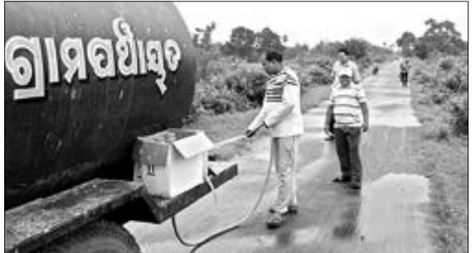
ରେଶମ ଗ୍ରାମପଞ୍ଚାୟତର ସରପଞ୍ଚ ଓ ଇଓ ରାସ୍ତା ସଫେଇ କରୁଛନ୍ତି ।