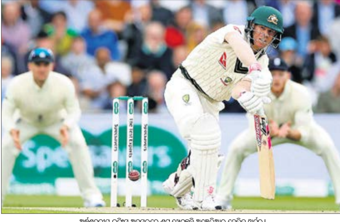
ଅର୍ଦ୍ଧଶତକର ଇନିଂସ ଅବସରରେ ଶର୍ ଷ୍ଟେଲିଆର ତେଜିତ ଫ୍ଲାନର୍।

ରନ କରିଛନ୍ତି। ମାର୍କସ୍ ହାରିସ୍ ଏବଂ ଉପମାନ ଖାଟ୍ଟା ୮ ରନ ଲେଖାଏଁ କରି ପ୍ୟାଟିଲିୟନ ଫୋର୍ ସାରିଥିଲେ। ବର୍ଷାକଳିତ କାରଣରୁ ଖେଳ ଏକ ଘଣ୍ଟା ବିଳମ୍ବରେ ଆରମ୍ଭ ହୋଇଥିଲା। ପୂର୍ବରୁ ବକରା ପାଇ ଆସିଥିବା ଅଷ୍ଟ୍ରେଲିୟ ଓପନର ମାର୍କସ୍ ହାରିସ୍ ମାତ୍ର ୮ ରନ କରି ଡୋପ୍ରା ଆର୍ଟରକ୍ ବଲ୍‌ରେ ବେୟାରସ୍ଟେକ୍ ଦ୍ୱାରା କ୍ୟାଚ୍ ଆଉଟ୍ ହୋଇଯାଇଥିଲେ। ଦକ୍ଷିଣ ଷ୍ଟୋର ସେତେବେଳକୁ ମାତ୍ର ୧୨ ରନ ଥିଲା। ମଧ୍ୟାହ୍ନ ଭୋଜନ ପୂର୍ବରୁ ମାତ୍ର ୪ ଓଭର ବୋଲି ସମ୍ଭବ ହୋଇଥିଲା। ଭ୍ରମଣକାରୀ ଦଳ ଏହି ମ୍ୟାଚକୁ ଓପନର କାମେରନ ବ୍ୟାଲ୍‌କ୍ଲିଫ୍ ବାଦ୍ ଦେଇଥିଲା। ଏହି ବ୍ୟାଟ୍‌ମ୍ୟାନ ଗତ ୪ଟି ଇନିଂସରେ ମାତ୍ର ୪୪ ରନ କରିବାରେ ସମର୍ଥ ହୋଇଛନ୍ତି। ତେଜିତ ଫ୍ଲାନର୍‌କ ପାର୍ଟନର ହେବାଲାଗି ହାରିସ୍‌ଙ୍କୁ ଦଳରେ ନେଇଥିଲା। ଲର୍ଡ୍‌ଠାରେ ଅନୁଷ୍ଠିତ ବିକାଶ ଚେଷ୍ଟ ମ୍ୟାଚ ବର୍ଷାରେ ପ୍ରଭାବିତ ହେବା ସହ ତ୍ରୁ ଭାବେ ଶେଷ ହୋଇଥିଲା। ଭଲକ୍ଲିଫ୍ ଇଂଲଣ୍ଡରୁ ନୂଆ ବଲ୍ ବୋଲର ଷ୍ଟୁଆର୍ଟ ବ୍ରଦ୍ ଏବଂ ଆର୍ଟରକ୍ ବୋଲିଂ ବିରୋଧରେ ସଂଘର୍ଷ କରିବାକୁ ପଡ଼ିଥିଲା।