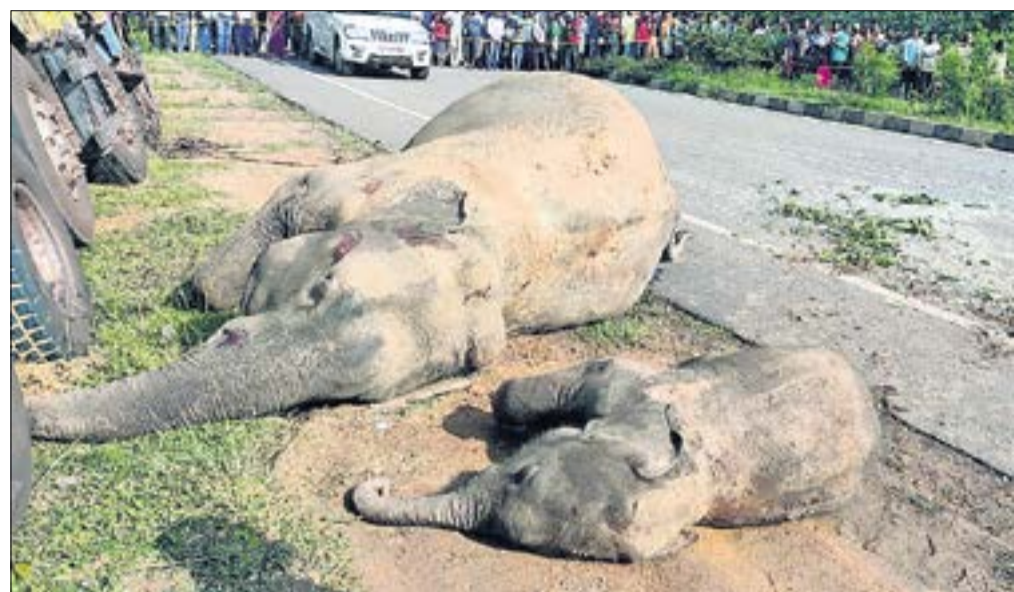
ଦୁର୍ଘଟଣାସ୍ଥଳରେ ପଡିଥିବା ୨ ମୃତହାତୀ।