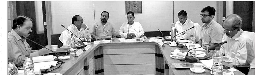
ବୈଠକରେ ମନ୍ତ୍ରୀ ଜିଲାପାଳ ଏବଂ ଅନ୍ୟ ଅଧିକାରୀଙ୍କ ସହ ସମାକ୍ଷା କରୁଛନ୍ତି।