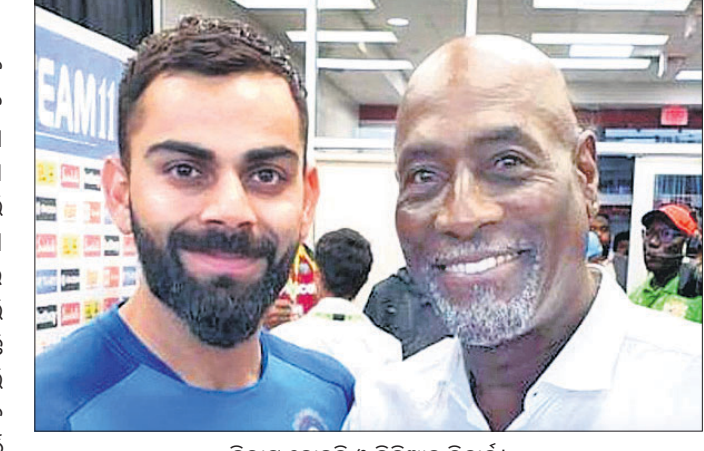
ବିରାଟ କୋହଲି ଓ ଭିତ୍ତିଆନ ରିଟାର୍ଡ଼୍

ଓଡ଼ିଶାରେ କିର୍ମଦଣ୍ଡୀ ବ୍ୟାଟ୍ମ୍ୟାନ ଭିତ୍ତିଆନ ରିଟାର୍ଡ଼୍ ଭାରତୀୟ ଅଧିନାୟକ ଭାବେ ଖେଳିବାକୁ ପ୍ରସ୍ତୁତ ହୋଇଛି । ବିରାଟ କୋହଲିଙ୍କ ନେତୃତ୍ୱରେ ଭାରତୀୟ ଦଳ ଖେଳିବାକୁ ପ୍ରସ୍ତୁତ ହୋଇଛି ।