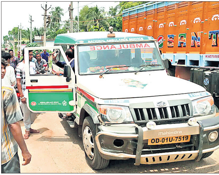
ଆମ୍ବୁଲାନ୍ସକୁ ଉଦ୍ୟତ୍ତ ଲୋକେ ଅଟକାଇଛନ୍ତି।