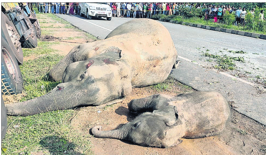
ଦୁର୍ଘଟଣାସ୍ଥଳରେ ପଡ଼ିଥିବା ୨ ମୃତହାତୀ।

ଉଲ୍ଲେଖ କରାଯାଇଛି। ଛାତ୍ର ସଂସଦ ନିର୍ବାଚନ ଯୋଗୁ ଅନେକ ସମୟରେ ଶୈକ୍ଷିକ ବାତାବରଣ ବିଚିତ୍ରି ଯାଉଛି। ଛାତ୍ରଛାତ୍ରୀଙ୍କ ପାଠପଢ଼ା ବ୍ୟାହତ ହେଉଛି। ଅନେକ ସମୟରେ କଲେଜ ଓ ବିଶ୍ଵବିଦ୍ୟାଳୟରେ ଆଇନଶୃଙ୍ଖଳା ପରିଚ୍ଛିନ୍ନ ହେଉଛି। ରାଜନୈତିକ ଦଳର ନେତାମାନେ ମଧ୍ୟ ଛାତ୍ରଛାତ୍ରୀଙ୍କୁ ବିଭ୍ରାନ୍ତ କରିବାକୁ ପଛ ନାହାନ୍ତି। ଏସବୁକୁ ଦୃଷ୍ଟିରେ ରଖି ନିର୍ବାଚନକୁ ବାତିଲ କରାଯାଇଥିବା କୁହାଯାଇଛି।