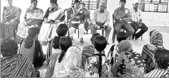
ସଚେତନତା କର୍ମଶାଳାରେ ଉପସ୍ଥିତ ମହିଳା ଓ ଯୁବକ।