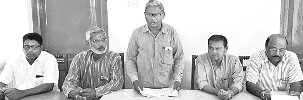
ଖବରଦାତା ସମ୍ମିଳନୀରେ ମଦ ବିରୋଧୀ ସଙ୍ଗଠନର କର୍ମକର୍ତ୍ତା।

ଜୁଲାଇ ମୁନିସିପାଲିଟିର ପଞ୍ଚୁୟାଣୀ ମୌଜାରେ ଥିବା ଲକ୍ଷ୍ମଣନାଥ ଠିକିଏ ବିବେଶୀ ମଦ ଦୋକାନକୁ ରୁଚିତ ସ୍ଥାନାନ୍ତର ନ କଲେ ଆନ୍ଦୋଳନ ପାଇଁ ପଛ ହାତୀ କରିବ ବୋଲି ଜୁଲାଇ ମଦ ବିରୋଧୀ ସଙ୍ଗଠନ ପକ୍ଷରୁ ଚେତାବନୀ ଦିଆଯାଇଛି।