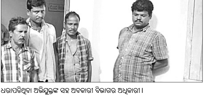
ଧରାପଡ଼ିଥିବା ଅଭିଯୁକ୍ତଙ୍କ ସହ ଅବକାରୀ ବିଭାଗର ଅଧିକାରୀ।

ଚଳିତବର୍ଷ ସମସ୍ତ କଲେଜ ଓ ବିଶ୍ୱବିଦ୍ୟାଳୟରେ ଛାତ୍ର ସଂସଦ ନିର୍ବାଚନ ହେବ ନାହିଁ ବୋଲି ଉଚ୍ଚଶିକ୍ଷା ବିଭାଗ ପକ୍ଷରୁ ଗୁରୁତ୍ୱପୂର୍ଣ୍ଣ ବିକ୍ଷେପ ପ୍ରକାଶ ପାଇଛି। ଏହାକୁ ନେଇ ବିଭିନ୍ନ ଛାତ୍ର ସଙ୍ଗଠନ ପକ୍ଷରୁ ରାଜ୍ୟ ସରକାରକୁ ସମାଲୋଚନା କରାଯାଇଛି।