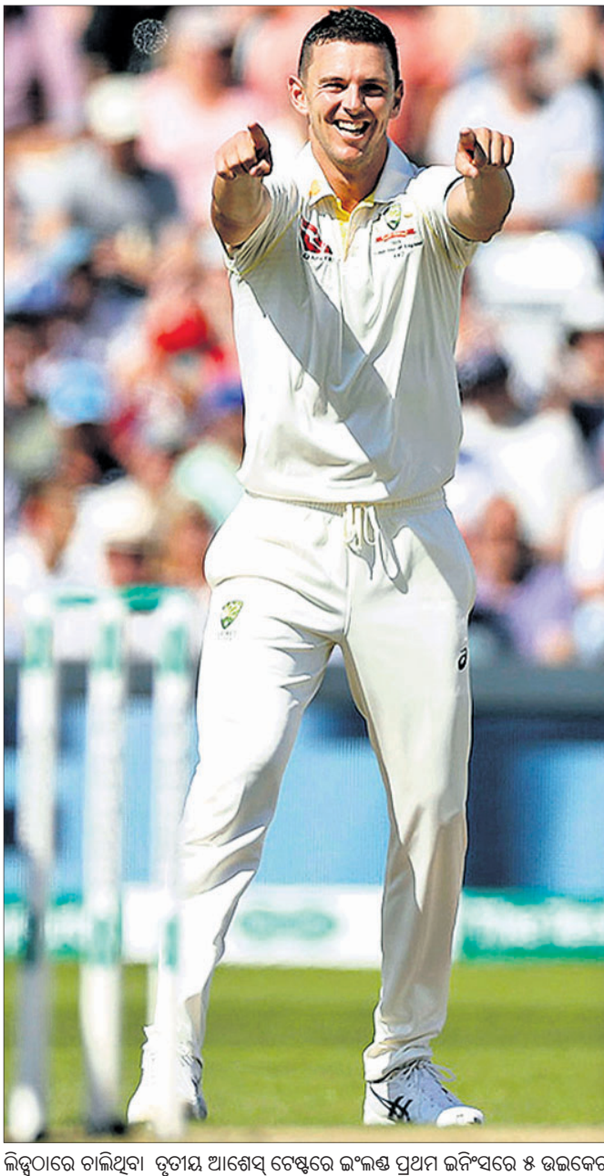
ଲିଡ୍ରେ ଚାଲିଥିବା ତୃତୀୟ ଆଶେଷ ଟେଷ୍ଟ୍ରେ ଇଂଲଣ୍ଡ୍ ପ୍ରଥମ ଇନିଂସରେ ୫ ଉଇକେଟ୍ ହାସଲ କରିଥିବା ଅଷ୍ଟ୍ରେଲିଆର ଗୋବିନ୍ଦ୍ ହାଜେଲଭର୍ଡ୍।