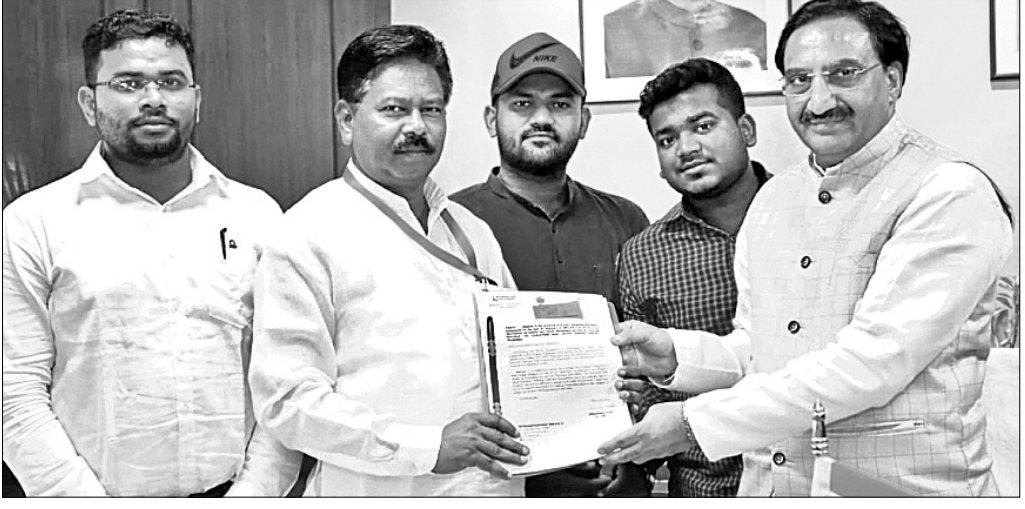
ଛାତ୍ରମାନେ କେନ୍ଦ୍ର ମାନବ ସମ୍ବଳ ବିକାଶ ମନ୍ତ୍ରୀଙ୍କୁ ଭେଟୁଛନ୍ତି।