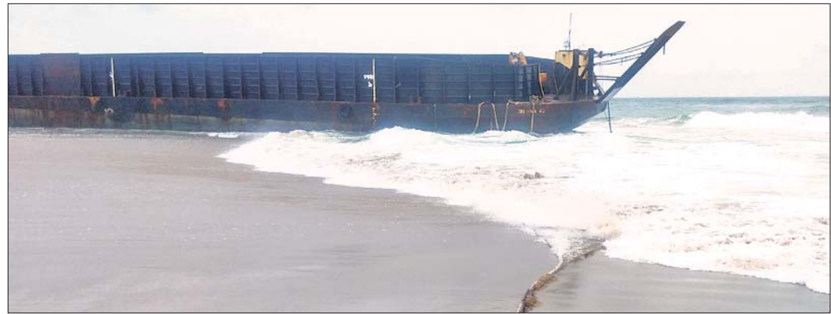
କୃଷ୍ଣପ୍ରସାଦ, ୨୩୮ (ଡି.ଏନ.ଏ.)