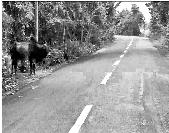
ବନ୍ତ-ବାରିକପୁର ରାସ୍ତାର ଶିଆଳିଆ ଚର୍ଚ୍ଚି ପଏଣ୍ଟ।

ଭଦ୍ରକ ଜିଲ୍ଲା ବନ୍ତ-ବାରିକପୁର ରାସ୍ତାର ଶିଆଳିଆ ଚର୍ଚ୍ଚି ପଏଣ୍ଟ ତେଜ୍ କୋର୍ ଭାବେ ପରିଚିତ। ବହୁ ସମୟରେ ଏଠାରେ ଦୁର୍ଘଟଣା ଘଟି ଧନକ୍ଷୟ ହାରି ହେଉଛି। ଦୁର୍ଘଟଣାକୁ ରୋକିବା ପାଇଁ ପ୍ରଶାସନ ପକ୍ଷରୁ ଗୁରୁତ୍ଵ ଦିଆଯାଇ ନ ଥିବାରୁ ସାଧାରଣରେ ଅସନ୍ତୋଷ ପ୍ରକାଶ ପାଇଛି।