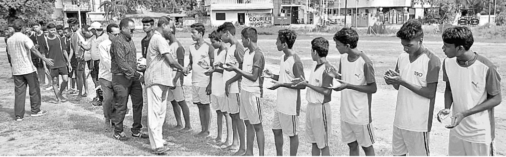
ମ୍ୟାଚ୍ ପୂର୍ବରୁ ପଢ଼ିଆରେ ଉଭୟ ଦଳର ଖେଳାଳି।