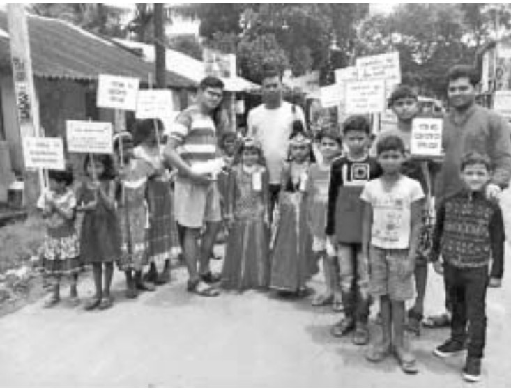
କୁରୁରା ରୁକ୍ମିଣୀ ପଞ୍ଚାୟତରୋ ସୋସାଇଟିରେ ଜନ୍ମାଷ୍ଟମୀ ପାଇଁ ହୁଣ୍ଡିରେ ଅର୍ଥ ଆଦାୟ କରୁଛନ୍ତି।