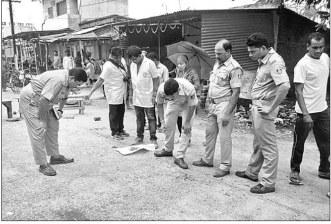
ଫୋରେନସିକ୍ ଟିମର ଅଧିକାରୀ