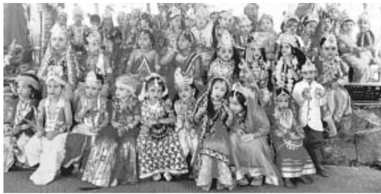
ଜୟପୁର ବିଜ୍ଞାନ ଇନ୍ଫରମାସନାଲ ସ୍କୁଲରେ ରାଧାକୃଷ୍ଣ ବେଶରେ ଛାତ୍ରାଛାତ୍ରୀ।