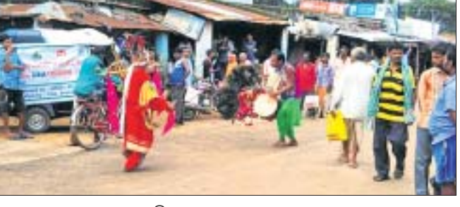
ଲୋକଙ୍କୁ ସଚେତନ କରାଯାଇଛି।

ଫିରିଙ୍ଗିଆ, ଖଜୁରିପଡ଼ା ଓ ଚକାପାଦ ବୁକର ବିଭିନ୍ନ ଅଞ୍ଚଳରେ ସ୍ୱେଚ୍ଛାସେବୀ ଅନୁଷ୍ଠାନ ସ୍ୱାତନ୍ତ୍ର ସହାୟତାରେ ଜିଲ୍ଲାରେ ଆଦୃତ ବନ୍ଧୁ ବାଣୀକାର ନୃତ୍ୟ ମାଧ୍ୟମରେ ତେଜୁ, ମ୍ୟାଲେରିଆ ଓ ଝାଡ଼ାବାଡି ନିରାକରଣ ଉପରେ ଲୋକଙ୍କୁ ସଚେତନ କରାଯାଇଛି। ଜିଲ୍ଲାରେ କିପରି ତେଜୁ, ମ୍ୟାଲେରିଆ, ଝାଡ଼ାବାଡି ନ ବ୍ୟାପିବ, ସେ ବିଷୟରେ ବିଭିନ୍ନ ସଚେତନତା ବାଣୀ ଦିଆଯାଇଥିଲା। ୨ଟି ଦଳ ବାଣୀକାର ନୃତ୍ୟ ଦଳ ଏଥିରେ ଭାଗ ନେଇଥିଲେ। ଅପହସ୍ତ ଜଳାକାର ଲୋକେ ବିଭିନ୍ନ ସ୍ୱାସ୍ଥ୍ୟ ସଚେତନତା ସମସ୍ତ ବାଣୀ ପାଇପାରିବେ, ସେଥିନେଇ ଫିରିଙ୍ଗିଆ ମେଡିକାଲ