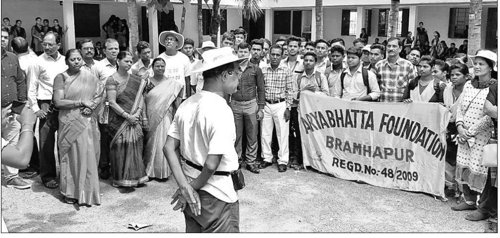
ସଭାରେ ଉପସ୍ଥିତ ଛାତ୍ରଛାତ୍ରୀ ଓ ଅଧ୍ୟାପିକା ଅଧ୍ୟାପକବୃନ୍ଦା