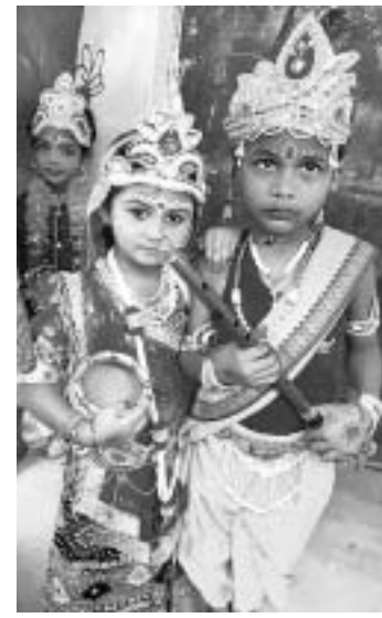
ଦଶମସ୍କନ୍ଧର ଶିଶୁ ମନ୍ଦିରରେ ରାଧାକୃଷ୍ଣ ବେଶ।