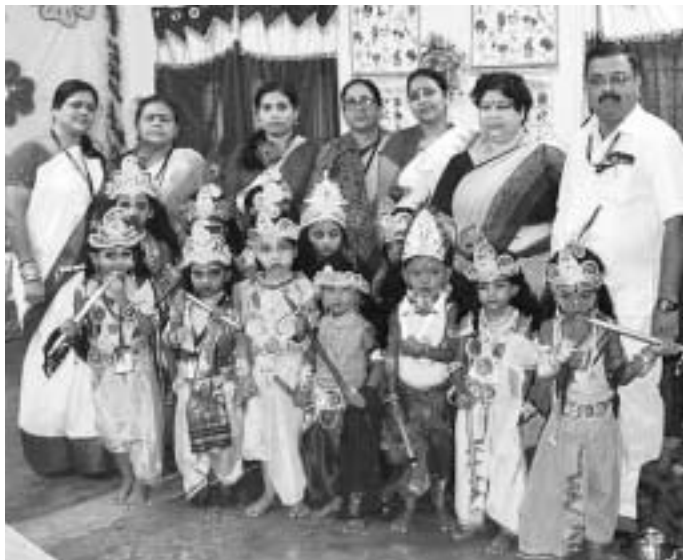
ଦାମନଯୋଡ଼ି ସ୍ଥିତ ସରସ୍ଵତୀ ଶିଶୁ ବିଦ୍ୟାଳୟରେ ପିଲାଙ୍କ ରାଧାକୃଷ୍ଣ ବେଶ।