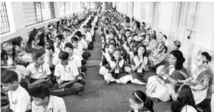
ଜୟପୁର ଶାରଦା ବିହାର ଶିଶୁମନ୍ଦିରରେ ଜନ୍ମାଷ୍ଟମୀ।