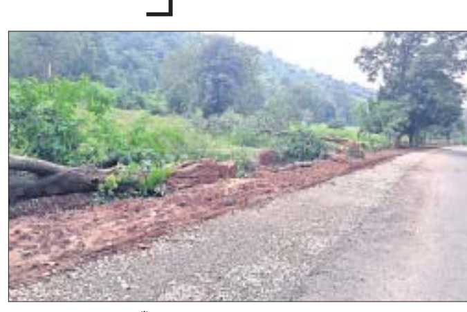
ରାଜପଥ ସମ୍ପ୍ରସାରଣ ପାଇଁ ଗଛ କଟାଯାଇଛି।

କକ୍ଷମାଳ ଜିଲ୍ଲା ଦାରିଙ୍ଗବାଡି ବୁକ ଅଞ୍ଚଳରେ ଦିନକୁ ଦିନ ଗରମ ବୃଦ୍ଧି ପାଇବା ସହ ଅସ୍ୱାଭାବିକ ଭାବେ ପାଣିପାଗର ପରିବର୍ତ୍ତନ ହେଉଛି। ଅଞ୍ଚଳରେ ଜନସଂଖ୍ୟା ବୃଦ୍ଧି ସାଙ୍ଗକୁ କଂକ୍ରିଟ ରାସ୍ତା, ଘର ବୃଦ୍ଧି ପାଇଛି। ସେହିପରି ଜନସଂଖ୍ୟା ବୃଦ୍ଧି ଯୋଗୁ ଜଙ୍ଗଲ ମଧ୍ୟ କ୍ଷୟ ହେବାରେ ଲାଗିଛି। ଅନ୍ୟପକ୍ଷେ ଜନସଂଖ୍ୟା ଅନୁଯାୟୀ ଯାନବାହନ ବୃଦ୍ଧି ପାଇଛି। ଏବେ ପୁଣି ଜଙ୍ଗଲ ସମ୍ପାଦନ ଆଉଁସକ ପୁଣ୍ୟସାଧାର କାରଣ ପାଇଛି। ଓଡ଼ିଶାର କଂଗ୍ରେସ କୁହାଯାଉଥିବା ଦାରିଙ୍ଗବାଡି ଅଞ୍ଚଳ ଏବେ ଜଙ୍ଗଲ ସମ୍ପାଦନ ଯୋଗୁ ନିଜ ସୌନ୍ଦର୍ଯ୍ୟ ହରାଇବାକୁ ବସିଲାଣି। ଗୋଟିଏ ପକ୍ଷେ କାଠ ମାଫିଆ ଜଙ୍ଗଲ ସମ୍ପାଦନ କରିଆସୁଥିବାବେଳେ ଜିଲ୍ଲା ପ୍ରଶାସନ ଜଙ୍ଗଲମି ଲୋକଙ୍କୁ ପ୍ରଦାନ ପରେ ଜଙ୍ଗଲ ନିଜ ଅସ୍ତିତ୍ୱ ହରାଇବାକୁ ବସିଲାଣି। ସେପକ୍ଷେ ରାଇପୁର ଠାରୁ