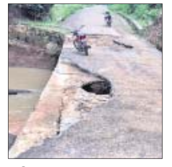
ଭାଙ୍ଗି ଯାଇଥିବା ଶଙ୍ଖ।