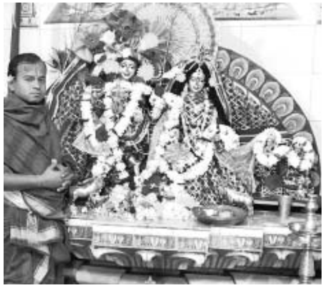
ମାଥାଲପୁଟ ରାଧାକୃଷ୍ଣ ମନ୍ଦିରରେ ପୂଜାର୍ଚ୍ଚନା।