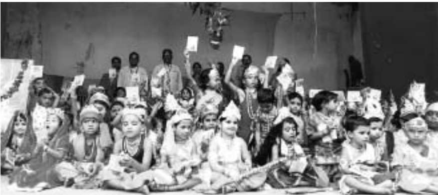
କୋରାପୁଟ ସରସ୍ଵତୀ ଶିଶୁ ବିଦ୍ୟାଳୟରେ ରାଧାକୃଷ୍ଣ ବେଶ ପ୍ରତିଯୋଗିତା।