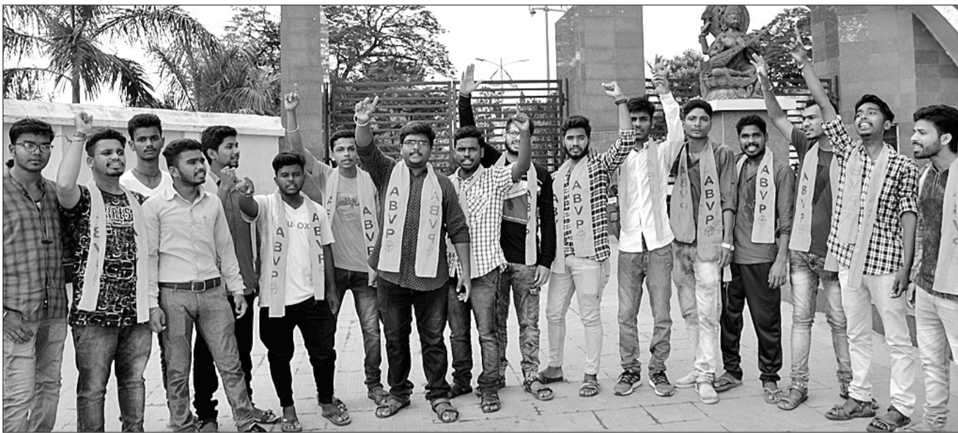
ଶୁକ୍ରବାର ଜିଏମୟ ଫାଟକ ସମ୍ମୁଖରେ ଏଭିପି ପକ୍ଷରୁ ବିରୋଧ ପ୍ରଦର୍ଶନ କରାଯାଇଛି ।

ଚଳିତ ବର୍ଷ କଲେଜ ଓ ବିଶ୍ୱବିଦ୍ୟାଳୟ ଛାତ୍ର ସଂସଦ ନିର୍ବାଚନ ମଧ୍ୟ ହେବ ନାହିଁ ବୋଲି ରାଜ୍ୟ ସରକାର ଠିକ୍ କରିଛନ୍ତି । ହେଲେ ଏହାକୁ ବିରୋଧ ଓ ପ୍ରତିବାଦ କରି ଶୁକ୍ରବାର ରାଜ୍ୟ ସରକାର ଓ ଉଚ୍ଚ ଶିକ୍ଷାମନ୍ତ୍ରୀଙ୍କ ବିରୋଧରେ ରାଜ୍ୟରେ ମେହେର ବିଶ୍ୱବିଦ୍ୟାଳୟ ଅଞ୍ଚଳ ଭାରତୀୟ ବିଦ୍ୟାର୍ଥୀ ପରିଷଦ (ଏଭିପି) ଯୁକ୍ତି ପକ୍ଷରୁ ବିରୋଧ ପ୍ରଦର୍ଶନ କରାଯାଇଛି ।