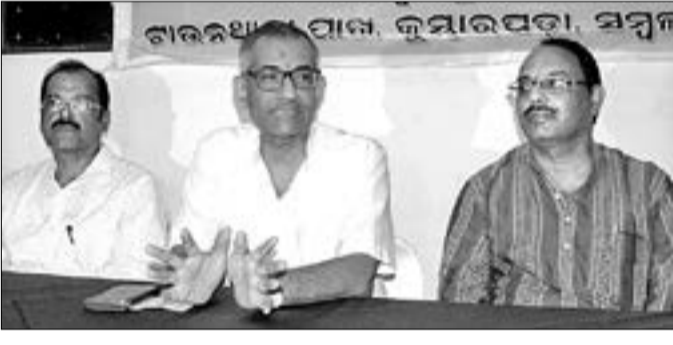
ଶୁକ୍ରବାର ସମ୍ବଲପୁରରେ ଧର୍ମାନ୍ତରୀକରଣ ପ୍ରତିରୋଧକ ଉପାୟ ସମ୍ବନ୍ଧରେ ସମୀକ୍ଷା ହୋଇଥିଲା।

ବାଲାଦେଶୀ ଅନୁପ୍ରବେଶ ବହୁଛି ଧର୍ମାନ୍ତରୀକରଣରେ ସରକାର ନୀରବ ଧର୍ମାନ୍ତରୀକରଣରେ ସରକାର ନୀରବ ଧର୍ମାନ୍ତରୀକରଣରେ ସରକାର ନୀରବ ଧର୍ମାନ୍ତରୀକରଣରେ ସରକାର ନୀରବ ଧର୍ମାନ୍ତରୀକରଣରେ ସରକାର ନୀରବ ଧର୍ମାନ୍ତରୀକରଣରେ ସରକାର ନୀରବ ଧର୍ମାନ୍ତରୀକରଣରେ ସରକାର ନୀରବ