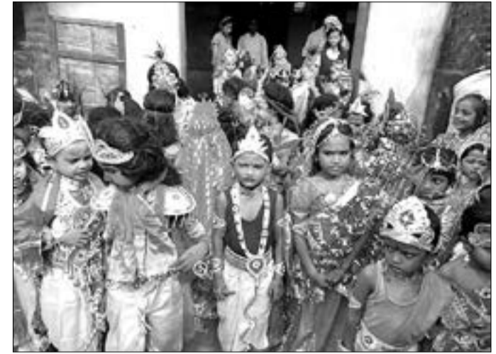
ରାଧାକୃଷ୍ଣ ବେଶ ପ୍ରତିଯୋଗିତାରେ ପଳାମାନେ ସାମିଲ ହୋଇଛନ୍ତି।