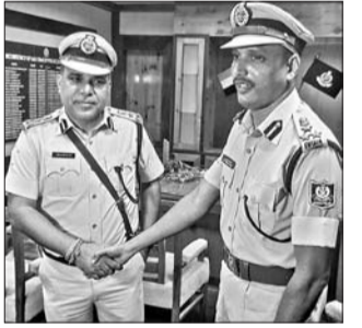
ନିୟମିତ ଦେବାରେ ପୋଲିସ୍ ଅବହେଳା କରିବ ନାହିଁ । ଏଥିପାଇଁ ବିଭାଗୀୟ ଅଧିକାରୀ ଓ କର୍ମଚାରୀମାନଙ୍କୁ ସାଙ୍ଗରେ ନେଇ କାମ କରାଯିବ ବୋଲି ସେ କହିଥିଲେ ।