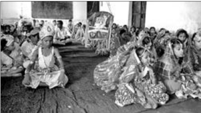
ବୋଡ଼େନରେ ଶିଶୁପାଠ୍ୟପୁସ୍ତକ ପଢ଼ାଖୋଳଣା ପର୍ବ ପାଳନ କରାଯାଇଛି।

ବୋଡ଼େନ ସରକାରୀ ଶିଶୁ ପାଠ୍ୟପୁସ୍ତକ ପଢ଼ାଖୋଳଣା ପର୍ବ ପାଳନ ହୋଇଥିଲା। ଏହି ଉତ୍ସବରେ ପାଠ୍ୟପୁସ୍ତକ ପଢ଼ାଖୋଳଣା ପର୍ବ ପାଳନ କରାଯାଇଥିଲା। ପାଠ୍ୟପୁସ୍ତକ ପଢ଼ାଖୋଳଣା ପର୍ବ ପାଳନ କରାଯାଇଥିଲା। ପାଠ୍ୟପୁସ୍ତକ ପଢ଼ାଖୋଳଣା ପର୍ବ ପାଳନ କରାଯାଇଥିଲା।