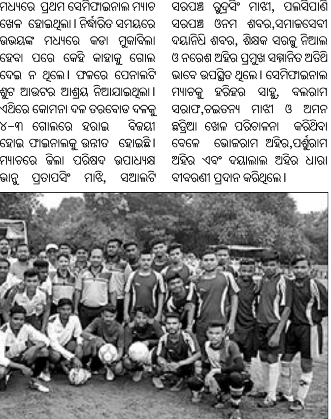
କୋମନା ଲଲେଭେନ ପାଇନାଲ କ୍ରିକେଟ୍ ଟୀମ୍ ସମସ୍ତଙ୍କ ସହିତ ଫୋଟୋ ଗ୍ରହଣ କରିଛନ୍ତି।

ନୂଆପତ୍ର କ୍ରିକେଟ୍ ଟୀମ୍ କୋମନା ଲଲେଭେନ ପାଇନାଲ କୋମନା ଲଲେଭେନ ପାଇନାଲ କୋମନା ଲଲେଭେନ ପାଇନାଲ କୋମନା ଲଲେଭେନ ପାଇନାଲ କୋମନା ଲଲେଭେନ ପାଇନାଲ କୋମନା ଲଲେଭେନ ପାଇନାଲ କୋମନା ଲଲେଭେନ ପାଇନାଲ