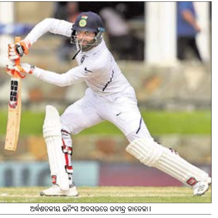
ଅର୍ଦ୍ଧଶତକୀୟ ଇନିଂସ୍ ଅବସରରେ ରବୀନ୍ଦ୍ର ଜାଡେଜା।

ଫାଇନାଲ୍ ମ୍ୟାଚ୍‌ରେ ଭାରତୀୟ ଦଳ ୨୯୭ ରନରେ ଲକ୍ଷ୍ୟ ହାସଲ କରିବାକୁ ସମର୍ଥନ ପ୍ରଦାନ କରୁଥିଲା।