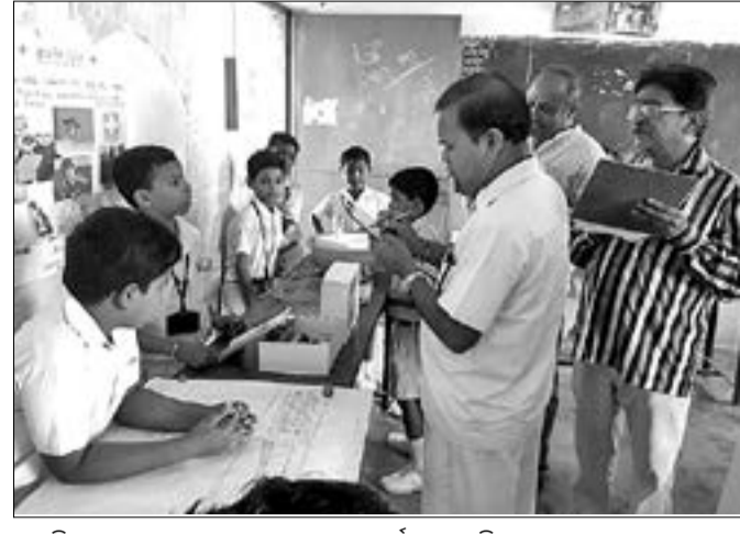
ଜ୍ଞାନବିଜ୍ଞାନ ମେଳାରେ ଜଣେ ସ୍ତ୍ରୀ ପ୍ରଦର୍ଶନ କରୁଛନ୍ତି।

ଦିନକୁ ଦିନ ସମସ୍ତ ବିଦ୍ୟାପନ୍ଦରରେ ପାଠ୍ୟ ପଢ଼ାବାର ଲାଭ ହେଉଛି। ପାଠ୍ୟ ପଢ଼ାବାର ଲାଭ ହେଉଛି। ପାଠ୍ୟ ପଢ଼ାବାର ଲାଭ ହେଉଛି। ପାଠ୍ୟ ପଢ଼ାବାର ଲାଭ ହେଉଛି। ପାଠ୍ୟ ପଢ଼ାବାର ଲାଭ ହେଉଛି। ପାଠ୍ୟ ପଢ଼ାବାର ଲାଭ ହେଉଛି। ପାଠ୍ୟ ପଢ଼ାବାର ଲାଭ ହେଉଛି। ପାଠ୍ୟ ପଢ଼ାବାର ଲାଭ ହେଉଛି।